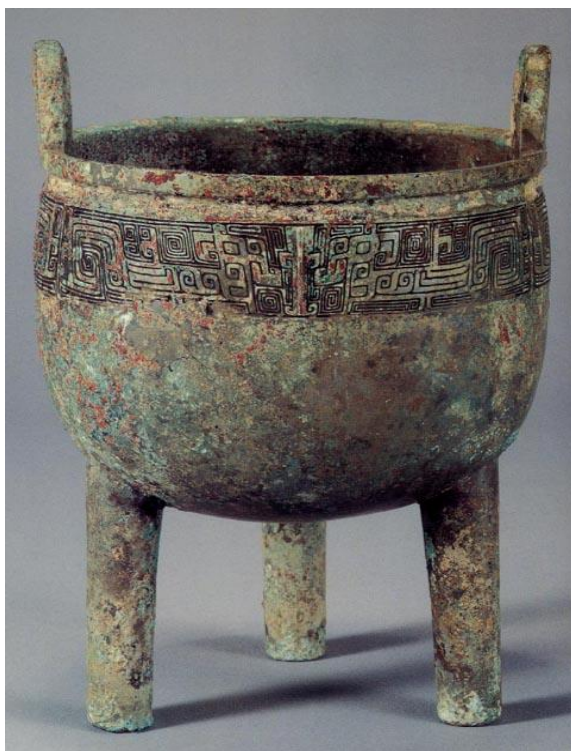
ภาพที่ 19 ลายนก ที่ปรากฏบนภาชนะสำริดสมัย