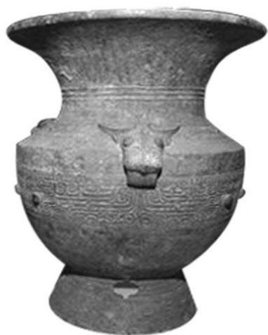
ภาพที่ 23 ลายวัว ที่ปรากฏบน ภาชนะสำริดสมัยราชวงศ์ซาง

ลายวัว ปรากฏเป็นส่วน หัวแกะสลักแบบลอยตัว อยู่รอด้านภาชนะ ด้านบนสุดมีเขาทั้ง 2 ข้าง ถัดลงมาคือดวงตาที่กลมคู่หนึ่ง ด้านล่างสุดที่เป็นเส้นยาวคือปาก ใบหน้ายาวเป็นรูปวงรี ลักษณะโดยรวมเหมือนรูปพรรณส่วนหัวของวัว ภาชนะ 1 ใบ อาจปรากฏหัวของวัว 2-4 หัว ขึ้นอยู่กับลักษณะของภาชนะ ส่วนใหญ่ลายวัวที่ปรากฏบนภาชนะสำริดไม่นิยมแกะสลักช่วงลำตัว