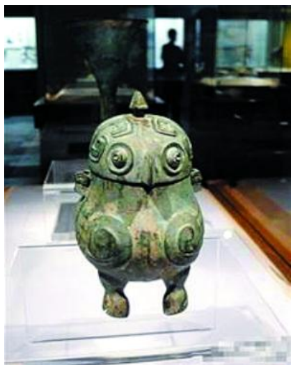
ภาพที่ 18 ลายนกฮูกที่ปรากฏบนภาชนะสำริดสมัยราชวงศ์ซาง

ขนหางอย่างชัดเจน ส่วนหัวครอบคลุมถึงฝ่าปีคางชนะ (ภาพที่ 17) ลายนกฮูกในยุคซางจัดว่าเป็นลาย ประดับที่มีวิธีการที่ล้ำเลิศที่สุด ถึงแม้ว่าจะไม่ใช่ลายที่ได้รับความนิยมมากเท่าลายเถาเถียะ แต่ก็ยังเป็นลาย ประดับบนภาชนะสำริดที่ใช้กันอย่างแพร่หลาย