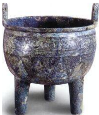
ภาพที่ 16 ลายจักจั่นเรียงตัวบนภาชนะสำริดสมัยราชวงศ์ซาง