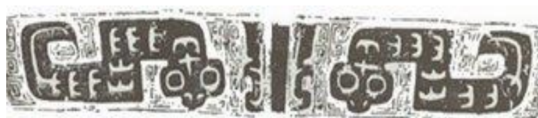
ภาพที่ 12 ลายงู ที่ปรากฏบนภาชนะสำริดสมัยราชวงศ์ซาง

ลายงู ลักษณะช่วงหัวเป็นรูปสามเหลี่ยมคว่ำลง และมีความกว้างมาก มีดวงตากลมที่ข้องเขม็งอย่างเด่นชัด ลำตัวมีเกล็ด ส่วนของหางคดเป็นวงขึ้นด้านบน เดิมทีเรียกลายประดับนี้ว่า “ลายคักเค้” (蚕纹) บ้างก็เรียกกันว่า “ลายงูขด” (蟠虺纹) ลายนี้ส่วนใหญ่ปรากฏในยุคชางตอนกลางถึงตอนปลาย (ภาพที่