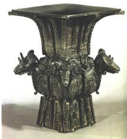
ภาพที่ 21 ลายแพะ ที่ปรากฏบนภาชนะสำริดสมัยราชวงศ์ชางตอนปลาย

คนจีนนิยมใช้ตัวอักษรที่เหมือนหรือคล้ายกันแทนความหมายที่มงคล ตัวอักษร “羊” Yang แปลว่าแพะ ซึ่งประกอบอยู่ในตัวอักษร “祥” Xiang แปลว่าสิริมงคล ดังนั้นแพะจึงถูกแทนความหมายว่าเป็นสัตว์ที่เป็นสิริมงคล ( http://www.cnki.com.cn/Article/CJFDTOTAL-YST200805050.htm [ออนไลน์], เข้าถึงเมื่อวันที่ 6 กุมภาพันธ์ 2556)