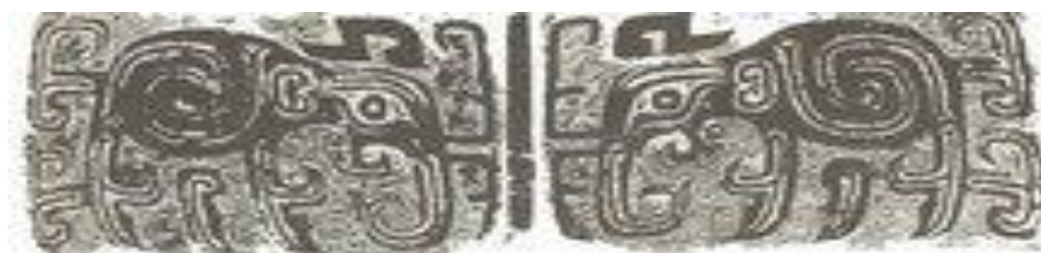
ภาพที่ 22 ลายช้าง ที่ปรากฏบนภาชนะสำริดสมัยราชวงศ์ซาง