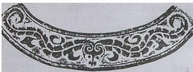
ภาพที่ 8 ลายมังกรสองลำตัว ที่ปรากฏบนภาชนะสำริดสมัยราชวงศ์ซาง

เรียกอีกชื่อหนึ่งว่า มังกรสองหาง มีลักษณะเป็นมังกรหนึ่งหัว สองลำตัว ช่วงลำตัวทั้งสองข้างมีลักษณะโค้งเป็นคลื่นตามแบบทั่วไปของมังกร ส่วนหัวจะอยู่ตรงกลางระหว่างลำตัว มักนำไปประดับบนขอบปากภาชนะ เมื่อนำไปประดับบนภาชนะเน้นว่าส่วนหัวคือจุดศูนย์กลางของภาชนะ ส่วนลำตัวทั้งสองข้างยาวคลุมรอบด้านของภาชนะ ลวดลายประเภทนี้ใช้แพร่หลายในยุคชางตอนปลายถึงยุคโจวตอนต้น (ภาพที่ 8) ( http://bbs.sssc.cn/viewthread.php?tid=783489 [ออนไลน์], เข้าถึงเมื่อวันที่ 10 มกราคม 2556)