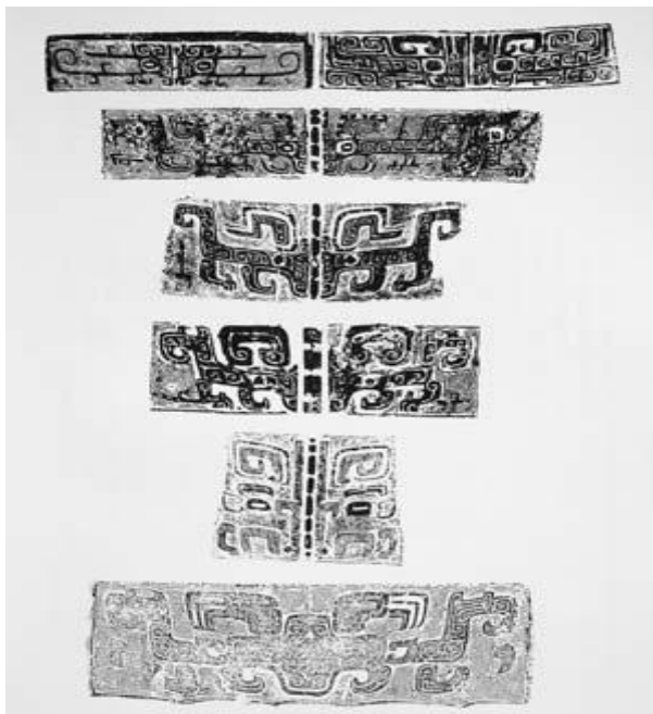
ภาพที่ 6 รูปแบบลายเถาเถียะ ที่ปรากฏบนภาชนะสำริดสมัยราชวงศ์ซาง

เถาเถียะ เป็นสัญลักษณ์หนึ่งที่แทนความหมายของสิ่งที่อยู่เหนือธรรมชาติ และสัมผัสไม่ได้ ให้กลายเป็นรูปธรรมขึ้นมาให้ดูมีอำนาจศักดิ์สิทธิ์ โดยใช้ความรู้สึกที่มีต่อสัตว์ที่พบเห็น นำมาอธิบายถ่ายทอดทัศนคติทางศาสนาหรือความเชื่อออกมา การที่เถาเถียะถูกสร้างสรรค์จากหลายสรรพสัตว์เพื่ออธิบายถึงอำนาจหนึ่งเดียวที่ยิ่งใหญ่เหนือกว่าสิ่งใด ด้วยใบหน้าโดยรวมที่ดูร้าย เชื่อกันว่าสามารถปกป้องคุ้มครองและกำจัดสิ่งชั่วร้ายออกไป (Chaeles Williams, 2006 : 62) ตามสัญชาตญาณการใช้ชีวิตของมนุษย์คือดำรงอยู่อย่างสงบสุข ปราศจากทุกข์โศกและสิ่งอัปมงคลทั้งปวง แต่ด้วยตัวมนุษย์ไม่สามารถหลีกเลี่ยงสิ่งเหล่านี้ได้ จึงปรารถนาสิ่งที่มีอำนาจเหนือธรรมชาติมาช่วยปัดเป่า ดังนั้น ความเชื่อเหล่านี้จึงถูกถ่ายทอดผ่านสัญลักษณ์ของอำนาจ ซึ่งก็คือ เถาเถียะ