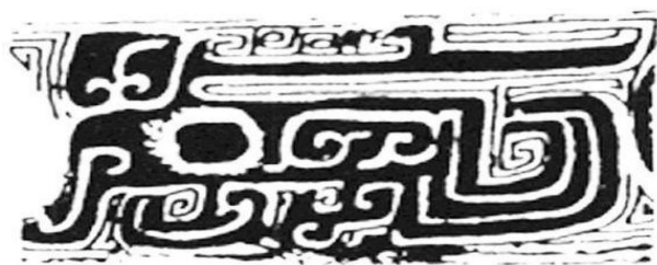
ภาพที่ 7 ลายมังกรปีนป่ายที่ปรากฏบนภาชนะสำริดสมัยราชวงศ์ชาง

มีลักษณะเป็นลวดลายที่ปรากฏให้เห็นด้านข้างหนึ่งของตัวมังกร ส่วนหัวจะโค้งลงด้านล่าง ขาวไป ถึงกลางลำตัวจะโค้งเป็นคลื่นสู่ด้านบน ปลายหางขดขึ้นด้านบนม้วนเป็นเกลียว ริมฝีปากด้านบนโค้งงอขึ้น ส่วนริมฝีปากล่างโค้งงอสู่ด้านล่าง ปาก้าออกกว้าง เขาของมังกรภาชนะแต่ละใบจะออกแบบรูปแบบของเขาแตกต่างกัน ส่วนหัวออกแบบมาจากสัตว์สี่งูคิ้วคิ้วส่วนช่วงลำตัวออกแบบมาจากงู ลายนี้ใช้แพร่หลายมากในยุคชางตอนกลางถึงยุคโจวตะวันตกตอน ต้น(ภาพที่ 7)