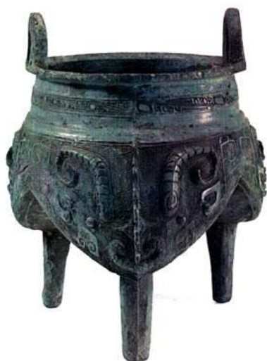
ภาพที่ 20 ลายแพะ ที่ปรากฏบนภาชนะสำริดสามขาสมัยราชวงศ์ชางตอนปลาย

(ภาพที่20) ลักษณะที่สองคือลายแพะที่ปรากฏบนภาชนะสำริดที่มีรูปทรงสี่เหลี่ยม ลายแพะจึงใช้ประดับรอบภาชนะทั้งสี่ด้าน ลักษณะนี้ลายแพะถูกแกะสลักแบบลอยตัว ใบหน้าเรียวยาว เขาขดงอเข้าเป็นวง ใต้คางมีหนวดและขนสตัวยาวไปถึงคอ เหมือนหัวของแพะจริงๆ ช่วงคอและลำตัวแกะสลักนูนสูงมีลายประดับเล็กน้อย ลักษณะนี้เน้นลวดลายที่เด่นชัดและการประดับที่ประณีตงดงามมากกว่าในลักษณะแรกซึ่งเป็นภาชนะสามขา (ภาพที่ 21)