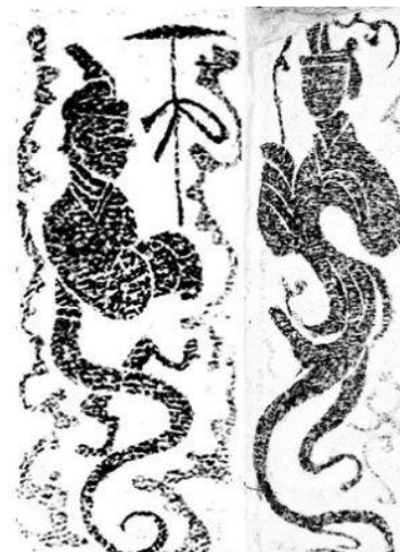
ภาพที่ 14 ภาพตำนาน นีววาฟู่สี

ประเทศจีนมีตำนานเกี่ยวกับงูมากมาย ในยุคอันเกิดตำนาน มนุษย์ร่างกายเป็นงูครั้งแรก ในตำนานนี้ว่ากับฟู่สี เนื่องจากยุคอันมีความเชื่อเกี่ยวกับงูว่ามีภาพลึกลับทั้งงดงามและเป็นสัตว์ที่มีจิตเมตตาธรรม จึงปรากฏตำนานเทพบุตรกับเทพธิดาชาวงดงามที่มีลำตัวเป็นหางงู เพื่อประทานธรรมชาติอันอุดมสมบูรณ์ให้แก่มวลมนุษย์ได้ดำรงชีพอย่างราบรื่น ซึ่งก็คือ เทพฟู่สี (伏羲) กับ