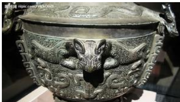
ภาพที่ 24 ลายเสือ ที่ปรากฏบนภาชนะสำริดสมัยราชวงศ์ซาง