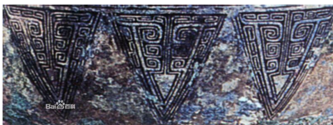
ภาพที่ 15 ลายจ๊กจั้น ที่ปรากฏบนภาชนะสำริดสมัยราชวงศ์ชาง

ลายจ๊กจั้น รูปร่างเป็นรูปสามเหลี่ยมคล้ายกับใบไม้ ช่วงที่ ึ่งมีลายเส้นคล้ายรูปหัวใจประดับอยู่รอบตัว ไม่มีขา มีดวงตาสองข้างที่กลมโต ลักษณะใกล้เคียงกับดักแด้ (ภาพที่ 15) มักจะถูกประดับเรียงตัวเป็นแนวนอนติดกันอยู่บนปากภาชนะหรือไม้เท้าเรียงตัวเป็นแนวตั้งตรงช่วงกลางของภาชนะ (ภาพที่ 16)