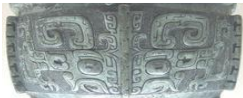
ภาพที่ 3 ลายเถาเถี่ยะที่ปรากฏบนภาชนะสำริดสมัยราชวงศ์ซาง