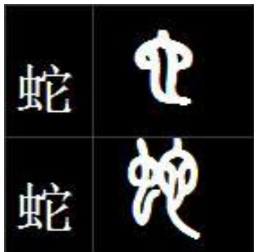
ภาพที่ 13 ลายงูโบราณ ที่ปรากฏบนกระดุกเสียงทวยสมัยก่อนประวัติศาสตร์

ตามความเชื่อโดยทั่วไปเพื่อพบเห็นงูอยู่ใน ระยะประชิด เป็นเรื่องที่น่าขนานนามถึงชีวิต และเป็น เรื่องโชคร้ายหนึ่ง เนื่องจากงูเป็นสัตว์มีพิษร้ายแรง ดังนั้น เพื่อสร้างความศักดิ์สิทธิ์ให้แก่ภาชนะ และมีความเชื่อว่าจะสามารถกลืนกินความชั่วร้าย จึงใช้ความร้ายของงู ประดับเป็นลวดลายบนภาชนะ