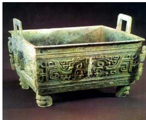
ภาพที่ 9 ลายงู ที่ปรากฏบนภาชนะสำริดสมัยราชวงศ์ซาง