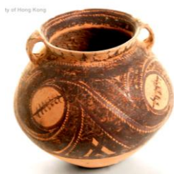
ภาพที่ 1 วัฒนธรรมหยางเซา สมัยหินใหม่ (8000-2100 B.C.) ประเทศจีน