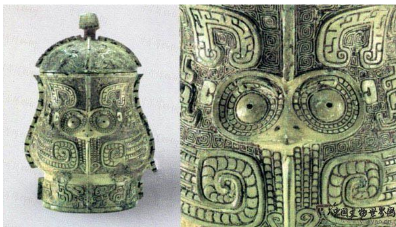
ภาพที่ 17 ลายนกฮูกที่ปรากฏบนภาชนะสำริดสมัยราชวงศ์ซาง ที่มา : http://www.yueyao.cn/cangpinku/ShowPhoto.asp?PhotoID=59694 [ออนไลน์]

ลายนกฮูก มีรูปร่างกลม ทำท่างองๆ บนหัวมีลายขนคืออยู่สองลาย ดวงตากลมโต เบ้าตาเป็นรูปสี่เหลี่ยมขนมเปียกปูน ปากเป็นรูปตะขอกว่าลงด้านล่างยาวถึงหน้าอก มีคอ ปีก ขาสั้น จึงทำให้หางที่คู่สั้นสามารถแตะถึงพื้น เท้าข้างหนึ่งมีสี่กรงเล็บ บนปีกและหางของลายนกฮูกมีการสลักให้เห็นเป็นขนปีกและ