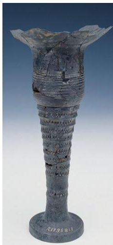
ภาพที่ 2 เครื่องดินเผาทรงสูง เคลือบสีดำ วัฒนธรรมลุงชาน สมัยหินใหม่ (2600-2000B.C.) ประเทศจีน พบที่สุสานหมายเลข 14 มณฑลชานตง (Tomb M4, Wa-wu-ts'un, Liang-ch'eng-chen, Jih-chao, Shantung)

ราชวงศ์เซี่ย(夏朝) เป็นราชวงศ์แรกในประวัติศาสตร์จีน อยู่ระหว่างประมาณศตวรรษที่ 21-16 ก่อนค.ศ. ศูนย์กลางการปกครองของราชวงศ์เซี่ยอยู่ที่บริเวณภาคใต้ของมณฑลเกี่ยวกับราชวงศ์เซี่ยยังพบ น้อยมาก จากหลักฐานที่พบ เครื่องมือการผลิตยังคงเป็นเครื่องมือหินเป็นหลัก เครื่องมือกระดูกและเขาสัตว์และเครื่องมือเปลือกหอย บนฐานรากของบ้านเรือน เติงดินและผนังของสุสานได้ค้นพบรอยขูดดิน ด้วยเครื่องมือที่ทำจากไม้ ประชาชนในสมัยนั้นใช้ความขยันหมั่นเพียรและสติปัญญาของตน ปรับพื้นฐานทำการเพาะปลูกด้วยเครื่องมือที่ค่อนข้างล้าหลัง แม้จนถึงปัจจุบันจะ ยังไม่เคยค้นพบเครื่องทองสัมฤทธิ์ที่มีขนาดค่อนข้างใหญ่ในซากปรักหักพังสมัยราชวงศ์เซี่ยก็ตาม แต่เคยค้นพบเครื่องมือ อาวุธและภาชนะที่ทำด้วยทองสัมฤทธิ์ชนิดต่างๆเช่น มีด สว่าน ขวานมือ สิว ล้อม ง้าว ภาชนะใส่เหล้าคั่ว เป็นต้น นอกจากนี้ยังค้นพบซากโบราณของเตาเผาหล่อทองสัมฤทธิ์ ค้นพบแม่พิมพ์หล่อเครื่องทองสัมฤทธิ์ที่ทำด้วยดินเผา กากทองสัมฤทธิ์และเศษหม้อสำหรับหล่อทองสัมฤทธิ์ นอกจากนี้ยังค้นพบเครื่องหยกที่มีเทคนิคผลิตค่อนข้างสูงจำนวนมาก มีเครื่องประดับที่ฝังอัญมณี ( http://thai.cri.cn/chinaabc/chapter14/chapter140101.htm [ออนไลน์], เข้าถึงเมื่อวันที่ 13 กุมภาพันธ์ 2556)