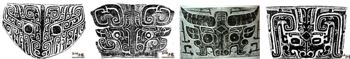
ภาพที่ 5 ลายหน้ากากเถาเที๊ยะที่คล้ายงู แพะ วัว มนุษย์หมอบีตามลำดับ ที่ปรากฏบนภาชนะสำริดสมัยราชวงศ์ซาง

การสร้างสรรคูปแบบของเถาเที๊ยะเป็นการนำลักษณะเด่นของสัตว์ที่มีอยู่จริงต่างๆที่มีความหมายพิเศษมารวมเข้าด้วยกัน เช่น นำรูปแบบของเขาสัตว์มาจากวัว และกวาง นำรูปแบบของเขี้ยวและปากมาจากเสือ ดวงตาดูร้ายเหมือนมังกร เป็นลักษณะเฉพาะที่แสดงถึงการผสมผสานด้านความหมายที่หลากหลายผ่านสัญลักษณ์เดียว (Mario Bussagli, 1969: 74)