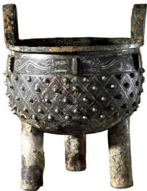
ภาพที่ 11 ลายมังกรขุย ที่ปรากฏบนภาชนะสำริด สมัยราชวงศ์ซาง