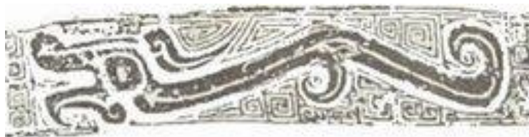
ภาพที่ 10 ลายมังกรขุย ที่ปรากฏบนภาชนะสำริดสมัยราชวงศ์ซาง