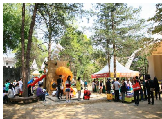
ภาพที่ 1 กิจกรรมต่าง ๆ บนเกาะนามิ