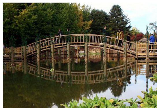
ภาพที่ 2 สระน้ำ