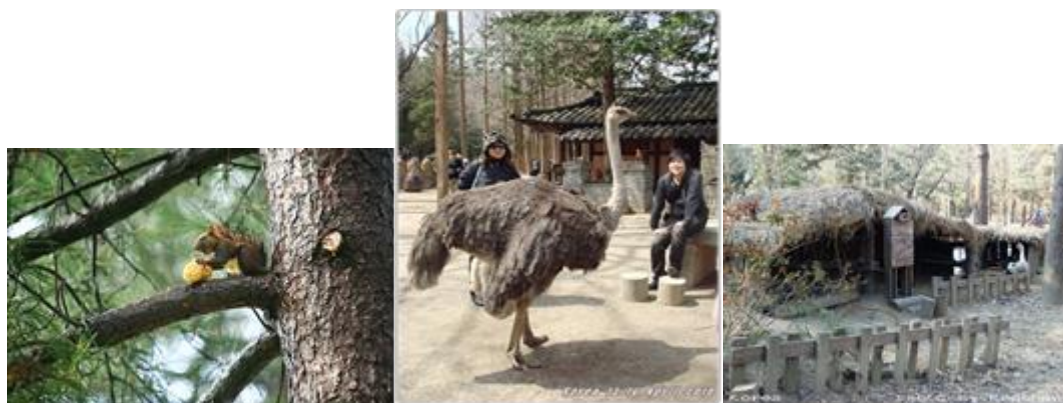
ภาพที่ 3 สัตว์ต่างๆ