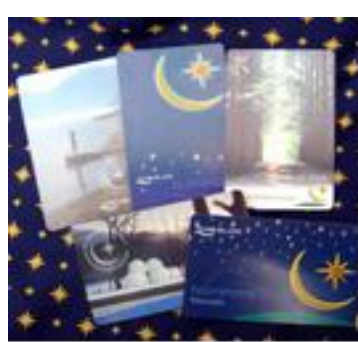
ภาพที่ 1 Naminara Republic