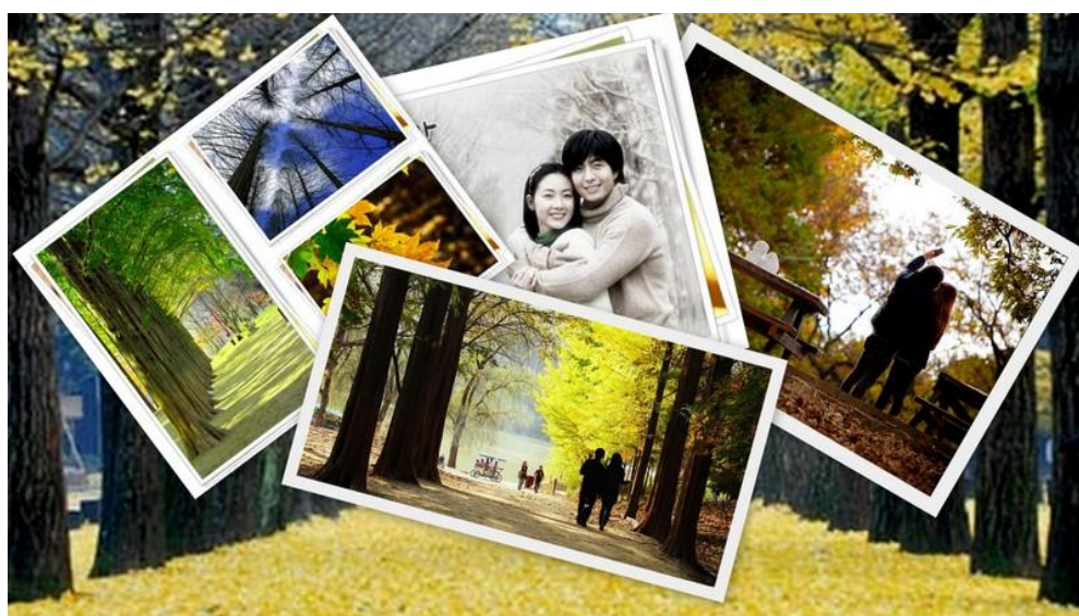
ภาพที่ 1 นักท่องเที่ยว