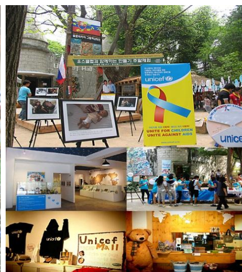
ภาพที่ 2 กิจกรรมต่าง ๆ บนเกาะนามิ