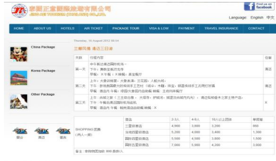
รูปภาพที่ 2 แสดงรายละเอียดของการท่องเที่ยวและค่าใช้จ่ายผ่านทางเว็บไซต์ของบริษัททัวร์ในประเทศไทย

ที่มา : http://www.ja99tour.com/site/index.php?option=com_content&view=article&id=188:2012-08-16-08-56-37&catid=44:thailand-package&Itemid=96 (2555)