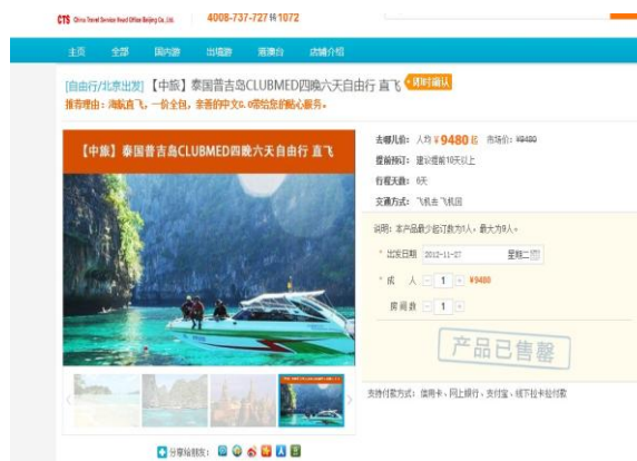
รูปภาพที่ 1 แสดงการโฆษณาและการติดต่อซื้อขายแพ็คเกจทัวร์ผ่านทางเว็บไซต์ของบริษัททัวร์ในประเทศจีน

นักท่องเที่ยวที่เดินทางมาท่องเที่ยวพร้อมกับบริษัททัวร์อาจ มีการติดต่อบริษัทนำเที่ยวของ ประเทศจีน โดยการติดต่อด้วยตนเอง หรือการติดต่อผ่านทางเว็บไซต์ท่องเที่ยวของประเทศจีนเพื่อ เลือกรูปแบบและสถานที่ท่องเที่ยว พร้อม จ่ายเงินตามราคาที่กำหนด และสามารถเตรียมตัว ท่องเที่ยวได้ทันที เนื่องจากทางบริษัทนำเที่ยวจะดำเนินการเรื่องการทำวีซ่า การซื้อตั๋วเครื่องบิน การจองที่พัก การดำเนินการเรื่องมัลติเอนทรีหรือไกด์ทัวร์ เป็นต้น ซึ่งนักท่องเที่ยวส่วนใหญ่เลือกที่ จะดำเนินการรูปแบบนี้เนื่องจากมีราคาถูก สะดวกสบายและง่ายต่อการเดินทางท่องเที่ยว