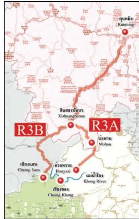
ภาพที่ 3 : แสดงเส้นทาง R3A และ R3B