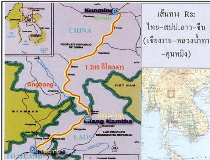
ภาพที่ 2 : แสดงเส้นทาง R3

ที่มา : http://www.asiaroadexpress.com/r3.html