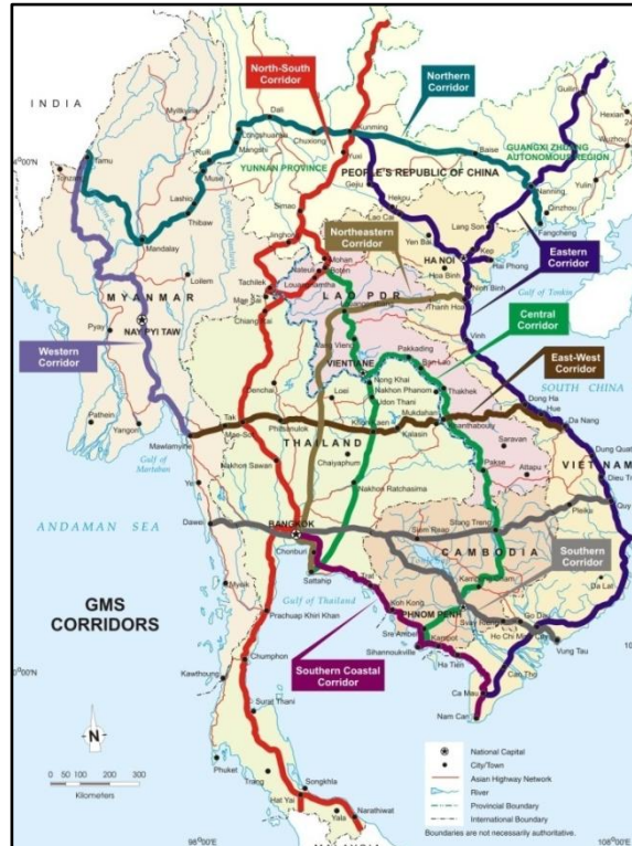
ภาพที่ 1 : แสดงเส้นทางหลวงที่เชื่อมโยงระหว่างประเทศในกลุ่มอนุภูมิภาคุ่มแม่น้ำโขง