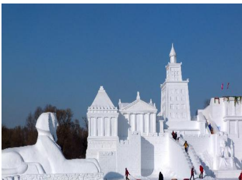
ภาพที่ 5 การแกะสลักหิมะน้ำแข็งบริเวณเกาะไท่หยางเต่า