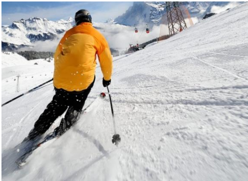
ภาพที่ 8 การเล่นสกี บริเวณเทือกเขาเอ้อหลงซาน