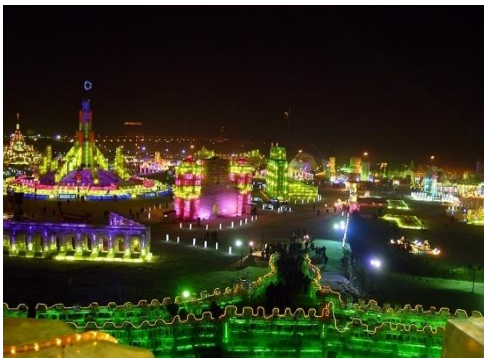
ภาพที่ 3 เทศกาลแกะสลักโคมไฟน้ำแข็ง