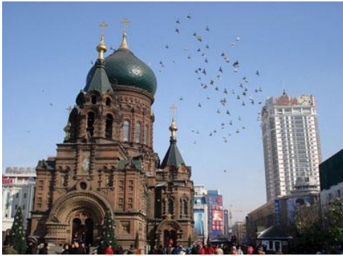
ภาพที่ 1 โบสถ์เซนต์โซเฟียในฮาร์บิน