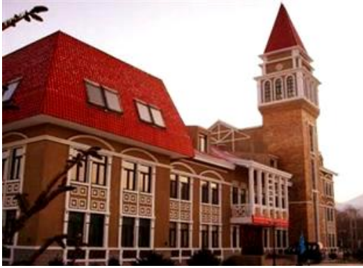
ภาพที่ 6 ที่พักสำหรับนักท่องเที่ยวที่นิยมเล่นสกี