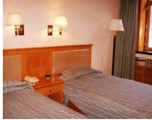
ภาพที่ 7 ห้องพักของสกี รีสอร์ท