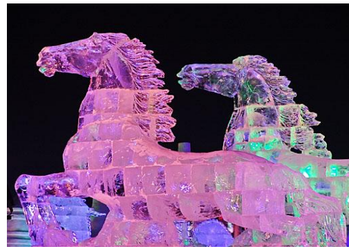
ภาพที่ 4 ม้าสลักน้ำแข็ง