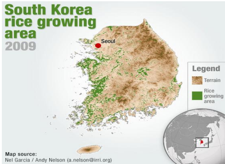
ภาพที่ 2 ภาพแหล่งปลูกข้าวในประเทศเกาหลีใต้