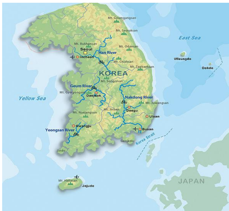
ภาพที่ 3 ภาพแผนที่แสดงส่วนของแม่น้ำในประเทศเกาหลีใต้