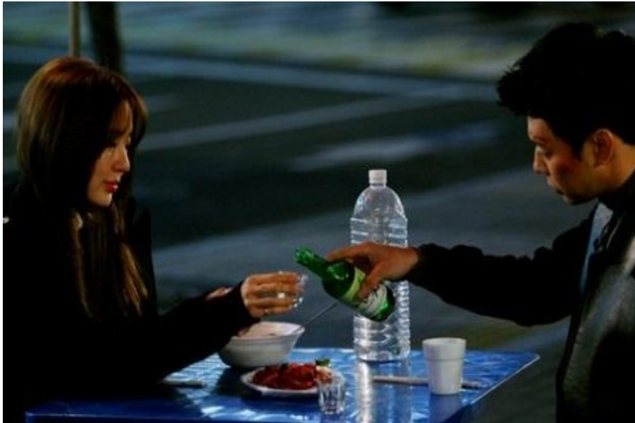
ภาพที่ 5 การดื่มโซจูที่ปรากฏในละครเกาหลีใต้เรื่อง “I Miss You”