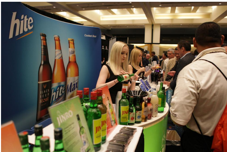
ภาพที่ 6 การเปิดตัวเครื่องดื่มแอลกอฮอล์โซจู ที่เมืองนิวยอร์ก ประเทศสหรัฐอเมริกา

ที่มา : http://www.hiteus.com/1_news_detail.asp?idx=131&page=2