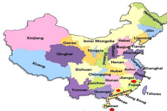
● แสดงบริเวณมณฑลที่ตั้งเขตเศรษฐกิจพิเศษพิเศษ