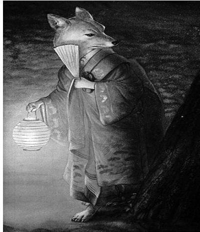
ภาพที่ 21 ปีศาจจิ้งจอก

http://anubiscross.exteen.com/20071112/entry