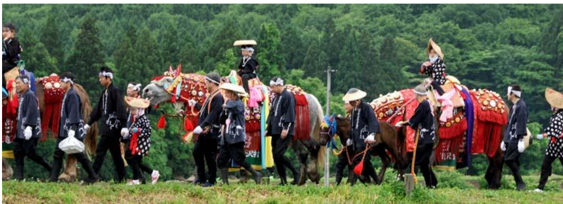
ภาพที่ 3 ขบวนแห่ม้าไปยังศาลเจ้าในเทศกาลชะงุชะงุ อุมัคโคะ

http://www.uchinome.jp/event/traditional/2008/tradi22_1.html