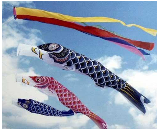
ภาพที่6 ชงปลาการ์ฟ

http://plaza.rakuten.co.jp/fuminoritamaki/diary/200905030000/