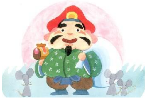
ภาพที่13 เทพเจ้าไดโกะคุเตน