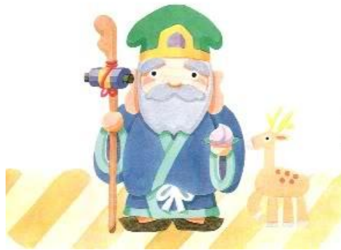
ภาพที่15 เทพเจ้าจูโรจิน