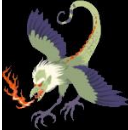
ภาพที่22 ปีศาจอิทซึมาเด็น

http://anubiscross.exteen.com/20071112/entry