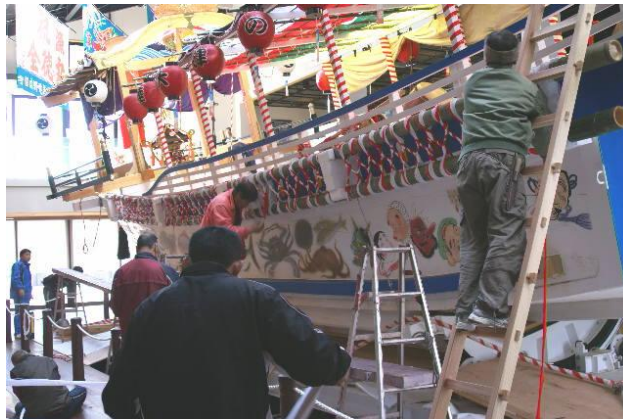
ภาพที่ 2 ภาพวาดที่กาบเรือใช้ในขบวนแห่เทศกาลฮิตะมิ โทซึโนะ โอะฟูเนะ มัทซึริ

http://blog.goo.ne.jp/gomitaro_1940/e/a5dc13525272fe0e73224547220f3d5a