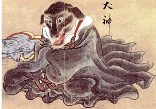
ภาพที่ 23 ปีสางหัวสุนัขอินุกามิ

http://anubiscross.exteen.com/20071112/entry