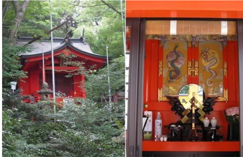
ภาพที่11 ศาลเจ้าคุชูริว ที่ทะเลสาบอาชิในเมืองฮาโกเนะ

เทพเจ้าริวจินไว้ที่ Hakone Jinja (ศาลเจ้าฮาโกเนะ) และรู้จักกันในชื่อ Kuzuryu Shingu (ศาลเจ้าคุชูริวใหม่)