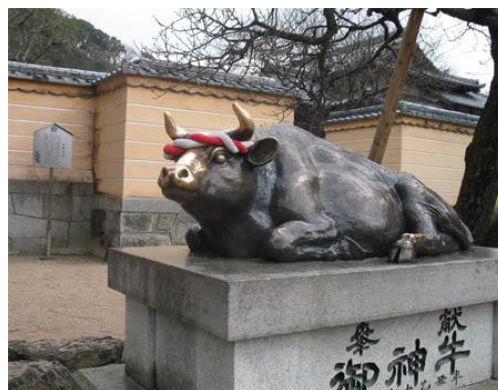
ภาพที่18 รูปปั้นวัวซึ่งเป็นที่ฝังศพของเทพเจ้าเทนจิน ที่ศาลเจ้าคาไซฟู

เทพเจ้าเทนจิน ไม่ใช่เทพแท้แต่เป็นเทพที่มาจากมนุษย์และได้รับการนับถือว่าเป็นเทพตอนที่ท่านยังมีชีวิตอยู่นั้น ท่านเป็นนักปราชญ์ที่ทุ่มเท ใฝ่เรียนใฝ่รู้ แม้จะตกยากก็ยังคงศึกษาหาความรู้ใส่ตัวอยู่เสมอ ท่านมีงานเขียนด้านประวัติศาสตร์ญี่ปุ่นมากมาย เก่งในเรื่องภาษาจีน และชำนาญการแต่งกวีแบบจีนอีกด้วย (สมัยนั้นญี่ปุ่นใช้จีนเป็นต้นแบบในหลายๆ ด้าน) นอกจากนี้ท่านยังมีจิตใจที่บริสุทธิ์และกระทำแต่สิ่งดีงาม สถานที่ฝังศพของท่าน ก็คือ ศาลเจ้าคาไซฟู (Dazaifu Tenmangu) ในปัจจุบัน ถือเป็นศาลเจ้าหลักประจำองค์เทพเจ้าเทนจิน ในแต่ละปีจะมีนักท่องเที่ยวจำนวนมากมาสักการะ ส่วนใหญ่จะมาเพื่อขอพรให้ประสบความสำเร็จด้านการเรียน มาดูรูปปั้นวัวซึ่งกลายเป็นสัตว์พาหนะของเทพเทนจิน โดยชาวญี่ปุ่นมีความเชื่อว่าถ้าได้ลูบหัวและเขาของวัวจะทำให้หายจากอาการเจ็บป่วยและจะโชคดี ประสบความสำเร็จในเรื่องการเรียน บรรดาผู้ปกครองจึงมักจะพาบุตรหลานมาฝากเนื้อฝากตัวกับศาลเจ้าแห่งนี้ เพื่อให้บุตรหลานของตนฉลาดและมีสติปัญญาดี