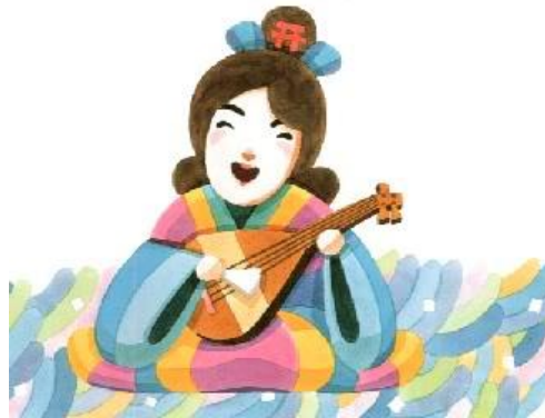
ภาพที่16 เทพเจ้าเบ็นเท็น