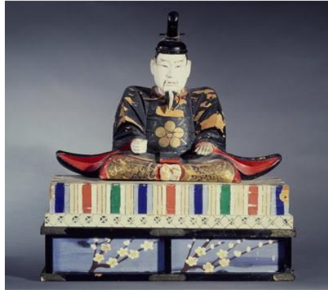
ภาพที่17 เทพเจ้าเทนจิน

http://www.marumura.com/japanist_monthly/?id=728