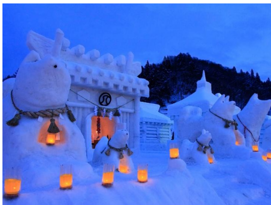
ภาพที่ 5 ประติมากรรมน้ำแข็งรูปศาลเจ้าและสุนัขที่เมืองยูสะวะ

http://plaza.rakuten.co.jp/kabegamimura/diary/201002150000/