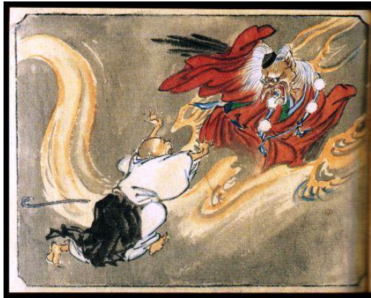
ภาพที่19 การาสูเทนกู

http://www.ilovetogo.com/Article/76/1089