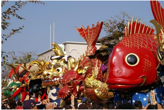
ภาพที่ 4 ภาพขบวนรถที่ใช้ในขบวนแห่เทศกาลกระทะชิโอะคุนชิ

http://fukuoka-hotel.net/hotel/ryokou/2009/06/post-1.html