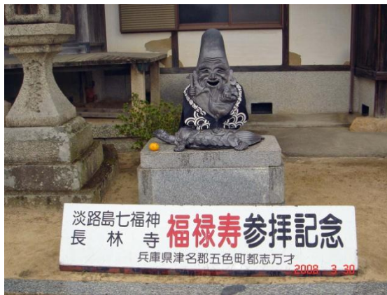
ภาพที่14 รูปปั้นเทพเจ้าฟุคุโระคุจู

http://blogs.yahoo.co.jp/katuldh2002/54828068.html