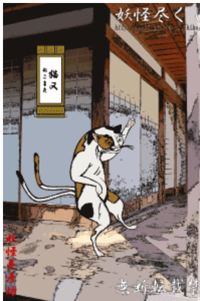
ภาพที่20 เนโกะมาตะ

http://anubiscross.exteen.com/20071112/entry