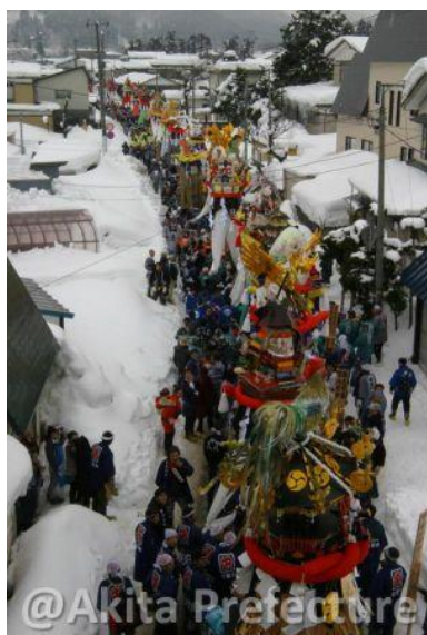
ภาพที่1 ขบวนแห่เทศกาลบงเท็น

http://www.japanmook.com/web/?option=com_content &view=article&id=710000153&Itemid=89