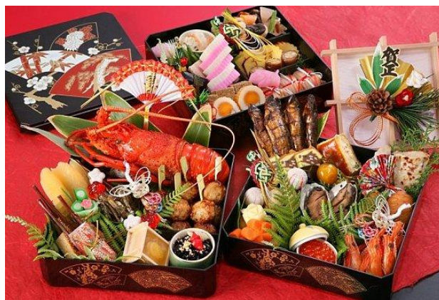
ภาพที่7 ชุดอาหารที่รับประทานในวันปีใหม่

http://www.punica.co.th/bbs/viewthread.php?tid=9068