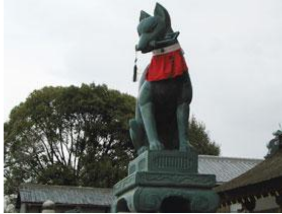
ภาพที่ 9 รูปปั้นซึ่งเป็นร่างหนึ่งของเทพอินาริ