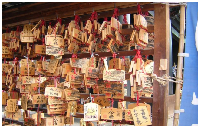
ภาพที่ 8 ป้ายอะมะ