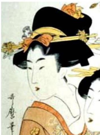
ภาพที่12 ทรงผมของโสเภณี เรียกว่าทรง Yoko hyoko

มีลักษณะทรงผมที่เรียกว่า ทรงผม Yoko hyoko โดยมีวิธีการทำคือ เกล้าผมขนาดใหญ่ไว้ด้านบน มีหวีกิ่งไม้ ริมบั้น ประดับตกแต่งบนผม ปักกระจายไว้ด้านข้าง เป็นทรงผมที่มีลักษณะคล้ายภูเขาขนาดใหญ่ไว้บนศีรษะ มีปีกสองข้าง มีการประดับตกแต่ง