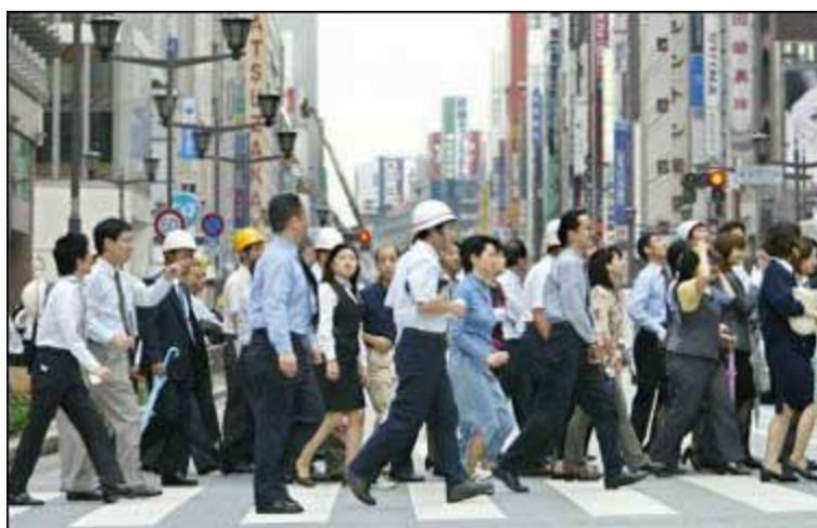
ภาพที่ 13 ลักษณะทรงผมของพนักงานบริษัท และ ลูกจ้างในโรงงาน

ยังต้องตัดผมให้เรียบร้อยไม่ปล่อยให้ผมยาวรุงรัง เราจะพบเห็นผู้ชายวัยทำงานของญี่ปุ่น มักจะใส่สูทตัดผมทรง ทรง ย้อมผมสีดำ กลายเป็นเอกลักษณ์ของชายวัยทำงานของญี่ปุ่น การที่ตัดผมแบบนี้เพื่อสร้างภาพลักษณ์ให้น่าเชื่อถือและสร้างความเป็นระเบียบวินัยในองค์กร ดังนั้นการควบคุมในยุคที่สี่นี้ไม่ใช่การควบคุมทางร่างกาย แต่เป็นการยกระดับการควบคุมให้อยู่ในกระแสสังคมทุนนิยม โดยเปลี่ยนจากการควบคุมผ่านตัวบุคคลมาเป็นกลุ่มคนแทน