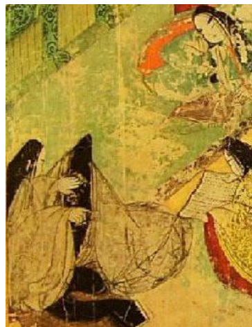
ภาพที่ 5 ทรงผมของผู้หญิงชาวบ้านทั่วไปในยุคเอโดะ เรียกว่าทรง Taregami