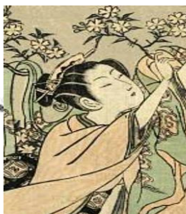
ภาพที่ 6 ทรงผมของผู้หญิงชาวบ้านทั่วไปในยุคเอโดะ เรียกว่าทรง Shimada Mage ที่มา http://gwomatsuri.blogspot.com/2010_08_02_archive.html (ซ้าย) http://asianhistory.about.com/od/japan/ss/JapanHair.htm (ขวา)