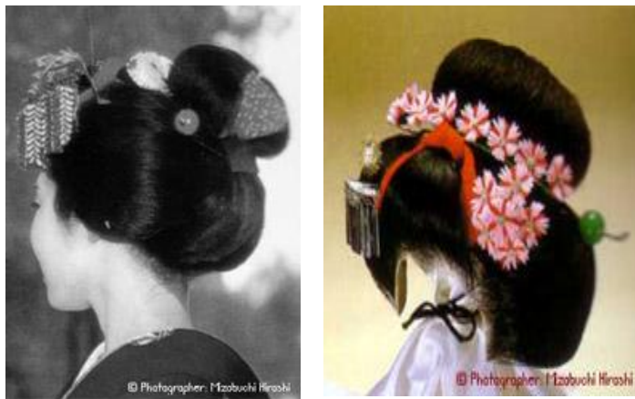
ภาพที่9 ทรงผมในพิธีเลื่อนชั้นไมโกะรุ่นเยาว์เป็นไมโกะรุ่นใหญ่ เรียกว่าทรง Ofuku

3.3.2 พิธีเลื่อนชั้นไมโกะรุ่นเยาว์เป็นไมโกะรุ่นใหญ่: ทรงโอฟุคุ (Ofuku) วิธีการทำผมทรงโอฟุคุ เหมือนกับทรงวาเรชิโนบุ เพียงแต่จะพันแถบผ้าไหมสีแดงเพียงส่วนบนของมวยผมเท่านั้น ส่วนเครื่องประดับก็จะคล้ายกัน