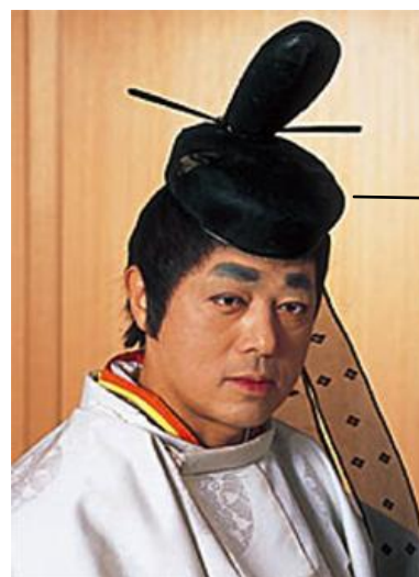
หมวกคะบุโตะ

ภาพที่2 ทรงผมของผู้หญิงในยุคอะซึกะและนาระ (ซ้าย) ทรงผมของผู้ชายในยุคอะซึกะและนาระ (ขวา)