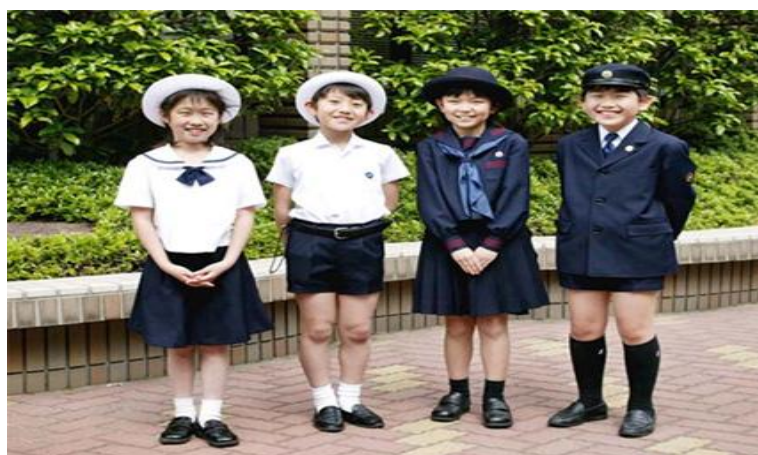
ภาพที่14 ลักษณะทรงผมของนักเรียนประถมญี่ปุ่น

เมื่อญี่ปุ่นเข้าสู่สังคมสมัยใหม่ การสร้างอัตลักษณ์แบบญี่ปุ่นดั้งเดิมเปลี่ยนเป็นการสร้างอัตลักษณ์ของคนญี่ปุ่นให้เป็นรูปแบบตะวันตก ทรงผมเป็นสิ่งที่แสดงให้เห็นถึงหน้าที่ของแต่ละคนในสังคมเพราะทรงผมของแต่ละอาชีพจะแตกต่างกันไป เช่น ทรงผมของนักเรียน ทรงผมของคนทำงาน เป็นต้น ซึ่งแตกต่างจากในอดีตตามแนวคิดแบบตะวันออกทรงผมแบบญี่ปุ่นจะเป็นสิ่งที่แบ่งเพศและชนชั้น อย่างชัดเจนว่าแต่ละคนว่าเป็นเพศใดชนชั้นใด แต่เมื่อญี่ปุ่นรับแนวคิดตะวันตกเข้ามาในยุคนี้ จึงเปลี่ยนให้ทรงผมไม่สามารถใช้แสดงอัตลักษณ์แบ่งเพศและชนชั้นอีกต่อไป เพราะทรงผมไม่มีรูปแบบที่ตายตัวตาม ทรงผมจึงไม่สามารถกำหนดชนชั้นทางสังคมอีกต่อไป