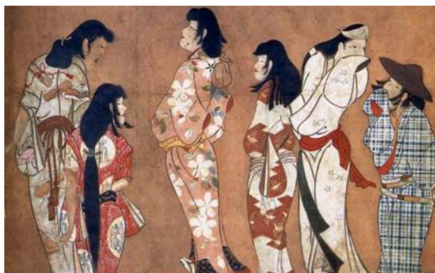
ภาพที่3 ทรงผมของผู้หญิงในยุคเฮอัน