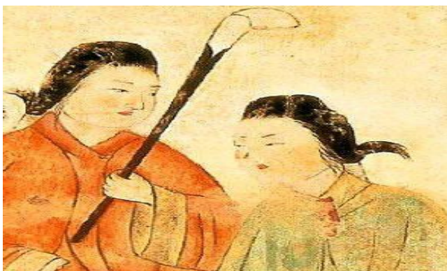
ภาพที่4 ทรงผมของผู้หญิงชนชั้นสูงในยุคเอโดะ เรียกว่าทรง Keptasu

มีลักษณะทรงผมที่เรียกว่า ทรงผม Keptasu: วิธีการทำผมด้านหน้ายกสูงมีลักษณะสูงเหมือนกลอง ส่วนผมด้านหลังมัดเป็นหางม้ามีลักษณะคล้ายเคียว