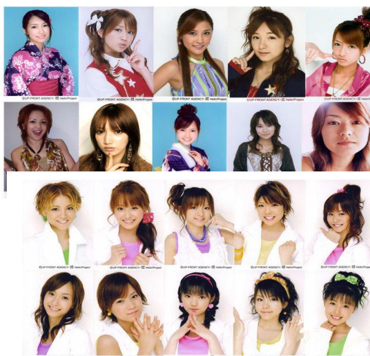
ภาพที่15 ทรงผมของผู้หญิงในยุควัฒนธรรมนิยมทรงผมญี่ปุ่น (ซ้าย)

ทรงผมแสดงให้เห็นถึงตัวตนของคนญี่ปุ่นที่มีความหลากหลายผ่านทางทรงผมของแต่ละคนในแต่ละช่วงอายุ ทรงผมในยุคนี้สะท้อนภาพสังคมญี่ปุ่นที่มีการผสมผสานระหว่างวัฒนธรรมเก่าและใหม่ร่วมกันได้เป็นอย่างดีพบว่าคนรุ่นเก่าคือ ผู้สูงอายุ ผู้ใหญ่วัยทำงาน ก็มักจะยังทำทรงผมให้มีรูปแบบที่เรียบง่าย ไม่นิยมข้อมผม สีสันฉูดฉาด อาจจะเป็นเพราะหน้าที่ในสังคมที่กำหนดและความเชื่อที่เน้นไปที่การสร้างชาติให้เป็นระเบียบเรียบร้อยและมีแบบแผน ในขณะที่เดียวกันทรงผมของวัยรุ่น ซึ่งถือเป็นคนรุ่นใหม่ กลายเป็นไม่มีรูปแบบทรงผมที่ตายตัว เปลี่ยนแปลงทรงผมไปตามกระแสแฟชั่น แต่วัยรุ่นญี่ปุ่นไม่ได้เป็นผู้ตามกระแสเพียงฝ่ายเดียว วัยรุ่นญี่ปุ่นก็มีการสร้างทรงผมเป็นของตนเอง แสดงให้เห็นถึงการสร้างสรรค์เป็นผู้นำ