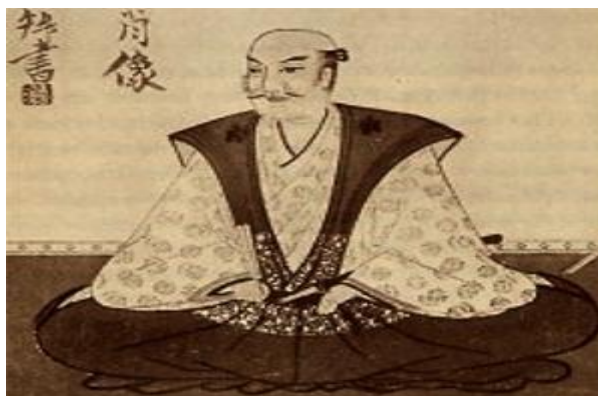
ภาพที่4 ทรงผมของผู้ชายที่ โคนผมในยุคคะมะคุระและมุโระมะจิ

ทรงผมของผู้หญิงจะมีลักษณะปล่อยผมยาวคล้ายกับยุคเฮอัน ส่วนทรงผมของผู้ชายทรงผมของผู้ชายมีทั้งการ โคนผมและแบบที่ไม่ โคนผม แต่พบว่าจะมีลักษณะของการ โคนผมมากกว่าเนื่องจาก ยุคนี้เป็นการปกครองเปลี่ยนจากระบบทาสที่กษัตริย์เป็นผู้มีอำนาจในการปกครองไปเป็นการปกครองระบบศักดินาภายใต้การปกครองของ โชกุนหรือผู้ปกครองทางการทหาร ชนชั้นสูงจึงเปลี่ยนจากขุนนางเป็นชนชั้นนักรบ จึงเกิดสงครามการเมืองขึ้น ทรงผมที่มีลักษณะของการ โคนผมจึงเป็นนิยมของผู้ชายที่แสดงออกถึงการเป็นนักรบ ส่วนผู้ชายที่ไม่ โคนผมก็จะเป็นการแสดงถึงชนชั้นอื่นที่ไม่ใช่ นักรบ ในยุคนี้