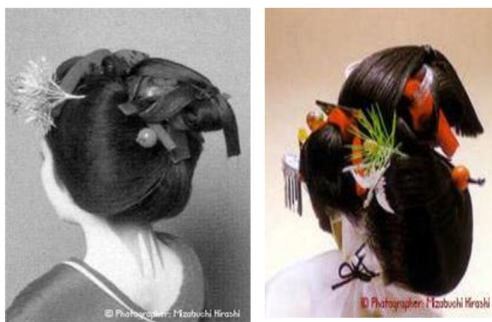
ภาพที่10 ทรงผมในพิธีกลับปกเสื้อ เรียกว่าทรง Sango

3.3.3 พิธีกลับปกเสื้อ: ทรงซังโกะ (Sango) วิธีการทำผม คือเกล้าผมขึ้น บิดให้เป็นห่วง ปล่อยหางผมเอาไว้ด้านหลัง และเจ้าของสำนักเกอิชาจะเป็นผู้ที่ตัดชายผมที่ปล่อยไว้