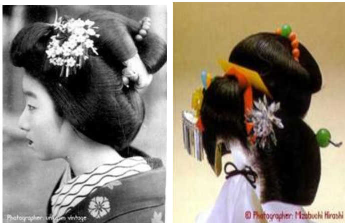
ภาพที่11 ทรงผมในเทศกาลสำคัญต่างๆ เรียกว่าทรง Yakko Shimada

3.3.4 เทศกาลสำคัญอื่นๆ: ทรงยักษ์โกะชิมาดะ (Yakko Shimada) วิธีการทำผม คือเกล้าผมเป็นทรงยักษ์โกะชิมาดะ และประดับด้วยเครื่องประดับที่แตกต่างกันไปตามเทศกาล เช่น วันขึ้นปีใหม่จะปักปิ่นนกฟิราบบิ้นดอกไม้ ปิ่นปะการัง ประดับด้วยหวี ลูกบิดหยก และจะพันฐานมวยผมด้วยแถบผ้าไหมสีฟ้า ชมพู หรือแดง เป็นต้น