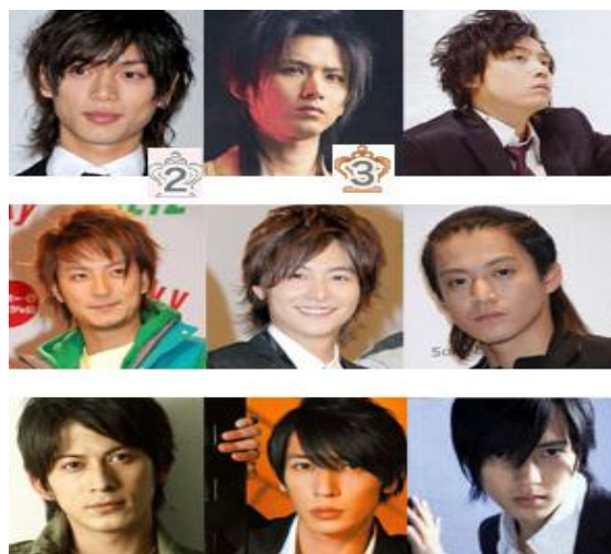
ทรงผมของผู้ชายในยุคนิยมวัฒนธรรมญี่ปุ่น (ขวา)