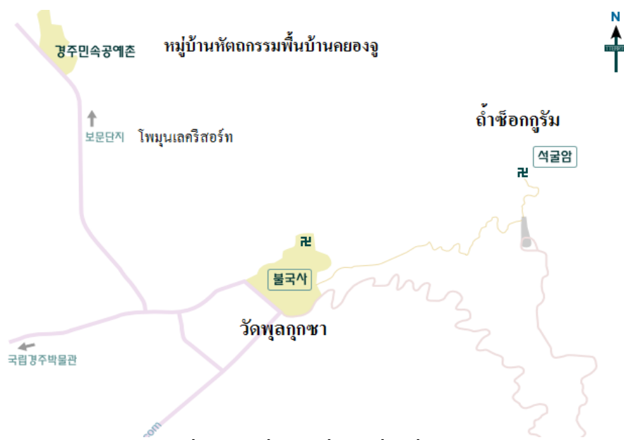
ภาพที่ 2 แผนที่สถานที่ท่องเที่ยวที่สำคัญในคยองจู