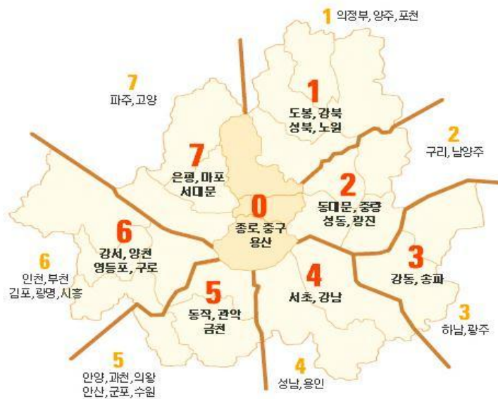
ภาพที่ 3 แผนที่เส้นทางรถประจำทางในกรุงโซล

ในกรุงโซลมีรถประจำทางแล่นผ่านรอบเมือง โดยมีป้ายบอกสถานีเป็นภาษาเกาหลี ซึ่งเป็นปัญหาสำหรับนักท่องเที่ยวมากที่สุด สายการเดินรถแบ่งออกเป็น 5 สาย ได้แก่ สายสีฟ้า สายสีเขียว สายสีแดง สายสีเหลือง และสายในเมือง โดยแต่ละสายจะมีตัวเลข 3 หลัก หลักที่ 1 หมายถึง เขตพื้นที่ต้นทาง หลักที่ 2 หมายถึง เขตพื้นที่ปลายทาง หลักที่ 3 หมายถึง หมายเลขเส้นทาง