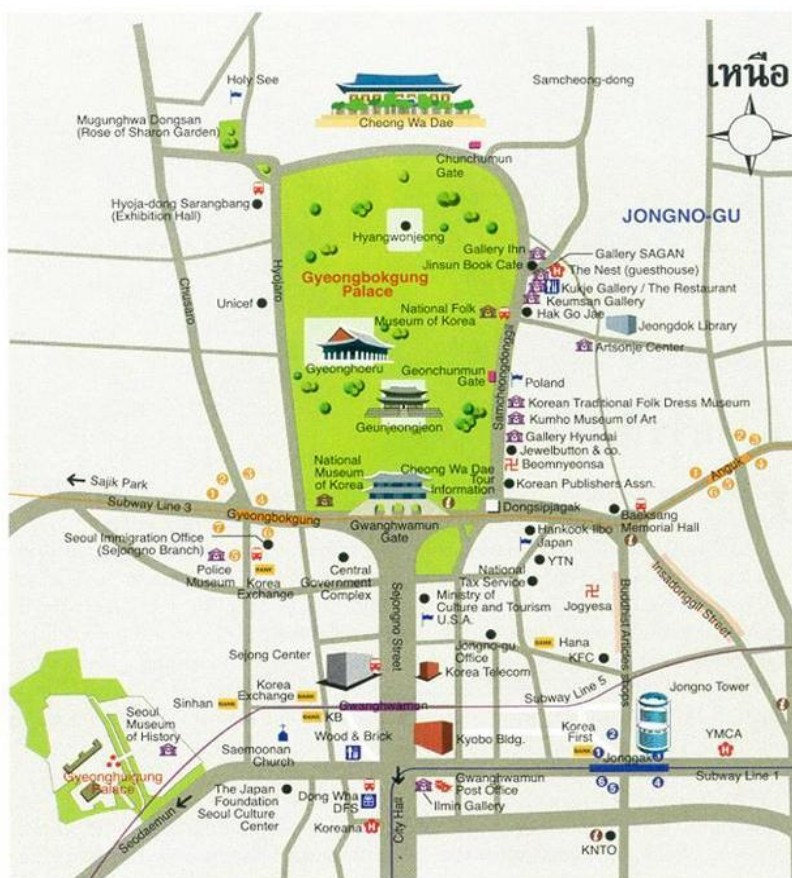
ภาพที่ 1 แสดงแผนที่บริเวณโดยรอบจัตุรัสควังฮวามุน

2. รถประจำทาง คยองบกกุงฝั่งตะวันตก สาย 0212,1020,1711,7016,7022 คยองบกกุงฝั่งตะวันออกเคียงใต้ สาย 1020,109,171,272,602,602-1( Airport Bus), 606,7025,708 และคยองบกกุงฝั่งตะวันตกเฉียงใต้ สาย 9708