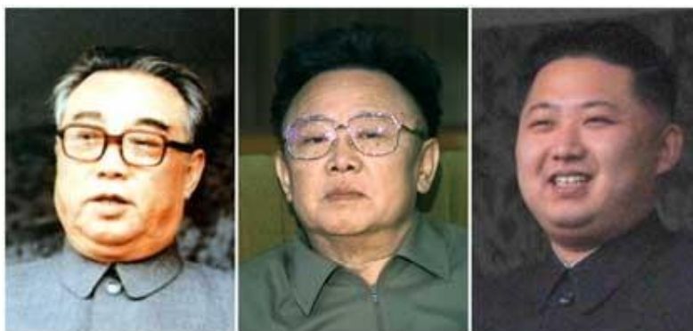
รูปที่ 5. ผู้นำเกาหลีเหนือ คิมอิลซ็อง คิมจองอิล และคิมจองอิน

ว่าก่อนคิมจองอิลเสียชีวิตในเดือนธันวาคม ค.ศ.2011 เพียงหนึ่งปี เขาได้วางตัวคิมจองอินบุตรชายให้เป็นทายาททางการเมือง โดยที่คิมจองอินอายุน้อยและไม่มีประสบการณ์ทั้งในพรรค กองทัพ และรัฐบาล หากแต่เพราะคิมจองอินเป็นบุคคลในตระกูลคิม และอยู่ในฐานะหลานของผู้ก่อตั้งเกาหลีเหนือ ดังนั้นการก้าวขึ้นดำรงตำแหน่งผู้นำจึงดูไม่ต่างไปจากการสืบสันตติวงศ์ในระบอบสมบูรณาญาสิทธิราชย์ ในเมื่อผู้นำคนใหม่ยังไม่มีผลงานหรือแสดงความสามารถให้เป็นที่ประจักษ์ย่อมมีความเป็นไปได้ที่จะเกิดการแย่งชิงอำนาจขึ้น สำหรับจุดอ่อนนี้ ผู้นำเกาหลีเหนือคนแรกและคนถัดมาต่างได้สร้างกลไกเพื่อป้องกันปัญหาที่จะเกิดขึ้นเอาไว้แล้ว