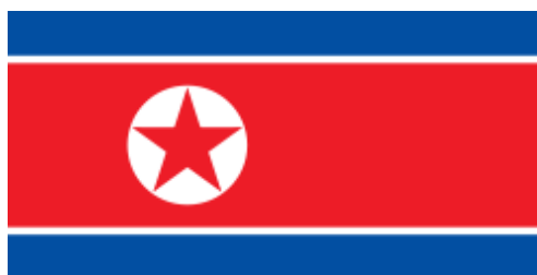
รูปที่ 1 ธงชาติประเทศสาธารณรัฐเกาหลีและประเทศสาธารณรัฐประชาธิปไตยประชาชนเกาหลี