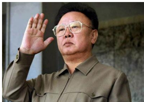
รูปที่ 3 คิมจองอิล

ประวัติการศึกษา คิมจองอิลสำเร็จการศึกษาพื้นฐานทั่วไปในช่วงเวลาประมาณ ค.ศ.1950-1960 โดยศึกษาชั้นประถมและมัธยม ที่กรุงเปียงยาง ตั้งแต่วัยเด็กก็ฉายแววที่จะเอาดีทางด้าน การเมืองอย่างเด่นชัด ระหว่างที่ใช้ชีวิตนักเรียน ก็เริ่มเข้าไปเกี่ยวข้องกับการเมือง โดยเข้าร่วมกลุ่ม สหภาพเยาวชนและสันนิบาตเยาวชนประชาธิปไตย ทำให้ได้เรียนรู้ทฤษฎีมาร์กซิสต์ และการศึกษา ด้านอื่นๆ ในปีค.ศ. 1957 คิมจองอิลได้รับเลือกให้เป็นรองกรรมการนักเรียนของโรงเรียนที่เป็น สาขาของสันนิบาตประชาธิปไตย โดยแสดงจุดยืนที่ชัดเจนว่าเกลียดชังนักการเมืองที่ดีแต่หา ผลประโยชน์ใส่ตัว นอกจากนั้นยังพยายามส่งเสริมให้ เพื่อนร่วมชั้นเรียนได้มีความรู้เกี่ยวกับเรื่อง เศรษฐศาสตร์และการเมืองให้มากกว่าเดิม คิมจองอิล จบการศึกษาจากมหาวิทยาลัยคิมอิลซอง เอก เศรษฐศาสตร์การเมือง เช่นเดียวกับชนชั้นนำเกาหลี เหนืออื่นๆ ที่จะต้องจบจากสถาบันแห่งนี้ ทั้งยังมี โอกาสศึกษาภาษาอังกฤษที่มหาวิทยาลัยมอลตาอีกด้วย