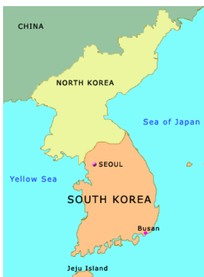
รูปที่ 2 แผนที่คาบสมุทรเกาหลี

ความหวังของคนเกาหลีที่จะเห็นดินแดนในคาบสมุทรเกาหลีเป็นแผ่นดินเดียวกันภายหลังจากการได้รับอิสรภาพจากญี่ปุ่นสิ้นสุดลง เมื่อมีการกำหนดเส้นแบ่งเขตแดน โดยสมาชิกในคณะกรรมการหน่วยพิทักษ์ของกองทัพสหรัฐอเมริกาเป็นเส้นขนาน 38 องศาเหนือ ขณะนั้นรัฐบาลโซเวียตภายใต้การนำของ โจเซฟ สตาลิน ได้มีคำร้องขอให้กลุ่มกองทัพประชาชนที่สู้รบต่อต้านญี่ปุ่นด้วยยุทธวิธีกองโจร ให้เป็นฝ่ายที่อยู่ภายใต้การปกครองของโซเวียต ส่วนดินแดนที่อยู่ใต้เส้นขนาน 38 องศาเหนือ ถือเป็นเขตปกครองของอเมริกา ต่อมาองค์การสหประชาชาติ หรือ UN ให้มีการเลือกตั้งขึ้นในปี ค.ศ.1948 โดยให้ทางใต้และทางเหนือเลือกผู้แทนเพื่อจัดตั้งรัฐสภาแห่งชาติ แต่สมาชิกของฝ่ายใต้กลับบริบรางวัลรัฐธรรมนูญแบบประชาธิปไตยขึ้นทันทีและเลือก ดร.ซึงมันรี เป็นประธานาธิบดีคนแรก รวมทั้งได้ประกาศตัวเป็นประเทศสาธารณรัฐเกาหลี(เกาหลีใต้) ส่วนทางเหนือก็ได้จัดให้มีการเลือกตั้งในเวลาต่อมา จากนั้นก็จัดตั้งประเทศสาธารณรัฐประชาธิปไตยเกาหลี(เกาหลีเหนือ)