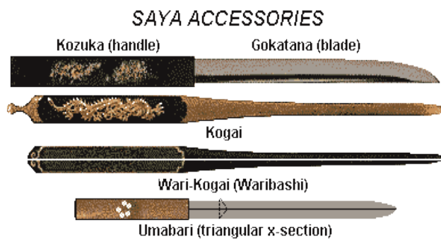
ชื่อภาพ โคซูกะ โคโก และ ะริโคโก

ปลอกของดาบรูปแบบ นูกะซูกิริ ถูกออกแบบมาให้ใช้งานได้สารพัดประโยชน์ เช่น ติดตั้งช่องใส่ มีดสารพัดประโยชน์ ช่องใส่โคซูกะ(Kozuka) หรือ อาวุธลับ และช่องใส่ ะริโคโก (Wari-kogai) หรือ ตะเกียบ โคซูกะเป็นมีดขนาดเล็กมาก ใช้เป็นอาวุธลับ สมัยเอโดะ โคซูกะไม่ได้ทำโดยช่างตีดาบเหมือนอาวุธทั่วไป แต่จะทำโดยช่างทำเครื่องประดับ ทั้งนี้เพราะว่า สมัยนี้นิยมสลักลวดลายสวยงามลงบนอาวุธชิ้นเล็กๆ ส่วน ะริโคโก หรือตะเกียบ ก็จะทำโดยช่างทำเครื่องประดับเช่นกัน และต้องเป็นช่างที่ฝีมือดีมาก ถึงจะสามารถทำ ะริโคโก ได้ เพราะ ะริโคโก มีขนาดเล็กกว่า โคซูกะมากจึงจำเป็นต้องใช้ช่างทำเครื่องประดับที่ประณีต ะริโคโก ไม่ได้มีไว้ใช้สำหรับรับประทานอาหารเพียงอย่างเดียว แต่สามารถกลายอาวุธลับได้เมื่อจำเป็น เนื่องจากปลายด้ามสามารถถอดออกเป็นมีดได้