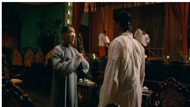
ภาพที่ 6 เงินเส้าไป๋ร้องขอความช่วยเหลือ คร. ซุนยัตเซ็นจากนายพลฟาง

“งานปฏิวัติไม่ใช่เพียงแค่มุ่งเงินพิมพ์หนังสือและแจกใบปลิวความหมายของการปฏิวัติคือการหลั่งเลือดและยอมเสียสละ” (เงินเส้าไป๋)