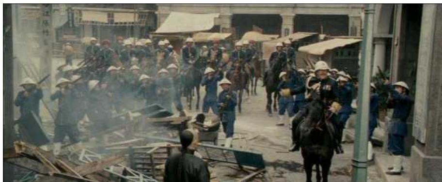
ภาพที่ 3 ซื่อมีฟูนำกำลังตำรวจมาแอบคุ้มกันหลี่อ้วถ้งและนำขบวน ดร. ซุนยัตเซ็น

พาขบวนของ ดร.ซุนยัตเซ็น ไปจนถึงบ้านมารดาอย่างปลอดภัย แต่ด้วยหน้าที่ ความรับผิดชอบเขาจึงไม่สามารถช่วยเหลืออย่างเต็มที่ หลังจากพาขบวนของ ดร.ซุนยัตเซ็นไปถึงจุดหมาย เขาจึงได้ถอนกองกำลังทั้งหมดกลับ