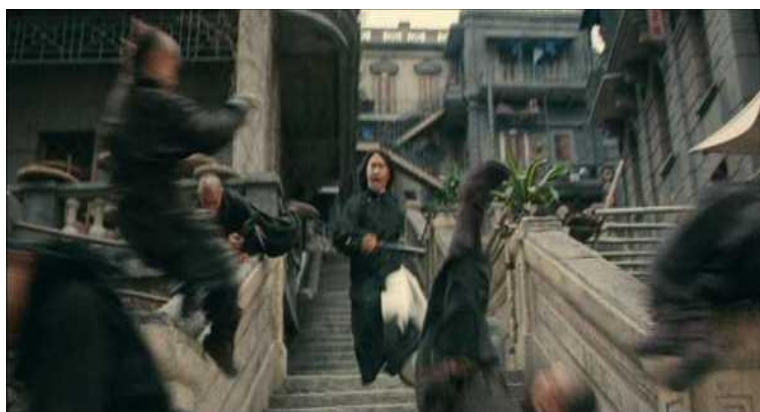
ภาพที่ 14 หลิวยูไป๋ต่อสู้กับมือสังหารของเหยียนเสี่ยวกั๋ว

“ไปรักผู้หญิงที่ไม่ควรจะรัก จนพ่อฆ่าใจตาย มีหน้าซ้ำเธอมาตัวตายต่อหน้าฉันอีก ฉันต้องอยู่อย่างละอายใจ ฉันเหมือนญาติคนหนึ่งเท่านั้น ไม่มีอะไรเจ็บปวดกว่านี้อีกแล้ว ขอบคุณมากคุณชายหลี่ หลิวยูไป๋จะได้หลุดพ้นซะที”