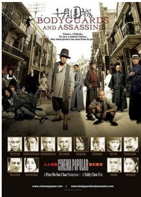
ภาพที่ 1 โปสเตอร์ภาพยนตร์