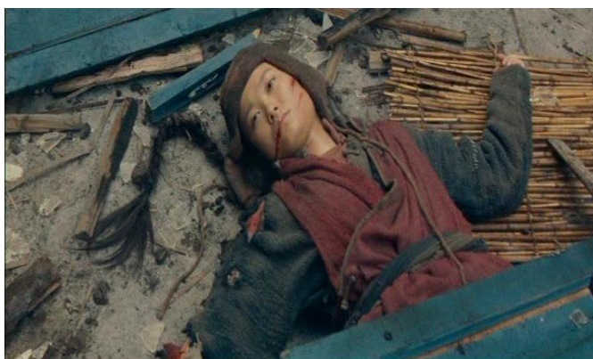
ภาพที่ 12 ฟางหงพลีชีพเพื่อสะกดแผนการไร่ระเบิดสังหาร ดร. ชุนยัคเซ็น

“หนูอยากพบเพื่อนของท่านคนนั้น คนที่พ่อหนูต้องตายเพราะเขา งานที่พ่อทำค้างเอาไว้หนูจะทำต่อ”