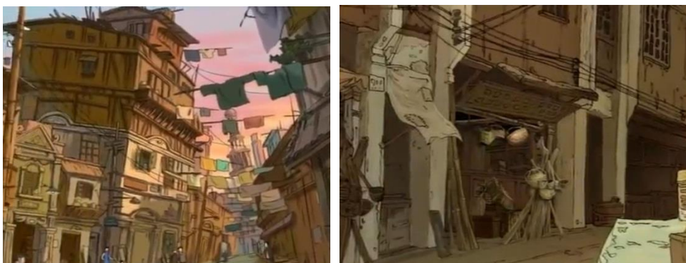
ภาพที่ 11-12 ที่อยู่อาศัยของคนจน

เป็นฉากที่ปรากฏในหนังสือการ์ตูน เป็นฉากที่ซานหมาเดิน ไปถึงสถานสงเคราะห์เด็กกำพร้าแห่งหนึ่ง พอพบกับหัวหน้าสถานสงเคราะห์ซานหมาจึงขอร้องให้หัวหน้ารับตนไว้สักคน คิดไม่ถึงเลยว่า ศาสด์ตัดสินใจที่คืนสถานสงเคราะห์แห่งนี้ให้กับผู้อื่นไปแล้ว สถานที่แห่งนี้ต้องถูกปิดลง เด็กกำพร้าจำนวนมากกำลังประสบปัญหา จึงไม่สามารถรับซานหมาได้