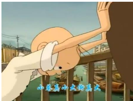
ภาพที่ 6 ซานเหมาทำงานรับจ้างเงินสามลื้อ