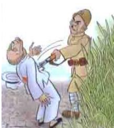
ภาพที่1 ความโหดเหี้ยมของคนญี่ปุ่น