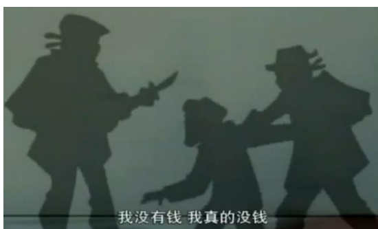
ภาพที่ 18 โจรผู้ร้ายเกลื่อนเมือง

เป็นตอนที่ซานเหม้าออกมาทำงานรับจ้างชั่วคราวทำให้กับผู้คนที่ด้านผ่านไปผ่านมาตามข้างถนนและมีชายมีอายุอีกคนหนึ่งทำอาชีพรับปะยางรถตั้งอยู่ข้างๆซานเหม้า เข้าได้ชักชวนให้ซานเหม้าร่วมมือกับตนเอาตะปูไปโรยไว้บนถนนเพื่อถ้าหากมีรถผ่านมาเหยียบตะปูแล้วรถยางรั่วก็จะได้มาซ่อมที่ร้านของตนเองและซานเหม้าก็จะได้ผลพลอยได้ด้วยที่ว่าจะได้มีคนมาจ้างซ่อมทำขณะที่รอเปลี่ยนยางรถ แต่ซานเหม้าไม่ยอมทำตาม เมื่อมีรถเหยียบตะปูและร้านที่ใกล้ที่สุดคือร้านของชายผู้นั้นเขาก็มีอุบายเรียกค่าซ่อมเพิ่มสูงขึ้นถึงไม่ยอมจ่ายแต่ก็ต้องจำใจ เหตุการณ์นี้แสดงให้เห็นถึงความเห็นแก่ตัวได้อย่างชัดเจน ตัวเองได้ผลประโยชน์บนความทุกข์ของผู้อื่น