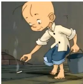
ภาพที่ 3 ซานหมาทำงานเก็บเศษบุหรี่