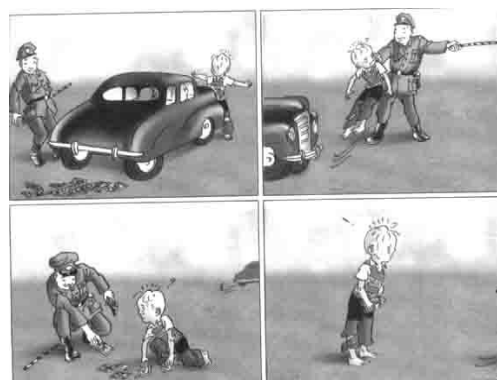
ภาพที่ 22 เงินคืออำนาจ

เป็นฉากที่คนรวยกำลังจะตีซานหมา แต่กลับเงี้ยวผิดไปถูกข้าราชการที่ยืนอยู่ด้านหลัง ข้าราชการท่านนั้น โกรธจัดเงี้ยวไม่เท่าจะตีคนรวยคนนั้นแต่ก็กลับเงี้ยวไม่เท่าไปถูกทหารชาวต่างชาติที่ยืนอยู่ด้านหลังอีกเช่นกัน ทหารชาวต่างชาติยกเท้าเตะข้าราชการเรื่องจบลงโดยคนร่ำรวยและ ข้าราชการชาวจีนต่างพากันโค้งคำนับขอโทษทหารชาวต่างชาติอย่างอ่อนน้อมเป็นที่สุด (สมัยนั้น เป็นสมัยเดียวกับที่มีเขตเช่าพิเศษที่เขียนป้ายติดไว้ว่า ห้ามสุนัขและคนจีนเข้าในเขตนี้ ทั้งที่เป็นพื้น แผ่นดินจีน แท้ๆ)