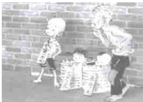
ภาพที่ 19 ชายคน