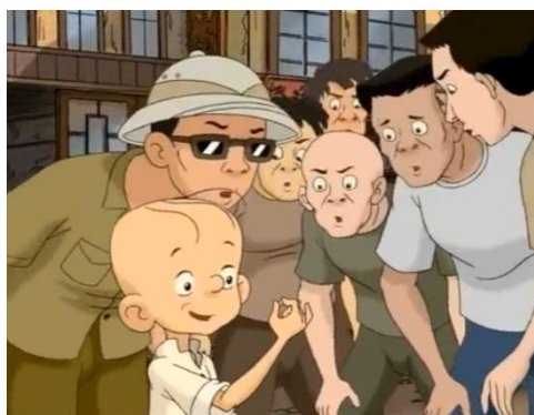
ภาพที่ 7 ค่าของเมล็ดข้าว