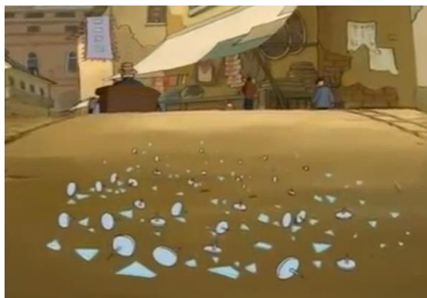
ภาพที่ 17 ความเห็นแก่ตัวของช่างรับปะยาง

ยากจนเลี้ยงลูกไม่ได้ก็มีแต่จะอดตายทั้งบ้าน ทางรอดทางเดียวที่พวกเขาจะทำคือนำลูกออกเร่ขายให้ไปอยู่กับคนอื่น เพื่อลูกจะได้มีอาหารกิน