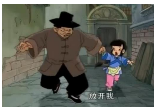
ภาพที่ 16 ชายเด็ก