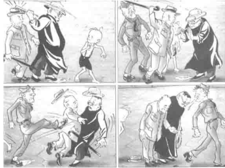
ภาพที่ 20 อำนาจ

ที่มา : หนังสือการ์ตูนเพื่อชีวิต ชันหมาพเนจร