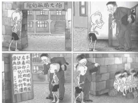
ภาพที่ 10 เด็กกำพร้าที่รัฐบาลละเลย

ที่มา : หนังสือการ์ตูนเพื่อชีวิต ชันหมาพเนจร