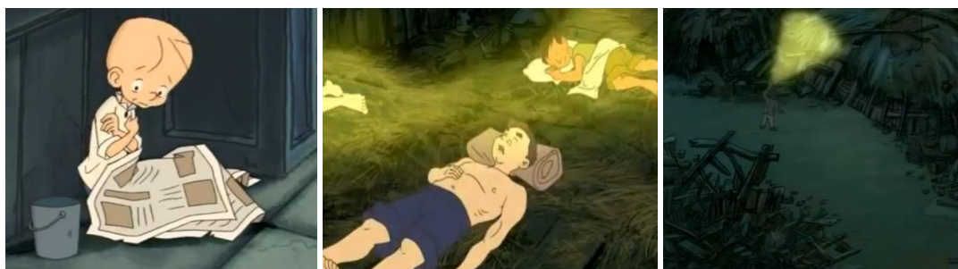
ภาพที่ 13-15 ที่นอนของคนไร้บ้าน

ที่อยู่อาศัยส่วนใหญ่ที่ปรากฏในการ์ตูนเรื่องนี้ส่วนใหญ่จะให้เห็นสภาพความเป็นอยู่ของชุมชนแออัด หรือที่คนทั่วไปเรียกว่า สลัม