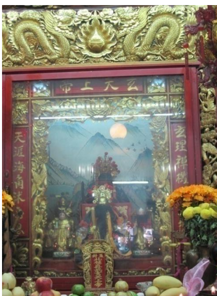
รูปภาพที่2 เทพเหียงเทียนเสียงตี้ (ตัวเหล่าเอี้ย)

ดังนั้นในปัจจุบันที่เขาเสียนหัวชั้น รูปปั้นของเทพเหียงเทียนเสียงตี้จึงมีเต่าและงูที่เป็นรูปปั้นถูกเหยียบไว้ใต้ฝ่าเท้า และเป็นเหตุผลให้ผู้คนที่มากราบไหว้ไม่นำเนื้อวัวมาถวายตั้งแต่นั้นเป็นต้นมา (เอกสารอัดสำเนา, ม.ป.ป.)