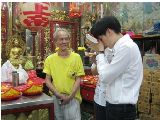
รูปภาพที่ 7 พิธีปิดตัวปีขง