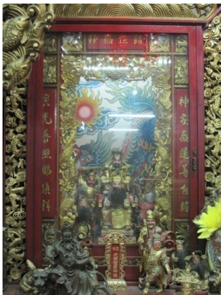
รูปภาพที่9 เทพไล่ชั่งเอี้ย

เป็นศาลในลัทธิเต๋า ได้มีการประยุกต์ผสมผสานร่วมกับพุทธมหายานและหินยานเพื่อให้เข้ากับสังคมทั้งไทยและจีน จึงทำให้ศาลเจ้าพ่อเสือนั้นมีผู้คนมากมายมากราบไหว้ขอพรต่างๆ