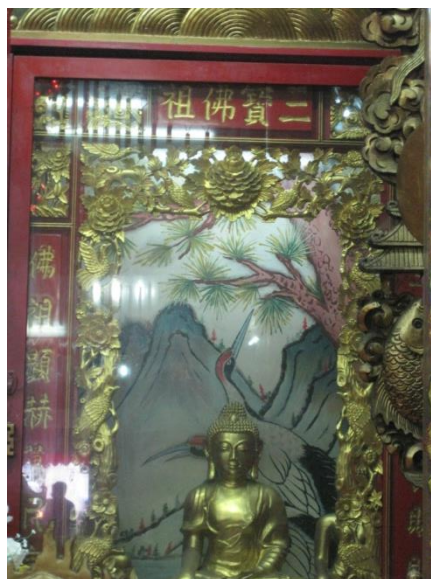
รูปภาพที่12 พระพุทธเจ้า