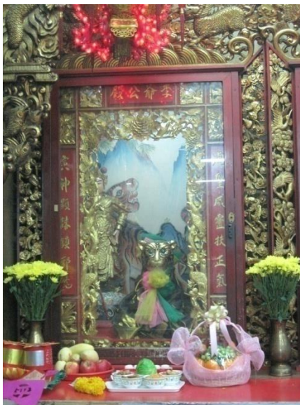
รูปภาพที่4 องค์เจ้าพ่อเสือ