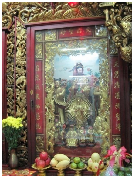
รูปภาพที่11 เจ้าแม่กวานอิม