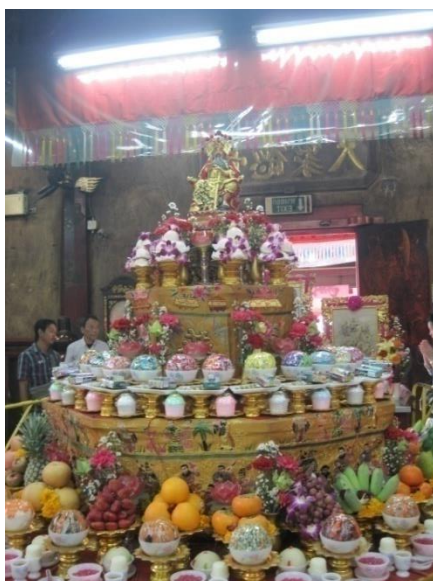
รูปภาพที่5 เครื่องสักการะในพิธีก้งจูเทียน

กันตั้งปลิขานต่อเบื้องหน้าพระพักตร์แห่งองค์พระสัมมาสัมพุทธเจ้าขอถึงพระรัตนตรัยเป็นที่พึ่งและ ประกาศตนเป็นธรรมบาลค้ำครองพระสัทธรรมและเหล่าพุทธบริษัทให้บำเพ็ญบุญบารมีได้ราบรื่นโดย มีมิฆารและกษัตริย์ตรายใดๆมาแผ้วพานต่อพระศาสนาและผู้บำเพ็ญธรรมทั้งหลายพิธีก้งจูเทียนนี้มอองค้ตัว เหล่าเอี้ย เป็นเทพประธานในการเจิญเทพต่างๆลงมา ปีหนึ่งจะจัดประมาณ1-2ครั้ง (ศาลเจ้าพ่อเสือ, 2557 : เว็บไซค์)