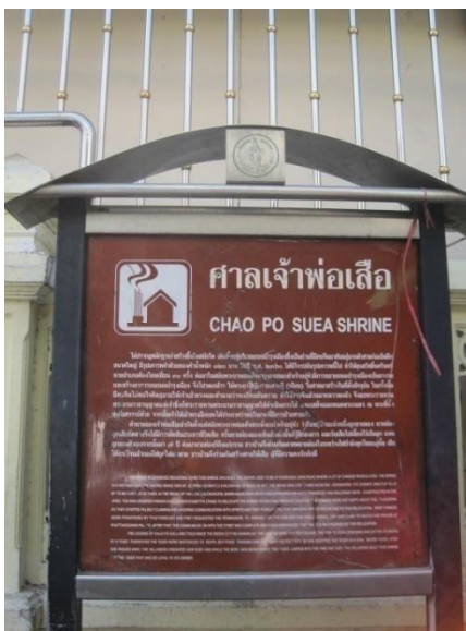
รูปภาพที่1 ป้ายหน้าศาลเจ้าพ่อเสือ