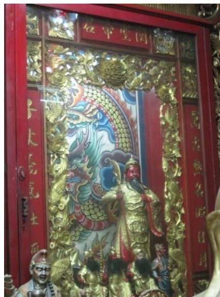
รูปภาพที่10 องค์เจ้าพ่อกวานอู