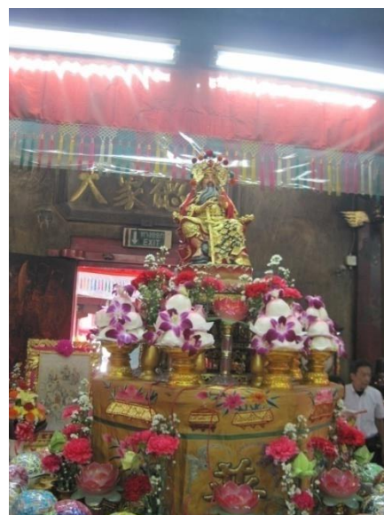
รูปภาพที่6 องค์ค้ตัวเหล่าเอี้ยเป็นประธานในงานพิธี

นอกจากนี้ในเทศกาลต่างๆที่มีความสำคัญต่อชาวไทยเชื้อสายจีนนั้น จะมีผู้คนเข้ามากราบไหว้ ขอพรที่ศาลเป็นจำนวนมากเช่นเทศกาลตรุษจีน ซึ่งเป็นเทศกาลที่สำคัญมากสำหรับชาวไทยเชื้อสายจีน เพราะเป็นวันแรกของปีใหม่ โดยจะมีการเดินทางมากราบไหว้ขอพร เพื่อให้เกิดความเป็นสิริมงคล ตลอดทั้งปี รวมไปถึงคนที่เกิดปีชงจะมีการมาปิดตัวทำพิธีสะเดาะเคราะห์ เพื่อให้เจ้าพ่อค้ำครอง ในการ ปิดตัวปีชงนั้นที่ศาลเจ้าพ่อเสือจะมีวิทยากรในการสอนให้ทำพิธีได้อย่างถูกต้องอีกด้วย โดยผู้คนส่วน ใหญ่ที่มาไหว้ศาลเจ้าพ่อเสือในวันตรุษจีนนั้น จะต้องเช่า "ฮู่" หรือ ยันต์กลับไป มีทั้งเช่าไว้พกติดตัว มี ทั้งเช่าไว้เพื่อติดที่ประตูหน้าบ้าน เพื่อให้องค์เจ้าพ่อช่วยค้ำครอง และป้องกันกษัตริย์ตรายต่างๆ