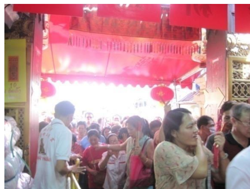
รูปภาพที่ 8 ผู้คนแห่เข้ากราบไหว้ในเทศกาลตรุษจีน