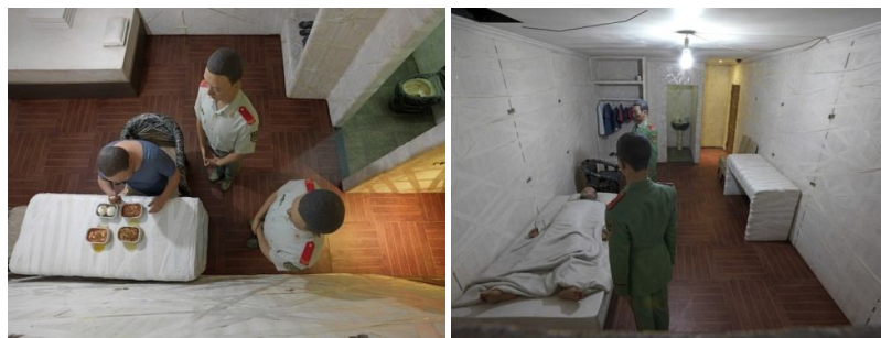
รูป 1 Ai Weiwei กำลังถูกจับตามองขณะรับประทานอาหารและขณะนอนหลับ ที่มา Ai Weiwei (2013 : online)