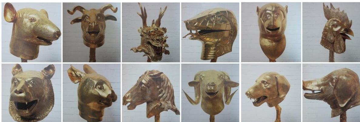
ภาพ หมายเลข 5