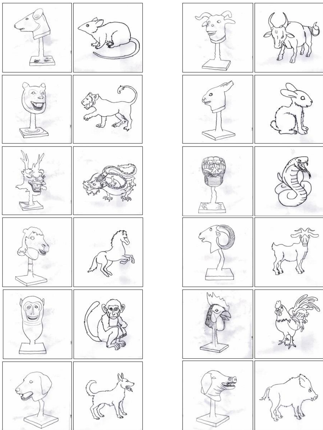
ภาพ หมายเลข 3( คัดลอกายเส้น โดย : ภาณี มณีเนตร)