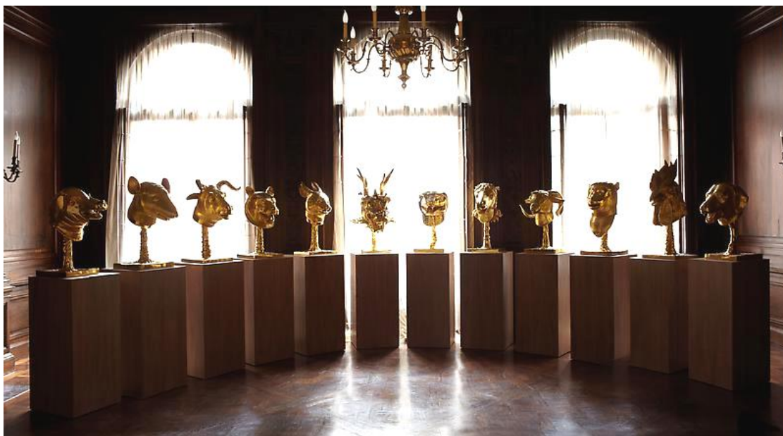
ภาพ หมายเลข 1

ผลกระทบทางประวัติศาสตร์และทัศนคติของศิลปินที่มีผลต่อประติมากรรม Circle of Animals/ Zodiac Headsของอ้ายเว่ยเว่ย(艾未未)