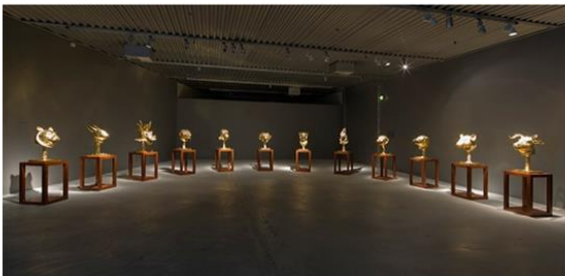
ภาพ หมายเลข 2