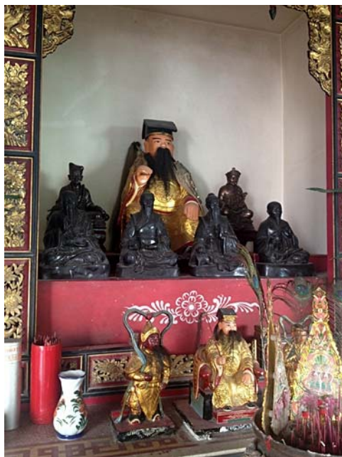
ศาลเจ้านักพรต