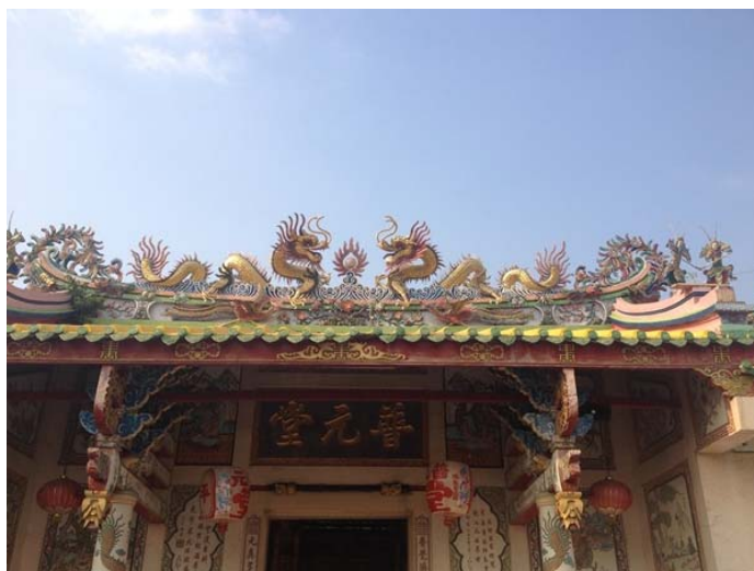
ภาพหลังคาประดับด้วยปูนปั้นรูปมังกรคู่หันหน้าหากัน

ฝาผนังเพื่อเป็นการให้ความหมายและความสำคัญต่อศาลเจ้า และการประดับตกแต่งแต่ละอย่างนั้นก็จะให้ความหมายที่แตกต่างกัน