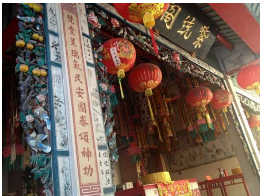
ภาพศิลปะการแกะสลักไม้ด้านข้างของเสาที่เป็นเอกลักษณ์ของศาลเจ้า

ที่มา นางสาวชนิตา เมธาสิทธิพงษ์, ศาลเจ้าโพธิ์ง่วนตั้ง, ถ่ายเมื่อวันที่ 20 มกราคม 2557