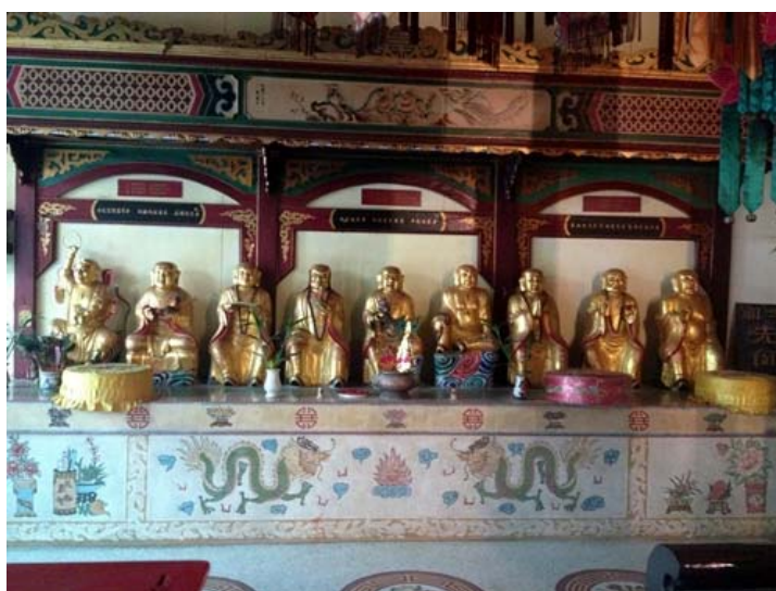
ภาพ18อรหันต์ทางด้านซ้ายของเทพองค์ประธาน ศาลเจ้าโพธิ์ง้วนต้ง. ถ่ายเมื่อวันที่ 20 มกราคม 2557