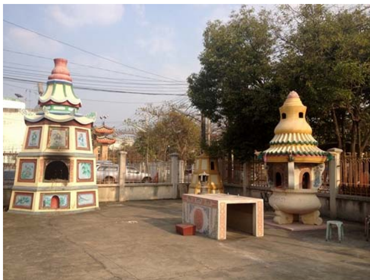
ด้านซ้ายคือเตาเผากระดาษ ด้านขวาคือแท่นบูชาฟ้าดิน

ที่มา นางสาวชนิตา เมธาสิทธิพงษ์. ศาลเจ้าโพธิ์ง่วนตั้ง. ถ่ายเมื่อวันที่ 20 มกราคม 2557