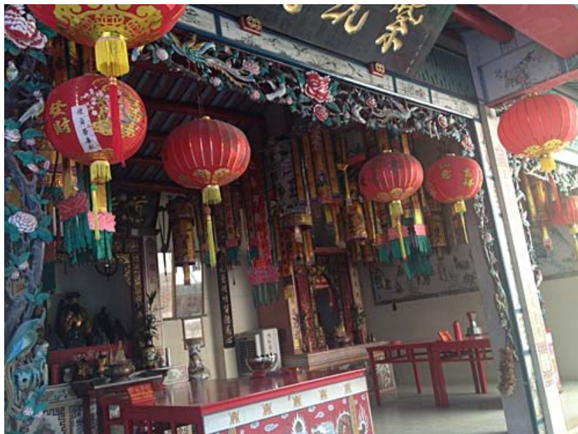
โคมแดงที่ห้อยภายในศาลเจ้า

ที่มา นางสาวชนิตา เมธาสิทธิพงษ์, ศาลเจ้าโพธิ์ง่วนตั้ง, ถ่ายเมื่อวันที่ 20 มกราคม 2557