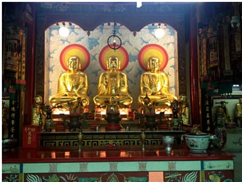
เทพองค์ประธานของศาลเจ้าโพธิ์ง่วนตั้ง