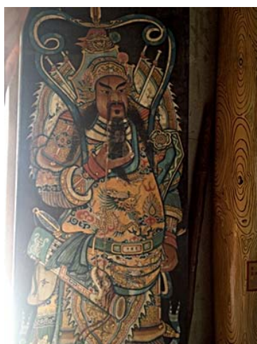
ภาพเทพประตุบนประตูทางเข้าศาลเจ้า

เดินเข้ามาจะพบบานประตูซึ่งเป็นรูปเทพประตุ หรือเหมินเสิน 11 สลักอยู่บนบานประตูทางเข้าศาลเจ้า เทพประตุเป็นสัญลักษณ์มงคลตามคติความเชื่อของชาวจีน เพราะเป็นสัญลักษณ์ความหมายของพลังอำนาจในการพิทักษ์ปกป้องคุ้มครองพื้นที่ที่อยู่ด้านในให้อยู่อย่างสงบร่มเย็น