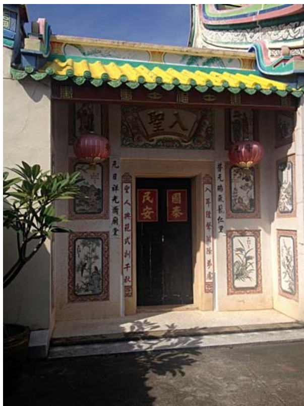
ภาพประตูข้างด้านซ้ายมือของศาลเจ้า