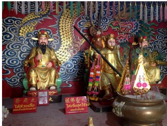
ศาลเทพเจ้าแห่งโชคลาภ เทพเจ้าแห่งเจีย และเทพเจ้าแห่งดวงชะตา

ถัดมาก็จะเป็นศาลเทพเจ้าแห่งโชคลาภ เทพเจ้าแห่งเจีย และเทพเจ้าแห่งดวงชะตา ทั้งสามเทพนี้เป็นที่รู้จักของผู้คนทั่วไปเป็นอย่างดีเทพเจ้าแห่งโชคลาภหรือไท่ส่วยเอี้ยะ ก็จะมอบความโชคดีในเรื่องของเงินทองความอุดมสมบูรณ์ให้แก่ผู้กราบไหว้บูชา เทพเจ้าแห่งเจียจะช่วยให้ประสบความสำเร็จในหน้าที่การงานอย่างรวดเร็ว มีความสำเร็จในเชิงธุรกิจ ศาลต่อมาจะเป็นศาลของเทพเจ้าหมอยา เทพเจ้าการเกษตร และเทพเจ้าผู้โปรดวิญญูณ