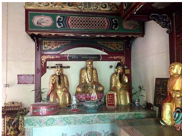
เทพเจ้าคุ้มครองวิหาร ศาสตราจารย์เส้าหลิน และเทพแห่งปัญญา ศาลเจ้าโพธิ์ง้วนต้ง. ถ่ายเมื่อวันที่ 20 มกราคม 2557