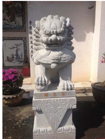
สิงห์คู่ตั้งไว้ด้านหน้าของประตูทางเข้าศาลเจ้า

ที่มา นางสาวชนิตา เมธาสิทธิพงศ์, ศาลเจ้าโพธิ์ง่วนต้ง, ถ่ายเมื่อวันที่ 20 มกราคม 2557