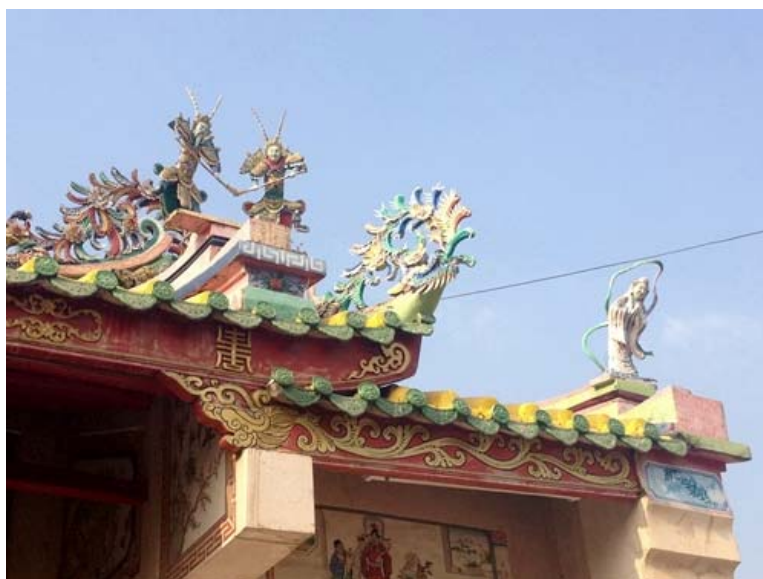
ภาพการประดับรูปสัตว์บนหลังคา

ชาวจีนมีความเชื่อในเรื่องของสิ่งอันเป็นมงคล หนึ่งในนั้นคือมังกร ซึ่งแสดงถึงความเป็นจีนได้อย่างดี ชาวจีนถือมังกรว่าเป็นสัญลักษณ์แห่งความยุติธรรม พลังและอำนาจ รวมเข้ากับสีแดงที่แสดงถึงความเป็นมงคลอย่างยิ่ง เพราะเหตุนี้การประดับตกแต่งภายในหรือภายนอกของศาลเจ้าส่วนใหญ่จะใช้มังกรเป็นการตกแต่งมากเป็นอันดับต้นๆ