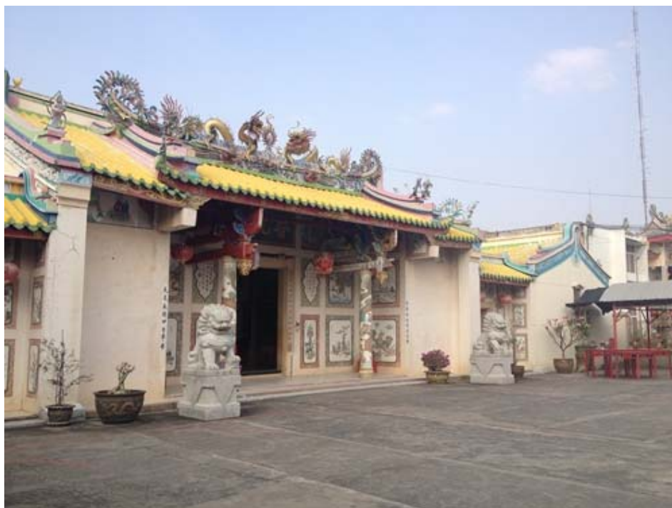
ภาพด้านหน้าของศาลเจ้า

ที่ตั้งของศาลเจ้าโพธิ์วงตั้งตั้งอยู่ที่ 169 ถนน 25 มกรา ตำบลพระปฐมเจดีย์ อำเภอเมือง นครปฐม ซึ่งตั้งอยู่ในเขตชุมชนของชาวจีนแต้จิ๋ว ศาลเจ้าโพธิ์วงตั้งมีประวัติที่ไม่ค่อยชัดเจนนัก มีเพียงหลักฐานที่ไม่เป็นลายลักษณ์อักษรเป็นการเล่ากันปากต่อปาก ผู้ศึกษาวิจัยได้ทำการสอบถามจากทางผู้ดูแลศาลเจ้า ทราบว่าศาลเจ้านี้ได้มีการปลูกสร้างมาเป็นระยะเวลานานมากแล้ว ก่อนที่จะมีหมู่บ้านชุมชนของชาวจีนแต้จิ๋วมาอาศัยอยู่ในย่านนี้ ซึ่งรวมระยะเวลาที่สร้างได้ประมาณ 140ปี ถือเป็นศาลเจ้าที่เก่าแก่ที่สุดในย่านนี้ ผู้คนที่อาศัยอยู่ในแถบศาลเจ้านั้นได้มาขอเช่าที่ของศาลเจ้าอาศัยอยู่ ทำให้ที่แถวย่านที่เป็นที่ตั้งของศาลเจ้านั้นมีชาวจีนมาอาศัยอยู่กันอย่างหนาแน่นอยู่กันเป็นชุมชน