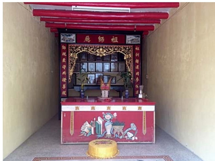
ผู้ปฏิบัติธรรมที่ล่วงลับไปแล้ว