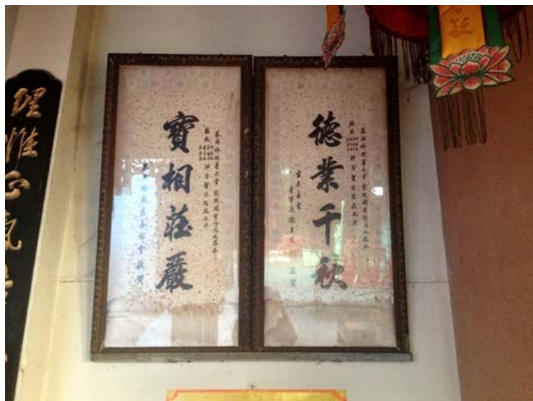
ภาพป้ายอักษรคำโคลงคู่ภายในศาลเจ้าโพธิ์วันตั้ง

ทั้งนี้ยังพบว่าในศาลเจ้ายังมีป้ายอักษรคำโคลงคู่ นับว่าเป็นกวีนิพนธ์ชนิดหนึ่งของจีน ส่วนมากกวีเป็นบทกวี 2 ประโยคคู่กันที่แฝงไปด้วยความหมายที่ลึกซึ้งและไพเราะ คำโคลงคู่ส่วนมากจะบรรยายทิวทัศน์ ประวัติความเป็นมาหรืออาจเป็นข้อความสวดดีความดีของเทพเจ้าที่ตั้งบูชาในศาลเจ้านั้นก็ได้ คำโคลงคู่กันจะประกอบด้วยตัวอักษรจีน 2 แถว แต่ละแถวจะมีตัวอักษรคู่กันและมีการสัมผัสอักษรกัน นอกจากนี้ยังพบว่ามีจารึกลงบนระฆังและกลอง ข้อความที่จารึกนั้นมักกล่าวถึงความเป็นมาของการสร้างระฆังหรือกลอง ผู้ที่บริจาคและเวลาก่อสร้าง