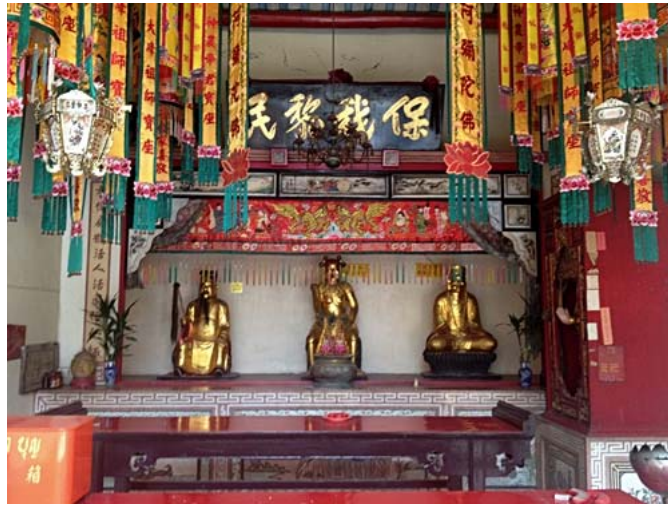
ศาลเทพเจ้าหมอยา เทพเจ้าการเกษตร และเทพเจ้าผู้โปรดวิญญาน ศาลเจ้าโพธิ์ง่วนตั้ง. ถ่ายเมื่อวันที่ 20 มกราคม 2557