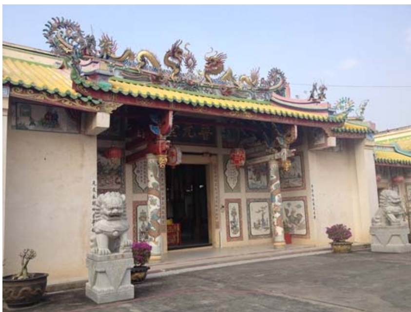
ภาพด้านหน้าของศาลเจ้าโพรงวังตั้ง

รูปแบบอาคารศาลเจ้ามีลักษณะเป็นอาคารทรงตรง ลักษณะหลังคามีลักษณะตัดตรงปูด้วยกระเบื้อง ด้านบนของหลังคาประดับด้วยปูนปั้นรูปมังกรคู่หันหน้าเข้าหากัน เหนือประตูมีป้ายตัวอักษรเขียนว่าโพรงวังตั้ง ที่แปลว่าศาลเจ้าทั่วไป หลังคาภายนอกเป็นรูปแบบสถาปัตยกรรมจีน จะเห็นได้จากมีรูปปั้นมังกร หงส์ ซึ่งเป็นการตกแต่งด้วยศิลปะแบบจีนทั้งสิ้น ลักษณะของหลังคานั้นในหนังสือตำนานวัดและเทพเจ้าจีนทางแถวเอเชียันั้น วัดส่วนใหญ่ได้ถูกก่อสร้างขึ้นโดยได้รับแบบอย่างมาจากวัดทางภาคใต้ของจีน อีกทั้งการวางแผนก่อสร้างมีความคล้ายคลึงกันหลายอย่าง เช่น รูปทรงของหลังคา การประดับตกแต่งของหลัง การแกะสลักสันแนวของหลังคา และแนวของมุมที่ลาดเอียง