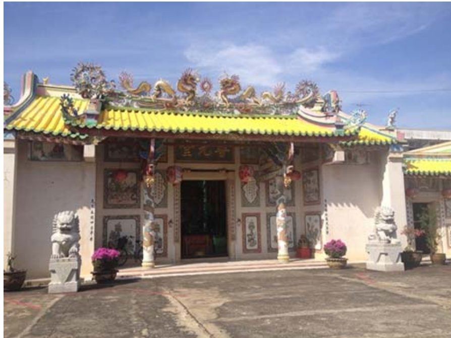
ภาพด้านหน้าของศาลเจ้าโพธิ์วงตั้ง