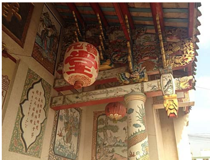
ลวดลายของการตกแต่งคานเสา

ภาพต้นไม้มงคลบนฝาผนังของด้านหน้าศาลเจ้า เป็นภาพดอกไม้ ต้นไม้ต่างๆที่สื่อความหมายในทางที่ดี ตกแต่งอยู่ตามฝาผนัง ต้นเสา คาน หลังคาและประตูบานพับต่างๆ