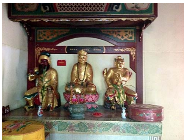
เทพเจ้ากวนอู เทพเจ้าอั้งป้วย และเทพเจ้าตุแลคุ้มครองศาสนา