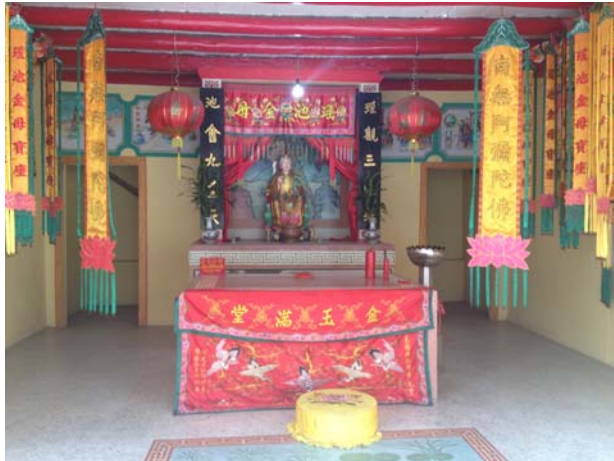
อริยะเทวีแดนสระทิพย์

ที่มา นางสาวชนิตา เมธาสิทธิพงษ์. ศาลเจ้าโพธิ์ง่วนตั้ง. ถ่ายเมื่อวันที่ 20 มกราคม 2557