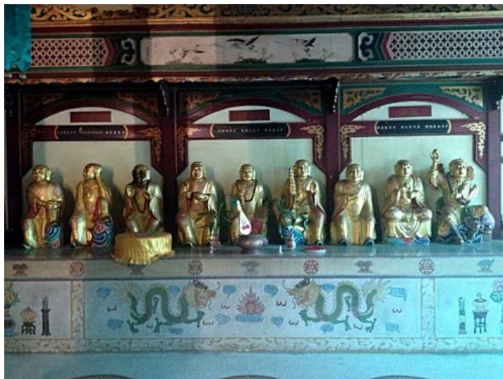
ภาพ18อรหันต์ทางด้านขวาของเทพองค์ประธาน

ที่มา นางสาวธนิดา เมธาสิทธิพงศ์. ศาลเจ้าโพธิ์ง่วนตั้ง. ถ่ายเมื่อวันที่ 20 มกราคม 2557