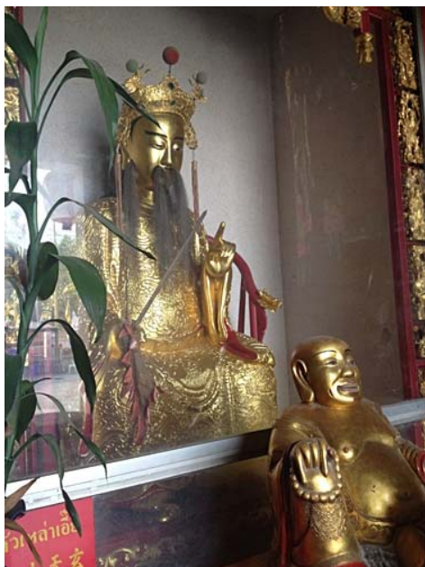
ภาพศาลมหาเทพ (เจ้าพ่อเสือ)

เดินถัดเข้ามาจากประตูจะพบกับศาลมหาเทพหรือศาลเจ้าพ่อเสืออยู่หน้าประตูทางเข้า ทางขวามือเป็นที่บริจาคเงินทำบุญและห้องรับรองแขก ส่วนทางด้านซ้ายมือจะเป็นห้องรับรองแขก ถัดจากศาลเจ้าพ่อเสือเข้ามาจะเบี่ยงทางเดินด้านใน ด้านหลังของศาลเจ้าพ่อเสือเป็นศาลพระสกันทโพธิสัตว์ หรืออีกชื่อหนึ่งว่าพระเวทโพธิสัตว์ ซึ่งเป็นเทพที่มีหน้าที่เฝ้าอารักขาพระพุทธศาสนา ด้วยเหตุนี้ภายในวัดทางพุทธศาสนาฝ่ายมหายานนั้น วิหารต้นจะอยู่เบื้องหน้า ภายในนั้นจะมีองค์พระเมตไตรยโพธิสัตว์เป็นองค์ประธาน และด้านหลังจะประทับยืนด้วยพระโพธิสัตว์องค์หนึ่งนั่นคือพระสกันทโพธิสัตว์ หรือพระเวทโพธิสัตว์นั่นเอง