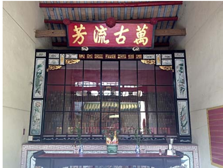
เก็บแผ่นป้ายวิญญาณจารึกบรรพบุรุษ

เมื่อเดินผ่านประตูแปดเหลี่ยมเข้ามา ก็จะพบกับอาคารหลังที่สามซึ่งแบ่งออกเป็น 5 ห้องใหญ่ๆ ห้องแรกจะเป็นที่เก็บแผ่นป้ายวิญญาณจารึกบรรพชนที่ล่วงลับไปแล้ว จะนำแผ่นป้ายชื่อจารึกมาเกี่ยวไว้ที่นี่ ถัดมาจะเป็นห้องของผู้ปฏิบัติธรรมที่ล่วงลับไปแล้ว ห้องต่อมาเป็นศาลของอริยะ เทวีแดนสระทิพย์