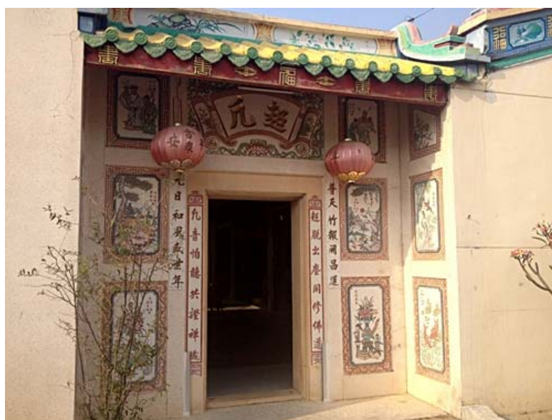
ภาพประตูข้างด้านขวามือของศาลเจ้า