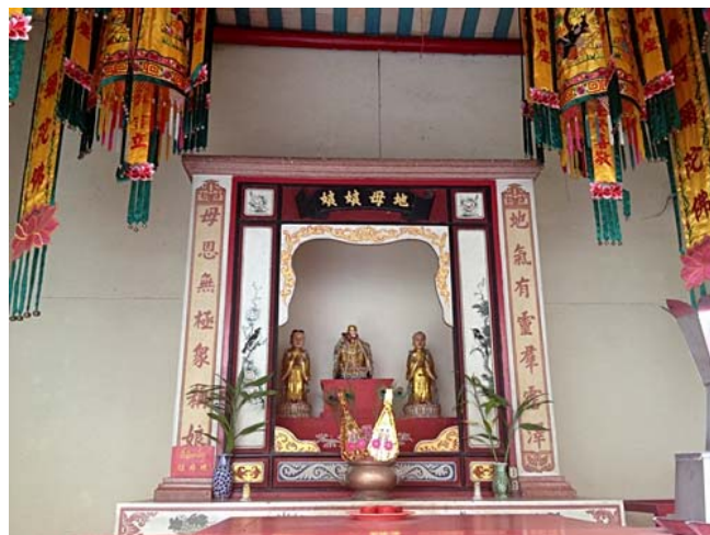
พระแม่ธรณี