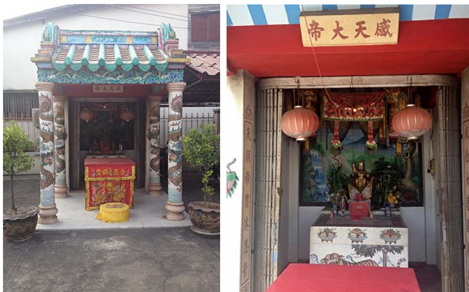
ศาลแปะกงเจ้าที่

ด้านนอกศาลเจ้าจะมีศาลเจ้าแปะกงเจ้าที่อยู่ด้านซ้ายของศาลเจ้า และแท่นบูชาฟ้าดินอยู่ทางด้านขวาเกือบถึงประตูทางออกของศาลเจ้า