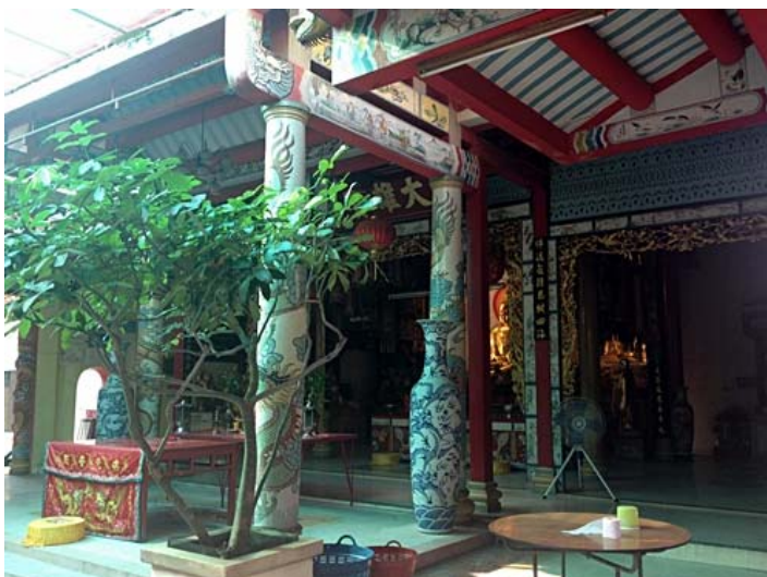
บริเวณด้านข้างระเบียงทางเดิน ศาลเจ้าโพธิ์ง้วนต้ง. ถ่ายเมื่อ วันที่ 20 มกราคม 2557