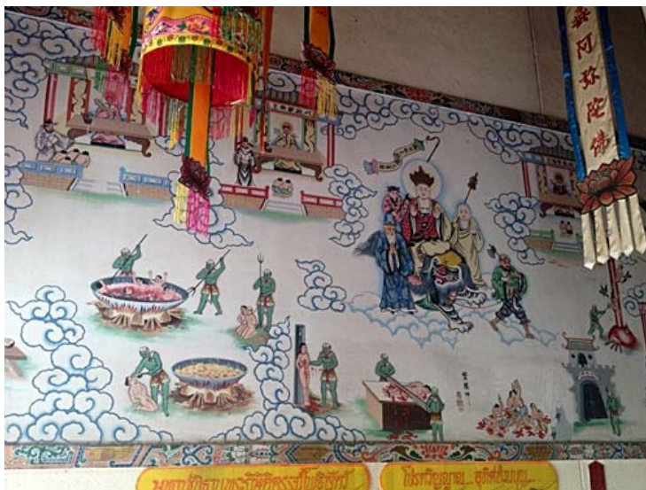
ภาพวาดจิตรกรรมเรื่องราวในนรกบนฝาผนัง

ภาพการลงโทษในนรกสำหรับความผิดลักษณะต่างๆซึ่งเป็นความเชื่อทางศาสนาพุทธ ทำให้ผู้พบเห็นเกิดความเกรงกลัวต่อบาป ภาพเหล่านี้จะถูกวาดอยู่ตามฝาผนัง ประตูบานพับ เป็นต้น