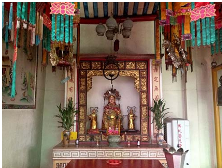
ศาลเจ้าแม่เบ็กไฟร