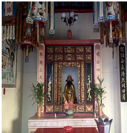
ศาลเจ้าพ่อหลักเมือง