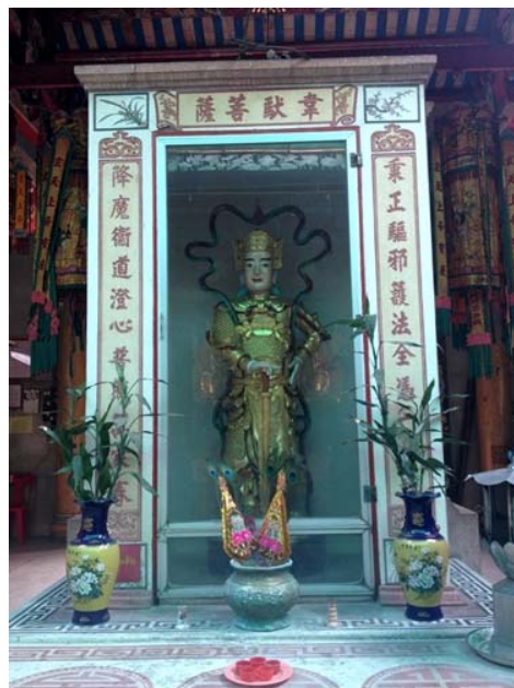
ภาพพระสกันทโพธิสัตว์ (พระเวทโพธิสัตว์)