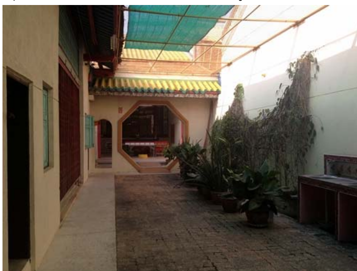
บริเวณทางเดินด้านข้างของอาคารเทพองค์ประธาน

ภายในอาคารหลังที่สองนี้นอกจากเป็นที่ประดิษฐานของเทพองค์ประธานแล้ว ยังมีการตกแต่งด้วยโคมแดง เจียนมงคลต่างๆ เพื่อเสริมความเป็นสิริมงคล และเพื่อความสวยงามภายในศาลเจ้า นอกจากนี้ยังมีภาพจิตรกรรมฝาผนังทั้งหมดในบริเวณนี้ที่จะเป็นเรื่องราวของเทพเจ้าของลัทธิเต๋า เช่น สัตว์ศักดิ์สิทธิ์ในตำนานของจีน ในส่วนของเพดานอาคารหลังนี้วาดเป็นลวดลายของเมฆ เพื่อแสดงถึงอาณาจักรของเทพเจ้าบนสวรรค์ ถัดมาด้านข้างอาคารนี้จะมีทางเดินทอดยาวไปถึงอาคารด้านหลังสุดของศาลเจ้า เมื่อเดินออกมาจะพบประตูแปดเหลี่ยม