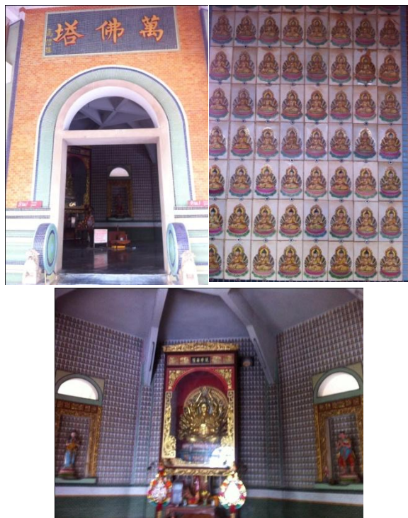
ภาพที่ 1 เจดีย์ชั้นที่ 1 ในวัดถ้ำเขาน้อย

ชั้นที่ 1 ผนังภายนอกประดับด้วยกระเบื้องโมเสก (mosaic) เจาะผนังเป็นซุ้มประตูโค้ง หน้าซุ้มประตูตกแต่งด้วยตุ๊กตาหินรูปสิงห์เหนือช่องซุ้มประตูมีป้ายเขียนด้วยอักษรภาษาจีน (ภาพที่ 1) ผนังภายในประดับด้วยกระเบื้องดินเผาบุรูปพระพุทธรูปปางมารวิชัยลงสี ภายในบรรจุรูปปั้นพระโพธิสัตว์กวนอิมพันมือ และมีการเจาะซุ้มหน้าต่าง 2 ซุ้มซึ่งบรรจุรูปปั้นเทพตามความเชื่อของจีน