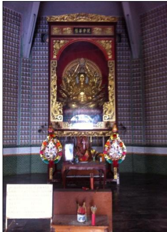
ภาพที่9 พระโพธิสัตว์กวนอิม (อวโลกิเตศวร)

ที่มา: สวรรรยา ใจชาญสุขกิจ. วัดถ้ำเขาน้อย จังหวัดกาญจนบุรี.ถ่ายวันที่ 28 กรกฎาคม 2556.