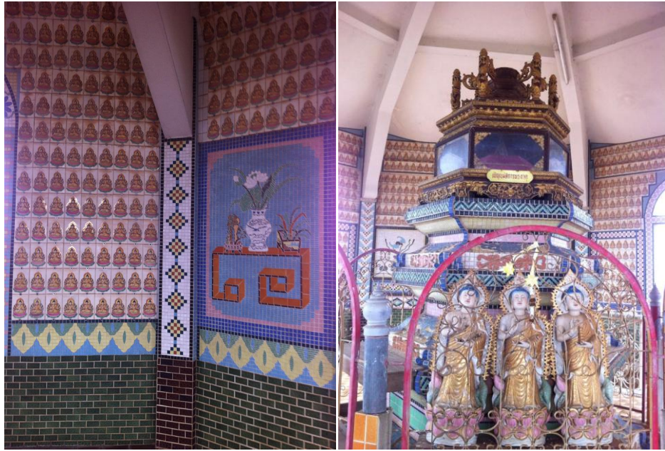
ภาพที่ 7 เจดีย์ชั้นที่ 7 ในวัดถ้ำเขาน้อย