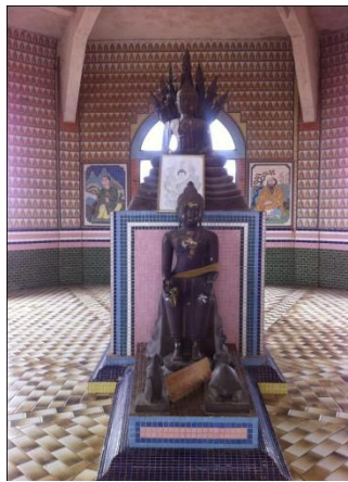
ภาพที่10 พระพุทธรูปปางนาคปรกและป่าเลไลยก์