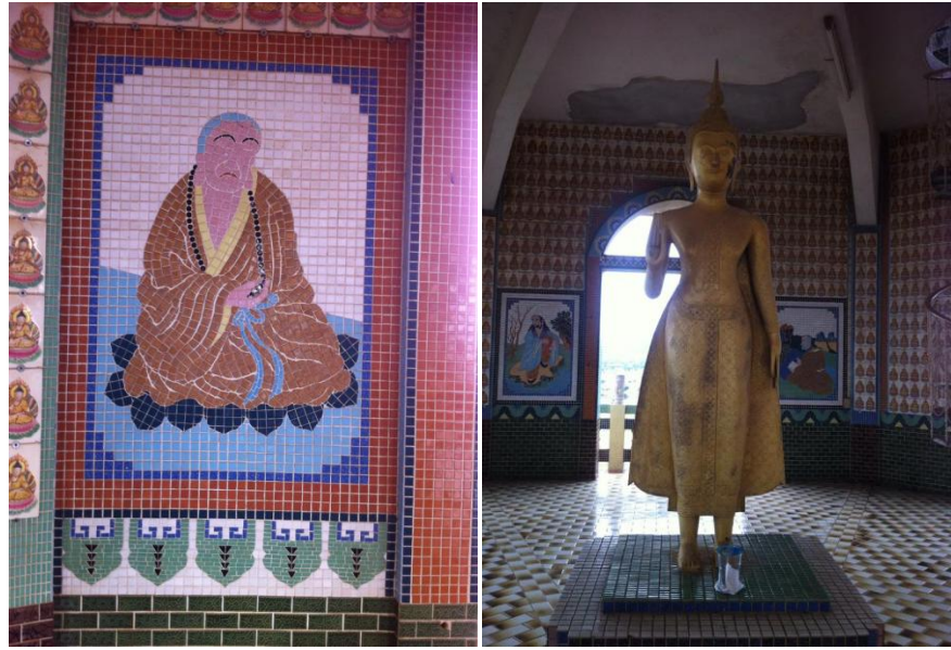
ภาพที่ 5 เจดีย์ชั้นที่ 5 ในวัดถ้ำเขาน้อย