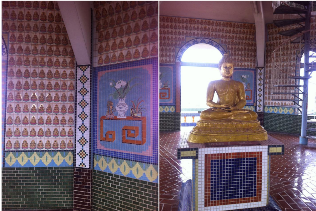
ภาพที่ 6 เจดีย์ชั้นที่ 6 ในวัดถ้ำเขาน้อย