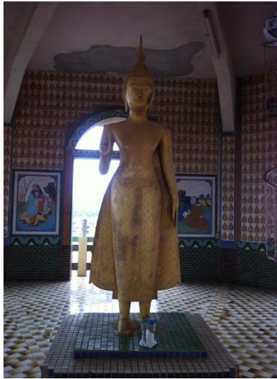
ภาพที่13 พระพุทธรูปปางประทานอภัย

ที่มา: ศววรรษยา ใจชาญสุขกิจ. วัดถ้ำเขาน้อย จังหวัดกาญจนบุรี.ถ่ายวันที่ 28 กรกฎาคม 2556.