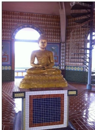
ภาพที่14 พระพุทธรูปปางสมาธิ