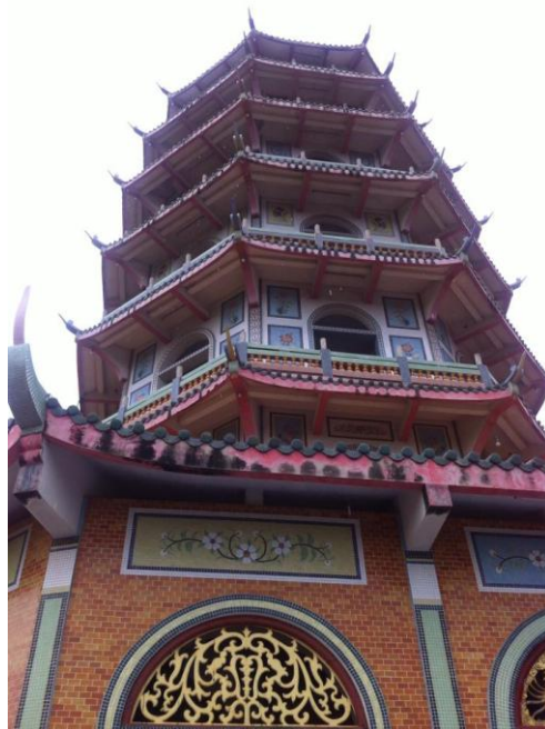
ภาพที่8 เจดีย์จีน 7 ชั้น ในวัดถ้ำเขาน้อย

ลักษณะสถาปัตยกรรมและการตกแต่ง จากโครงสร้าง การตกแต่ง และการจัดวางรูปปั้น และพระพุทธรูปของเจดีย์ 7 ชั้น ในวัดถ้ำเขาน้อย จังหวัดกาญจนบุรีที่กล่าวมาข้างต้นมาเปรียบเทียบกับเจดีย์จีน (塔:Tǎ) ซึ่งเป็นสถาปัตยกรรมดั้งเดิมของจีน พบว่าโครงสร้างของเจดีย์ 7 ชั้นในวัดถ้ำเขาน้อย จังหวัดกาญจนบุรีมีรูปทรงของหลังคาเป็นรูปแปดเหลี่ยมและเป็นชายคาแบบไล่ระดับ อีกทั้งมีส่วนของผนังที่เปิดบางส่วนเช่นเดียวกับเจดีย์จีนในสมัยศตวรรษที่ 5-10 (ภาพที่8)