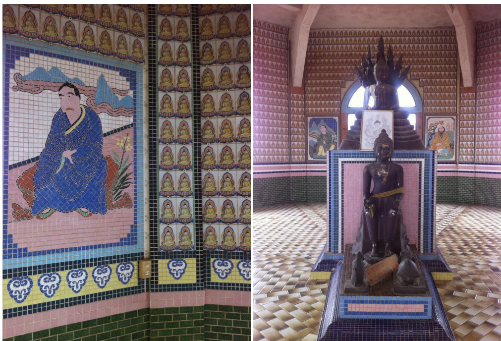
ภาพที่ 2 เจดีย์ชั้นที่ 2 ในวัดถ้ำเขาน้อย

ชั้นที่ 2 ผนังซุ้มประตูโค้ง 2 ด้าน และซุ้มหน้าต่างโค้งทั้ง 2 ด้าน ประดับด้วยกระเบื้องโมเสครูปดอกไม้ภายในกรอบสี่เหลี่ยมสีฟ้าด้านละ 4 รูป ผนังประดับกระเบื้องสีขาว ผนังภายในประดับด้วยกระเบื้องดินเผาปูนดำรูปพระพุทธเจ้าปางมารวิชัยลงสี ข้างซุ้มประตูทั้ง 2 ด้าน ประดับด้วยโมเสกรูปนักปราชญ์จีนในกรอบสี่เหลี่ยม ภายในบรรจุพระพุทธรูปสำริดปางนาคปรก และพระพุทธรูปสำริดปางป่าเลไลยก์ พระหัตถ์ซ้ายขวาวางคว่ำบนพระชานุ พระหัตถ์ขวาวางหงายบนพระชานุ มีรูปช้างหมอบใช้วงจับกระบองน้ำ และ อีกด้านหนึ่งมีลึงถือรวงผึ้งถวย