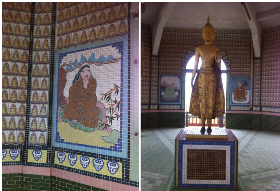
ภาพที่3 เจดีย์ชั้นที่ 3 ในวัดถ้ำเขาน้อย