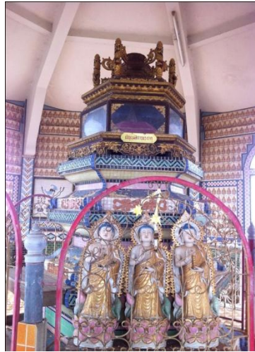
ภาพที่15 พระบรมสารีริกธาตุ

ที่มา: ศวรรยา ใจชาญสุขกิจ. วัดถ้ำเขาน้อย จังหวัดกาญจนบุรี.ถ่ายวันที่ 28 กรกฎาคม 2556.