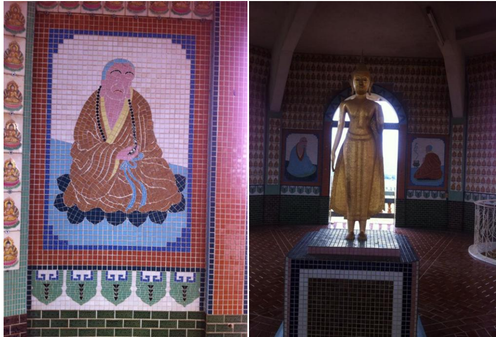
ภาพที่4 เจดีย์ชั้นที่ 4 ในวัดถ้ำเขาน้อย