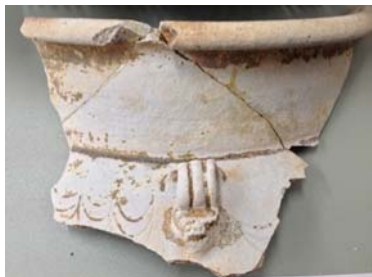
ภาพที่ 24 เศษภาชนะสมัยราชวงศ์ถัง ตามณฑลเจ้อเจียงจากหลุมขุดตรวจที่ 22 ที่มา : ซาดา ทนสิงห์, ชั้นที่ 1, ถ่ายวันที่ 12 ธันวาคม 2553, ปัจจุบันอยู่ที่สำนักศิลปากรที่ 5 ปราจีนบุรี

กลุ่มที่ 3 เนื้อดินมีทั้งเนื้อดินธรรมดาสีเทาปนขาว และเนื้อดินแกร่งสีเทา เนื้อละเอียด เคลือบสีเขียว มะกอกปนเหลืองทั้งด้านในและด้านนอก เคลือบบางแตกราน หลุดร่อนง่าย มีลักษณะใกล้เคียงกับ ภาพที่ 4 ภาชนะจากเตาหีบเหยาในมณฑลเจ้อเจียง ราชวงศ์ถัง