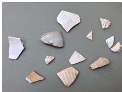
ภาพที่ 25 เศษภาชนะสมัยราชวงศ์หยวน เตาอันตี มณฑลฝูเจี้ยนจากหลุมขุดตรวจที่ 105 ที่มา : ซาดา ทนสิงห์, ถ่ายวันที่ 12 ธันวาคม 2553, ปัจจุบันอยู่ที่สำนักศิลปากรที่ 5 ปราจีนบุรี

กลุ่มที่ 7 เนื้อดินแกร่ง สีขาวละเอียด เคลือบสีเขียวอ่อน เนื้อเคลือบบางใส แตกราน เคลือบทั้งด้านในด้านนอก มีลักษณะใกล้เคียงกับ ภาพที่ 12 ภาชนะจากเตาอันตี มณฑลฝูเจี้ยน ราชวงศ์หยวน