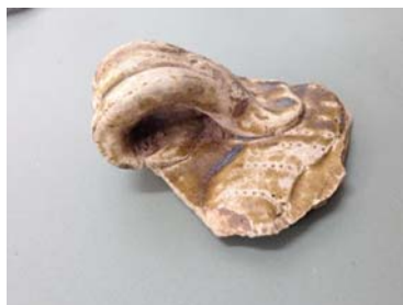
ภาพที่ 23 เศษภาชนะสมัยราชวงศ์ถัง ตามฉลบทลเหอหนาน จากหลุมขุดตรวจที่ 22 ที่มา : ธาดา ทนสิงห์, ชั้นที่ 2, ถ่ายวันที่ 12 ธันวาคม 2553, ปัจจุบันอยู่ที่สำนักศิลปากรที่ 5 ปราจีนบุรี

กลุ่มที่ 2 เนื้อดินสีส้มถึงสีเทานวล เนื้อละเอียดและแกร่งเคลือบสีมะกอกเข้มจนถึงน้ำตาลดำ เคลือบทั้งด้านในและด้านนอก ซึ่งมีทั้งเคลือบบาง และแตรกรานหลุดร่อนง่าย บางบริเวณเนื่องจากการแตกระกอนของน้ำยาเคลือบ มีลักษณะใกล้เคียงกับ ภาพที่ 2 เศษภาชนะเตาฉางชา มณฑลเหอหนาน ราชวงศ์ถัง