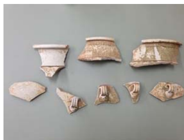
ภาพที่ 22 เศษภาชนะสมัยราชวงศ์ถัง ตามฉลบทลเหอหนาน จากหลุมขุดตรวจที่ 22 ที่มา : ธาดา ทนสิงห์, ชั้นที่ 4, ถ่ายวันที่ 12 ธันวาคม 2553, ปัจจุบันอยู่ที่สำนักศิลปากรที่ 5 ปราจีนบุรี

กลุ่มที่ 1 ภาชนะขนาดใหญ่ เนื้อดินค่อนข้างหยาบ สีออกเหลือง เนื้อแกร่งหนา สำหรับภาชนะขนาดเล็กมีเนื้อละเอียด สีส้มเขียว เนื้อเคลือบมีทั้งแบบเคลือบใสมันและเคลือบด้าน แตรกราน เคลือบทั้งด้านในและด้านนอก เว้นบริเวณของปากด้านบนและส่วนก้นด้านนอก เนื้อเคลือบหลุดกะเทาะบางส่วน มีลักษณะใกล้เคียงกับ ภาพที่ 1 ตามฉลบทลเหอหนาน ราชวงศ์ถัง