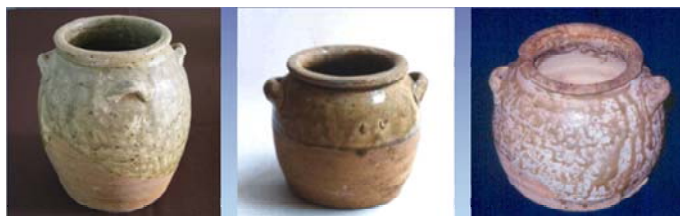
ภาพที่ 1 ภาพที่ 2

ภาพที่ 1 และ 2 เป็นภาพภาชนะจากเตาฉางซาง และเตาฉางซา มณฑลเหอหนาน