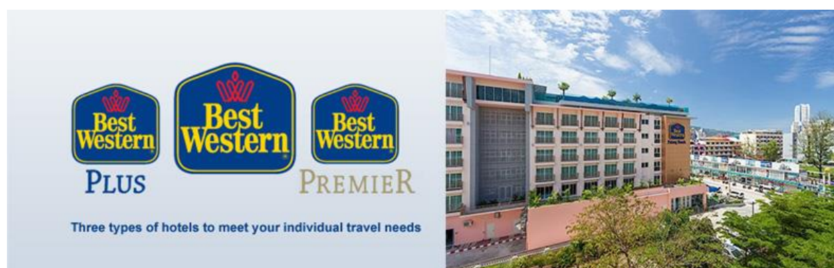
ภาพที่ 4.6 Best Western