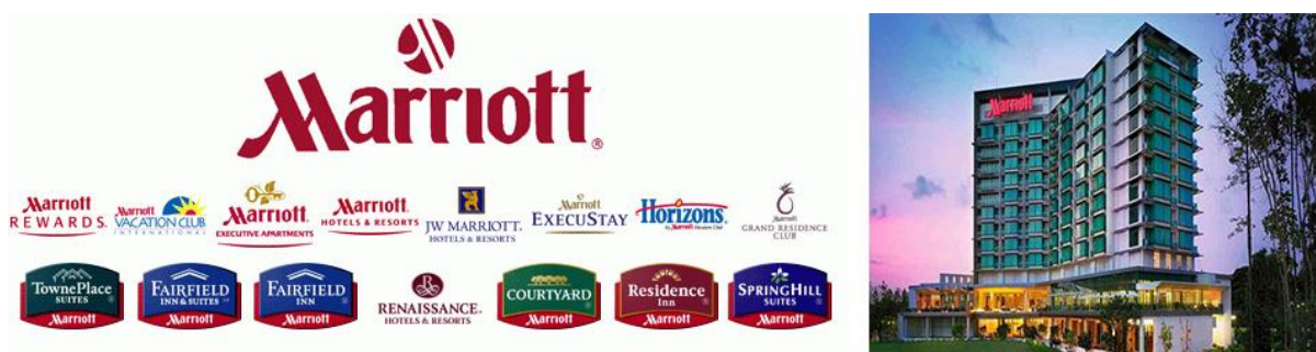
ภาพที่ 4.4 Marriott International