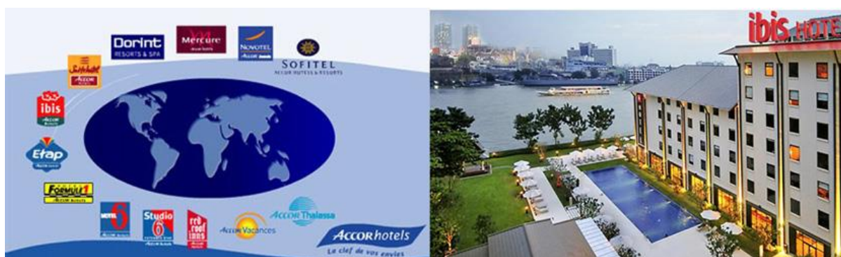
ภาพที่ 4.2 Accor