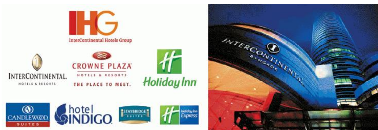
ภาพที่ 4.1 InterContinental Hotels Group (IHG)