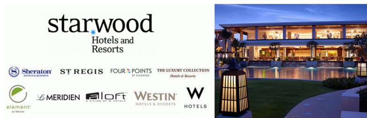
ภาพที่ 4.7 Starwood Hotels and Resorts