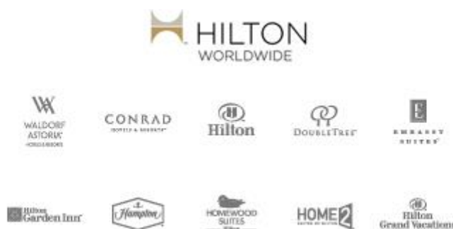
ภาพที่ 4.3 Hilton Hotels Corporation