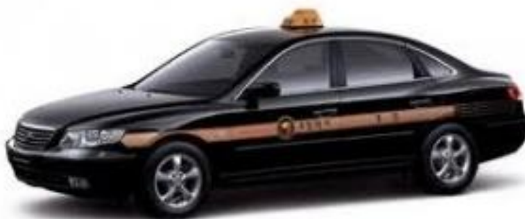
ภาพที่ 4.12 Mobeom Taxi