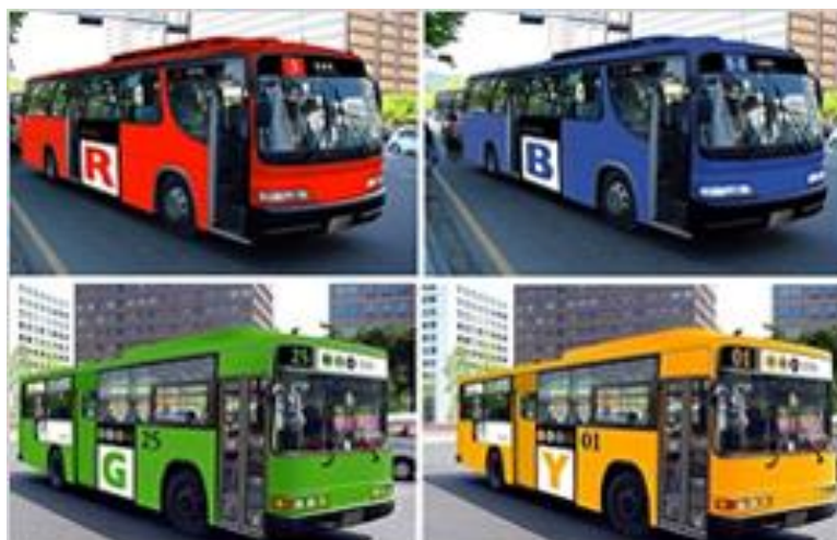
ภาพที่ 4.10 รถโดยสารประจำทางภายในเมือง

ที่มา : http://www.educatepark.com/เรียนต่อเกาหลี/การคมนาคมในเกาหลี/เข้าถึงเมื่อวันที่ 10 เมษายน 2558