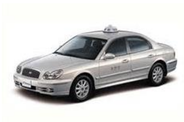
ภาพที่ 4.11 รถแท็กซี่ธรรมดา