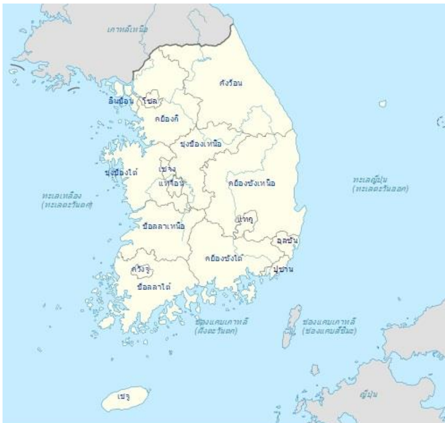
ภาพที่ 2.1 แสดงที่ตั้งของประเทศเกาหลีใต้

ที่มา: http://th.wikipedia.org/wiki/ประเทศเกาหลีใต้ เข้าถึงเมื่อวันที่ 4 พฤศจิกายน 2557