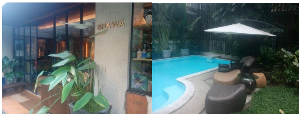
ภาพที่ 17 Bhawa spa

-ขาดแคลนบุคลากรที่มีความสามารถด้านภาษาญี่ปุ่นและขาดคนที่เข้าใจถึงเรื่องวัฒนธรรมและมารยาทของคนญี่ปุ่น