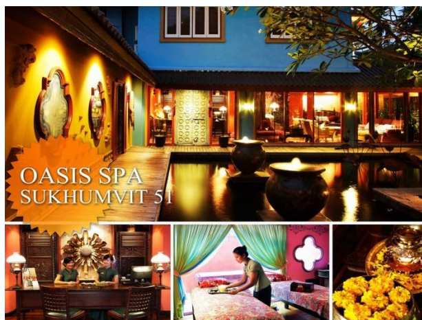
ภาพที่ 3 Oasis spa