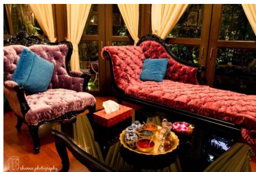
ภาพที่ 10 ห้องรับรองแขก

ดิวานามาสซาจแอนด์สปา (Divana Massage & Spa) ครองพื้นที่ในหัวใจของลูกค้าไปหลายต่อหลายราย บ้างถึงกับเหมาว่าที่นี่เป็นเหมือนบ้าน เพื่อนสนิท บางทีก็แวะมานั่งคุยด้วยความลืมหืม ซึ่งก็ไม่น่าแปลก เพราะเมื่อได้นั่งลงท่ามกลางบรรยากาศอบอุ่น กิ่งเย็นของที่แห่งนี้ ช่างผ่อนคลาย สบายหัวใจเสียจริงๆ ที่นี่ยังมอบความเป็นส่วนตัวให้เต็มที่ ด้วยการบริการแขกครั้งละน้อยราย จะนวดหน้า นวดตัว นวดเท้า นวดไทย นวดอโรมาเทอราพี ชัดตัว พอกโคลน แช่น้ำนม หรือ แช่สมุนไพร ก็ล้วนแต่ทำได้ในห้องเดี่ยว หรือห้องคู่ที่มีพื้นที่ให้ความผ่อนคลายกระจายได้เต็มเหยียด Divana Massage & Spa เปิดให้สุดใจความผ่อนคลายทุกวัน