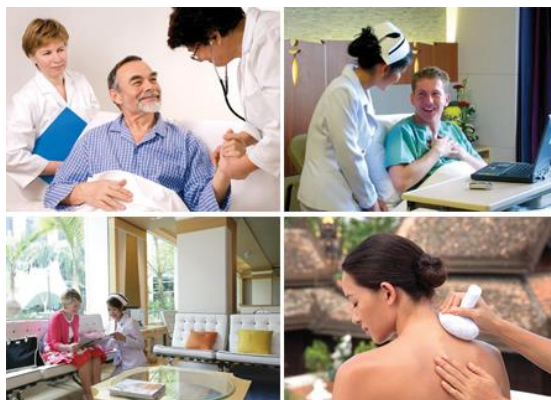
ภาพที่ 12 สุขภาพและความงาม