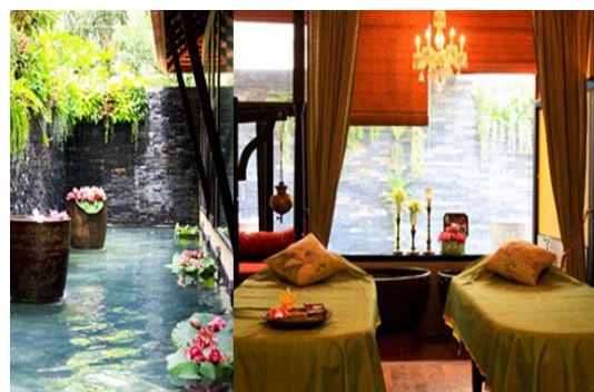
ภาพที่ 11 ห้องสปา