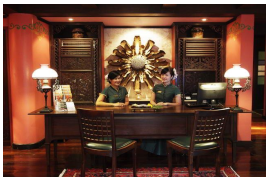
ภาพที่ 4 ฝ่ายต้อนรับ

โอเอซิสสปาเป็นสปาอัตลักษณ์ล้านนาไทย ในบรรยากาศแห่งความเขียวขจี แวดล้อมด้วยสวน และน้ำตกกลางเมืองใหญ่ ตกแต่งงดงามสร้างความสุขใจแก่ผู้มาเยือน นับตั้งแต่วันที่ก่อตั้งเมื่อปี 2546 ถึงปัจจุบัน โอเอซิสสปาสร้างประสบการณ์สปาที่ประทับใจให้ทั้งลูกค้าชาวไทยและต่างชาติจากประเทศต่างๆ ทั่วโลกมากกว่า 80,000 ท่าน โดยมีผลการสำรวจความพึงพอใจของลูกค้าที่ใช้บริการ (Customer Satisfaction Index Survey) พบว่า 98.7% ของลูกค้าที่ใช้บริการทั้งหมดมีความพึงพอใจในการบริการของโอเอซิสสปา