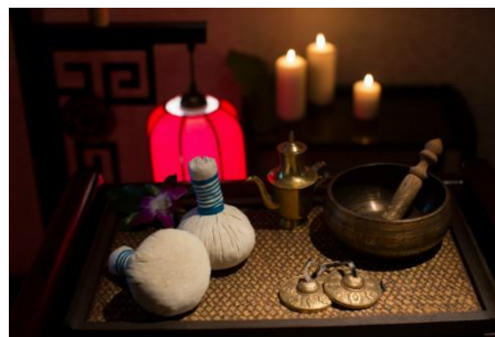
ภาพที่ 8 อุปกรณ์นวดประคบ