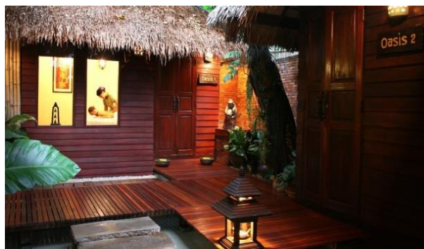
ภาพที่ 5 บริเวณห้องรับรองบริการ