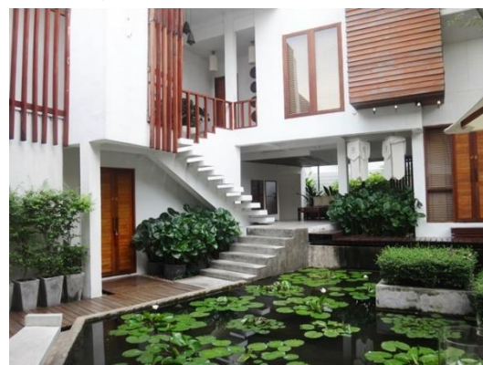
ภาพที่ 16 Oasis spa สาขาสุขุมวิท