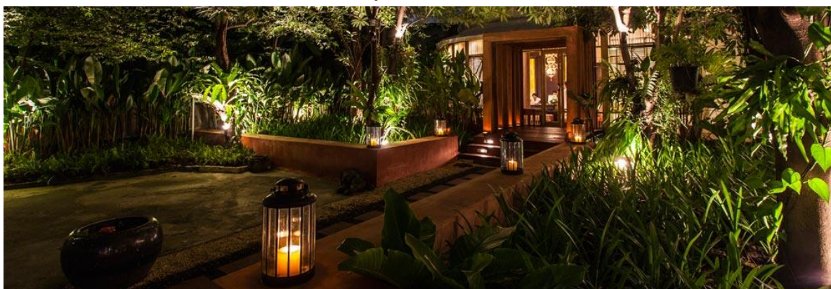
ภาพที่ 18 Divana spa and massage

- ด้านการท่องเที่ยวต่อชาวญี่ปุ่น ธุรกิจสปาที่สร้างรายได้ได้มากเพราะสปาเมืองไทยมีราคาถูกและได้รับการบริการที่ดีกว่าประเทศอื่นๆ นักท่องเที่ยวจึงเข้ามาใช้บริการสปาที่เมืองไทยกันเป็นจำนวนมากแต่ควรพัฒนาความสามารถเรื่องภาษาญี่ปุ่น ใช้นักล่ากรที่เข้าใจทั้งวัฒนธรรม และภาษาเพื่อจัดปัญหาการสื่อสารและความไม่เข้าใจทางวัฒนธรรม ความรู้สึกรักนิกคิตของชาวญี่ปุ่น