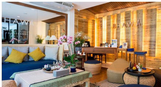
ภาพที่ 6 Bhawa spa