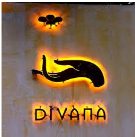
ภาพที่ 9 Divana spa and massage

ที่มา : http://nicolekiss.blogspot.com , (2015)