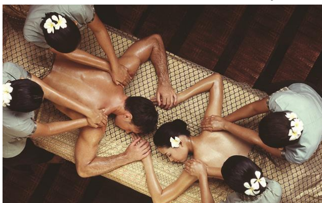
ภาพที่ 15 Oasis spa

ธุรกิจสปายังคงเติบโตได้ ถ้ามีบริการที่ดี ได้มาตรฐานสม่ำเสมอ และพัฒนาอย่างต่อเนื่อง เพราะในปัจจุบันสังคมเริ่มมีการให้ความสำคัญกับการดูแลสุขภาพและสังคมผู้สูงอายุที่จะเพิ่มขึ้นเรื่อยๆ ในอนาคต โดยการพัฒนาธุรกิจสปาในอนาคตมีองค์ประกอบ ดังนี้ การพัฒนาการให้บริการสปา กลยุทธ์ทางการตลาดเพื่อเพิ่มยอดขายสำหรับธุรกิจสปา และการพัฒนาบุคลากร เพื่อให้ธุรกิจสปาไทย ก้าวไกลสู่สากล สำหรับการพัฒนาต่อนักท่องเที่ยวชาวญี่ปุ่น นักท่องเที่ยวเข้ามาใช้บริการสปาที่เมืองไทยกันเป็นจำนวนมากเพราะมีราคาถูกและได้รับการบริการที่ดีกว่าประเทศอื่นๆ แต่ควรมีการพัฒนาความสามารถเรื่องภาษาญี่ปุ่น ใช้นวัตกรรมที่เข้าใจทั้งวัฒนธรรม และภาษาเพื่อจัดปัญหาการสื่อสารและความไม่เข้าใจทางวัฒนธรรม ความรู้สึนึกคิดของชาวญี่ปุ่น