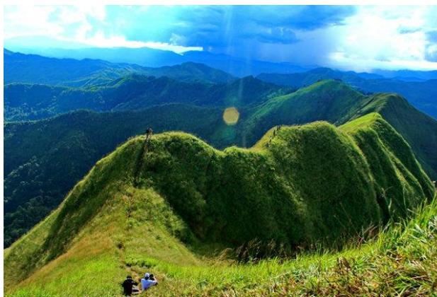
ภาพที่ 4.1 อุทยานเขาช้างเผือก

และจากผลการสัมภาษณ์เจ้าหน้าที่การท่องเที่ยวแห่งประเทศไทย สาขาจังหวัดกาญจนบุรี ได้ให้ข้อมูลว่า การท่องเที่ยวของประเทศไทย มีนโยบายหลัก ๆ ที่จะส่งเสริมการท่องเที่ยวโดยให้ความรู้อนุรักษ์ ไม่ให้เสื่อมโทรม พยายามให้นักท่องเที่ยวใส่ใจสิ่งแวดล้อม จะพยายามรณรงค์กับนักท่องเที่ยวให้มีความเป็นระเบียบ เคารพกฎเกณฑ์ของสถานที่ท่องเที่ยว และนโยบายของการท่องเที่ยวกาญจนบุรี ได้ประชาสัมพันธ์โดยเชิญชวนทางสื่ออินเทอร์เน็ต ทวี โทรทัศน์ สื่อท้องถิ่น ซึ่งภาพรวมของการท่องเที่ยวแห่งประเทศไทยคือ Dream Destination ได้สร้างความแปลกใหม่ให้แก่สถานที่ท่องเที่ยว Dream Destination ของเมืองกาญจนบุรี เช่น การให้ชมเขาช้างเผือก อุทยานทองผาภูมิให้ความรู้ชั้นชมธรรมชาติ และกิจกรรมผจญภัยต่าง ผู้คนให้ความสนใจมากขึ้น พื้นที่ซึ่งมีจำนวนจำกัด ด้วยความใส่ใจในการท่องเที่ยวของการท่องเที่ยวแห่งประเทศไทยจึงได้กำหนดจำนวนคนในแต่ละช่วงเวลาด้วย ปัจจุบันได้เกิดแหล่งท่องเที่ยวใหม่ ๆ ขึ้น เช่น รีสอร์ทท แพ ริมน้ำซึ่งได้รับความนิยมอย่างมาก ตอบสนองต่อจุดประสงค์ของนักท่องเที่ยวรุ่นใหม่ ที่เดินทางมาท่องเที่ยวเชิงนิเวศ