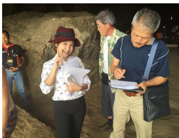
ภาพที่ 4.2 สัมภาษณ์ชาวญี่ปุ่นในถ้ำกระแซ ผู้วิจัย (2015)