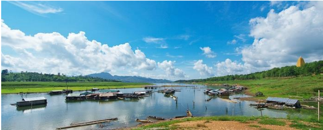
ภาพที่ 2.7 ทิวทัศน์อำเภอสังขละบุรี