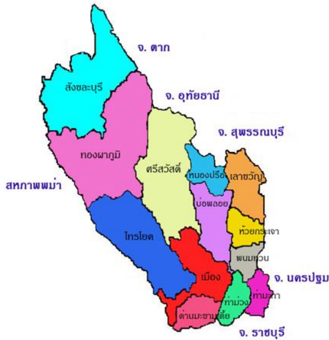
ภาพที่ 2.1 แผนที่จังหวัดกาญจนบุรี