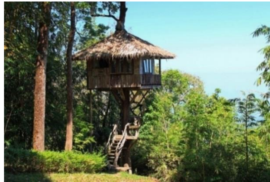
ภาพที่ 2.2 อุทยานแห่งชาติทองผาภูมิ

ที่ตั้ง : อำเภอทองผาภูมิ จังหวัดกาญจนบุรี 21110