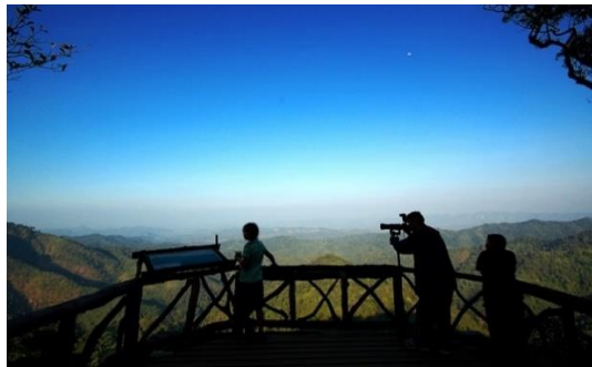
ภาพที่ 2.3 จุดชมวิวบนอุทยานแห่งชาติทองผาภูมิ