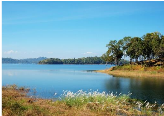
ภาพที่ 2.9 อุทยานแห่งชาติเขาแหลม

ที่ตั้ง : ปรางค์พล ทองผาภูมิ, กาญจนบุรี 71180