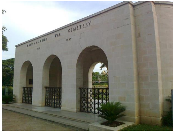
ภาพที่ 2.5 หน้าสุสานทหารสัมพันธมิตร