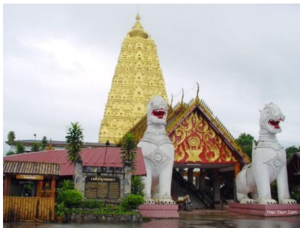
ภาพที่ 2.8 วัดวังกวีเวการาม

ที่ตั้ง : บ้านวังกะล่าง อำเภอสังขละบุรี จังหวัดกาญจนบุรี ใกล้กับชายแดนไทย-พม่า ห่างจากอำเภอมืองกาญจนบุรี ประมาณ 220 กิโลเมตร