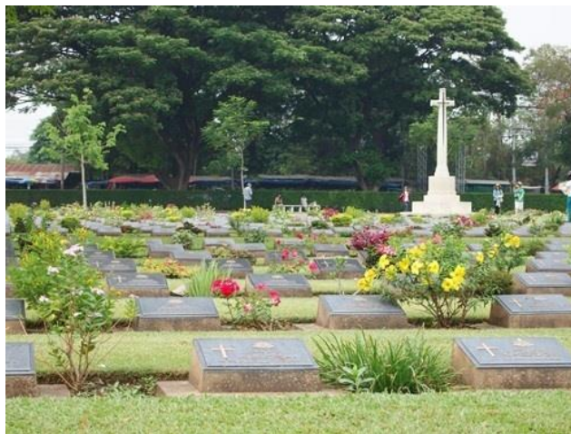
ภาพที่ 2.6 ภายในสุสานทหารสัมพันธมิตร