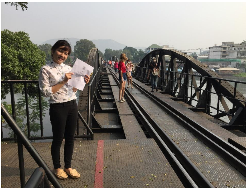
ภาพที่ 5.1 ทำการสำรวจนักท่องเที่ยวญี่ปุ่น ณ สะพานข้ามแม่น้ำแคว

2. การวิจัยนี้ ใช้แบบสอบถามนักท่องเที่ยวเพื่อสำรวจความพึงพอใจและสิ่งที่ต้องปรับปรุงแก้ไข แต่มีอุปสรรคคือนักท่องเที่ยวญี่ปุ่นไม่สามารถตอบข้อมูลในช่องรายได้ และควรสำรวจนักท่องเที่ยวชาติอื่นด้วย เพื่อส่งเสริมให้การท่องเที่ยวเชิงนิเวศ เกิดการพัฒนาที่หลากหลาย และกว้างขวางมากขึ้น