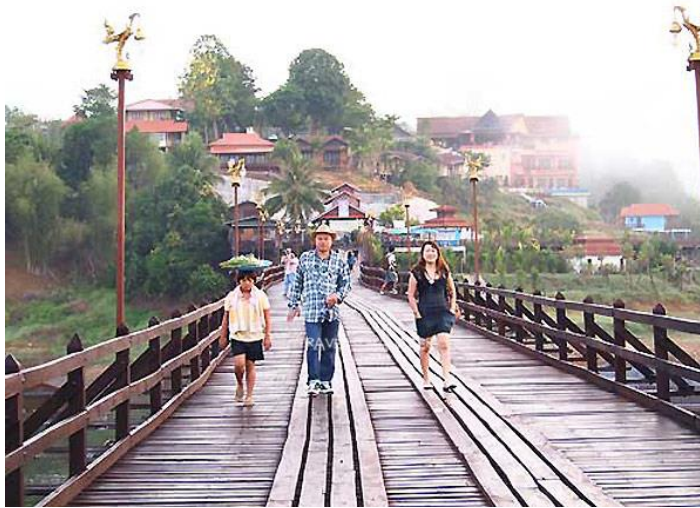
ภาพที่ 2.10 สะพานมอญที่สร้างใหม่

ที่อยู่: ตำบลหนองลู อำเภอสังขละบุรี จังหวัดกาญจนบุรี 71240