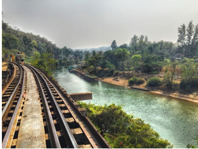
ภาพที่ 2.11 ถ้ำกระแซ