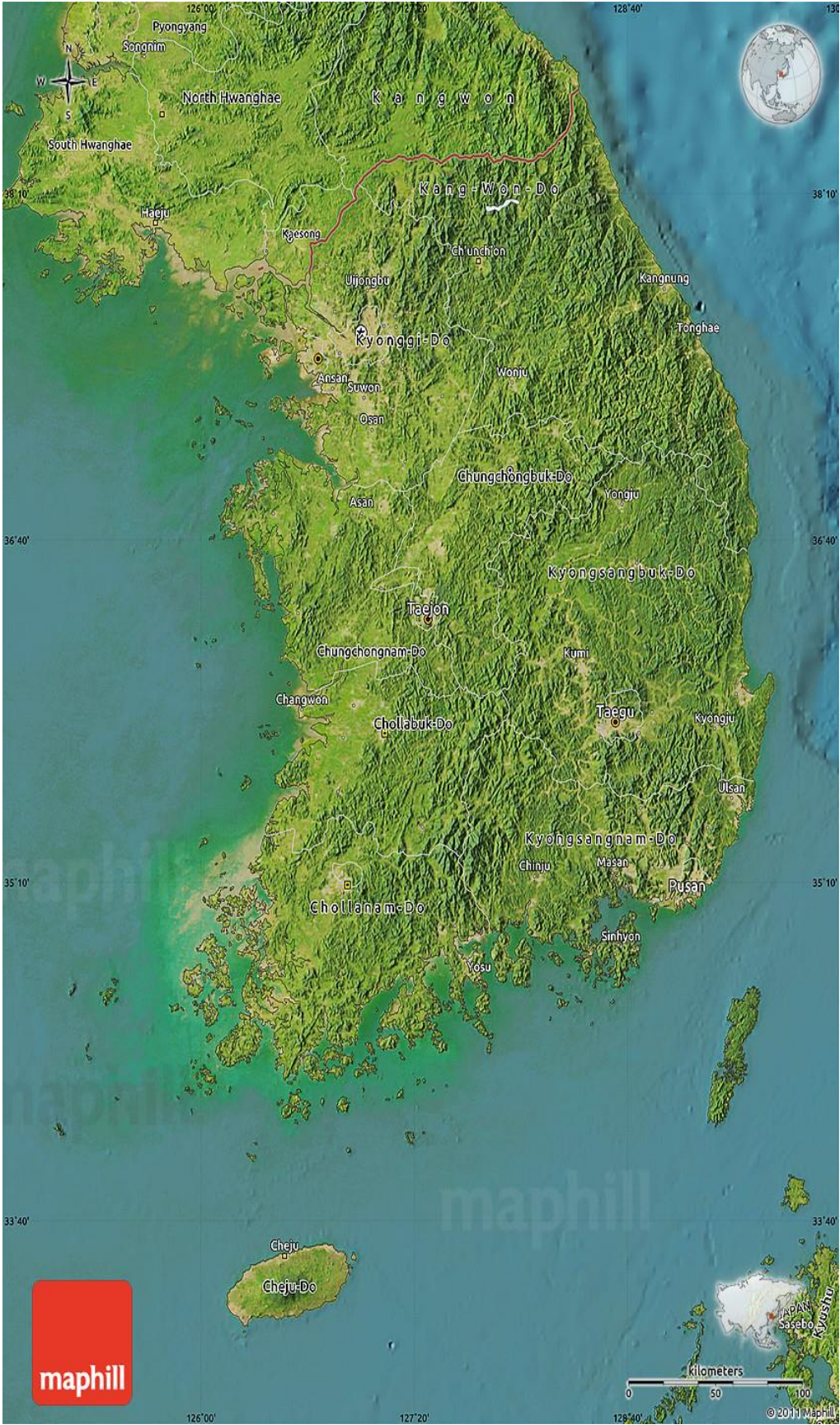
(ภูมิประเทศเกาหลีใต้)