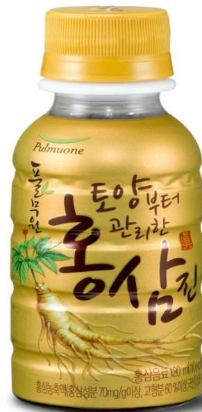
(รูปแบบผลิตภัณฑ์ไอสมเกาหลีแปรรูป)