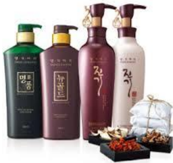
(รูปแบบผลิตภัณฑ์โสมเกาหลีแปรรูป)