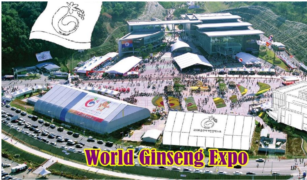
(เทศกาลโสมในเมืองคิมชานประเทศเกาหลีใต้)