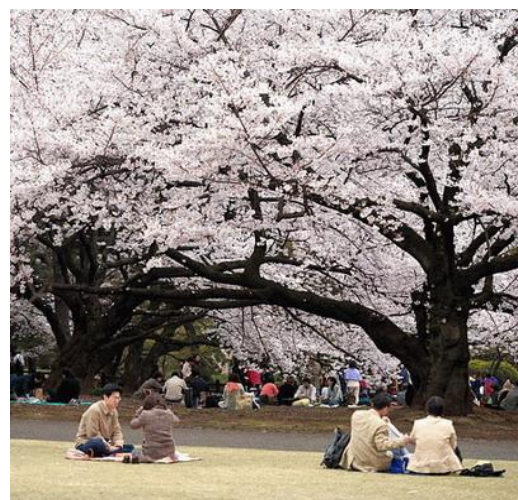
(ภาพบรรยากาศในฤดูกาล)