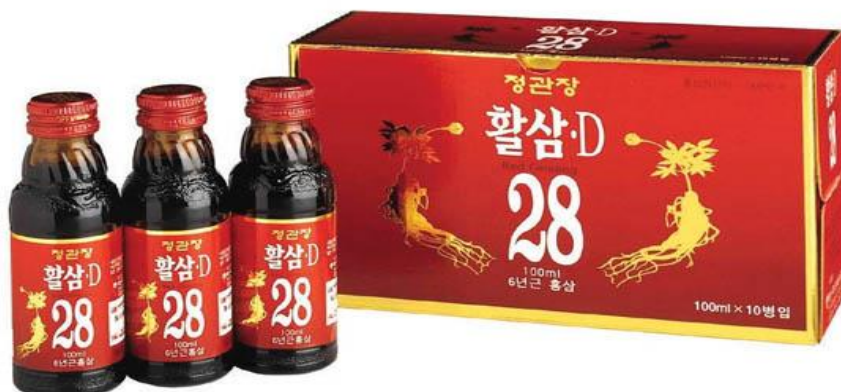
(รูปแบบผลิตภัณฑ์โสมเกาหลีแปรรูป)