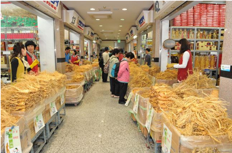
(ตลาดค้าโสมจังหวัดคิมชาน)