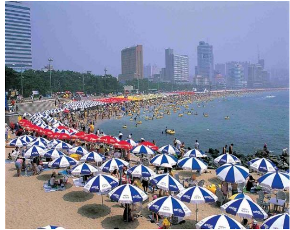
(ภาพบรรยากาศในฤดูกาล)