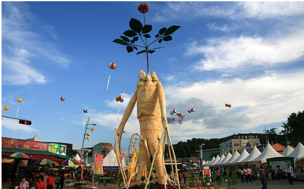
(เทศกาลโสมที่จังหวัดคิมชาน)