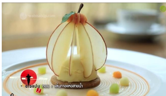
ภาพที่ 29 คริสตัลแอปเปิล