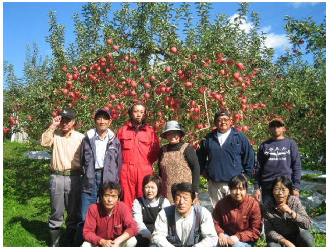
ภาพที่ 8 เกษตรกรผู้ประกอบการ Homestay เมือง Kuroishi