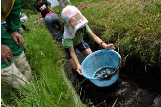
ภาพที่ 13 กิจกรรมช้อนปลาโตะโจ

2. อาโอโมริมีเทศกาลที่มีชื่อเสียงมากคือ เทศกาลเนบุตะ ซึ่งจัดขึ้นเป็นประจำทุกปี ระหว่างวันที่ 2-7 สิงหาคม เทศกาลเนบุตะเป็นเทศกาลที่ใหญ่เป็นอันดับ 3 ของญี่ปุ่น โดยทุกปีจะมีนักท่องเที่ยวกว่า 3 ล้านคนมาเที่ยวชมงานเทศกาลโคมไฟขนาดใหญ่รูปมนุษย์ที่จะปรากฏขึ้นในเวลากลางคืนประกอบกับเสียงขลุ่ยฮาเนโตะและการเต้นรำที่สนุกสนาน ซึ่งเทศกาลนี้จะจัดในช่วงฤดูร้อนของญี่ปุ่น