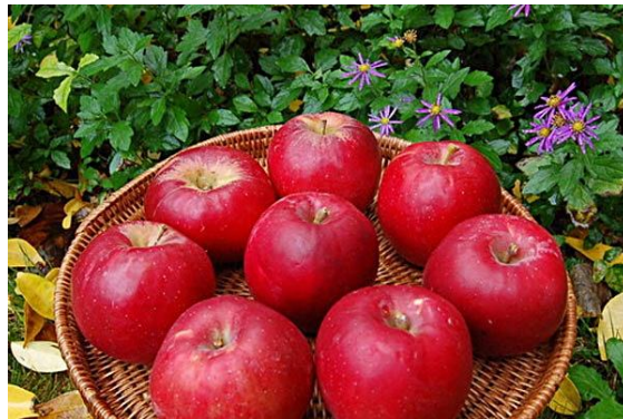
ภาพที่ 2 แอปเปิลพันธุ์โจนาธาน