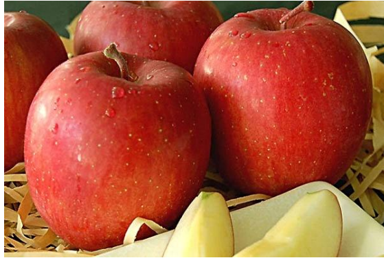
ภาพที่ 1 แอปเปิลพันธุ์ฟูจิ