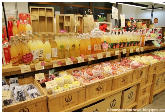
ภาพที่ 26 น้ำแอปเปิล