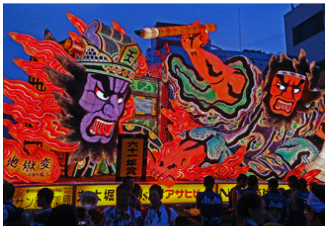
ภาพที่ 14 งานเทศกาลเนบุตะ

2. อาโอโมริมีเทศกาลที่มีชื่อเสียงมากคือ เทศกาลเนบุตะ ซึ่งจัดขึ้นเป็นประจำทุกปี ระหว่างวันที่ 2-7 สิงหาคม เทศกาลเนบุตะเป็นเทศกาลที่ใหญ่เป็นอันดับ 3 ของญี่ปุ่น โดยทุกปีจะมีนักท่องเที่ยวกว่า 3 ล้านคนมาเที่ยวชมงานเทศกาลโคมไฟขนาดใหญ่รูปมนุษย์ที่จะปรากฏขึ้นในเวลากลางคืนประกอบกับเสียงขลุ่ยฮาเนโตะและการเต้นรำที่สนุกสนาน ซึ่งเทศกาลนี้จะจัดในช่วงฤดูร้อนของญี่ปุ่น