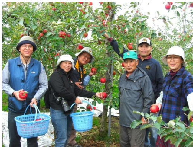
ภาพที่ 7 เกษตรกรผู้ประกอบกิจการHomestayเมือง Hirakawa