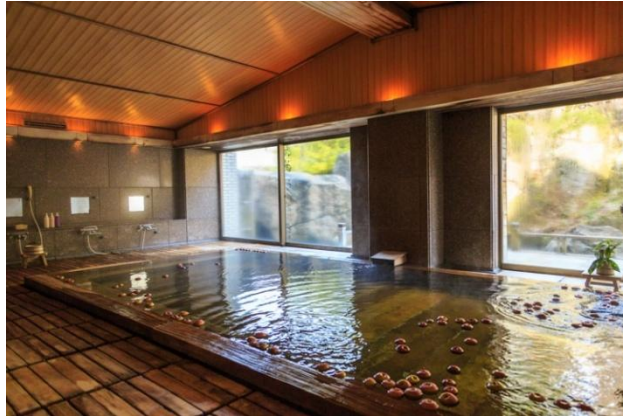
ภาพที่ 30 ออนเซนแอปเปิล