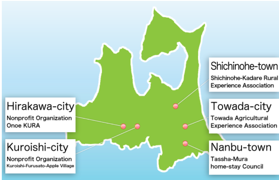
แผนที่ที่ 2 แสดงแหล่ง Homestay ของแต่ละเมืองในจังหวัดอาโอโมริ

กิจกรรมภายใน Homestay ในจังหวัดอาโอโมริมีจะแตกต่างกันไปตามเทศกาล ฤดูกาลและแผนการท่องเที่ยวของแต่ละหมู่บ้าน ดังนี้