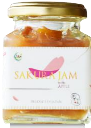
ภาพที่ 25 แยมแอปเปิล