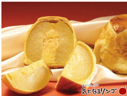
ภาพที่ 23 แอปเปิลพายคินินารูริงโกะ