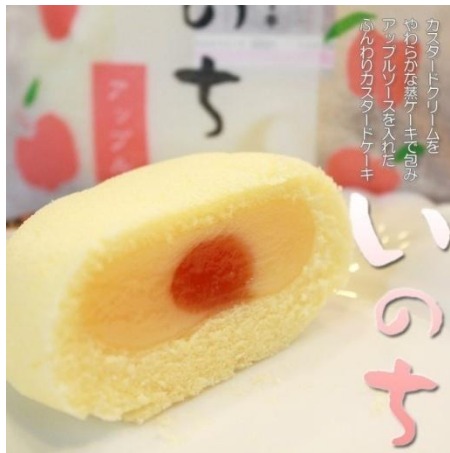
ภาพที่ 20 เค้กคัสตาร์ดสอดไส้ซอสแอปเปิล