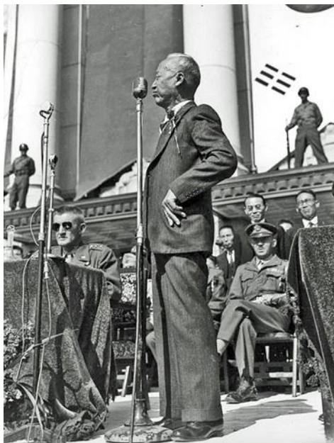
ภาพที่ 8 : ประธานาธิบดี อี ซึงมัน ขณะออกปราศรัยเลือกตั้ง