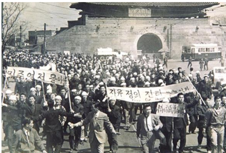
ภาพที่ 9 : ประชาชนรวมตัวประท้วงเพื่อขับไล่ ประธานาธิบดี อี ซึงมัน ใน ค.ศ.1960