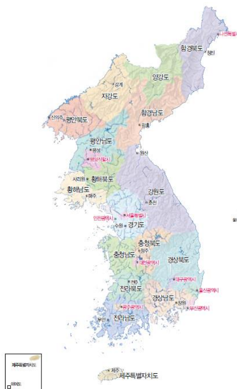
ภาพที่ 1 : คาบสมุทรเกาหลี