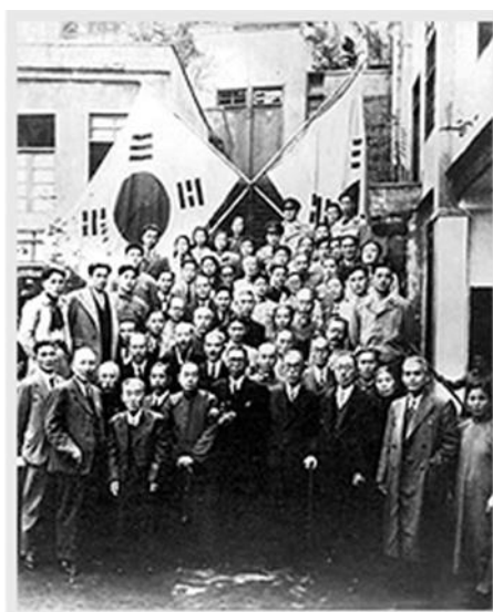
Key members standing in front of the KPG building(Chongqing) before Return to Korea(1945.11.3)

ที่มา : ◦ 승만 [ออนไลน์], เข้าถึงเมื่อ 29 เมษายน 2558. เข้าถึงจาก http://mpva.tistory.com/1685 .