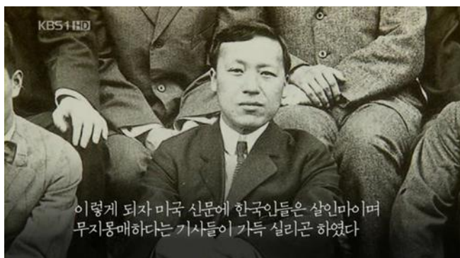
ภาพที่ 4 : ดร.อี ซึงมัน หนึ่งในหัวหน้าขบวนการกู้ชาติ