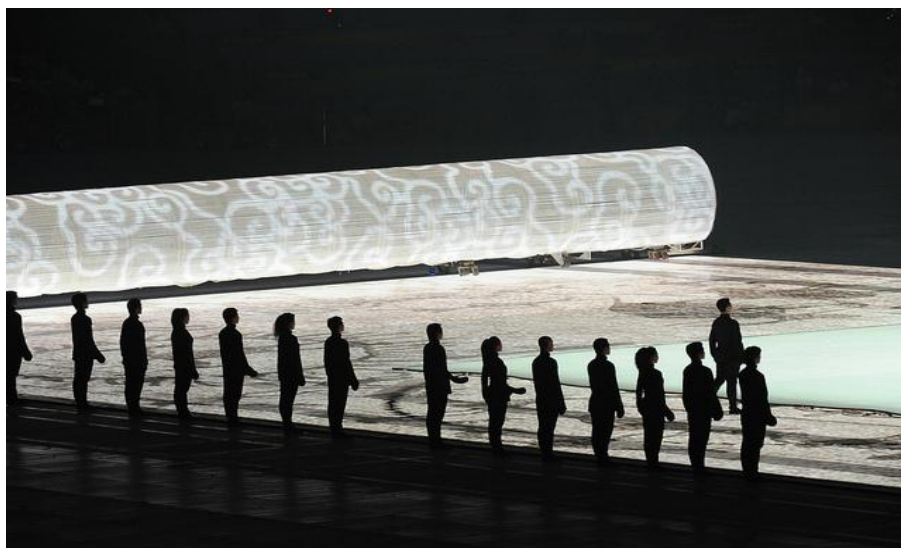
ภาพที่ 2 การแสดงชุด ม้วนกระดาษ