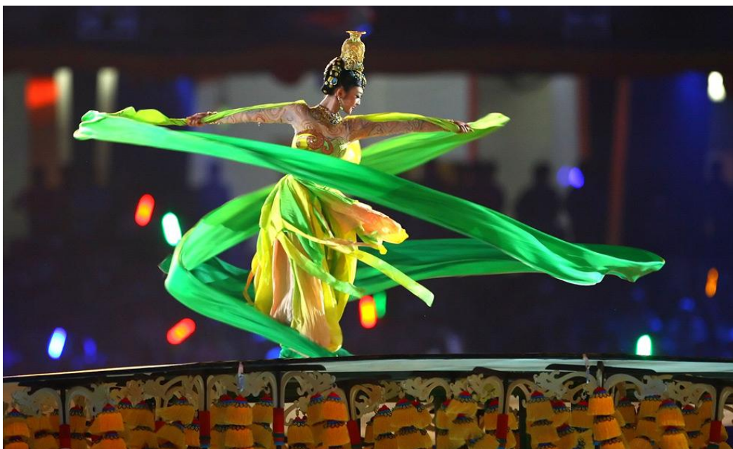
ภาพที่ 4 การแสดงชุด เส้นทางสายไหม