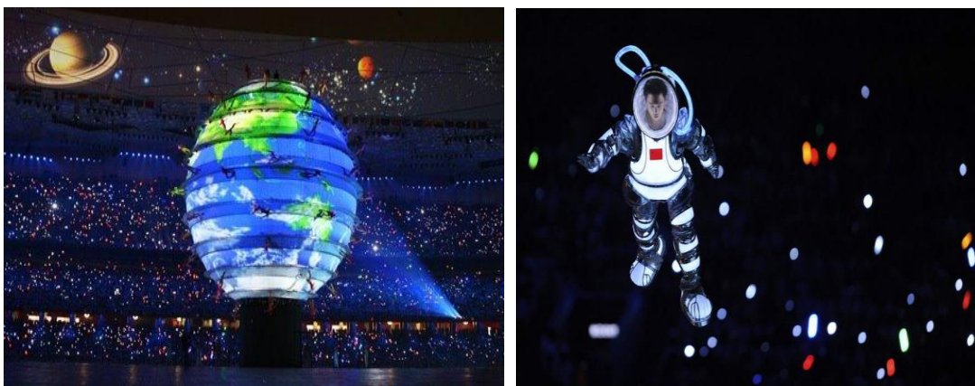
ภาพที่ 9 และ 10 การแสดงชุด ความฝัน