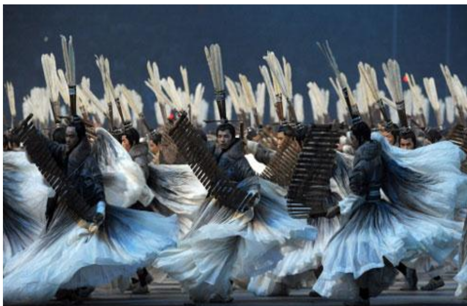
ภาพที่ 3 การแสดงชุด อักษรจีน

ที่มา: http://blog.sina.com.cn/s/blog_5c5ddf930100iutl.html (2010)