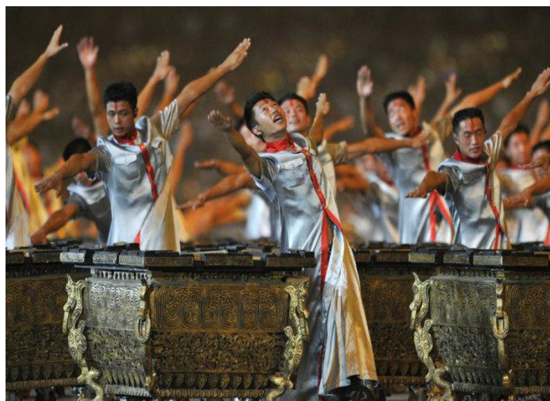
ภาพที่ 1 การแสดงกลองฟู