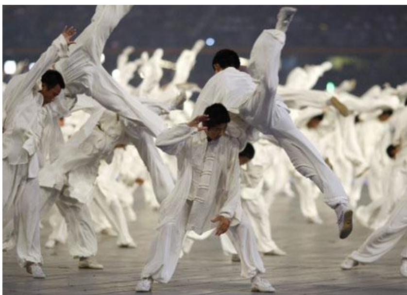
ภาพที่ 8 การแสดงชุด ธรรมชาติและโลก