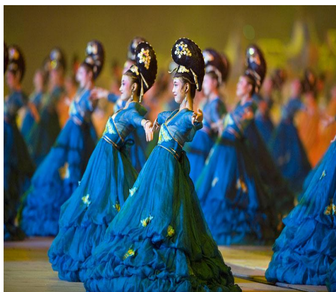
ภาพที่ 5 และ 6 การแสดงชุด คนตรีจีน