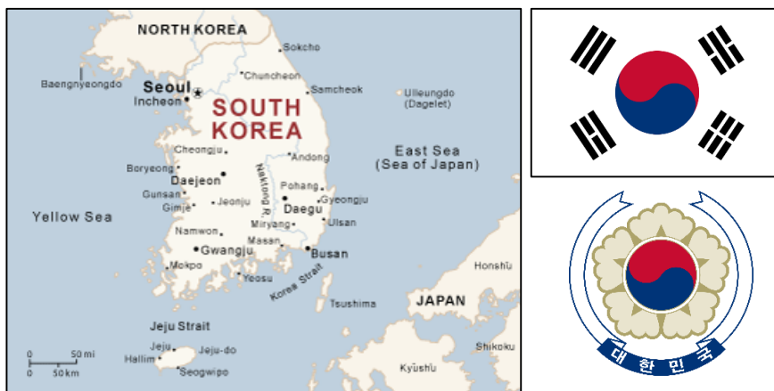
รูปที่ 1. แสดงแผนที่ที่ตั้ง ธงชาติ และสัญลักษณ์ประจำชาติของเกาหลีใต้

สาธารณรัฐเกาหลี (Republic of Korea) หรือรู้จักกันในนาม เกาหลีใต้ (South Korea) ชื่อภาษาเกาหลีคือ 대한민국 (แทฮันมินกุก) หรือเรียกสั้นๆว่า ใต้ (ฮันกุก) ตั้งอยู่ในทวีปเอเชียตะวันออก มีพรมแดนตอนเหนือติดกับประเทศเกาหลีเหนือ เมืองหลวงคือ กรุงโซล (Seoul) สังคมเกาหลีใต้มีความเป็นสังคมสมัยใหม่ (Modernization) และมีวัฒนธรรมที่หลากหลาย การเมืองการปกครองแบบประชาธิปไตย โดยมีประธานาธิบดีเป็นประมุขของประเทศ ซึ่ง พัค กึนฮเย (박근혜) ดำรงตำแหน่งประธานาธิบดีคนปัจจุบัน ด้านเศรษฐกิจเกาหลีใต้ถือว่าเป็นประเทศอุตสาหกรรมใหม่ที่พัฒนาแล้ว และมีเศรษฐกิจเจริญเติบโตแบบก้าวกระโดดจนได้รับสมญานามว่า “มหัศจรรย์แห่งแม่น้ำฮัน” (The Miracle on The Han River)