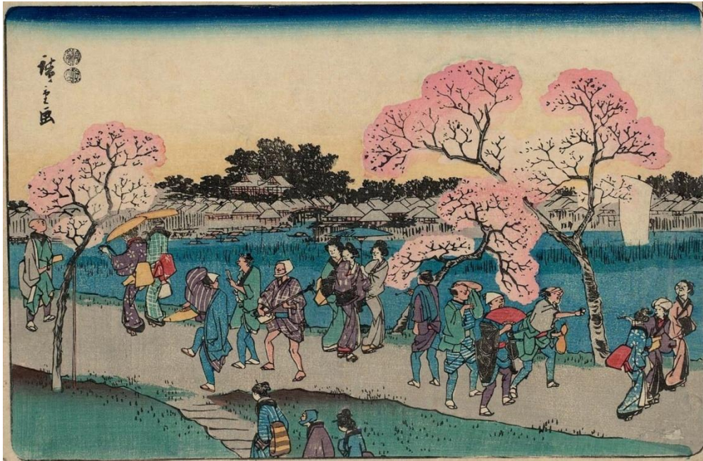
ภาพที่ 7 Cherry Blossom Viewing on the Sumida River Embankment