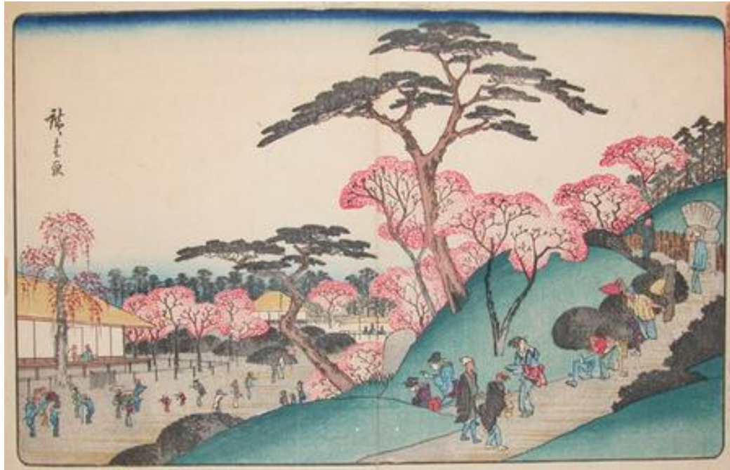
ภาพที่ 6 Spring at Nippori