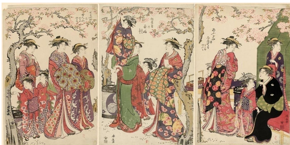
ภาพที่ 2 Courtesans Viewing Cherry Blossoms

หากนำสัญลักษณ์ของฤดูใบไม้ผลิมาวีเคราะห์ ภาพนี้มีสัญลักษณ์ที่สื่อถึงฤดูใบไม้ผลิคือดอกซากุระเนื่องจากซากุระเป็นดอกไม้ที่ผลิบานในช่วงฤดูเวลานี้และการที่ผู้คนนั่งชมดอกซากุระอยู่ใต้ต้นซากุระนั้นเป็นลักษณะของเทศกาลฮานามิหรือเทศกาลชมดอกซากุระที่มีปรากฏอยู่ในสัญลักษณ์ประเภทเทศกาล นอกจากนี้หากวิเคราะห์ตามสัญลักษณ์ประเภทสถานที่ที่มีชื่อเสียง เทือกเขาโกเท็นก็เป็นอีกหนึ่งสัญลักษณ์ของฤดูใบไม้ผลิเช่นกัน