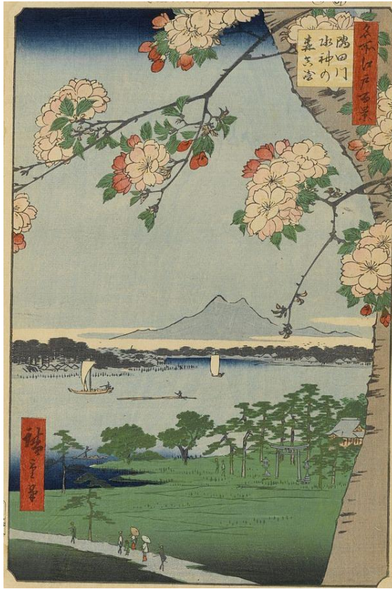
ภาพที่ 10 Suijin Shrine and Massaki on the Sumida River