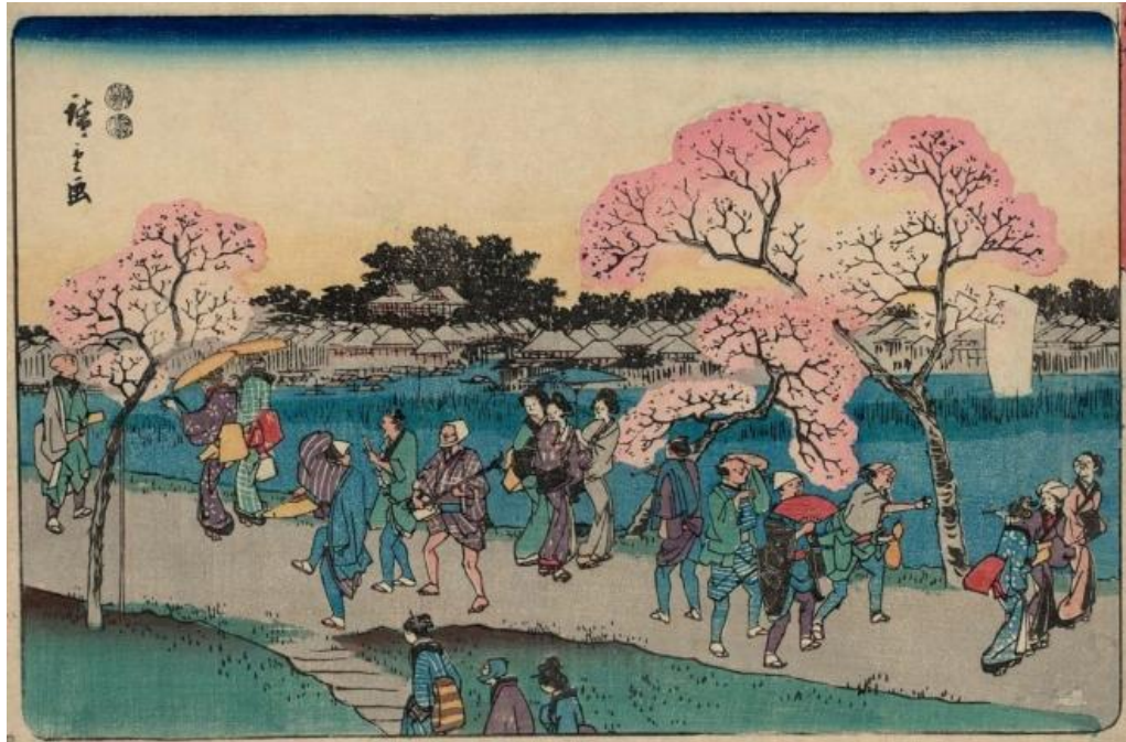
ภาพที่ 7 Cherry Blossom Viewing on the Sumida River Embankment