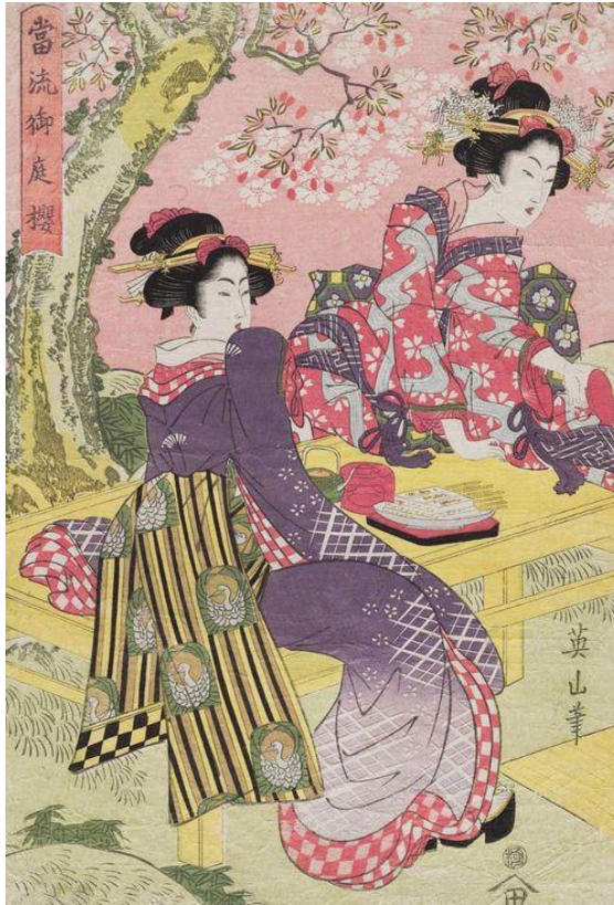
ภาพที่ 3 Cherry Blossom Viewing Party in a Japanese palace garden