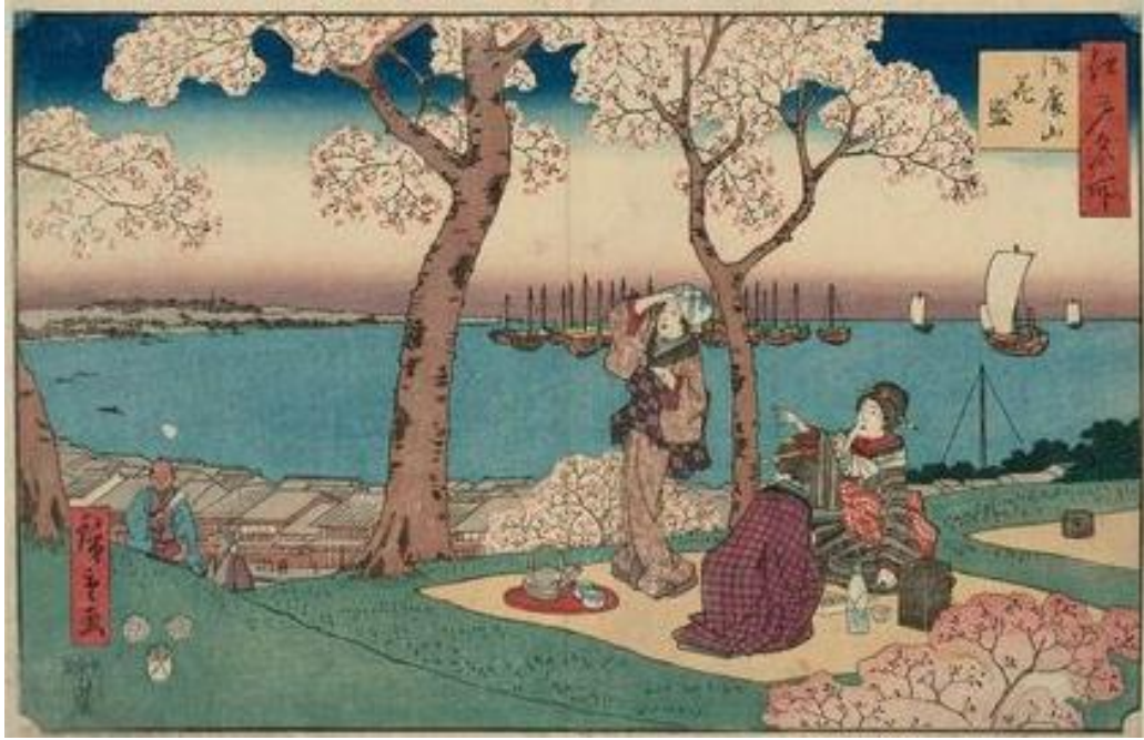
ภาพที่ 9 Cherry Blossom in full bloom along the Sumida River