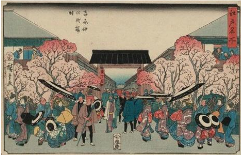
ภาพที่ 8 Cherry Blossom Time at Naka-no-cho in the Yoshiwara