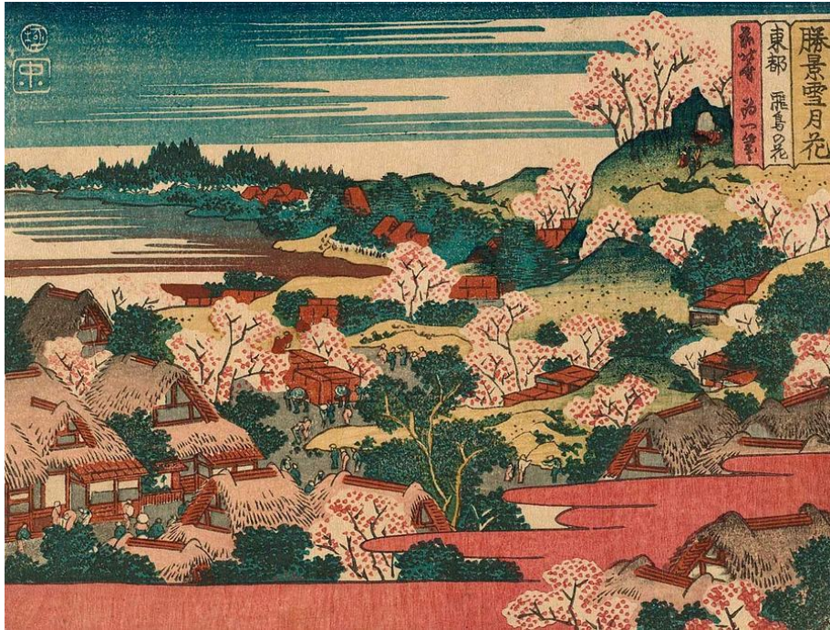
ภาพที่ 4 Cherry Blossom on Asuka Hill