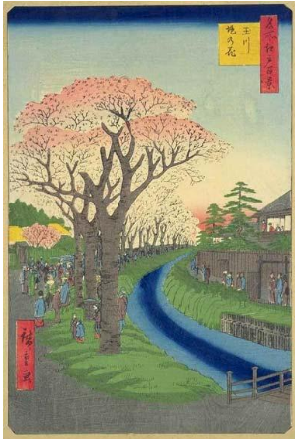
ภาพที่ 12 Blossoms on the Tama River Embankment