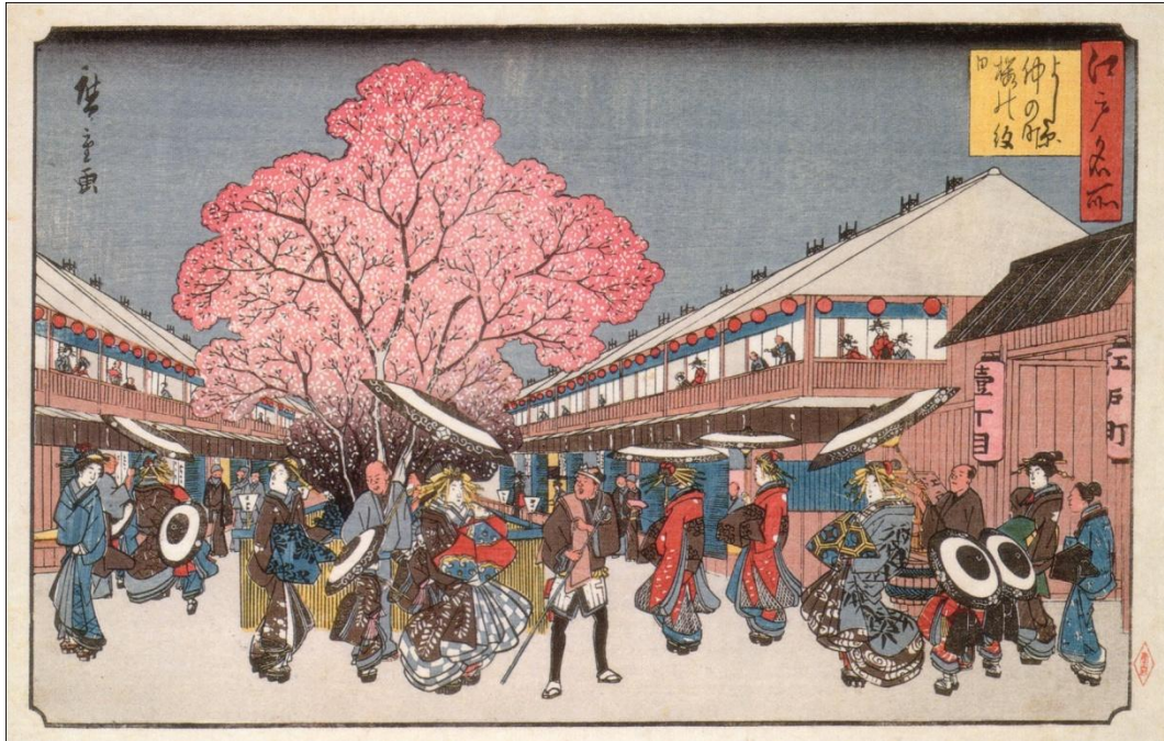
ภาพที่ 5 Viewing the cherry blossom on Nakanochō Street in the Yoshiwara Quarter ที่มา: Utagawa Hiroshige (1840)

ภาพ Viewing the cherry blossom on Nakanochō Street in the Yoshiwara Quarter เป็นภาพที่ผู้คนออกมาพบปะสังสรรค์และทำกิจกรรมร่วมกัน ณ บริเวณย่านโยชิวาระ(หรือเมืองโตเกียวในปัจจุบัน) ซึ่งเป็นศูนย์กลางของความรื่นรมย์ในสมัยเอโดะ ส่วนผู้หญิงที่ทาหน้าสีขาวในภาพคือโอริรันหรือหญิงสาวที่ขายตัวในสมัยนั้น