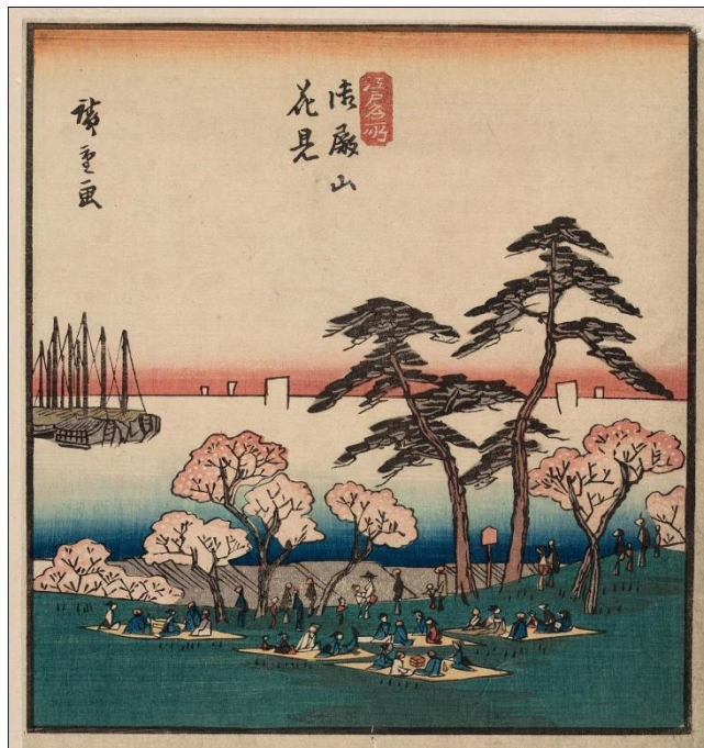
ภาพที่ 1 Cherry Blossom Viewing at Goten Yama

ภาพฤดูใบไม้ผลิมีรูปแบบและลักษณะในการสื่อความหมายที่แตกต่างกันออกไปตามแต่ละยุคสมัย ซึ่งแน่นอนว่าในสมัยเอโดะก็มีลักษณะเฉพาะของภาพฤดูใบไม้ผลิในยุคของตนเองเช่นกัน โดยสามารถนำสัญลักษณ์ของฤดูใบไม้ผลิ 3 ประเภทข้างต้นมาเป็นหลักในการวิเคราะห์ถึงลักษณะเฉพาะของภาพฤดูใบไม้ผลิในศิลปะสมัยเอโดะจำนวน 15 ภาพได้ดังนี้