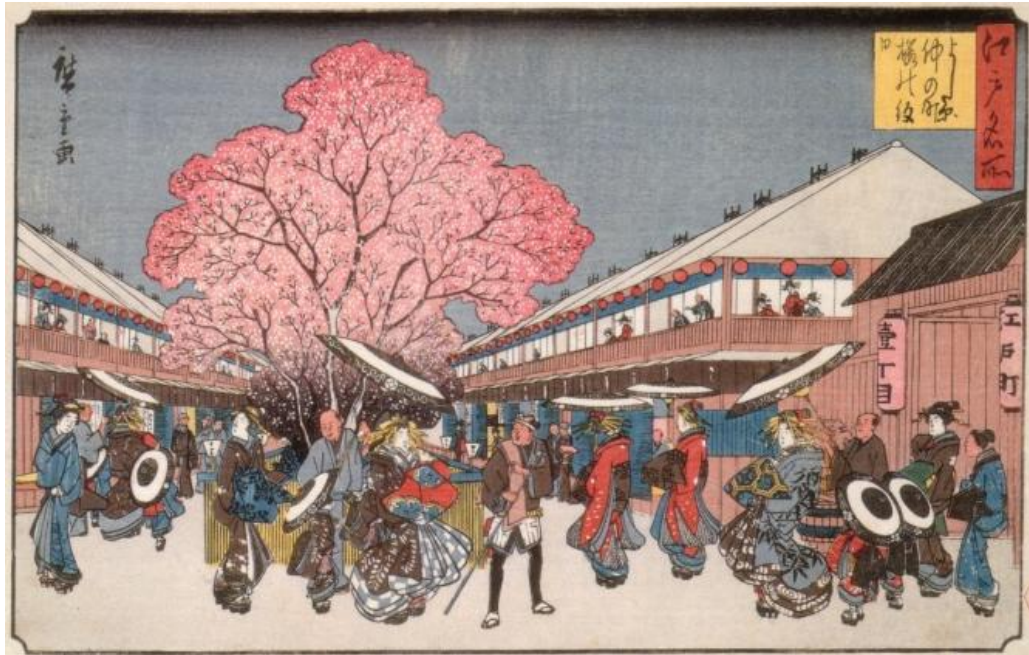
ภาพที่ 5 Viewing the cherry blossom on Nakanochō Street in the Yoshiwara Quarter ที่มา: Utagawa Hiroshige (1840)

ภาพ Viewing the cherry blossom on Nakanochō Street in the Yoshiwara Quarter เป็นภาพบรรยากาศในฤดูใบไม้ผลิ ณ บริเวณย่านโยชิวาระหรือเมืองโตเกียวในปัจจุบัน โดยในภาพพลุกพล่านไปด้วยผู้คนที่มาพบปะสังสรรค์กันหรือสัญจรผ่านไปมา ณ บริเวณย่านนี้ ถือเป็นอีกมุมมองหนึ่งของภาพที่สะท้อนให้เห็นถึงวิถีชีวิตของชาวญี่ปุ่น ณ ย่านโยชิวาระในสมัยเอโดะโดยเฉพาะการใช้ชีวิตของโอริรันหรือหญิงสาวขายตัวที่ทาหน้าสีขาวในภาพ เนื่องจากย่านนี้ในสมัยเอโดะเป็นย่านที่อยู่ของโอริรัน