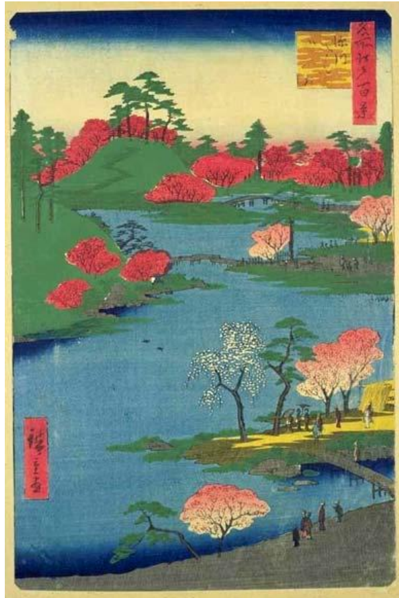
ภาพที่ 15 Cherry Blossoms at the Hachiman Shrine in Fukugawa ที่มา: Utagawa Hiroshige (1857)

ภาพCherry Blossoms at the Hachiman Shrine in Fukugawaเป็นภาพทิวทัศน์บริเวณริมแม่น้ำ ณ ศาลเจ้าฮาจิมันในฟูกูกาว่า ในภาพมีดอกไม้หลายชนิดขึ้นอยู่ตามบริเวณริมแม่น้ำและเนินเขา ซึ่งหนึ่งในดอกไม้หลายชนิดนั้นมีดอกซากุระรวมอยู่ด้วยนอกจากนั้นยังมีผู้คนมาพบปะสังสรรค์และชมวิวกันที่บริเวณแห่งนี้