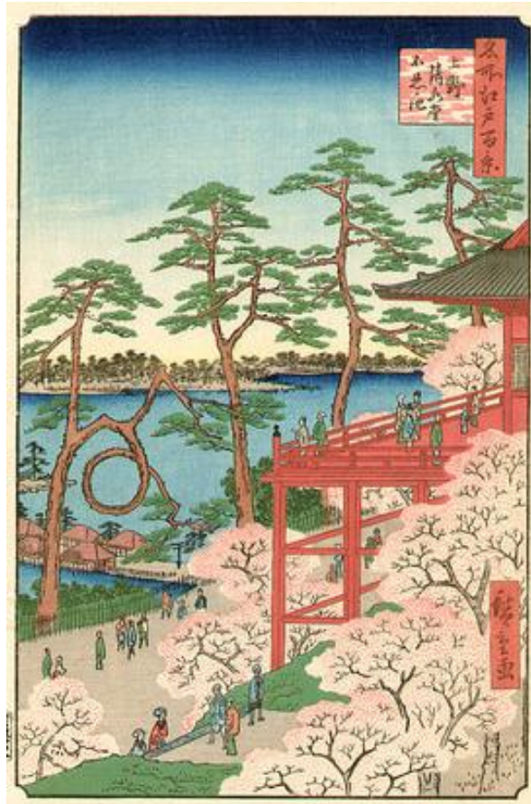
ภาพที่ 13 The Kiyomizu Temple and Shinobazu Pond at Ueno