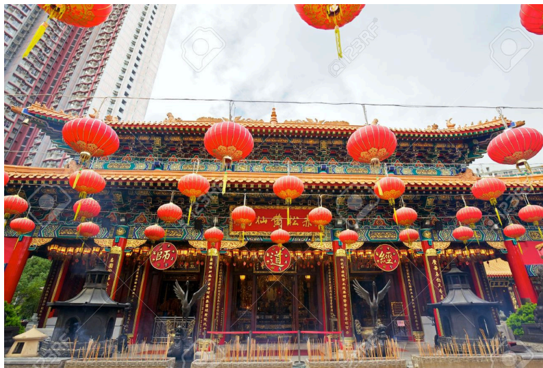
รูปที่ 5 วัดซิกซิกหยวน