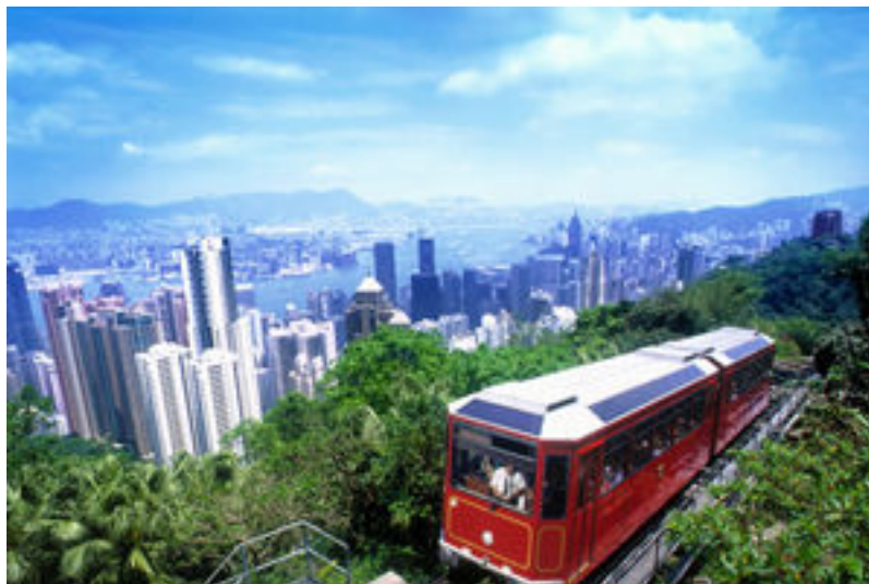
รูปที่ 4 เดอะฟิค