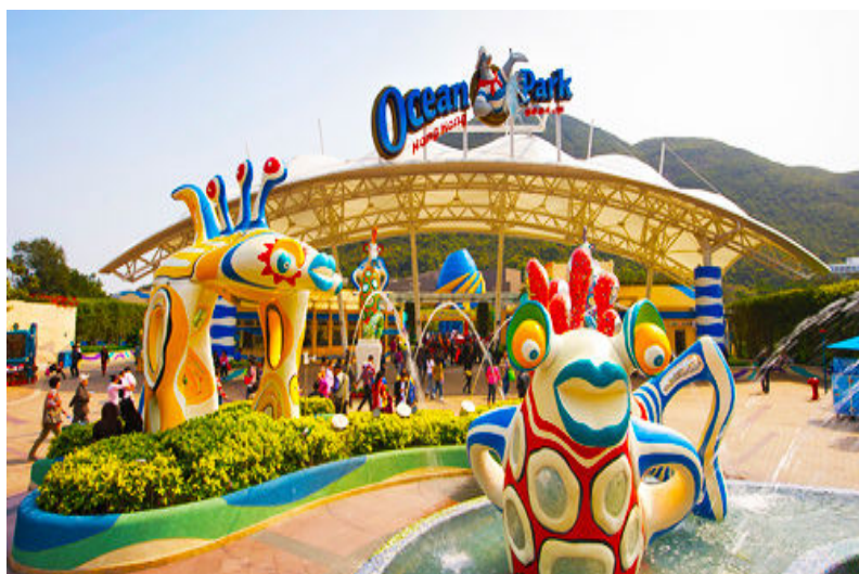
รูปที่ 13 โอเชียนปาร์คฮ่องกง

ร้านค้าและร้านอาหารในรูปแบบหมู่บ้านโบราณ ซึ่งจะเป็นประสบการณ์ที่ท่านจะจดจำตลอดไป อย่าพลาดเข้าชมการแสดงมัลติมีเดีย Walking with Buddha