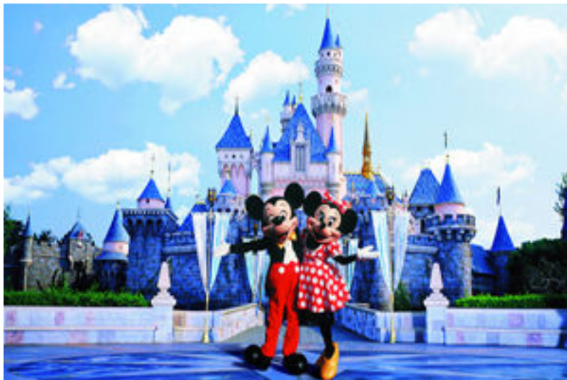
รูปที่ 9 ฮ่องกงดิสนีย์แลนด์