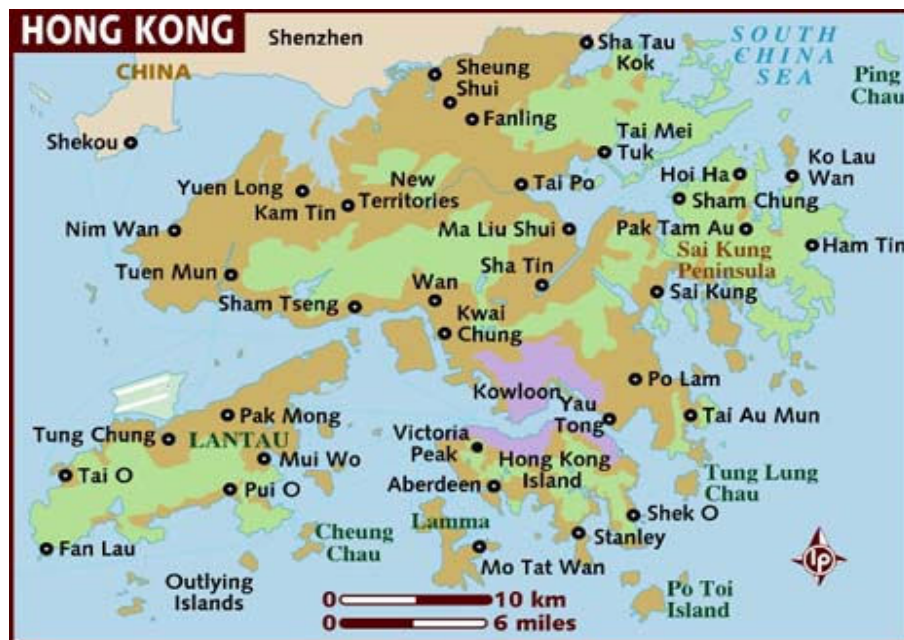
รูปที่ 2 แผนที่ลักษณะทางภูมิศาสตร์ฮ่องกง

กลาง ส่วนราชการและหน่วยงานต่าง ๆ สามารถใช้ภาษาอังกฤษและภาษาจีนกลางควบคู่กันในการติดต่อได้