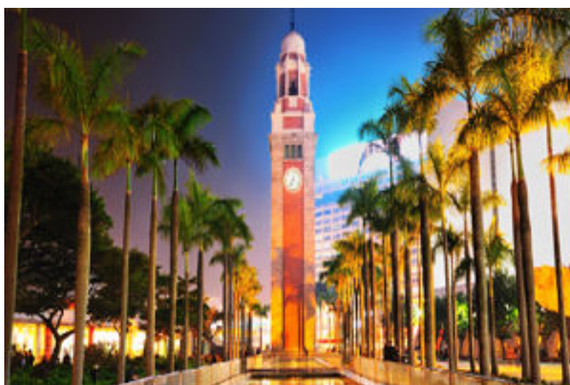
รูปที่ 6 หอนาฬิกา

วัดซิกซิกหยวน หอองไท่ซิน วัดนี้สร้างขึ้นเพื่อรำลึกถึงพระสงฆ์ที่มีชื่อเสียงในอดีตกาล หลวงพ่อหอองไท่ซิน (หรือที่เรียกอีกชื่อหนึ่งว่าฮวงซุ่ปิง) ซึ่งเกิดในศตวรรษที่ 4 และกลายเป็นเทพที่เขาสอน (เขาสนแดง) ในปี 1915 นักพรตลัทธิเต๋าเหลียงเหรินอัน ได้นำภาพอันศักดิ์สิทธิ์ของ หลวงพ่อหอองไท่ซิน เดินทางจากกวางตุ้งทางตอนใต้ของประเทศจีนมายังฮ่องกง ปัจจุบันวัดหอองไท่ซินเก็บรักษาภาพวาดอันล้ำค่านี้ไว้ ทั้งยังเป็นสถานที่สำหรับผู้เลื่อมใสศรัทธาได้สวดมนต์เพื่อขอโชคลาภและคำทำนายจากเหล่าทวยเทพ