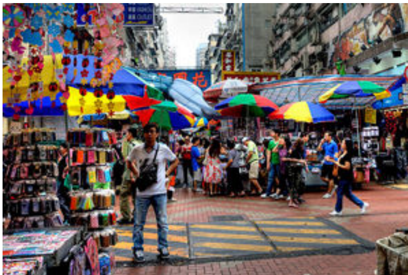
รูปที่ 8 เลดีส์ มาร์เก็ต