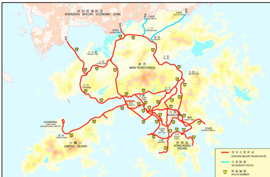
รูปที่ 1 แผนที่ถนนในฮ่องกง