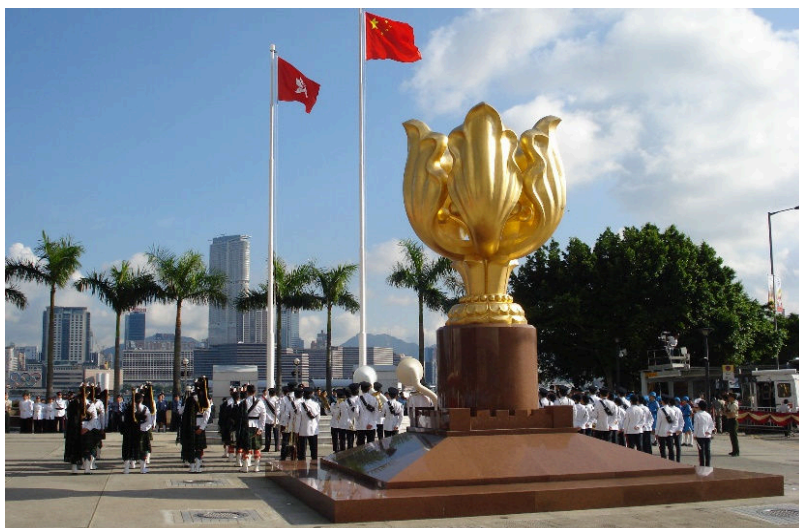
รูปที่ 10 โกลเด้น โบฮิเนีย สแควร์

ฮ่องกงดิสนีย์แลนด์ ดินแดนแห่งจินตนาการ อาณาจักรแห่งแฟนตาซี โลกแห่งอนาคต และหัวใจรักการผจญภัย มิกกี้เมาส์รอต้อนรับคุณสู่ดินแดนแห่งความสุขที่สุดของโลกใบนี้ พร้อมเครื่องเล่นมากมายที่มีเฉพาะที่นี่ที่เดียวในฮ่องกง