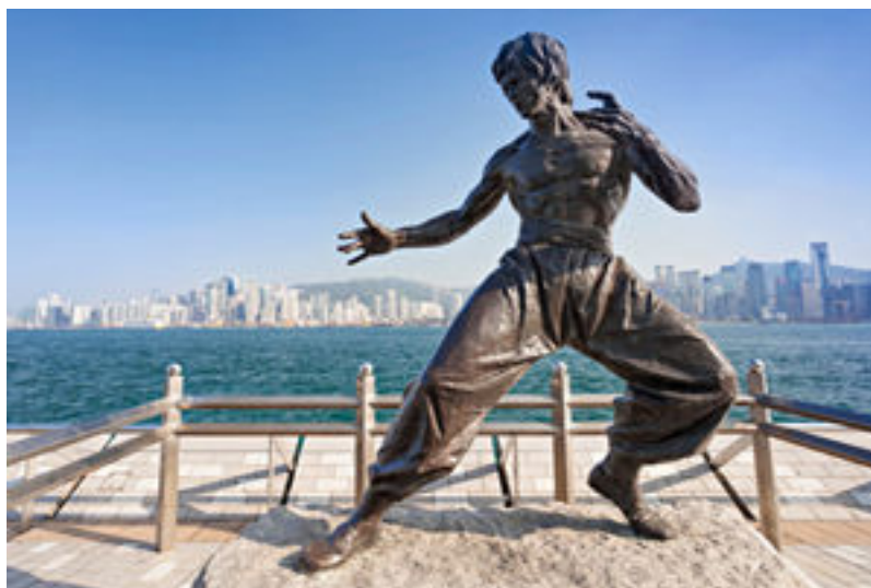
รูปที่ 3 อะเวนิว ออฟ สตาร์

ฮ่องกงมีสถานที่ท่องเที่ยวมากมายและได้รับการแวะเวียนจากนักท่องเที่ยวอยู่เสมอ เพราะเป็นหนึ่งในเมืองที่มีสีสันหลากหลาย มีสถานที่ท่องเที่ยวหลายประเภท ทั้งที่ท่องเที่ยวทางธรรมชาติ และสถานที่ท่องเที่ยวที่มนุษย์สร้างขึ้น