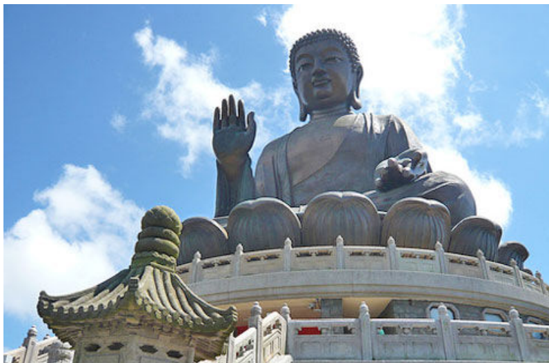
รูปที่ 12 วัดโป้หลิน

สำนักงานรอบๆ เช่น ทรัสต์ที่ต้องการสละความเครียดจากวันหรือสัปดาห์แห่งการทำงานให้หมดไป เดินชมร้านค้าริมถนนที่เนืองแน่นไปด้วยผู้คนหรือคู่มือช่างถนนจากชั้นบน