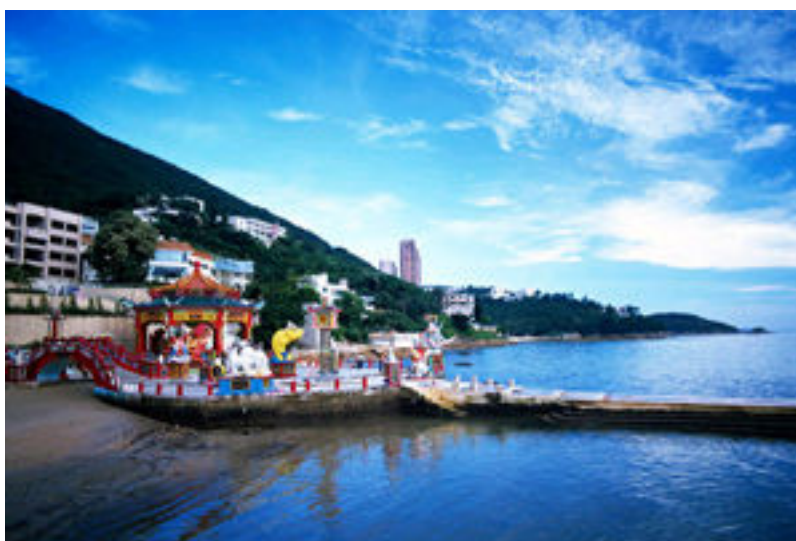
รูปที่ 7 อ่าวรีฟัสเบย์

หอนาฬิกา หนึ่งในสัญลักษณ์อันโดดเด่นแห่งจิมซาโจ่ย เดิมทีเป็นส่วนหนึ่งของสถานีต้นทางของรถไฟสายเก่าลูน-แคนตัน (KCR) สร้างขึ้นเมื่อปี ค.ศ. 1915 หอคอยทำจากอิฐสีแดงและหินแกรนิต สูง 44 เมตร เป็นอนุสรณ์ชวนให้รำลึกถึงสมัยอาณานิคม ปัจจุบันพื้นที่ของสถานีรถไฟได้กลายเป็นที่ตั้งของศูนย์วัฒนธรรมฮ่องกง หลังคาทรงโค้งและดีไซน์ทางด้านสถาปัตยกรรมที่คู่กันสมัยกลายเป็นฉากหลังอันงดงามของหอนาฬิกาแห่งนี้