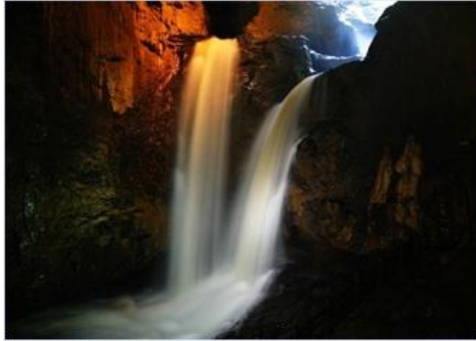
ภาพที่ 5 ถ้ำจิวเซียง