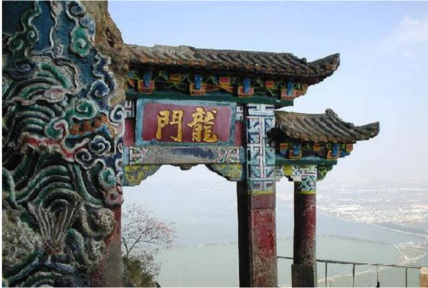
ภาพที่ 3 ประตุมังกร เขาซีซาน