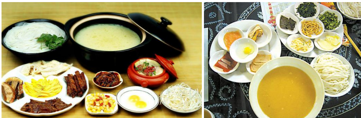
ภาพที่ 6 ก้วยเฉียวหมี่เซี่ยน หรือ ขนมจีนข้ามสะพาน