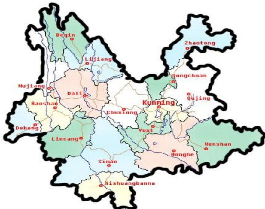
แผนที่ 2 แสดงเขตการปกครองของมณฑลยูนนาน