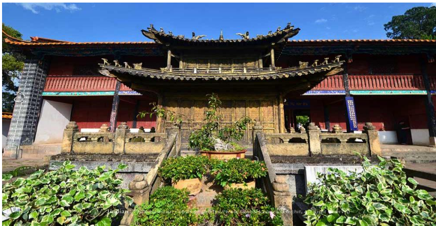
ภาพที่ 1 ตำหนักทองจินเตียน

1. ตำหนักทองหรือจินเตียน (jindian) ตั้งอยู่บนภูเขา หมิงฟิงซาน ด้านทิศตะวันออกของตัวเมือง คุนหมิง ตำหนักทองจินเตียนถูกสร้างขึ้นในสมัยราชวงศ์ หมิง และได้รับการบูรณะโดยอ๋อง อู่ชานกั๋ว ผู้ปกครองดินแดนแถบนี้ในสมัยราชวงศ์ชิง ตำหนักหลังนี้มีความสูง 6.7 เมตร กว้างและยาว 6.2 เมตร สร้าง ขึ้นด้วยทองเหลืองทั้งหลัง น้ำหนัก กว่า 250 ตัน เป็นสิ่งปลูกสร้างทองเหลืองที่ใหญ่ที่สุดของจีน มีกำแพง และป้อมล้อมรอบตำหนักเสมือนกำแพงที่ล้อมรอบเมือง มีกระเบื้องเคลือบน้ำหนักรวม 12 กิโลกรัม และคาบคาย สิทธิ์น้ำหนัก 20 กิโลกรัมถูกเก็บรักษาไว้ในศาลา เชื่อว่าทั้งสองเป็นอาวุธประจำกายของ อ๋อง อู่ชานกั๋ว