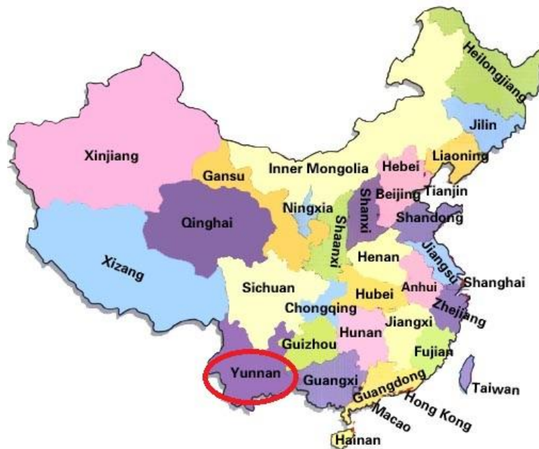
แผนที่ 1 แสดงที่ตั้งมณฑลยูนนาน

มณฑลยูนนาน มีอาณาเขตติดต่อกับประเทศเวียดนาม ลาว และพม่า มณฑลยูนนานมีสภาพภูมิประเทศสลับซับซ้อน โดยมีทิวเขาซึ่งมีหิมะปกคลุมยอดเขาเกือบตลอดปี ไปจนถึงป่าเขตร้อน ซึ่งเป็นที่อยู่อาศัยของช้างและลิง พืชที่สำคัญได้แก่ ใบบัว ยูคาลิปตัส และต้นไผ่ 1 ใน 3 ของประชากรประกอบด้วยชนกลุ่มน้อยหลายชนชาติ ชนกลุ่มน้อยส่วนใหญ่ยังคงยึดถือปฏิบัติตามประเพณีโบราณ อาทิ ประเพณีสงกรานต์ แห่งโคม และตลาดพระจันทร์ (Moon Market) ชาวยูนนานเป็น ศิลปิน นักเดินร่ำ นักร้อง และนักดนตรีที่มีชื่อเสียงจำนวนมาก มาจากชนกลุ่มน้อย อาทิ ชาชาติ นาซี หยี และไต มณฑลยูนนานตั้งอยู่ทางตอนใต้ของจีน ดังแสดงในแผนที่ 1