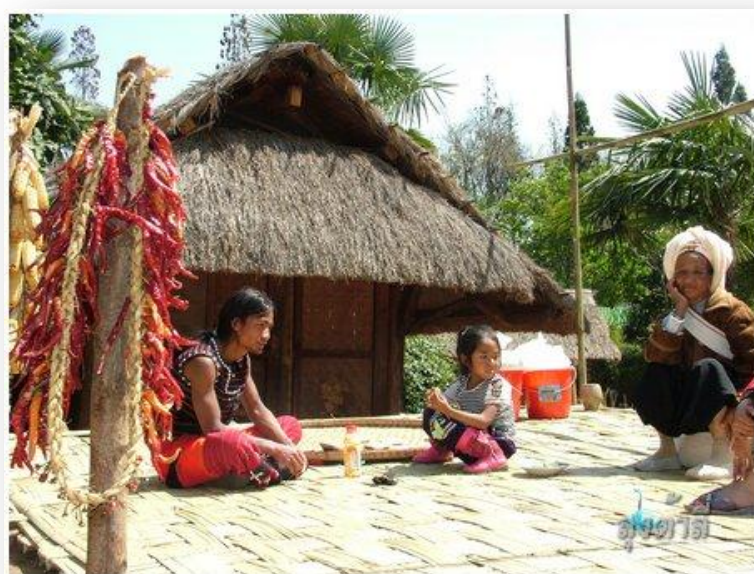
ภาพที่ 14 ชนเผ่าจำลองในหมู่บ้านวัฒนธรรม เมืองคุนหมิง

หมู่บ้านวัฒนธรรมยูนนาน (yunnan cultural village) 云南民俗村 หมู่บ้านวัฒนธรรมยูนนาน ตั้งอยู่ริมทะเลสาบเตียนจื่อ ด้านทิศใต้ของเมืองคุนหมิง ห่างจากตัวเมืองคุนหมิง 8 กิโลเมตร เป็นแหล่งท่องเที่ยวเชิงวัฒนธรรมและเวทีแสดงวัฒนธรรมของชนกลุ่มน้อยให้นักท่องเที่ยวได้ชม ภายในหมู่บ้านมีการจำลองบ้านของชนกลุ่มน้อยทั้ง 26 ชนกลุ่มของมณฑล ยูนนาน นอกจากการจำลองหมู่บ้านแล้วยังมีการแสดงเต้นรำ ร้องเพลง และการละเล่นของชนกลุ่มน้อยที่หลากหลายได้ยาก รวมทั้งการเล่นน้ำสงกรานต์ของชาวไทย ซึ่งเป็นหนึ่งในชนกลุ่มน้อยของมณฑล ยูนนาน