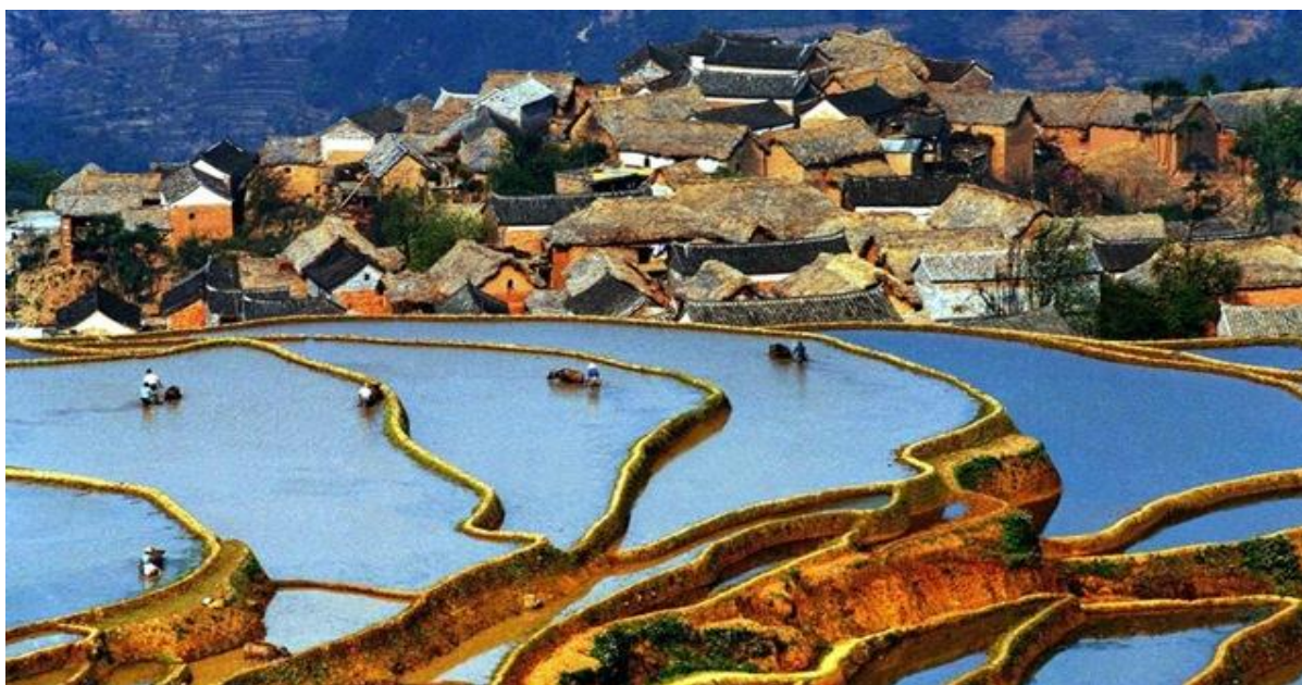
ภาพที่ 13 การทำนาขั้นบันได ชนเผ่าฮาหนี

ชนเผ่าฮาหนีเป็นผู้เชี่ยวชาญการปลูกพืชขั้นบันไดเป็นพิเศษ ทุ่งนาขั้นบันไดของชนเผ่าฮาหนี (Hani Rice Terraces/ 哈尼梯田) ในเขตหุบเขาลี้ก ตำบลหลงเหอ อำเภอหยวนหยาง มณฑลยูนนานได้รับการยอมรับให้เป็นมรดกโลกในปี 2556 เนื่องจาก มีทัศนียภาพทางธรรมชาติที่สวยงาม ช่อนเร้นกลิ่นอายวัฒนธรรมการดำรงชีวิตของชาวจีนพื้นถิ่น ที่ทำการเพาะปลูกแบบขั้นบันไดตามลักษณะของภูมิประเทศ