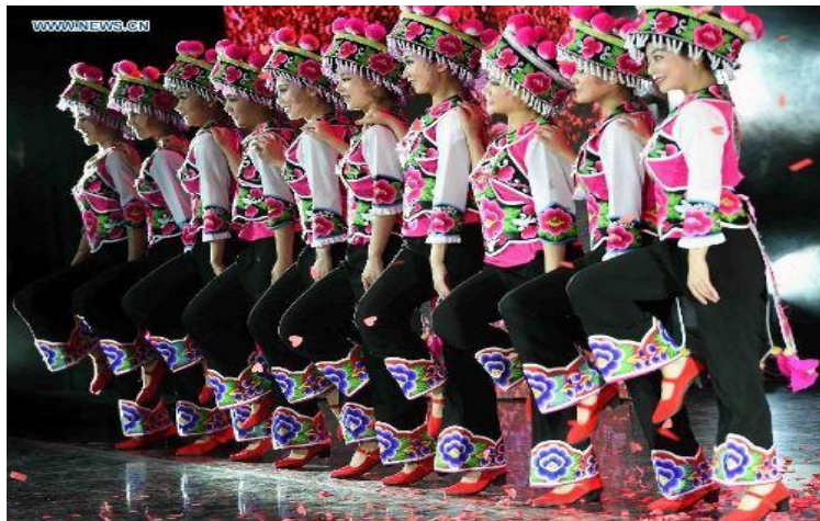
ภาพที่ 5 การแสดงชนกลุ่มน้อย Chuxiong Yi Autonomous Prefecture ที่เมืองฉู่สง

รัฐบาลของมณฑลยูนนานได้วางแผนสนับสนุนการท่องเที่ยวของมณฑล โดยมีการคงเอกลักษณ์ประจำกลุ่มชาติพันธุ์ไว้สูงสุด ทั้งการแต่งกาย ภาษาและประเพณีวัฒนธรรมดั้งเดิม ซึ่งเป็นการสร้างเอกลักษณ์และจุดเด่นในการท่องเที่ยว มีการดึงเอาความหลากหลายของกลุ่มชาติพันธุ์ สีสันเครื่องแต่งกาย วิถีชีวิตความเป็นอยู่ ศิลปะการแสดงมาใช้ในการนำเสนอรูปแบบการท่องเที่ยวรูปแบบใหม่ มีการจัดแสดงศิลปะการแสดงประจำแต่ละเผ่าขึ้น นำเสนอรูปแบบการท่องเที่ยวตามเทศกาลประจำกลุ่มชาติพันธุ์ภายในมณฑล ทำให้การท่องเที่ยวของยูนนานมีความดึงดูดและน่าสนใจเป็นอย่างมาก