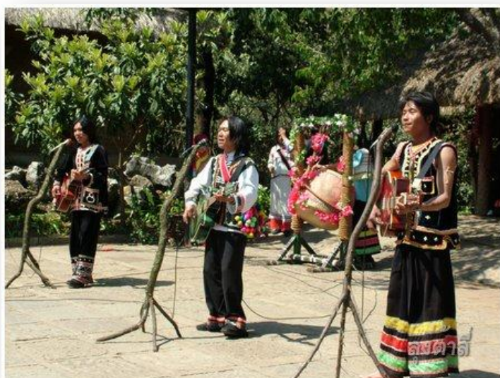
ภาพที่ 15 การแสดงดนตรีของชนกลุ่มน้อย ในหมู่บ้านวัฒนธรรม เมืองคุนหมิง