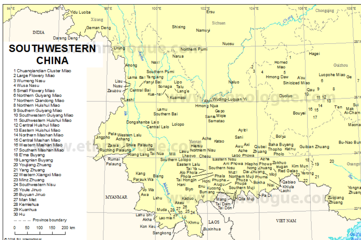
ภาพที่ 4 แผนที่แสดงการกระจายตัวของชนกลุ่มน้อยในมณฑลยูนนาน