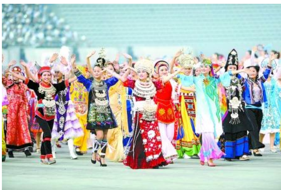
ภาพที่ 6 แสดงลักษณะการแต่งกายของชนกลุ่มน้อย มณฑลยูนนาน

ที่มา : http://thai.ynta.gov.cn/Item/1334.aspx