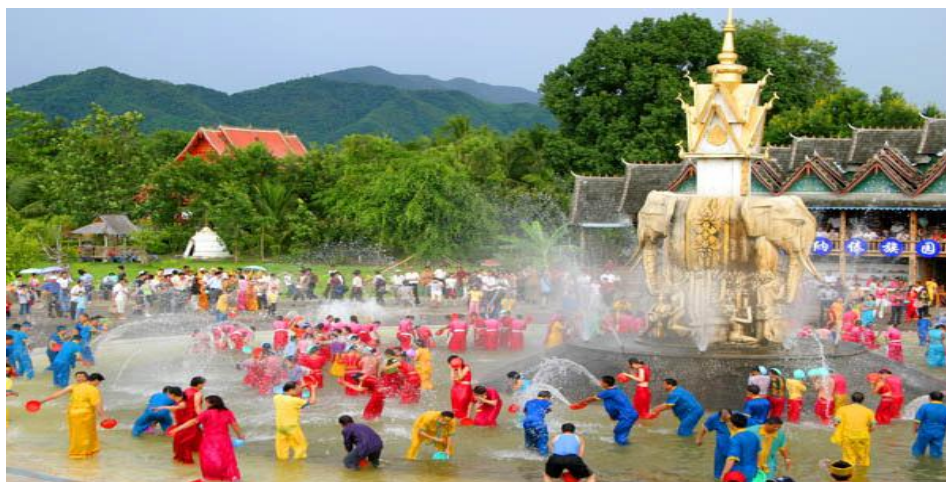
ภาพที่ 10 ประเพณีสงกรานต์ สิบสองปันนา