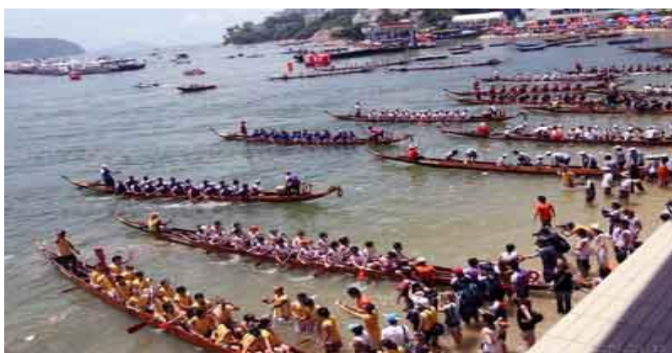
ภาพที่ 11 การแข่งขันเรือยาว เทศกาลสงกรานต์ สิบสองปันนา