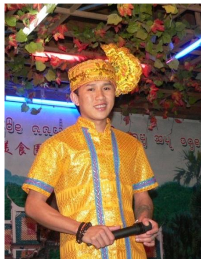
ภาพที่ 9 การแต่งกายชายชาวไตลื้อ(เทศกาล)