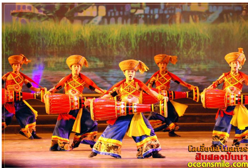
ภาพที่ 16 การแสดงโข่วพาราณสี ลีปสองปี่นา