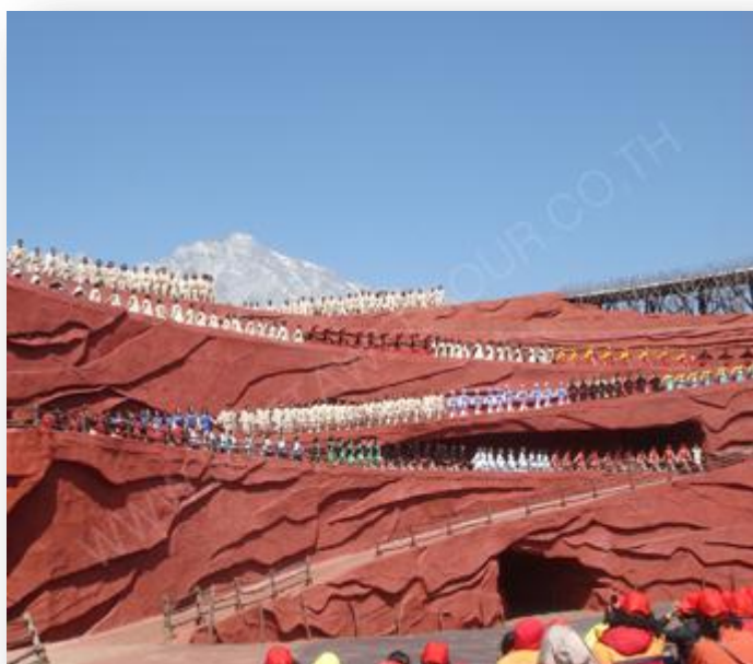
ภาพที่ 17 การแสดง IMPRESSION LIJIANG เมืองลี่เจียง

การแสดงโชว์ “Impression Lijiang” เป็นโชว์ที่กำกับการแสดงโดยจาง อี้ โหมว ซึ่งเป็นผลงานชิ้นที่สองต่อจากผลงานชิ้นแรก IMPRESSION LIU SAN JIE ที่เมืองหยางชว่ประสบความสำเร็จ เวทีการแสดงถูกสร้างขึ้นบริเวณใกล้กับภูเขาหิมะมังกรหยกเหนือระดับน้ำทะเล 3,100 เมตร โดยใช้วิวจริงของภูเขาหิมะมังกรหยกเป็นฉากหลังประกอบการแสดง การแสดงในภาคนี้จะเป็นการสะท้อนเรื่องราวที่เกี่ยวข้องกับภูเขาหิมะมังกรหยกอันศักดิ์สิทธิ์ และประเพณีของชนกลุ่มน้อยของเมืองลี่เจียง ใช้ทีมนักแสดงชนกลุ่มน้อยพื้นเมืองกว่า 500 คน เป็นการแสดงในสถานที่จริงที่ยิ่งใหญ่ท่ามกลางภูเขาหิมะ การแสดงชุดนี้ใช้ทุนสร้างกว่า 250 ล้านดอลลาร์ ซึ่งเป็นการประยุกต์นำเอาเอกลักษณ์ของชนกลุ่มน้อยมาใช้ในการส่งเสริมการท่องเที่ยวเป็นอย่างมาก