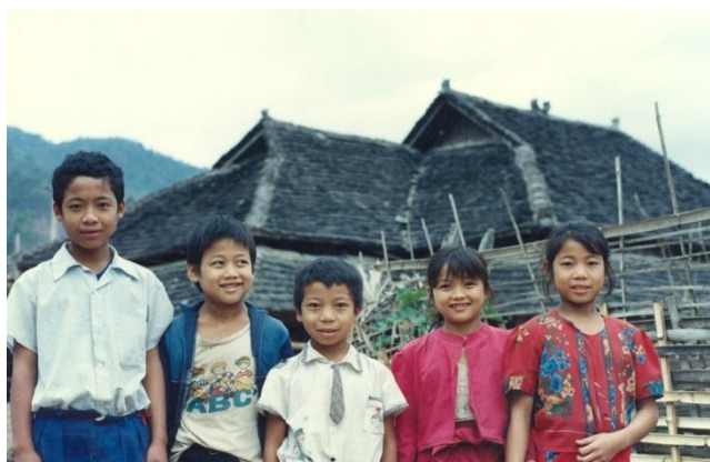
ภาพที่ 7 หมู่ละอ่อนชาวไตลื้อที่บ้านน้ำโป่ง ในชนบทเมืองยาง ลิบสองป้านา