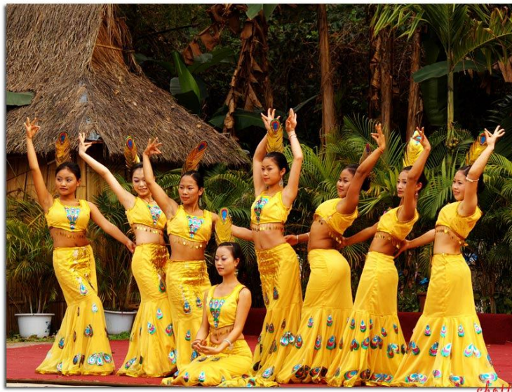
ภาพที่ 12 การแสดงระบำกยุง สาวไตลื้อ สิบสองปันนา