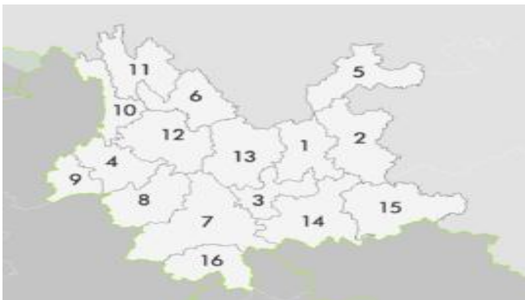
ภาพที่ 2 แผนที่มณฑลยูนนานแสดงการกระจายตัวของชนกลุ่มน้อย