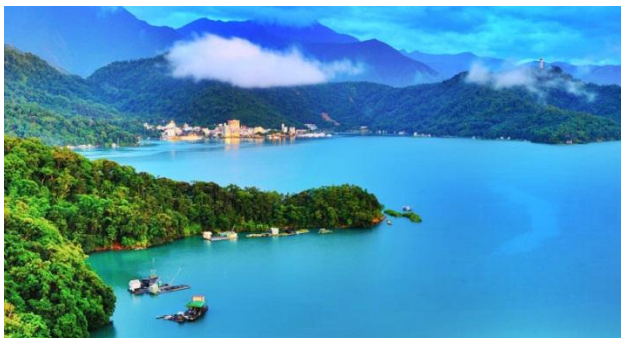
ภาพที่ 6 ทะเลสาบสุริยันจันทรา