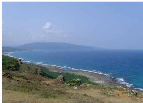
ภาพที่ 7 ทะเลเจ็นดิง