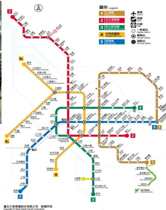
ภาพที่ 14 แผนที่ MTR ของไต้หวัน