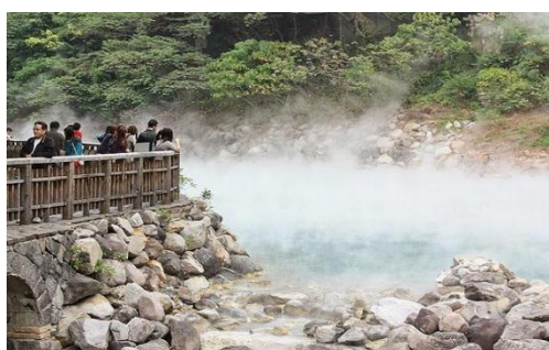
ภาพที่ 5 น้ำพุร้อนเปย์โถว

ช่วงฤดูหนาว ตั้งแต่ พฤศจิกายน – มีนาคม เหมาะแก่การท่องเที่ยว ซื้อสินในห้างสรรพสินค้า แช่น้ำพุร้อน