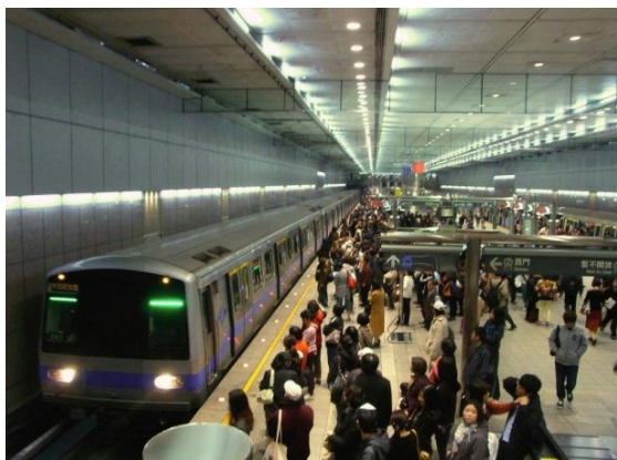
ภาพที่ 13 รถไฟฟ้า MRT