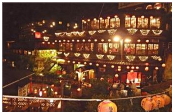
ภาพที่ 8 เมืองโบราณจิวเฟิน