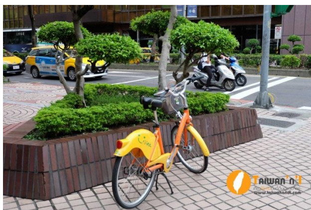
ภาพที่ 17 จักรยานสาธารณะ U-Bike