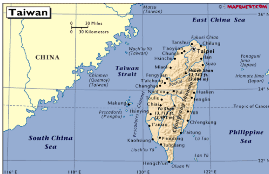
ภาพที่ 1 แสดงตำแหน่งที่ตั้งของเกาะไต้หวัน