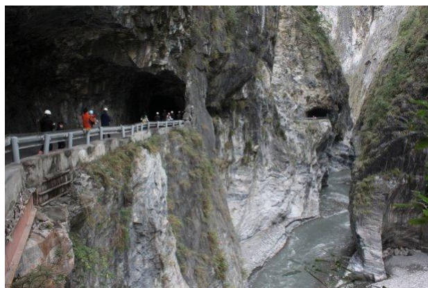
ภาพที่ 5 อุทยานทาโรโกะ