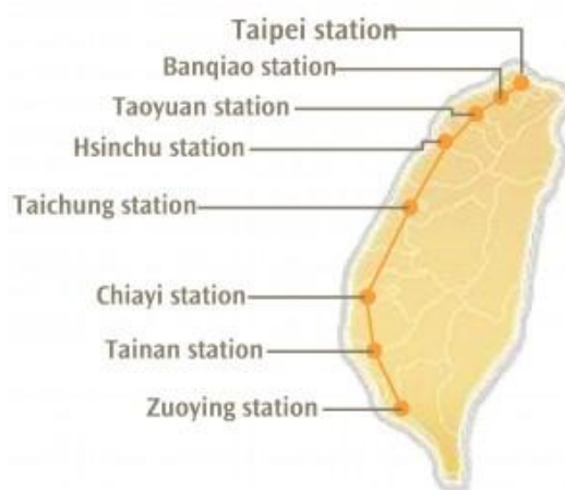
ภาพที่ 16 รถไฟความเร็วสูง THSR