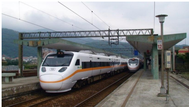
ภาพที่ 15 รถไฟ TRA