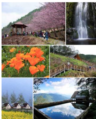
ภาพที่ 4 อุ๋หลิงฟาร์ม