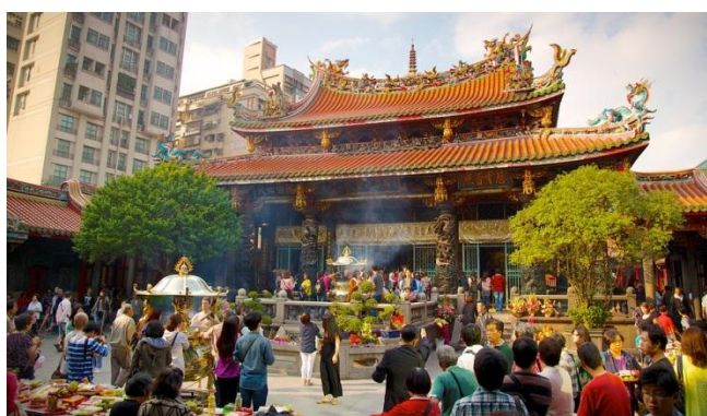
ภาพที่ 10 วัดหลงซาน