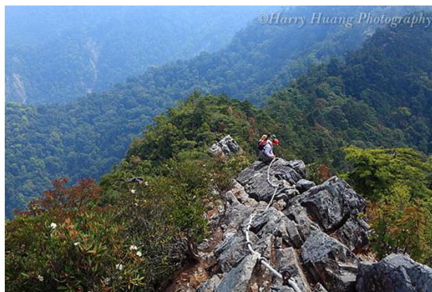
ภาพที่ 4 ภาพถ่ายอุทยานยี่ขัน