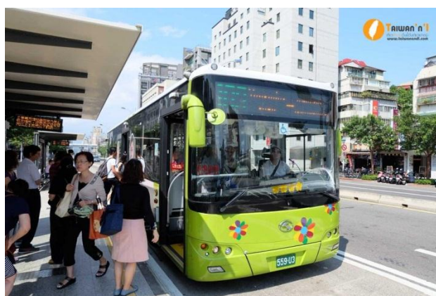
ภาพที่ 12 ภาพรถเมล์ของไต้หวัน