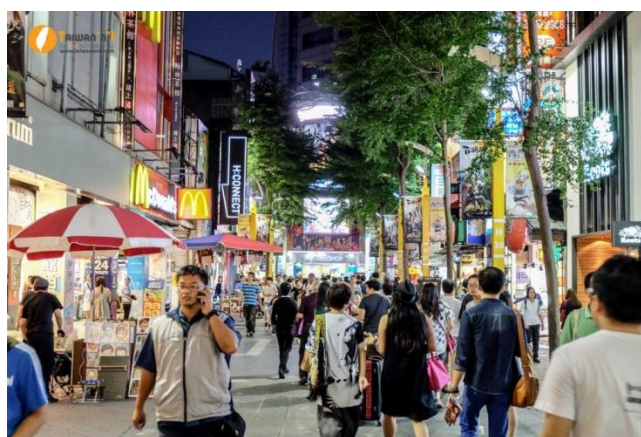
ภาพที่ 9 ซีเหมินติง แหล่งซื้อสินค้าของคนไต้หวัน