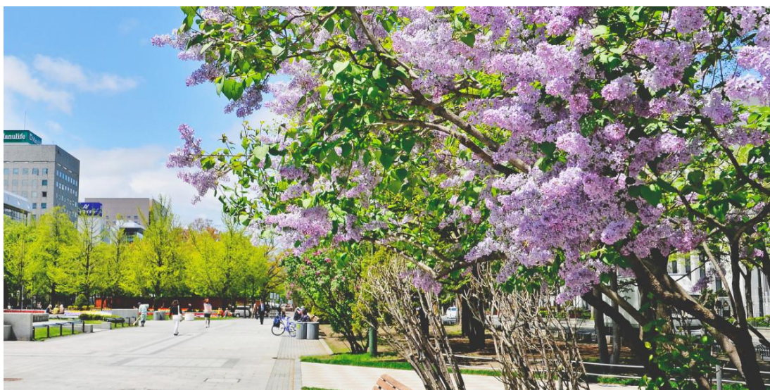
รูปที่ 24 งานเทศกาลไลแลค