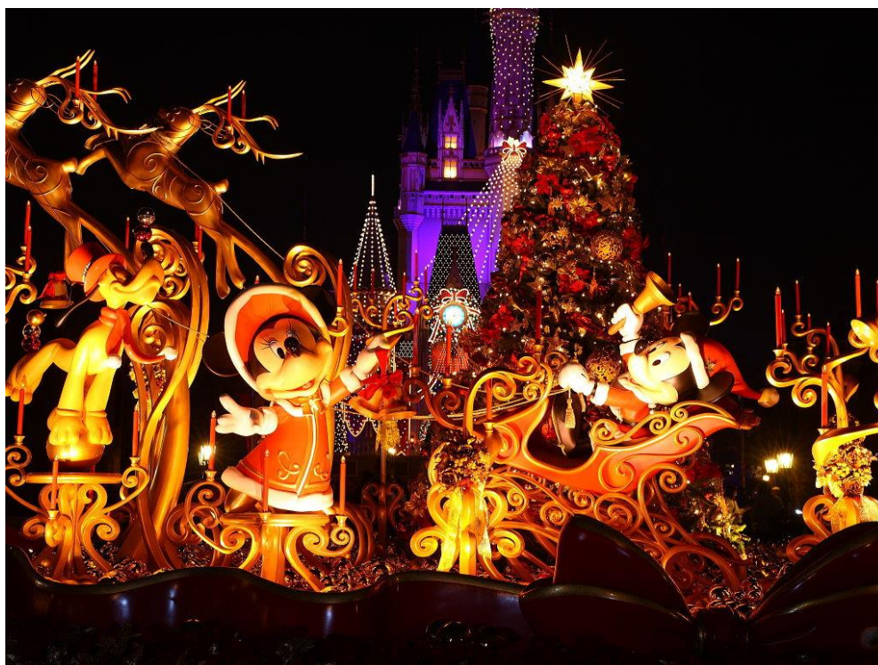
รูปที่ 8 ภาพขบวนพาเลทเทศกาลคริสต์มาส