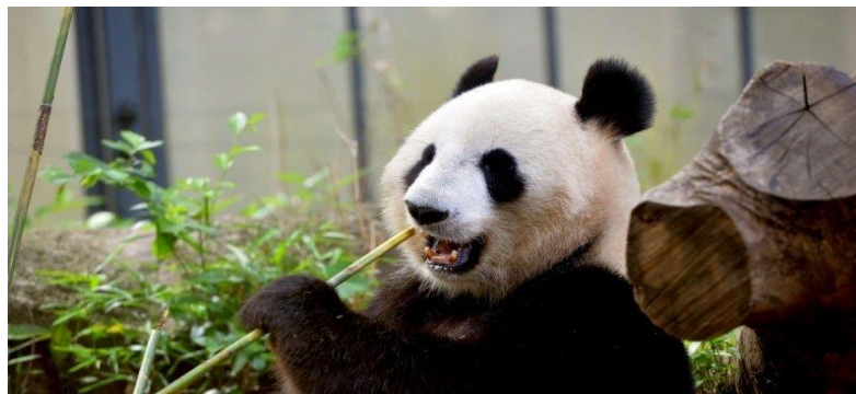
ภาพที่ 34 แพนด้าในสวนสัตว์อูเอโนะ

ทั้งหมด 464 สายพันธุ์ที่แตกต่างกันไม่ว่าจะเป็นหมีแพนด้ายักษ์ ช้าง เพนกวิน ยีราฟ ฯ ในเขตพื้นที่ด้านตะวันตกมีสวนสัตว์สำหรับเด็กซึ่งมีแพะและแกะให้เด็กๆได้ใกล้ชิดและได้เปิดโอกาสให้ผู้เข้าชมได้มีประสบการณ์การเรียนรู้เกี่ยวกับความหลากหลายของสัตว์รวมทั้งสร้างความสุข ความสนุกสนานและความเพลิดเพลินให้แก่นักท่องเที่ยวที่มาเยือนอีกด้วย