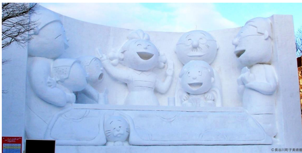
รูปที่ 23 ภาพงานเทศกาลหิมะซัปโปโร