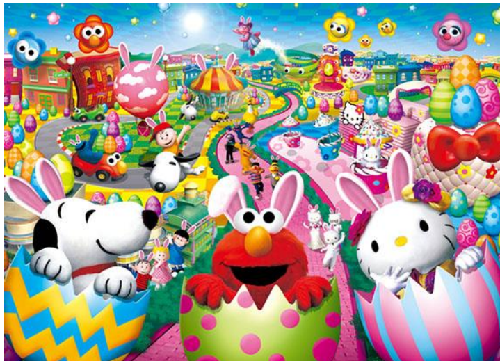
รูปที่ 51 โปสเตอร์เทศกาล Easter