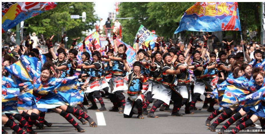
ภาพที่ 25 งานเทศกาล YOSAKOI โซรัน