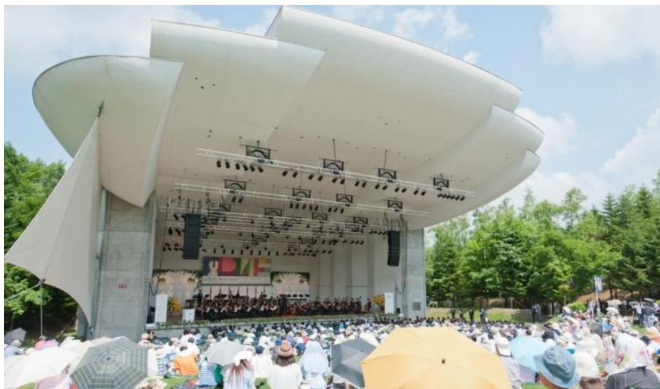
ภาพที่ 26 PMF (แปซิฟิกมิวสิกเฟสตีวัล)