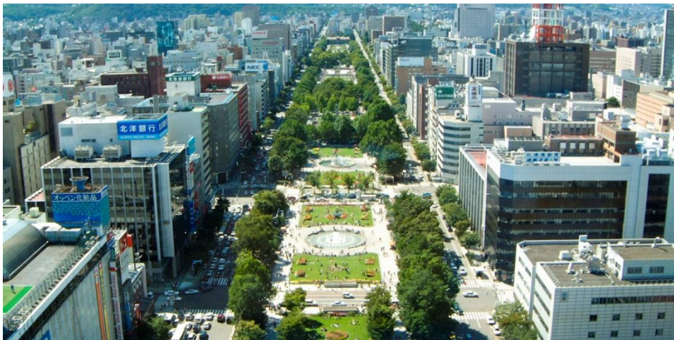
รูปที่ 22 ภาพถ่ายมุมสูงของสวนโอโตรี

ที่มา: http://www.welcome.city.sapporo.jp , (2558)