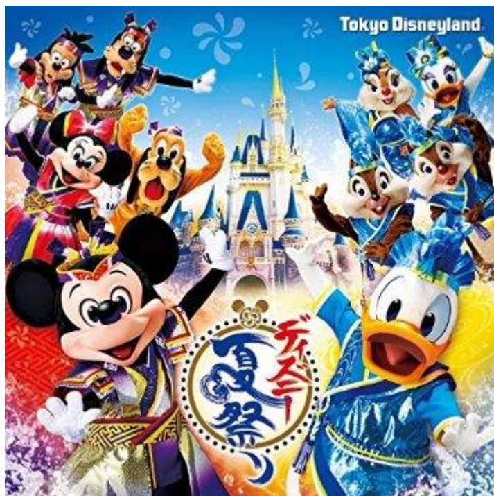
รูปที่ 19 โปรโมทงานเทศกาลฤดูร้อน