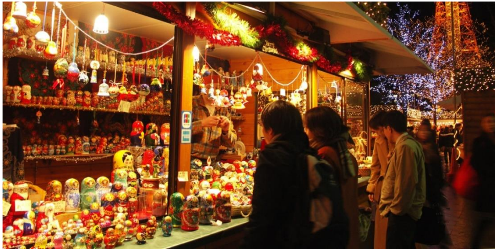
ภาพที่ 31 บรรยากาศงาน Munich Christmas Market in Sapporo