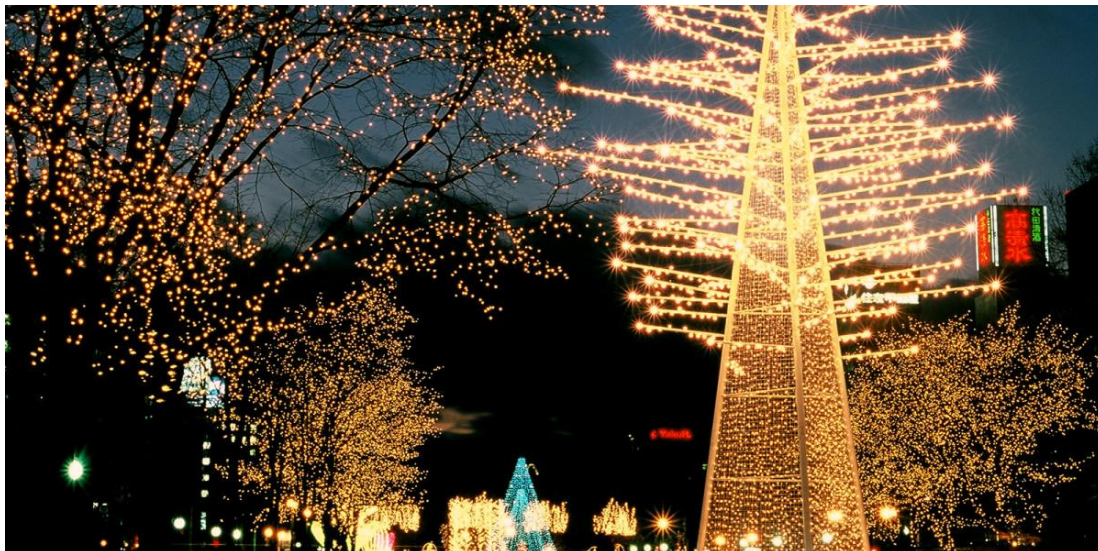
ภาพที่ 32 ภาพบรรยากาศงานซัปโปโร ไลท์ อิลลูมิเนชัน