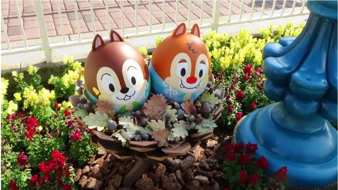
รูปที่ 16 การจัดตกแต่งสถานที่ เทศกาล Easter