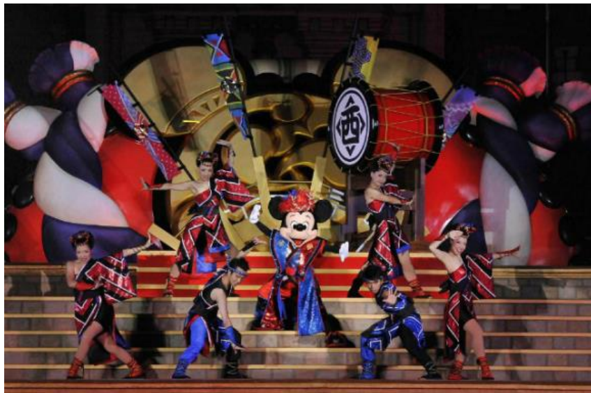
รูปที่ 40 การแสดงในเทศกาลฤดูร้อน