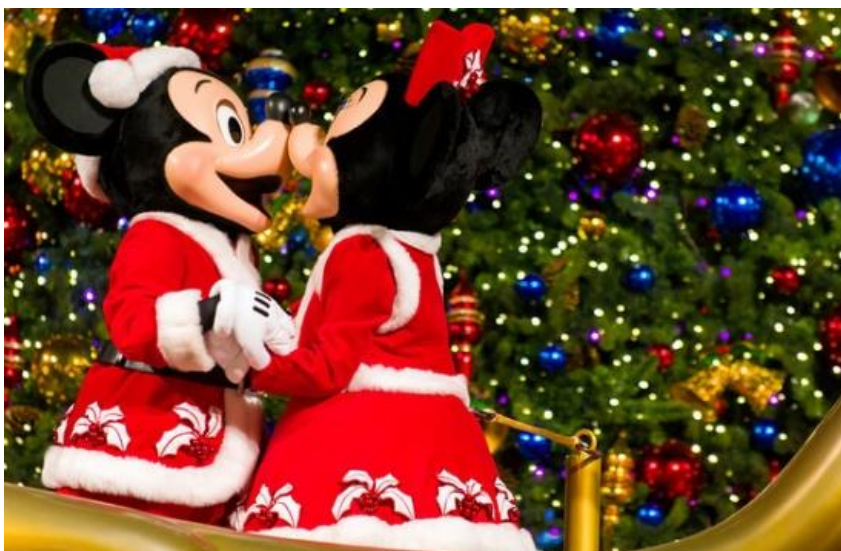
รูปที่ 9 ภาพขบวนพาเลทเทศกาลคริสต์มาส