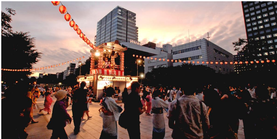
รูปที่ 46 งานเทศกาลฤดูร้อนของซัปโปโร