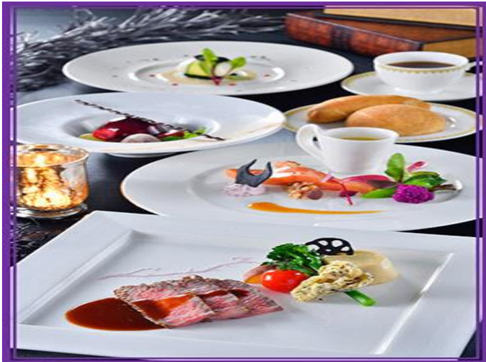
รูปที่ 3 ภาพอาหารที่จัดทำเพื่อเทศกาลฮาโลวีน