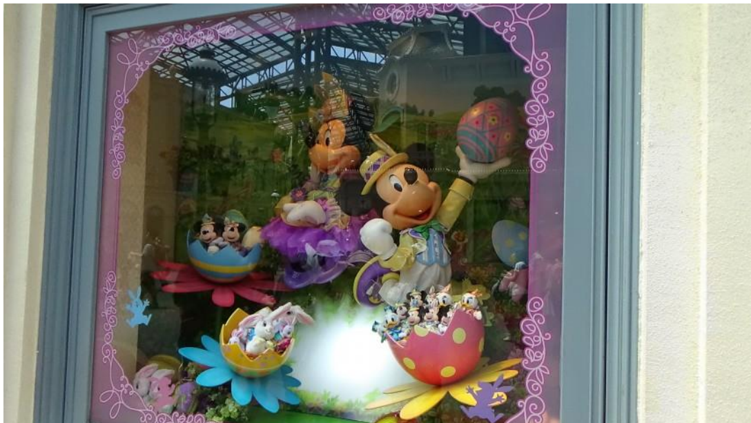
รูปที่ 15 การจัดตกแต่งสถานที่ เทศกาล Easter