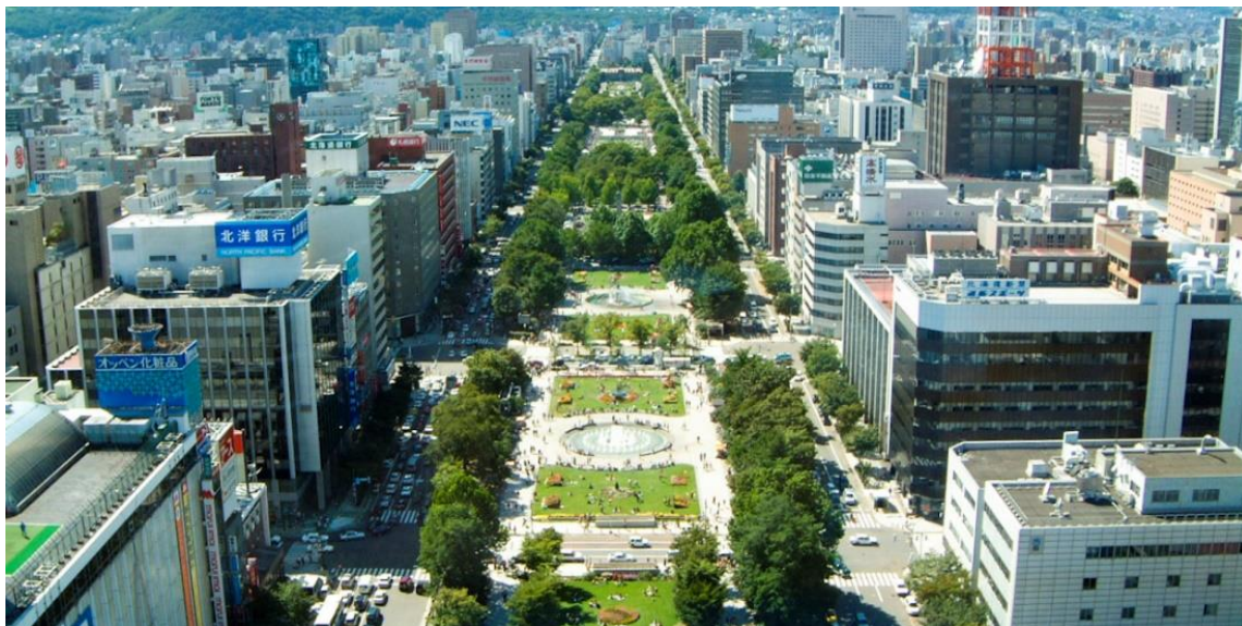
รูปที่44 สวนโอโตรี