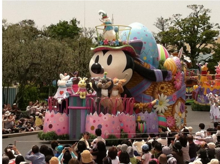
รูปที่ 14 ขบวนพาเลทเทศกาล Easter

ที่มา: https://disneynerd.wordpress.com , (2558)