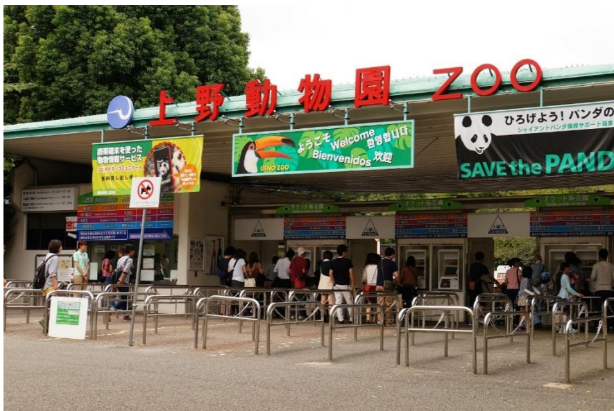
รูปที่ 47 ทางเข้าสวนสัตว์อุเอโนะ