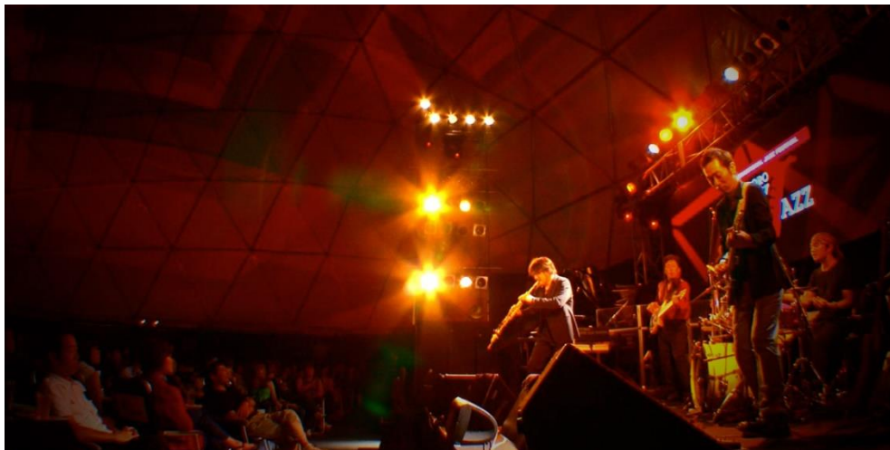
ภาพที่ 28 ซัปโปโรเจ็ส