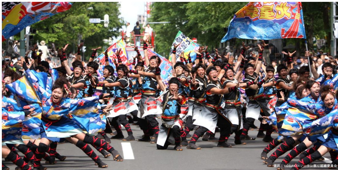
รูปที่ 45 งานเทศกาล YOSAKOI โซรัน