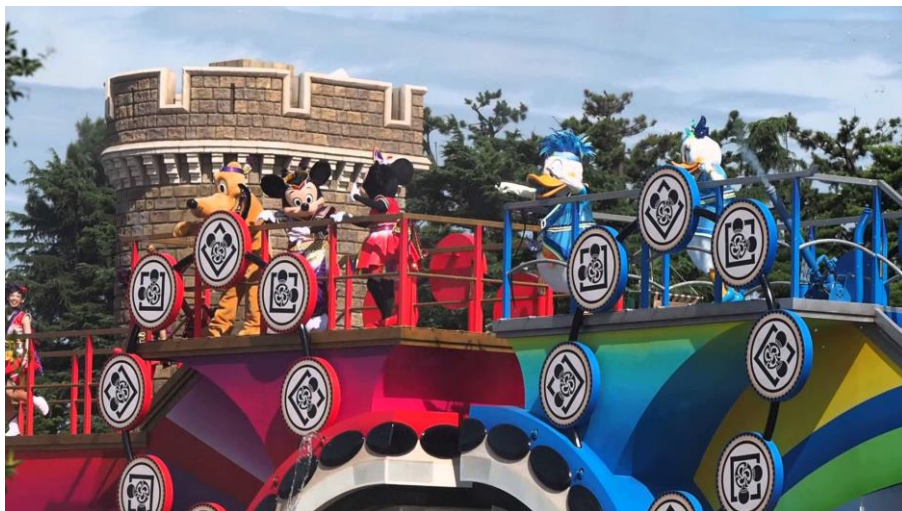
รูปที่ 41 การแสดงในเทศกาลฤดูร้อน