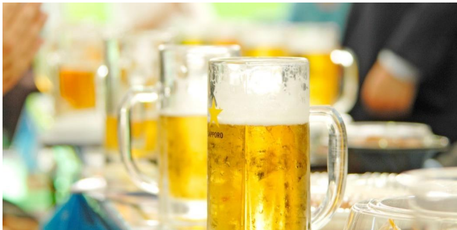
ภาพที่ 27 ซัปโปโรโอโตรีเบียร์การ์เด็นที่ให้การสนับสนุนทางด้านสวัสดิการ