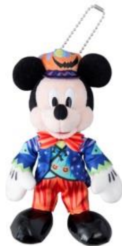
รูปที่ 5 ภาพของที่ระลึกเนื่องวันฮาโลวีน