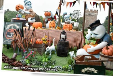
รูปที่ 6 การจัดแต่งสถานที่และการจุดพลุ