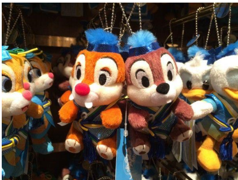
รูปที่ 42 ของที่ระลึกในเทศกาลฤดูร้อน

ของระลึกต่างๆที่มีความเป็นญี่ปุ่นผสมผสานอยู่