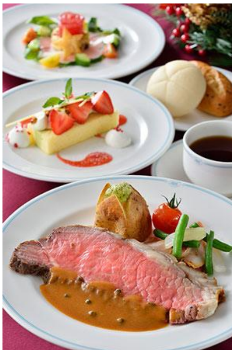
รูปที่ 10 ภาพอาหารที่จัดทำเพื่อเทศกาลคริสต์มาส