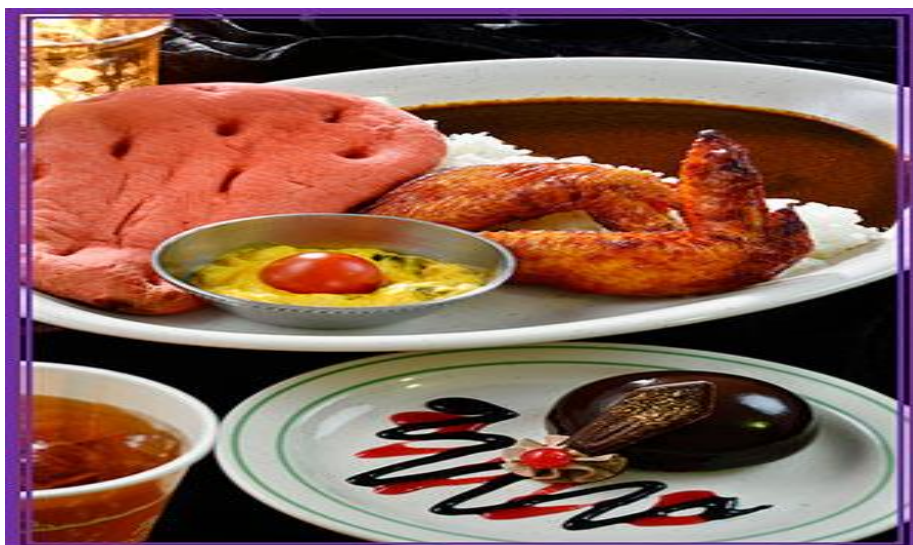
รูปที่ 3 ภาพอาหารที่จัดทำเพื่อเทศกาลฮาโลวีน