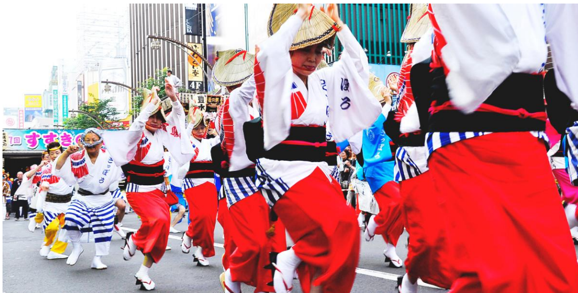
ภาพที่ 29 ภาพขบวนพาเลทในเทศกาลฤดูร้อน