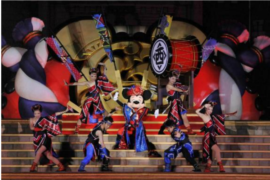
รูปที่ 20 การแสดงในเทศกาลฤดูร้อน