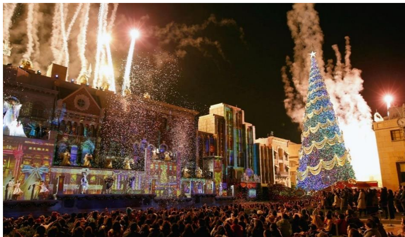
รูปที่ 50 เทศกาลคริสต์มาส