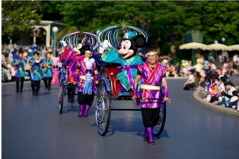
รูปที่ 39 ขบวนพาเลทในเทศกาลทานาบาตะ