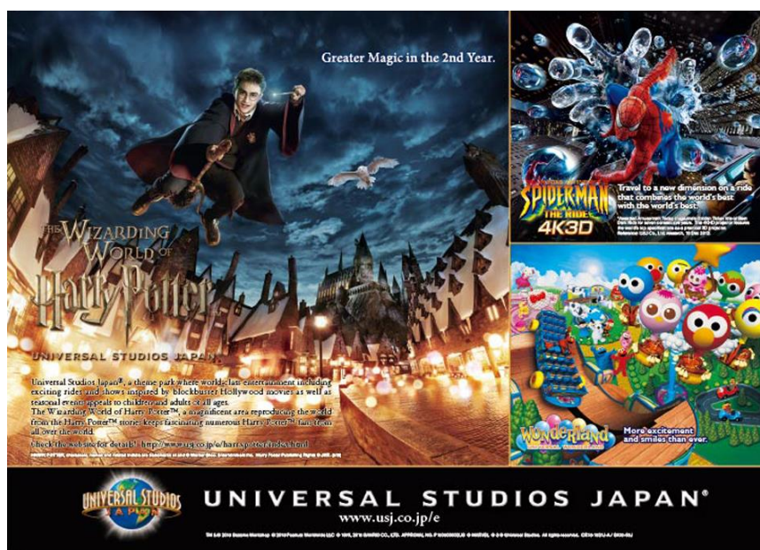
รูปที่ 48 โปสเตอร์แฮรี่พอตเตอร์