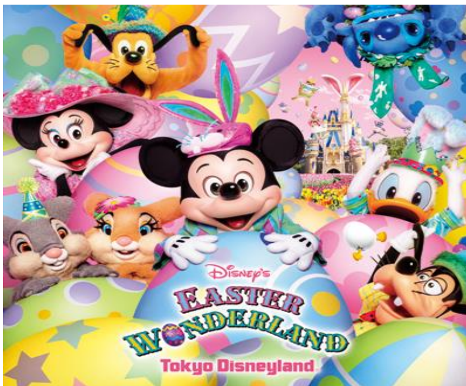
รูปที่ 13 ภาพโปรโมทเทศกาล Easter