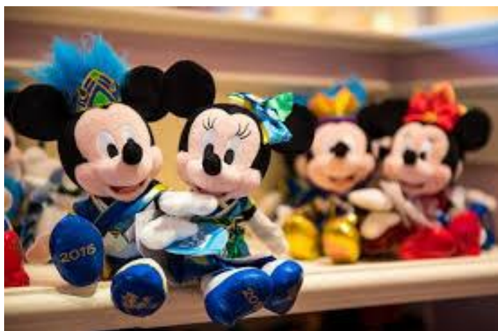
รูปที่ 21 ของที่ระลึกในเทศกาลฤดูร้อน