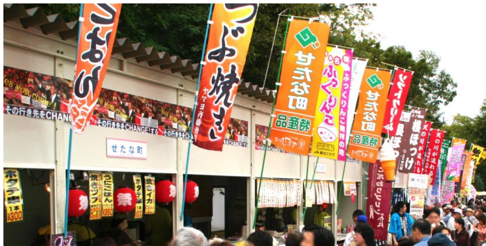
ภาพที่ 30 บรรยากาศร้านค้าในออทั้น์เฟสต์