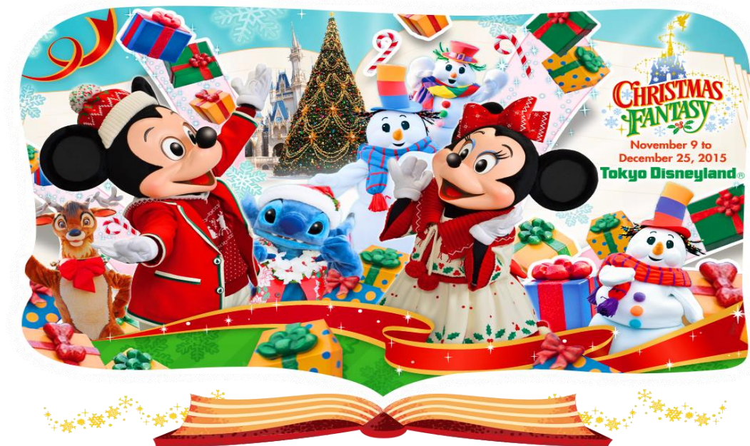
รูปที่ 7 ภาพโปรโมทเทศกาลคริสต์มาส