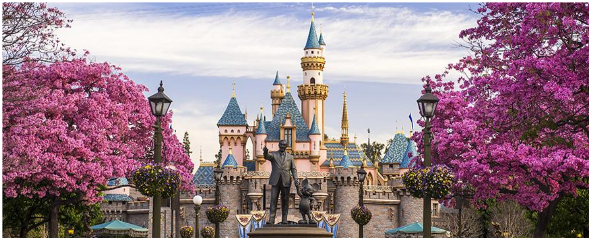
รูปที่ 1 รูปปั้นวอลต์ดิสนีย์และตัวละครมิกกี้เมาส์