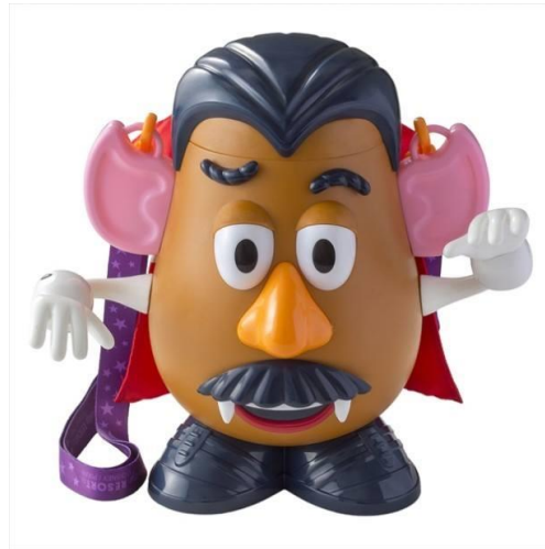
รูปที่ 4 ภาพของที่ระลึกเนื่องวันฮาโลวีน

ที่มา: www.tokyodisneyresort.jp , (2558)