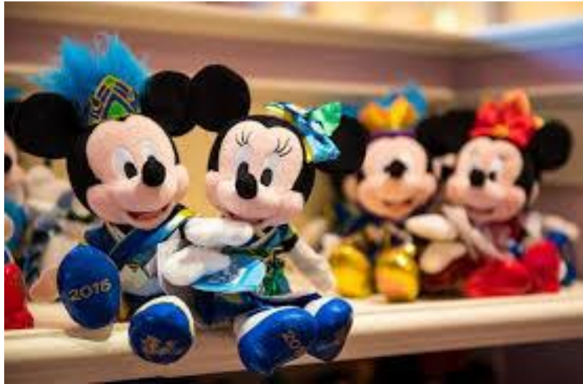
รูปที่ 42 ของที่ระลึกในเทศกาลฤดูร้อน