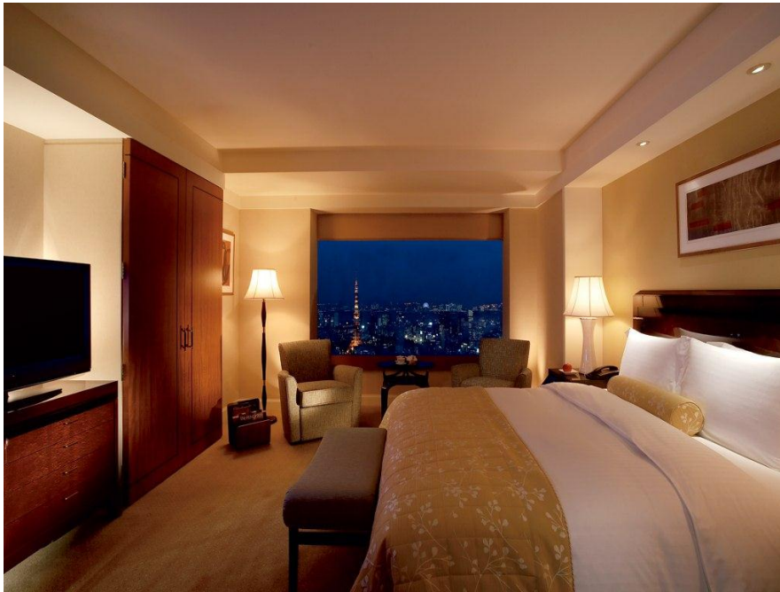
ภาพที่ 10 แสดงที่พักแบบตะวันตก