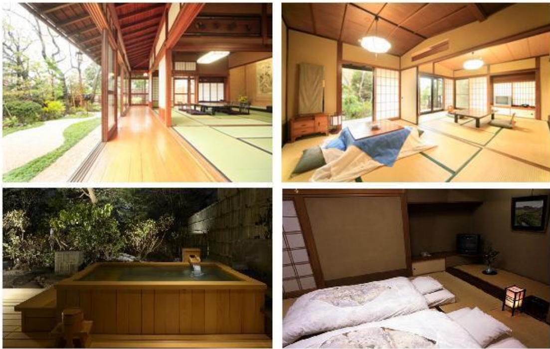
ภาพที่ 3 แสดงพื้นที่ต่างๆภายในที่พักแบบเรียวกัง