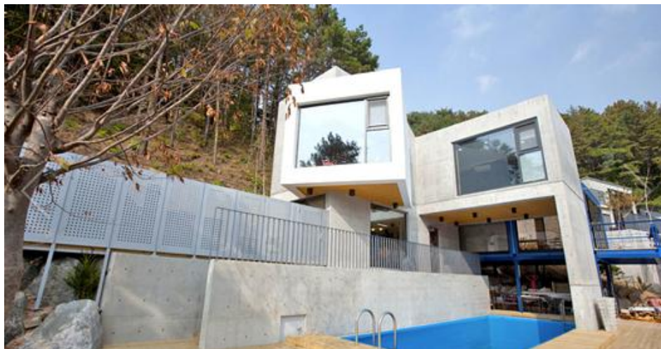
ภาพที่ 11 แสดงที่พักแบบ펜ซัน