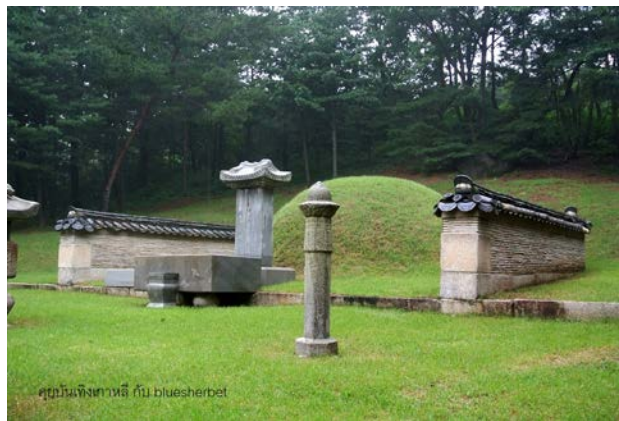
ภาพที่ 3 หลุมพระศพพระนางจางฮีบิน

สถาปนาแห่งพระมเหสีอินฮยอน พระเจ้าชูกจงจึงมีรับสั่งพระราชทานยาพิษให้กับพระสนมจางฮีบิน เพราะการทำไสยศาสตร์ภายในวังหลวงนั้นเป็นเรื่องต้องห้ามและเลวร้ายที่สุด พระสนมจางฮีบิน หรือจางอึ๊กจงสิ้นพระชนม์ในปี 1703 อย่างไรก็ตามในบันทึกประวัติศาสตร์ ไม่ได้บันทึกว่าพระนางเป็นหนึ่งในพระมเหสีของพระเจ้าชูกจง เพราะพระนางได้รับแต่งตั้งและโค่นปลดโดยเหตุผลทางการเมืองในยุคของพระเจ้าชูกจง ถึงแม้พระโอรสของพระสนมฮีบินได้ขึ้นครองราชย์เป็นจักรพรรดิคือพระเจ้าคยองจง แต่พระอิสริยยศของพระสนมจางฮีบินที่ได้รับไม่สามารถขึ้นเป็นพระพันปีได้ เป็นเพียง “พระราชเทวีอีกชนาน” เท่านั้น เพราะตำแหน่งพระพันปีนั้นจะต้องเป็นผู้ที่เคยดำรงตำแหน่งพระมเหสีมาก่อน แม้ว่าจะเป็นมารดาขององค์จักรพรรดิที่ขึ้นครองราชย์ก็ตาม