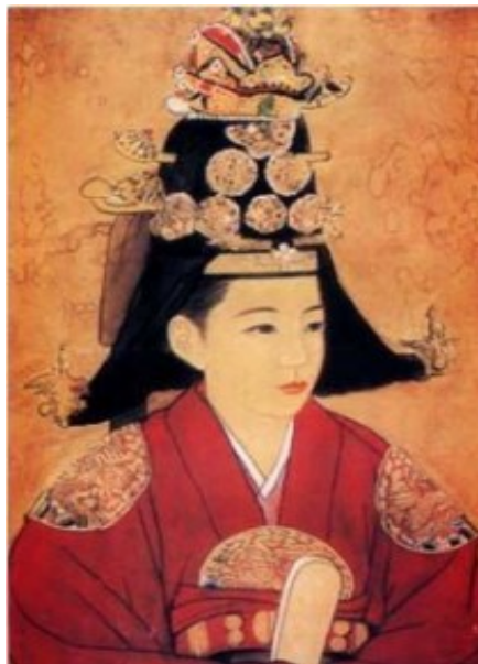
ภาพที่ 2 พระฉายาสถาปัตยกรรม พระมเหสีอินฮยอน

เป็นพระมเหสีแทน หลังจากพระมเหสีอินฮยอนหรือพระมเหสีพระองค์ที่สอง ของพระเจ้าซุกจง ถูกปลดออกจากตำแหน่ง ในปี 1689 พระสนมจางฮีบินจึงได้เลื่อนขึ้นเป็นพระมเหสีแห่งโชซอน และองค์ชายรัชทายาทได้รับการแต่งตั้งในปี 1690 พระมเหสีจางครองตำแหน่งพระมเหสีแห่งโชซอน 6 ปี ระหว่างปี 1689-1694 ต่อมาในภายหลังพระเจ้าซุกจงทรงคืนพระอิสริยยศให้พระมเหสีอินฮยอน และเรียกตัวกลับเข้าวังหลวง และแต่งตั้งองค์รัชทายาทหรือพระโอรสของพระสนมจางฮีบินเป็นพระโอรสบุญธรรมในพระมเหสีอินฮยอนแทนเพื่อให้องค์รัชทายาทได้มีพระอิสริยยศอย่างสมบูรณ์ แบบกล่าวคือ การที่องค์รัชทายาทจะได้รับการแต่งตั้งได้นั้นต้องมีพระมารดาซึ่งเป็นพระมเหสีของแผ่นดินถึงจะ ได้รับตำแหน่งองค์รัชทายาทอย่างไม่มีข้อกังขา และลดตำแหน่งของพระมเหสีจางลง เป็นพระสนมเอกหรือจางฮีบินตามเดิม