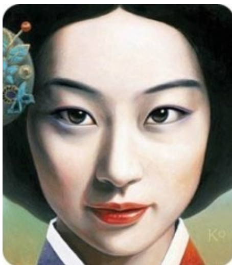
ภาพที่ 1 พระฉายาสถิตลักษณ์ พระสนมจางฮีบิโนหรือ จางอ๊กจอง

หลังจากพระสนมจางซุกวอนให้กำเนิดพระโอรสผู้ได้รับตำแหน่งองค์รัชทายาทอย่างสมบูรณ์แล้ว ในปี 1689 พระเจ้าชุกจงก็ได้แต่งตั้งพระสนมจางซุกวอนเป็นพระสนมสูงสุดหรือพระสนมจางฮีบิโน ในช่วงนี้พระสนมจางฮีบิโนมีอำนาจมากในการต่อสู้กับขุนนางฝ่ายตะวันตกในราชสำนัก พระนางทรงทำทุกทางเพื่อปกป้องตนเองและไม่ให้พระโอรสของตนเองถูกปลดจากตำแหน่งองค์รัชทายาท จากกลุ่มขุนนางที่คอยขัดขวางอำนาจ พระนางทรงทะเยอทะยานมักใหญ่ใฝ่สูงมีแผนการและใช้ทุกวิถีทางปลดพระมเหสีอินฮยอนลงจากตำแหน่งพระมเหสีเพื่อให้ตนเองได้ขึ้นเป็นพระมเหสีแทน เนื่องจากการเมืองในราชสำนักดุเดือดสุดท้ายพระมเหสีอินฮยอนก็ถูกพระเจ้าชุกจงเนรเทศออกจากวังหลวง เมื่อตำแหน่งพระมเหสีว่าง พระสนมฮีบิโนซึ่งดำรงตำแหน่งพระมเหสีสูงสุดก็ได้รับการแต่งตั้งขึ้นเป็น “พระมเหสีจาง” ถึงแม้จะดำรงตำแหน่งพระมเหสีเพียงระยะเวลา 6 ปี ในปี 1689 ถึง 1694 แต่ก็ถือว่าเป็นความปรารถนาสูงสุดในชีวิตของพระนาง