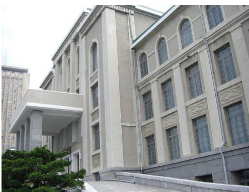
ภาพที่ 4 : มหาวิทยาลัยคิมอิลซง มหาวิทยาลัยแห่งแรกของเกาหลีเหนือ ตั้งชื่อตามผู้นำคนแรก

ระบบการศึกษาภายในเกาหลีเหนือมีลักษณะเช่นเดียวกับประเทศอื่นๆ สามารถแบ่งออกได้เป็น 4 ระดับ คือ ระดับอนุบาล ระดับประถม ระดับมัธยม และระดับมัธยมศึกษา โดยในระดับอนุบาลนั้นจะเป็นการเตรียมความพร้อมของเด็กในการฝึกใช้มือ เน้นการฝึกให้เด็กเรียนรู้การอยู่ร่วมกันกับผู้อื่นในสังคม มีการฝึกอ่านเขียน ภาษาเกาหลี และร้องเพลงเกี่ยวกับพรรคคอมมิวนิสต์ ความยิ่งใหญ่ของชาติ ความยิ่งใหญ่ของท่านผู้นำ สำหรับการศึกษาระดับนี้ยังไม่สามารถจัดให้ได้ทั่วประเทศ ดังนั้นผู้ปกครองที่อยู่ชนบทจึงนิยมดูแลอบรมลูกหลานด้วยตัวเอง ต่อมาในระดับประถมศึกษา เด็กจะได้เรียนภาษาประจำชาติ ประวัติศาสตร์ ภูมิศาสตร์ คิดเป็น 40 เปอร์เซ็นต์ของเนื้อหาวิชาทั้งหมด ที่เหลือเป็นวิชาคณิตศาสตร์-วิทยาศาสตร์ และวัฒนธรรม-กิจกรรมทางทหาร