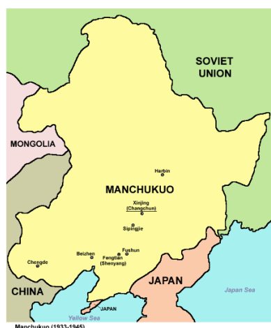
ภาพที่ 3 : แผนที่แสดงให้เห็นชายแดนของเกาหลีเหนือที่ติดกับดินแดนแมนจูแก้วและโซเวียต

เกาหลีถูกแบ่งออกเป็นสองส่วนโดยชาติมหาอำนาจจากตะวันตกทั้งสองคือ สหภาพโซเวียต และสหรัฐอเมริกาซึ่งมีอุดมการณ์ทางการเมืองผิดกันคนละขั้ว ดังนั้นระบบที่เกาหลีเหนือและเกาหลีใต้รับมาใช้จึงเป็นแบบเดียวกันกับชาติผู้ดูแลที่คอยหนุนหลังให้ความช่วยเหลือเรื่องต่างๆ โดยอุดมการณ์ทางการเมืองที่เป็นปฏิปักษ์ต่อกันนั้นก็มิได้ซึมซาบเข้าสู่ความเป็นประชาชนของทั้งสองประเทศอย่างซ้ๆ ด้วยเหตุนี้เอง ยิ่งเกาหลีเหนือ-ใต้ปล่อยเวลาให้ผ่านไปนานเท่าไร ความเห็นห่างก็ยิ่งขยายกว้างมากขึ้น ส่งผลกระทบต่อการรวมชาติให้กลับมาเป็นปึกแผ่นมากขึ้นเท่านั้น