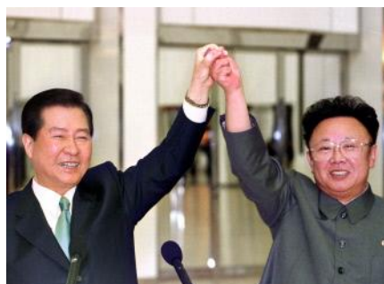
ภาพที่ 2 : คิมแฉงจับมือครั้งประวัติศาสตร์กับผู้นำเกาหลีเหนือคิมจองอิล