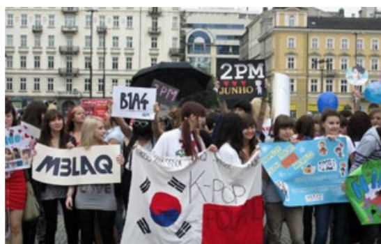
ภาพที่ 5 : แฟนคลับชาวต่างชาติถือธงชาติและป้ายชื่อนักร้องวงต่างๆของเกาหลีใต้

ด้านเศรษฐกิจ สถานการณ์หลังสงครามเกาหลีเต็มไปด้วยความยากลำบากชัดเจน รัฐบาลจึงส่งเสริมให้ประชาชนทำการเพาะปลูก ผลิตอาหาร เพื่อให้มีกินมีใช้ไปวันๆ และสนับสนุนให้นายทุนชาวอเมริกันเข้ามาผลิตสินค้าในเกาหลีแทนการนำเข้า เวลาผ่านไปหลายปี สภาพเศรษฐกิจของเกาหลีได้ฟื้นตัวขึ้นเรื่อยๆ สหรัฐอเมริกาเห็นว่าสามารถช่วยเหลือตัวเองได้บ้างแล้วจึงลดการช่วยเหลือแบบให้เปล่าลง ประเทศเกาหลีใต้ไม่สามารถยึดการทำเกษตรกรรมเป็นหลักเหมือนในอดีตได้ เนื่องจากมีพื้นที่น้อย จำนวนพลเมืองมาก และการที่สหรัฐอเมริกาลดการช่วยเหลือลงทำให้เกาหลีใต้จำเป็นต้องยึดนโยบายการผลิตเพื่อการส่งออกแทน ดังนั้นเพื่อวางแผนเศรษฐกิจในระยะยาว รัฐบาลจึงได้ส่งคนไปดูงาน ศึกษาความเป็นไปได้ต่างๆยังประเทศอุตสาหกรรมในยุโรป นอกจากนั้นกลุ่มนักวิชาการเกาหลีใต้ยังได้ศึกษาตัวอย่างจากญี่ปุ่นอย่างละเอียดด้วย กระทั่งในช่วงปลายทศวรรษ 1990 เกาหลีใต้ประสบความสำเร็จในการพัฒนาประเทศสูงสุด มีขนาดเศรษฐกิจใหญ่เป็นอันดับ 11 ของโลก ประชากรมีรายได้ต่อหัว 10,560 เหรียญสหรัฐต่อคน/ต่อปี ปริมาณการลงทุนทั้งภายในและภายนอกประเทศเพิ่มสูงขึ้นอย่างรวดเร็ว รวมถึงได้เข้าเป็นสมาชิกองค์การความร่วมมือทางเศรษฐกิจและการพัฒนา (OECD) ด้วย