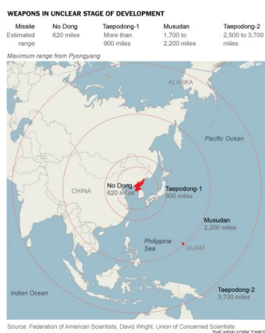
ภาพที่ 6 : แสดงระยะยิงสูงสุดของอาวุธนิวเคลียร์เกาหลีเหนือในปี 2013 มีจุดศูนย์กลางอยู่ที่กรุงเปียงยาง

ความจำเป็นที่จะปกป้องตัวเองจากการรุกรานของสหรัฐอเมริกา คราวนี้ประชาคมโลกคว่ำบาตรทั้งทางการเงินและอาวุธของเกาหลีเหนือ โดยอนุญาตให้นานาชาติสามารถตรวจค้นเรือบรรทุกสินค้าที่ผ่านเข้าออกเกาหลีเหนือได้ แรงกดดันในครั้งนี้ทำให้เกาหลีเหนือยินยอมเข้าร่วมโต๊ะเจรจาที่กรุงปักกิ่ง แต่ไม่มีอะไรคืบหน้า กระทั่งวันที่ 13 กุมภาพันธ์ 2007 การเจรจาซึ่งจัดขึ้นอีกครั้งก็บรรลุข้อตกลงประเด็นสำคัญคือ เกาหลีเหนือจะปิดเตาปฏิกรณ์ไฟฟ้าปรมาณู ขอมยุติโครงการนิวเคลียร์และยอมปรับความพันซ์ แลกกับความช่วยเหลือด้านพลังงานเป็นน้ำมันเชื้อเพลิง 50,000 ตัน และจะได้รับเพิ่มอีก 950,000 ตัน หลังจากแสดงให้เห็นว่าปิดโรงงานเกี่ยวกับนิวเคลียร์ทั้งหมด แต่หลายประเทศก็ไม่เชื่อว่าเกาหลีเหนือจะยอมทำตามข้อตกลง ซึ่งก็เป็นเรื่องจริงเมื่อเกาหลีเหนือได้ทดลองระเบิดนิวเคลียร์ได้คืนอีกครั้งในวันที่ 12 กุมภาพันธ์ 2013 ปฏิริยาตอบสนองจากนานาชาติในคราวนี้เป็นไปในทางลบอย่างมาก กระทรวงกลาโหมของญี่ปุ่น ได้ส่งกองบินขึ้นไปตรวจวัดค่ากัมมันตรังสี ส่วนกองทัพเกาหลีใต้ก็ได้ยกระดับความพร้อมสูงสุด 14