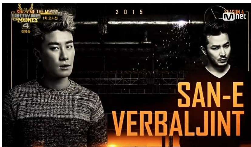
ภาพที่ 3 : โปรดิวเซอร์ ซึ่งเป็นผู้คอยให้คำชี้แนะและตัดสินการแข่งขันของทีม Brand New Music ได้แก่ Verbal Jint และ San E