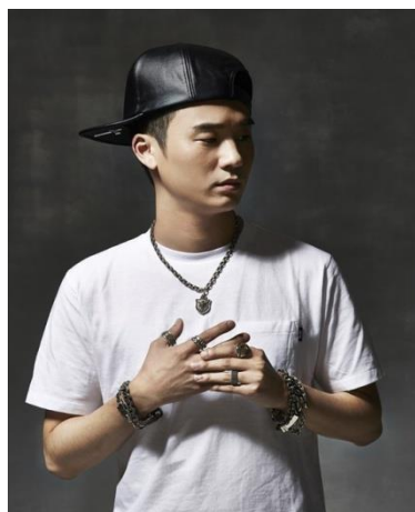
ภาพที่ 10 : Basick