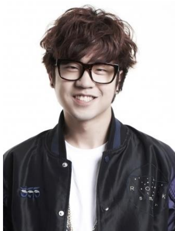
ภาพที่ 11 : Lil boi