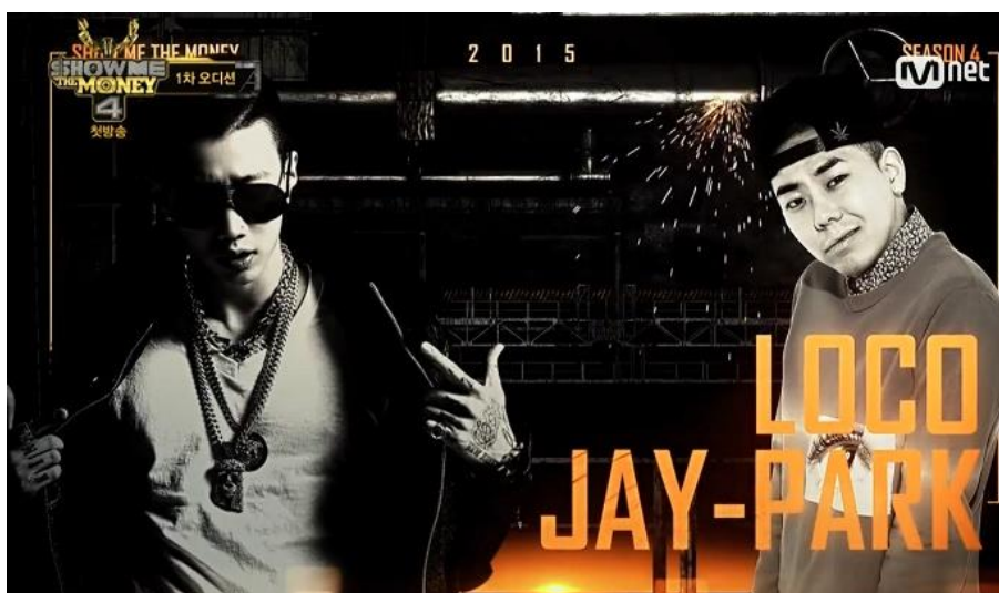
ภาพที่ 5 : โปรดิวเซอร์ ซึ่งเป็นผู้คอยให้คำชี้แนะและตัดสินการแข่งขันของทีม AOMG ได้แก่ Jay Park และ Loco