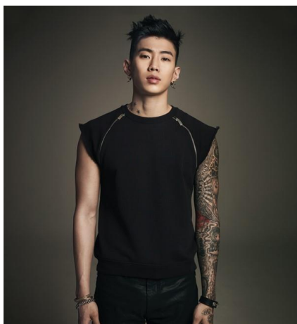
ภาพที่ 9 : Jay Park