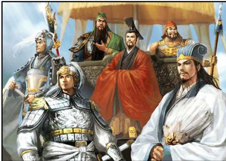
ภาพที่ 13 เล่าปี่ได้ครองเสฉวน

ในศึกครั้งนี้โจโฉได้ยกกองทัพมาโจมตีเมืองซินเอี๋ยของเล่าปี่ โดยที่โจโฉจัดกองทัพออกเป็นสี่กอง และกองหลวงอีกกองหนึ่งซึ่งมีกำลังทหารทั้งหมดเกือบห้าสิบล้านนาย ดังนั้นเมื่อขงเบ้งรู้ว่ากองทัพของโจโฉที่ยกมาโจมตีเมืองซินเอี๋ยในครั้งนี้มีกำลังมากถึงเพียงนี้ ขงเบ้งจึงได้เสนอให้เล่าปี่รีบย้ายหนีไปอยู่ที่เมืองฮ้วนเซีย ซึ่งมีชัยภูมิและเสบียงอาหารบริบูรณ์กว่าทันที ซึ่งจากการถอยของขงเบ้งในครั้งนี้จึงทำให้เล่าปี่มีโอกาสดำรงเจ้าเมืองเกงจิวและมณฑลเสฉวนที่กว้างใหญ่ไพศาลและยังเต็มไปด้วยทรัพยากรต่างๆ อันมีค่าเป็นจำนวนมากในภายหลังด้วย