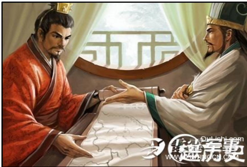
ภาพที่ 1 เล่าปี่และขงเบ้ง

ขงเบ้งนำเมืองไปติดสินบนขุนกวนในศึกครั้งหนึ่งที่โจโฉต้องการเข้าตีเสฉวน เนื่องจากโจโฉได้บุกเข้าตีเมืองฮันตั้งของเตียวล่อ อันเป็นแคว้นติดกับทางเหนือของเสฉวน และเมื่อโจโฉได้เมืองฮันตั้งที่อยู่ติดกับเสฉวนนี้ไป ก็ทำให้เล่าปี่ที่เพิ่งมาครองเมืองเสฉวนได้ไม่นานเกิดความวิตกกังวล ขงเบ้งจึงปลอมใจเล่าปี่และพยายามคิดหาอุบายเพื่อไม่ให้โจโฉยกทัพมาทำอันตรายเสฉวน