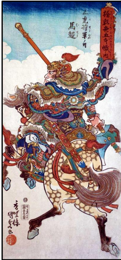
ภาพที่ 7 ภาพเขียนญี่ปุ่นของม้าเฉียว