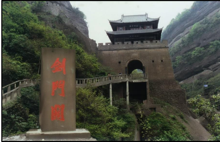
ภาพที่ 11 ด้านแฮ้งก้วน