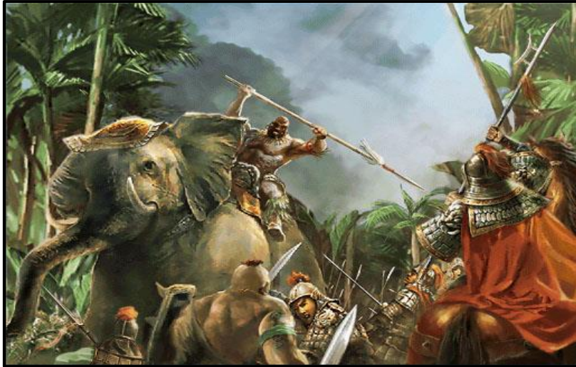
ภาพที่ 6 เบ็ญเฮงก่อกบฏ