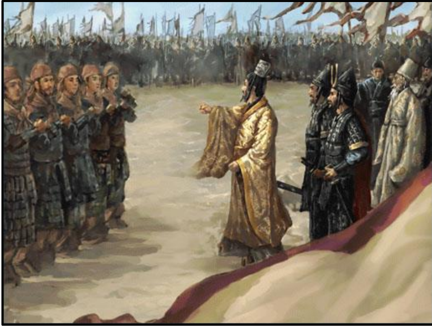
ภาพที่ 3 ขงเบ้งยกทัพตีแคว้นเว่ยครั้งที่ 4