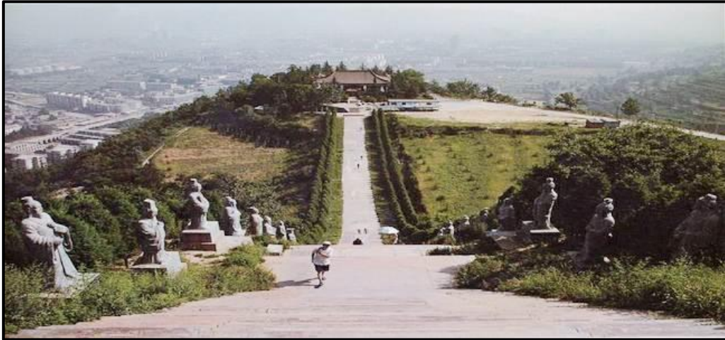
ภาพที่ 8 เนินทุ่งอ้อจ้งหยวน สมรภูมিরบครั้งสุดท้ายของขงเบ้งในการนำทัพ

ได้ควมมำลงมำจากเนินเขาร่วมกับตะโกนว่า “สุมาอ้ออย่าหนีเลย เข้ากลางเบ้งอย่างดินไม่ออกแล้ว” เพราะคำประกาศนี้ทำให้ทหารเว่ยทุกคนที่ได้ยินต่างพากันทิ้งอาวุธหนีเอาตัวรอด