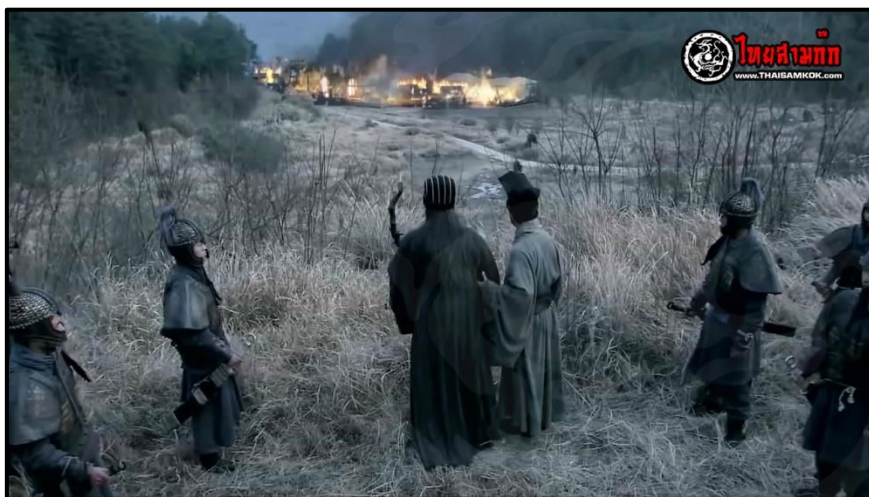
ภาพที่ 9 ขงเบ้งเผาทัพของสุมาอี้ในหุบเขาเฮาโลก๊ก จากจากซีรีส์จีน เรื่อง “สามก๊ก”

ฝ่ายขงเบ้งเมื่อเห็นว่าสุมาอীনำกำลังทหารออกมาโจมตีตนเองเช่นนี้แล้ว เขาก็แบ่งทหารของตนออกเป็นสามกอง โดยกองแรกมีหน้าที่ป้องกันค่ายใหญ่ที่เขาเกิสาน ส่วนกองทัพที่สองนั้นขงเบ้งให้ลอบไปโจมตีค่ายของสุมาอี้ และกองทัพที่สามซึ่งเป็นของขงเบ้งนั้น ก็ซุ่มรอกองทัพของสุมาอี้อยู่ที่ชอกเขาเฮาโลก๊ก และด้วยแผนการอันรัดกุมเช่นนี้ของขงเบ้ง ก็ทำให้สุมาอี้และบุตรชายทั้งสองของเขาตกลงไปในหลุมพรางของขงเบ้งอย่างง่ายดาย โดยเมื่อขงเบ้งเห็นว่าสุมาอี้และขบวนทหารเคลื่อนทัพเข้ามาในค่ายซึ่งเขาซุ่มรออยู่แล้ว ขงเบ้งก็สั่งให้ทหารโยนคบเพลิงลงไป ในค่ายแห่งนี้ทันที ดังนั้นแล้วเมื่อภายในค่ายแห่งนี้เต็มไปด้วยเชื้อเพลิงและวาร์ไวไฟชนิดต่างๆ เปลวเพลิงอันร้อนแรงจึงลุกโชนขึ้นคลอกสุมาอี้และทหารของเขาทั้งหมด ทว่าโชคชะตาของสุมาอื่ยังคงยังไม่ถึงที่สุด เนื่องจากว่ามีฝนตกลงมาอย่างหนักจนกระทั่งน้ำท่วมสูงถึงหนึ่งศอกและทำให้เปลวเพลิงทั้งหลายมอดดับไป