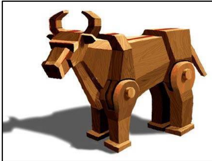
ภาพที่ 5 โคยนต์