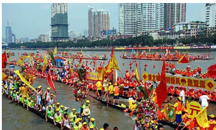
ภาพที่ 5 เทศกาลแข่งเรือมังกร

การแข่งเรือมังกรซึ่งเป็นฤดูน้ำหลาก จะเกี่ยวกับการเพาะปลูกจึงมีการใช้สีแดงรวมอยู่ด้วย ดังนั้นการแข่งขันเรือมังกรนั้นเรือที่เข้าแข่งนี้จะประดิษฐ์และตกแต่งเหมือนรูปมังกร คือ ตอนหัวเรือจะทำเป็นหัวมังกรสีแดงกำลังอ้าปากมีเขี้ยวยาว ลำเรือจะทาสีเป็นเกล็ดมังกร ส่วนตอนท้ายจะทำเป็นหางมังกรทาสีเขียวประดับด้วยธงสีต่างๆแต่ก็ใช้สีแดงยืนพื้น เพราะคนจีนนิยมใช้สีแดง ด้วยถือว่าสีแดงเป็นสีแห่งอำนาจสามารถปกป้องรักษาหรือขับไล่ภูตผีปีศาจได้ชะงัด