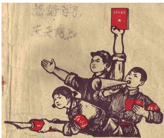
ภาพที่ 1 กลุ่มเรดการ์ด

สีแดงเป็นสีที่แสดงถึงความเชื่อมั่นและพลังอำนาจยิ่งหลังช่วงศตวรรษที่ 19 เป็นต้นมาสีแดงถูกใช้เป็นสัญลักษณ์ของเลือดรักชาติการปฏิวัติสีแดงจึงถูกใช้เป็นสีของธงทหารสีธงชาติธงพรรคหรือหน่วยพิทักษ์แดง (เรดการ์ด)คือ กลุ่มพลเรือนที่เป็นแนวหน้าในการปฏิวัติวัฒนธรรมในประเทศจีนโดยได้รับการสนับสนุนจากเหมาสีแดงถูกเลือกมาโดยพรรคคอมมิวนิสต์ของประเทศจีน เพราะสีแดงมีความหมายถึงเลือด จึงต้องการเน้นความรักชาติโดยใช้เลือดเป็นสัญลักษณ์ ซึ่งมีความหมายสอดคล้องกับวัฒนธรรมจีนจึงถูกนำมาใช้