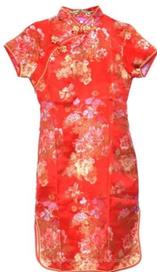
ภาพที่ 9 ชุดกี่เพ้า

ในยุคการปฏิวัติวัฒนธรรมนั้นผู้คนถูกจำกัดเครื่องแต่งกาย ทำให้ชุดสวยงามแบบเดิมหายไปแต่ในประเทศไต้หวัน ฮองกงยังมีชุดกี่เพ้าอยู่ โดยชุดกี่เพ้ามาจากคนจีนโพ้นทะเล ยังเน้นสีแดงแต่อิทธิพลจากการปฏิวัติวัฒนธรรมทำให้คนจีนแผ่นดินใหญ่จะมีความคิดเกี่ยวกับสีแดงที่เปลี่ยนไปโดยไม่ได้มองสีแดงในเรื่องความเชื่อและชนชั้นอีกต่อไปแต่จะเน้นเรื่องความสวยงามเป็นหลัก เช่น ชุดกี่เพ้า เป็นต้น กี่เพ้าเป็นเครื่องแต่งกายที่เกิดจากการหลอมรวมเป็นหนึ่งในชนชาติต่างๆของจีนและถือเป็นมรดกทางวัฒนธรรมการแต่งกายของชาวจีนกี่เพ้าเป็นงานตัดเย็บที่รวมเอาศิลปะหลายแขนงไว้ด้วยกันไม่ว่าจะเป็นหัตถกรรมการปักกลดลาย ภาพดอกไม้และนกหรือภาพอื่นๆซึ่งล้วนสะท้อนให้เห็นถึงเอกลักษณ์ทางวัฒนธรรมของจีน โดยชุดกี่เพ้าในปัจจุบันเป็นชุดที่ออกแบบไปตามแฟชั่นมากขึ้นแต่สีของชุดกี่เพ้าก็ยังคงเป็นสีแบบชุดกี่เพ้าโบราณเช่นชุดกี่เพ้าที่ใช้สีแดงสดสีเขียวสดและสีฟ้าสดตัดกับสีแดงและสีดำนอกจากนี้ยังมีการนำผ้าหลายชนิดมาใช้ในการตัดเย็บและมีรูปแบบหลากหลายให้เลือกไม่ว่าจะเป็นชุดกี่เพ้าสั้นชุดกี่เพ้ายาวหรือชุดกี่เพ้าที่ออกแบบตามฤดูกาลทั้งสี่ได้แก่ฤดูใบไม้ผลิฤดูร้อนฤดูใบไม้ร่วงและฤดูหนาว