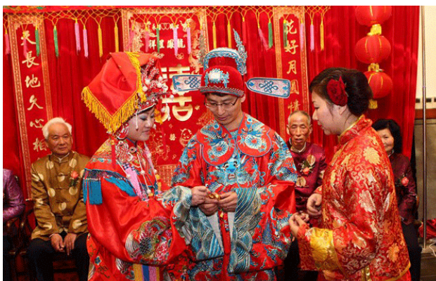
ภาพที่ 4 พิธีแต่งงานแบบจีน

สีแห่งมงคลของชาวจีนคือสีแดงสีแดงถูกนำมาใช้ในพิธีต่างๆที่แสดงความเป็นมงคล เช่น การเปิดกิจการใหม่จะมีการติดกระดาษแดง โบแดงริบบิ้นแดงผ้าคลุมป้ายแดงผ้าปูโต๊ะแดงถ้าเป็นสมัยก่อนก็จะสวมชุดแดงด้วยและในพิธีแต่งงานจะมีสีแดงมากมาย เช่น ชุดของเจ้าบ่าวเจ้าสาว ตัวอักษรที่ใช้ประดับในงานหมวกดอกไม้รวมไปถึงเกี่ยวเจ้าสาว