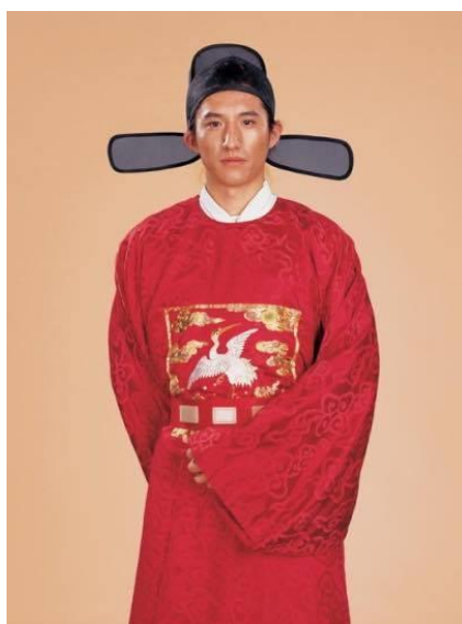
ภาพที่ ชุดขุนนางในสมัยราชวงศ์หมิง

สมัยราชวงศ์หมิง (ค.ศ.1368 – ค.ศ.1645) ในสมัยหมิงได้ให้ความสำคัญกับการฟื้นฟูวัฒนธรรมของชาวฮั่นดังนั้นเครื่องแต่งกายจะมีกลิ่นอายการผสมผสานระหว่างสมัยฮั่นถึงและซ่ง เสื้อผ้าชายจะเน้นเสื้อคลุมยาวเป็นหลักข้าราชการจะเน้นสวมใส่ชุด“ปู้ฝู” สวมหมวกผ้าแพรบาง สวมเสื้อคอกลมลายผ้าตรงกลางเสื้อคลุมยาวบ่งบอกถึงยศตำแหน่งทางราชการสมัยนั้นผู้ชายทั่วไปยังนิยมสวมหมวกผ้าแบบสีเหลี่ยมอีกด้วยในส่วนของชุดแต่งกายสตรีสวมเสื้อกันหนาวที่มีซิปในแบบจีนพกผ้าคลุมที่มีไว้พาดไหล่สีแดงหรือฟ้าและสวมกระโปรงเป็นต้น