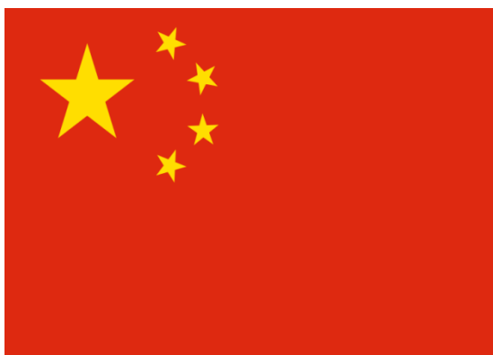
ภาพที่ 8 ธงชาติสาธารณรัฐประชาชนจีน ค.ศ.1949 – ปัจจุบัน