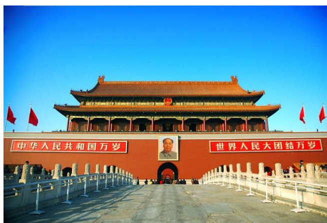
ภาพที่ 2 พระราชวังต้องห้าม

สีแดงเป็นสีที่มีนัยยะแห่งความศักดิ์สิทธิ์ ซึ่งสังเกตได้จากวัดพระราชวังพระตำหนัก หรือสิ่งปลูกสร้างสมัยก่อนของจีนจะมีเสาหลังคาหรือว่าส่วนประกอบต่างๆที่เป็นสีแดง เช่น บริเวณกำแพงของพระราชวังต้องห้ามหรืออาคารที่เทียนอันเหมิน เพราะในสมัยก่อนนั้นพระราชวังเป็นที่อยู่ของฮ่องเต้และมีความเชื่อว่าสีแดงเป็นสัญลักษณ์ของความปิติยินดีและความมั่งมี