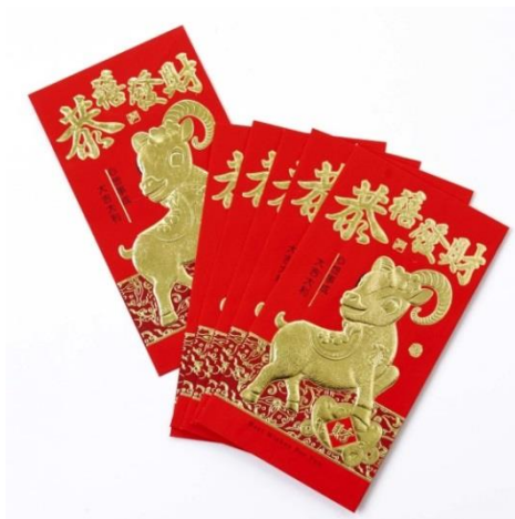
ภาพที่ 3 ซองอั่งเปา