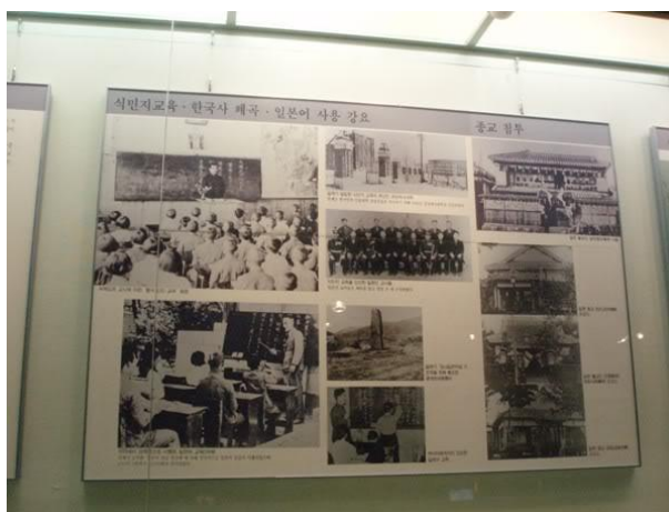
ภาพประกอบที่ 4

ซึ่งเป็นกลยุทธ์กีดกันชาติวิธีหนึ่งที่ญี่ปุ่นต้องการสลาย ทำลายเชื้อชาติ เอกลักษณ์ วัฒนธรรม ของเกาหลีในสมัยนั้น