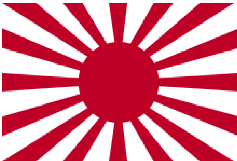
ภาพประกอบที่ 1

ธงนี้ออกใช้ครั้งแรกเมื่อวันที่ 7 ตุลาคม พ.ศ. 2432 และใช้มาจนสิ้นสุดสงครามโลกครั้งที่ 2 ภายหลังจากได้นำกลับมาใช้อีกครั้งในฐานะธงของกองกำลังป้องกันตนเองทางทะเล เมื่อวันที่ 30 มิถุนายน พ.ศ. 2497 สำหรับคนที่อยู่นอกประเทศญี่ปุ่นแล้วล้วนมีความรู้สึกกับธงนี้ในแง่ลบ จากความรุนแรงที่กองทัพญี่ปุ่นก่อขึ้นในช่วงสงครามโลกครั้งที่ 2 โดยเฉพาะอย่างยิ่งกับคนที่เคยต่อสู้ หรือถูกทารุณกรรมโดยทหารญี่ปุ่น และประเทศที่เคยถูกญี่ปุ่นยึดครอง