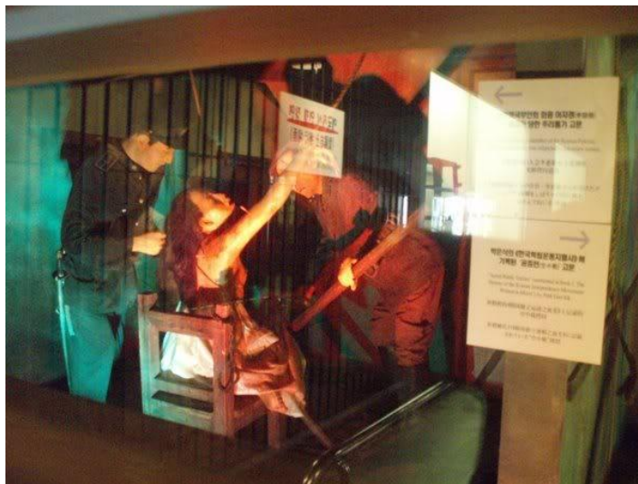
ภาพประกอบที่ 2 (เข้าถึงได้จาก : http://sz4m.com/b454253 )