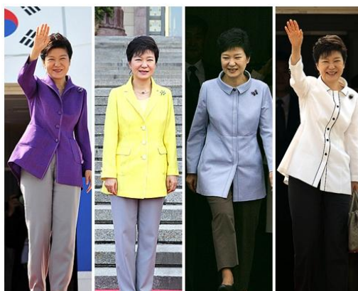
รูปที่ 2 : ปาร์ค กึนฮเย