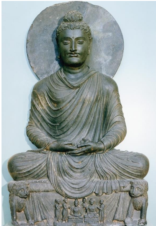
พระพุทธรูปศิลาจากคันธาระ หินสีเขียวสีเทา คริสต์ศตวรรษที่ 2 พิพิธภัณฑ์สถานแห่งชาติ สกอตแลนด์