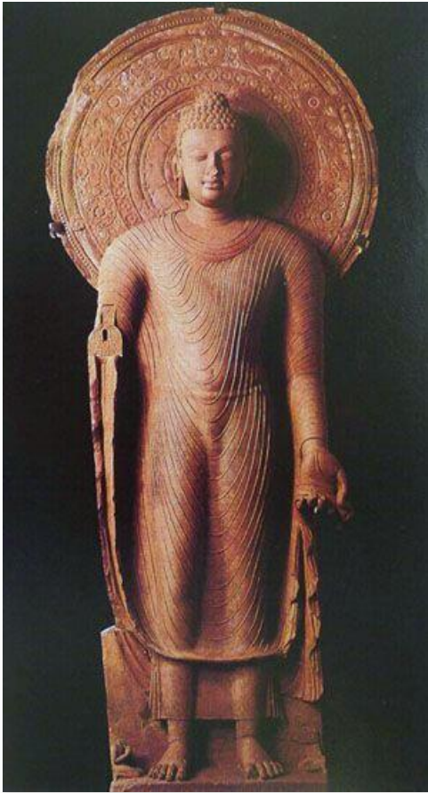
พระพุทธรูปกับพระรัศมี จากมถุรา สมัยคุปตะ คริสต์ศตวรรษที่ 5