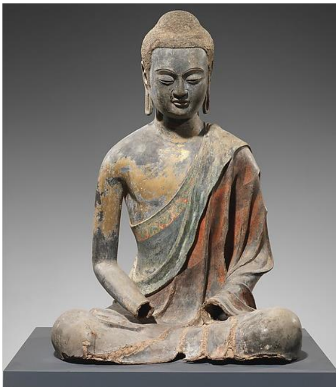
พระพุทธรูป สมัยถัง จาก พิพิธภัณฑ์ศิลปะเมโทรโพลิทัน นิวยอร์ก สหรัฐอเมริกา