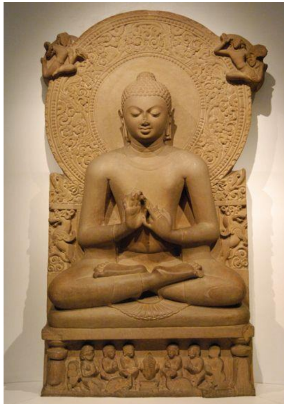
ประติมากรรมหินทรายชุนาร์ พระพุทธรูป ประทับนั่งปางปฐมเทศนาจากสารนาถ สมัยคุป ตะ ประมาณคริสต์ศตวรรษที่ 5 สูง 1.60 เมตร อยู่ ที่พิพิธภัณฑสถาน โบราณคดีสารนาถ

ประติมากรรมแบบพุทธศิลป์สมัยคุปตะได้สร้างขึ้นเป็นจำนวนมาก แพร่หลายไปทั่วอินเดียทั้งภาคเหนือและภาคกลาง ตลอดจนถึงอิทธิพลไปยังชาติต่างๆ ที่นับถือพุทธศาสนา เช่นจีน ถึงแม้ว่าอาณาจักรคุปตะจะถูกกองทัพมุสลิมทำลายพุทธสถาน จนทำให้พุทธศิลป์ด้านต่างๆ ไม่มีการสืบสานต่อ แต่จากการค้นพบวัตถุโบราณเป็นศิลปวัตถุคุปตะเป็นจำนวนมาก แสดงให้เห็นความรุ่งเรืองของคุปตะ และเป็นแบบอย่างในสมัยต่อมา สมกับการยกย่องให้เป็นยุคทองหรือสมัยคลาสสิกของอินเดีย ซึ่งเป็นแบบอย่างให้การสร้างงานศิลปะในสมัยต่อมาอีกหลายร้อยปี