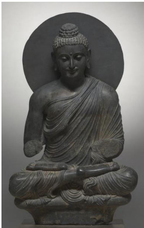
พระพุทธรูปประทับนั่ง ศิลปะคันธาระ สมัยกุษาณ สูง 129.30 ซม. ประมาณคริสต์ศตวรรษที่ 1-3 จาก พิพิธภัณฑ์ศิลปะแคลิฟอร์เนีย