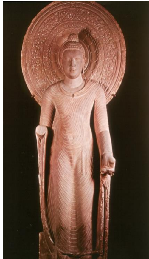
ประติมากรรมหิน พระพุทธรูป จากเมืองมถุรา สมัย คุปตะ คริสต์ศตวรรษที่ 5