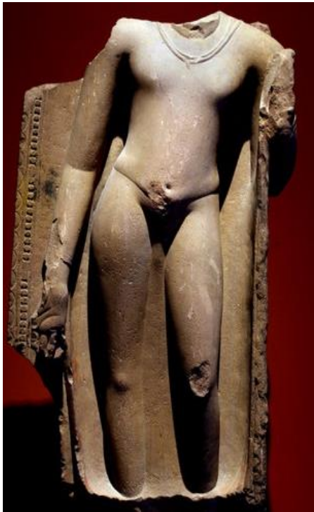
ประติมากรรมหินทรายขุนาร์ พระพุทธรูปจาก สารนาถ สมัยคุปตะ สูง 76 ซม.อยู่ที่พิพิธภัณฑ ศิลปะคลีฟแลนด์