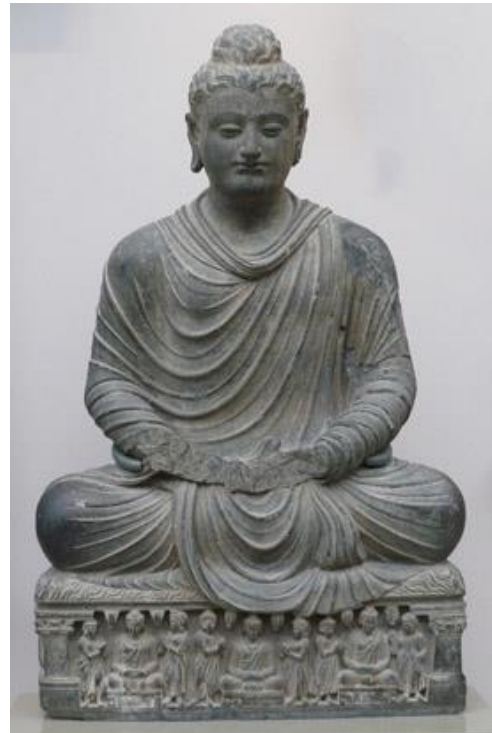
พระพุทธรูปประทับนั่ง สมัยคันธาระ

หมู่ที่ 2 คือพระพุทธรูปประทับนั่งครองจีวรห่มเฉียง ขอบของผ้าสังฆาฏิหรือจีวรรวมทั้งขอบสงฆ์ปรากฏอยู่ ทางด้านขวาเป็นสองระดับต่างกัน ผ้าสังฆาฏิหรือจีวรไม่ได้ยกขึ้นโดยช่วงพระกรหน้าเบื้องขวา เพราะเหตุว่าผ้าได้ห่มอยู่ ข้างใต้พระกรขวาแล้ว ดังนั้นจึงไม่มีริ้วเป็นรูปครึ่งวงกลมคลุมอยู่บนพระขงค์หรือพระบาท พระขงค์ทั้งสองข้างถูกคลุม ด้วยผ้าสังฆาฏิหรือจีวร แต่ข้อพระบาทและพระบาททั้งสองข้างก็มองเห็นได้อย่างชัดเจน ชายผ้าสังฆาฏิซึ่งพันอยู่รอบข้อ พระหัตถ์ซ้ายคลี่ออกไปยังฐาน เมื่อพระหัตถ์ซ้ายของพระพุทธรูปไม่วาง เพราะเหตุว่าพระพุทธรูปส่วนใหญ่ในกลุ่มนี้มัก แสดงปางประทานปฐมเทศนา พระพุทธรูปมักประทับนั่งอยู่บนฐานบัวคว่ำ