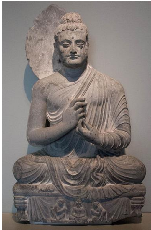
พระพุทธรูปประทับนั่ง หินชีสต์ แบบคันธาระ สูง 86.4 ซม. จาก พิพิธภัณฑ์ศิลปะเอเชีย ซานฟรานซิสโก

จากลักษณะของพระพุทธรูปแบบประทับนั่ง ทั้ง 2 หมู่ตามที่กล่าวมาข้างต้นนั้น เมื่อเปรียบเทียบจะเห็นได้ อย่างชัดเจนว่าลักษณะของจีวรทั้ง 2 แบบที่ใช้ห่มพระพุทธรูป จะมีลักษณะที่เป็นแบบห่มคลุม ซึ่งรูปแบบนี้จะเป็น การปกปิดพระวรกายทั้งองค์เผยให้เห็นเพียงแค่พระหัตถ์ทั้ง 2 ข้างที่วางซ้อนทับกัน แสดงให้เห็นเห็นริ้วของจีวรที่เป็นรูปครึ่งวงกลมคลุมอยู่บนพระชงค์หรือพระบาท และในส่วนของรูปแบบที่เป็นลักษณะแบบห่มเฉียงก็จะมีส่วนของ พระวรกายเผยให้เห็น ส่วนที่เป็นพระกร พระหัตถ์ที่ยกไว้ในระดับพระอุระ อีกอย่างหนึ่งที่เราเห็นได้ชัดเจนคือลักษณะ ของริ้วจีวรที่แตกต่างจากการห่มแบบคลุมคือไม่มีริ้วเป็นรูปครึ่งวงกลมคลุมอยู่บนพระชงค์หรือพระบาท จากลักษณะของพระพุทธรูปไม่ว่าจะเป็นพระพักตร์ พระเกศาและการห่มจีวรที่จัดได้ว่าเป็นลักษณะเด่น ของ แบบศิลปะคันธาระแล้ว ในช่วงตอนต้นการสร้างพระพุทธรูปยังจัดแสดงปางไว้เพียงแค่ 6 ปาง คือ