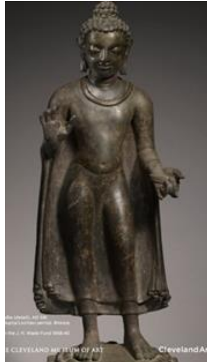
ประติมากรรมโลหะทองแดง พระพุทธรูปยืน จากสุลต่านกานซ์ รัฐพิหาร ศิลปะสมัยคุปตะ ประมาณ ค.ศ. 500 สูง 2.25 เมตร อยู่ที่ พิพิธภัณฑสถานเบอร์มิงแฮม อังกฤษ

ตัวอย่างพระพุทธรูปในนทำประทับนั่งทรงแสดงธรรม สร้างด้วยหินทรายขุนาร์ ในทำนั่งขัดสมาธิเพชร เบื้องหลังพระเศียรเป็นแผ่นศิลาวงกลมสัญลักษณ์ของพระรัศมี แสดงธรรมจักรมูทรา ปราภฏรอยพระสังฆาฏิมหึมหึ่นเล็กน้อย บริเวณพระศอ ข้อพระหัตถ์ พระชานุมณฑล และ พระชงฆ์ พระรัศมีออกแบบอย่างเรียบง่าย มีเทวดาคงค้อยประคองอยู่ แสดงถึงตอนที่พระพุทธเจ้าทรงแสดงพระปฐมเทศนาที่สารนาถ ได้บัลลังเป็นรูปคน 6 คน กำลึงถวายพระพร มีวงล้อธรรมจักรอยู่เบื้องกลางพร้อมกับกวาง 2 ตัวหมอบอยู่แสดงถึงสัญลักษณ์ของสวนกวางที่ทรงแสดงธรรมประกาศศาสนา ข้างพระวรกายสลักเป็นรูปสิงห์ช่างประติมากรที่สารนาถ นอกจากเชี่ยวชาญการแกะสลักหินแล้ว ยังมีความสามารถในการสร้างประติมากรรมโลหะด้วย