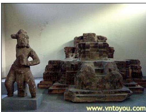
รูปที่1 พิพิธภัณฑ์ประติมากรรมของจาม (Museum of Cham Sculpture)

พิพิธภัณฑ์ประติมากรรมของจาม (Museum of Cham Sculpture) ตั้งอยู่ใจกลางเมืองดานัง สถานที่ที่รวบรวมศิลปวัตถุและเทวรูปต่างๆทางศาสนาฮินดู ในศิลปะของชนเผ่าจามที่เก่าแก่จากศตวรรษที่ 14 – 15 รวมเอาความเป็นมาของชนชาติจามที่รุ่งเรืองมาก่อนอาณาจักรใดๆ ในภูมิภาคนี้ ซึ่งส่วนใหญ่อยู่ในรูปของประติมากรรมที่แกะสลักจากหินและสำริดกว่า 300 ชิ้น อาคารพิพิธภัณฑ์ก่อสร้างขึ้นครั้งแรกเมื่อปี ค.ศ. 1915 และขยายพื้นที่เพิ่มเติมในปี ค.ศ. 1939 โดยสถาบันการศึกษาโลกตะวันออกของฝรั่งเศส นิทรรศการถูกจัดแสดงไว้ตามห้องต่างๆ ที่สะท้อนถึงยุคสมัยทั้ง 4 ยุคตามแหล่งกำเนิดของอารยธรรม ได้แก่ หมี่เซิน ตราเกียดดงเคื่อง และทาพเมิม ส่วนชั้นบนของพิพิธภัณฑ์มีการแสดงภาพที่เล่าเรื่องราวประวัติศาสตร์ความเป็น มาของชาวจามไว้อย่างน่าสนใจ ที่นี่จึงเป็นแหล่งรวมศิลปะจามที่ใหญ่ที่สุดในโลก ถัดมาด้านนอกมีระเบียบงที่สามารถชมวิวิวทัศน์