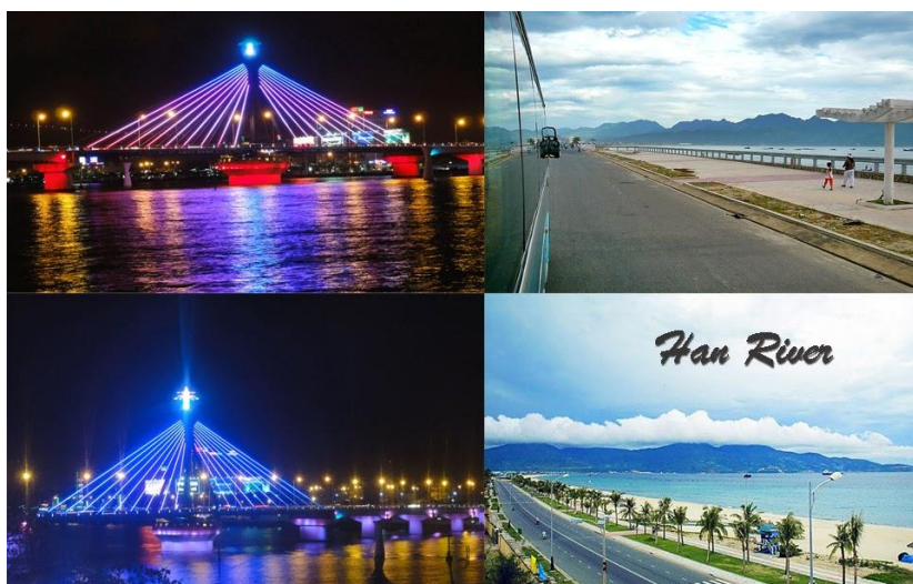
รูปที่ 2 แม่น้ำหาน (Han River)

ถูกสร้างขึ้นมาเป็นเมืองท่าแทนที่ฮอยอัน เพราะด้วยลักษณะภูมิประเทศของดานังที่มีแม่น้ำหานไหลผ่านใจกลางเมือง สะดวกต่อการขนส่งสินค้าระหว่างประเทศ แต่แม่น้ำหานก็ไม่ได้ทำหน้าที่เป็นเพียงสายน้ำเศรษฐกิจที่น่าพาความเจริญมา ผู้เวียดนามกลาง ทว่าแม่น้ำสายนี้ยังมีความสวยงามของทัศนียภาพที่ผสมผสานระหว่างเมืองท่าที่ คึกคักและธรรมชาติที่สวยงามของขุนเขาใหญ่ได้อย่างลงตัว หากคุณมาเยือนเมืองท่าดานังก็ควรหาเวลามาเดินเล่นที่ถนนเลียบบแม่น้ำหาน เพราะตั้งอยู่ไม่ไกลจากตัวเมือง เดินทางมาสะดวก มีทางเลียบบแม่น้ำที่ตกแต่งสวยงามด้วยสวนหย่อมสีเขียว วิถีทัศน์ที่สวยงามน่าชมตั้งแต่ นอกจากนี้ยังมีเรือคินเนอร์ที่ให้บริการนักท่องเที่ยวอยู่บริเวณตรงข้ามกับพิพิธภัณฑ์ประติมากรรมจาม โดยระหว่างล่องเรือคุณจะได้ลิ้มรสอาหารเวียดนามไปพร้อมกับชมความสวยงามของ แสงสีในยามค่ำคืน นับเป็นอีกหนึ่งประสบการณ์ที่น่าประทับใจ