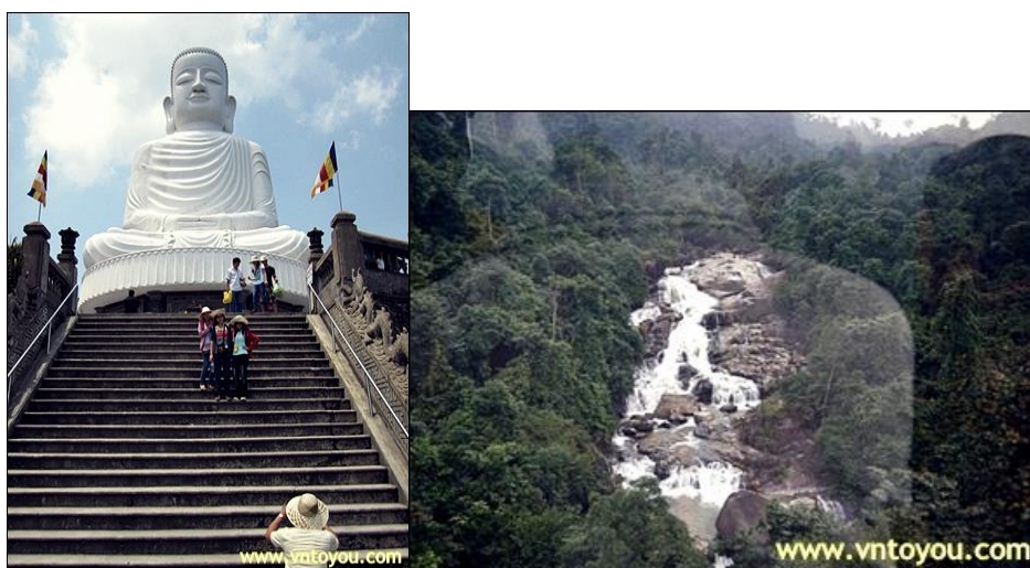
รูปที่ 7 บานาฮิลล์

คาลัท) ได้ค้นพบในสมัยที่ฝรั่งเศสเข้ามาปกครองเวียดนาม ได้มีการสร้างถนนอ้อมขึ้นไปบนภูเขา สร้างที่พักโรงแรม สิ่งอำนวยความสะดวกต่างๆเพื่อใช้เป็นสถานที่พักผ่อนในระหว่างการรบ ปัจจุบันได้มีการสร้างกระเช้าไฟฟ้า เพื่ออำนวยความสะดวกและประหยัดเวลาในการเดินทาง รวมทั้งชมวิว เมืองดานัง ชมความสวยงามของน้ำตก Toc Tien และถ้ำธาร Suoi no (ในฝัน) ชมวัดลินห์อิ่ง(วัดพระใหญ่บนเขาบานา)นมัสการพระพุทธรูปปูนขาวสูง 27 เมตร กระเช้าไฟฟ้าแห่งนี้สร้างขึ้นในปี 2007 และได้รับการบันทึกจาก guinness world ว่าเป็นกระเช้าที่ยาวที่สุดในโลกเมื่อ วันที่ 25 มีนาคม ปี 2009 โดยมีความยาว 5,042 เมตร นอกจากนี้ ยังมีสวนสนุกพร้อมเครื่องเล่นมากมาย บนยอดเขาบานาแห่งนี้