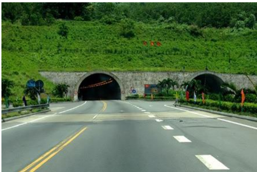
รูปที่ 9 อุโมงค์ไฮเวิน

อุโมงค์ไฮเวินเป็นอุโมงค์ที่เจาะผ่านภูเขาเพื่อเข้าสู่เมืองดานัง ยาว 6,280 เมตร สร้างโดยการกู้เงินดอกเบี้ยต่ำ จากญี่ปุ่น โดยรัฐบาล ญี่ปุ่นส่งผู้เชี่ยวชาญมาช่วยในการก่อสร้าง เป็นอุโมงค์ขุดเจาะ อุโมงค์หนึ่ง สำหรับรถไฟ อีก หนึ่งอุโมงค์สำหรับรถยนต์ ห้ามไม่ให้ รถจักรยานหรือ มอเตอร์ไซด์ อุโมงค์นี้ช่วยประหยัดเวลา ในการเดินทางได้มากกว่า หนึ่งชั่วโมง เพราะถ้าไม่วิ่งผ่านอุโมงค์นี้ ต้องวิ่งขึ้นเขา ในระยะทางกว่า ยี่สิบเอ็ดกิโลเมตร