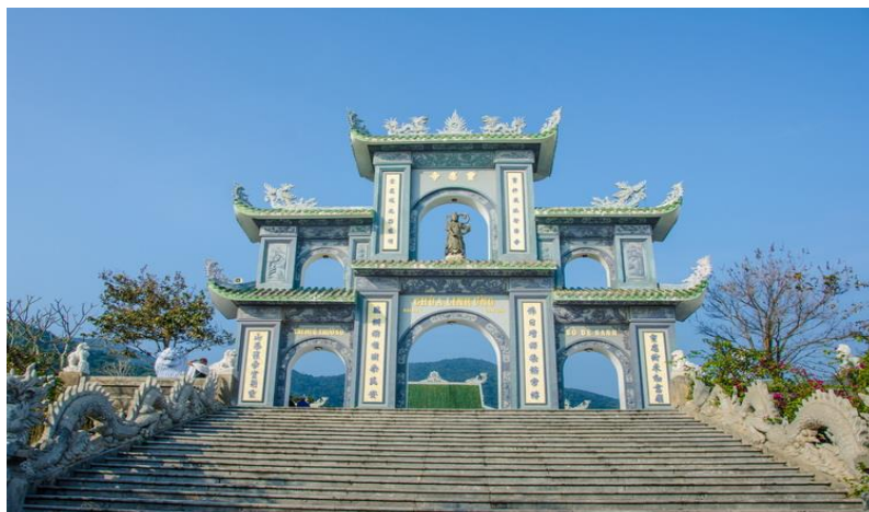
รูปที่ 8 วัดลินห้ออิง