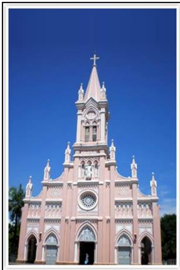
รูปที่3 โบสถ์คริสต์ (Danang Cathedral)

ยตร์ของชาวเมืองที่เดินทางมาเข้า โบสถ์ นับเป็นศูนย์รวมของชาวคริสต์นิกายโรมันคาทอลิกที่เหนียวแน่นอีกแห่งหนึ่งของเวียดนาม