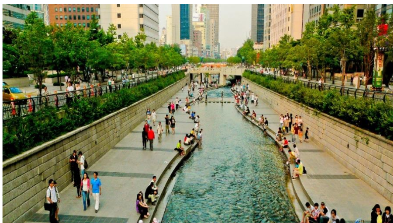
ภาพที่ 4.8 คลองของเกซอนหลังการปรับปรุง