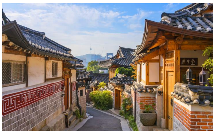
ภาพที่ 4.2 หมู่บ้านบุกชน (Bukchon Hanok Village)

2) หมู่บ้านบุกชน (Bukchon Hanok Village) หมู่บ้านที่เคยเป็นที่อยู่ของชนชั้นสูงในสมัยโชซอน บ้านเรือนในบริเวณนี้ยังคงเป็นบ้านเรือนแบบเกาหลีโบราณ หรือ ฮันอ๊ก (Hanok) ถือเป็นมรดกทางวัฒนธรรมที่ควรค่าแก่การอนุรักษ์ หมู่บ้านบุกชนตั้งอยู่ใกล้เคียงกับพระราชวังคยองบก ซึ่งหมู่บ้านแห่งนี้ได้ถ่ายทอดประวัติศาสตร์ และวัฒนธรรมที่มีมาอย่างยาวนานเอาไว้เพื่อให้ผู้คนได้สัมผัสและเรียนรู้วัฒนธรรมเกาหลีดั้งเดิม นอกจากนี้ยังได้รับการดูแลรักษาเอาไว้มาจนถึงปัจจุบันเพื่อเป็นมรดกทางวัฒนธรรมให้กับเมืองโซลอีกด้วย