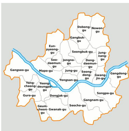
ภาพที่ 2.1 แผนที่เมืองโซล

โซล ตั้งอยู่ทางตะวันตกเฉียงเหนือของประเทศเกาหลีใต้ และมีพื้นที่ 605.52 ตารางกิโลเมตร ครอบคลุมพื้นที่ 0.61% ของเกาหลีใต้ และมีพื้นที่ 30.30 กม. จากเหนือจรดใต้ และ 34.78 กม. จากตะวันตกไปตะวันออก แม่น้ำฮัน (Han River) ไหลผ่านใจกลางกรุงโซล และแบ่งเมืองออกเป็นสองส่วน คือ ทิศเหนือและทิศใต้