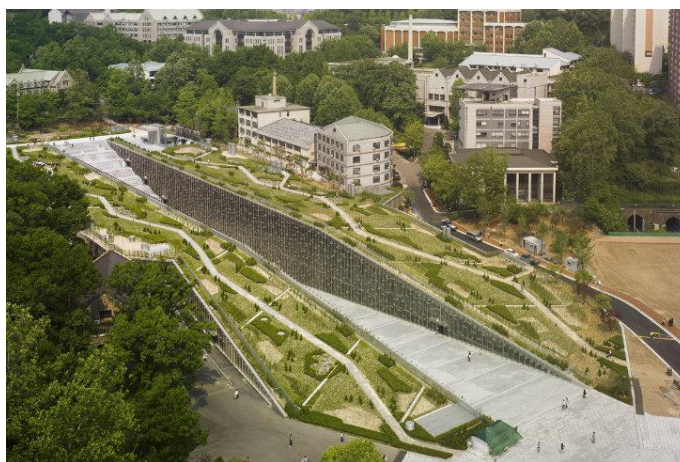
ภาพที่ 2.5 มหาวิทยาลัยสตรีอีฮวา (Ewha Womans University)

สร้างสวนสาธารณะบนหลังคาตึกตั้งแต่ค.ศ. 2002 จากเดิมที่พื้นที่บนหลังคานั้นต้องถูกปิดไว้ ด้วยเหตุผลด้านความปลอดภัยและการดูแลรักษาอาคารแต่ผลจากการดำเนินโครงการนอกจากจะเพิ่มพื้นที่สีเขียวขนาด 243,000 ตารางเมตรบนยอดอาคารจำนวน 550 แห่งแล้ว เทศบาลยังต้องระดมทุกศาสตร์ของการออกแบบมาใช้โดยต้องคำนึงตั้งแต่การออกแบบโครงสร้างให้รองรับน้ำที่จะต้องรั่วไหลและรากของต้นไม้ที่จะทะลุมาตามกำแพง ท้ายที่สุดแล้วเงินที่ลงทุนไปเพื่อชดเชยค่าก่อสร้างส่วนบางส่วนไม่เพียงส่งผลต่อการปรับคุณภาพชีวิต ด้วยการเคลื่อนย้ายพื้นที่สีเขียวเข้ามาอยู่บนหลังคาที่พักอาศัยและห้างสรรพสินค้าเท่านั้น แต่ยังส่งผลต่อคุณภาพอากาศ การประหยัดพลังงานในอาคารโดยช่วยลดการใช้เครื่องทำความร้อนในฤดูหนาวและประหยัดการใช้เครื่องปรับอากาศฤดูร้อนอันดุเดือดของกรุงโซล