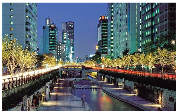
ภาพที่ 2.3 คลองชองเกชอน (Cheonggyecheon Stream)