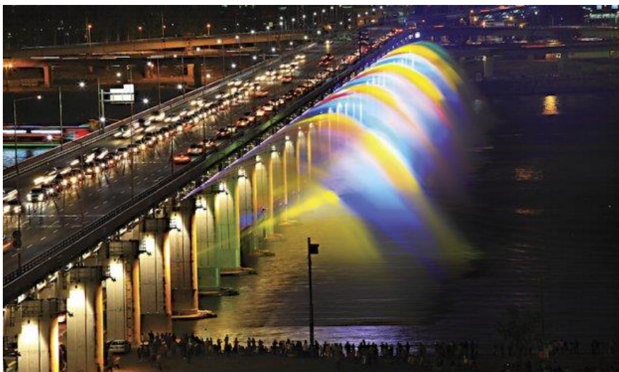
ภาพที่ 4.13 โชน้ำพุที่สะพานบันโพ