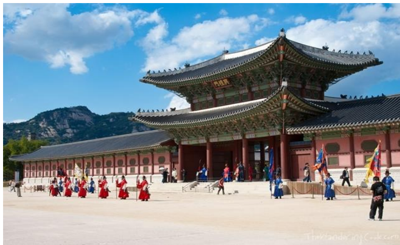
ภาพที่ 4.1 พระราชวังคยองบก (Gyeongbokgung)