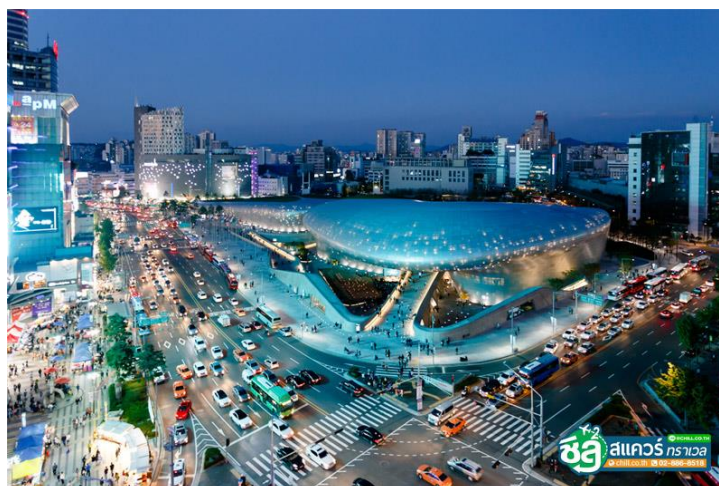
ภาพที่ 4.10 ทงแดมุน ดีไซน์ พลาซ่า