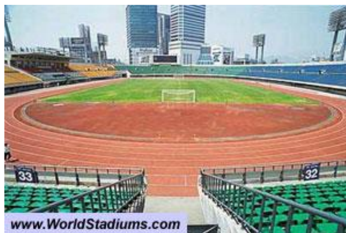
ภาพที่ 4.9 สนามกีฬาทงแดมุนในอดีต

- โซนที่ 5 เป็นโซนที่อยู่บริเวณรอบนอก คือ Dongdaemun History & Culture Park เป็น สวนสาธารณะที่รวมประวัติศาสตร์ และวัฒนธรรมของย่านทงแดมุนเอาไว้