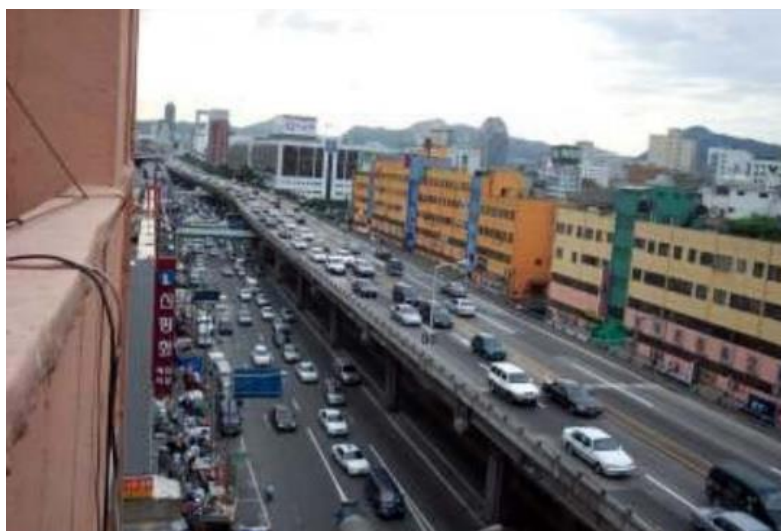
ภาพที่ 4.7 คลองของเกซอนก่อนการปรับปรุง

บริเวณคลองของเกซอน (Cheonggyecheon) เคยเป็นทางด่วนมาก่อนในอดีตมีการสร้างทางด่วนไว้บนคลองแห่งนี้ เนื่องจากโครงสร้างของสะพานนั้นเสื่อมสภาพทำให้เกิดความเสี่ยงในด้านความปลอดภัยรัฐบาลโซลจึงได้กำหนดนโยบายฟื้นฟูคลองของเกซอนขึ้นเพื่อลดความเสี่ยงทางด้านความปลอดภัย ลดปัญหาสภาพแวดล้อมจากควันของรถยนต์ด้วย และมีแผนฟื้นฟูบริเวณรอบคลองของเกซอนให้เป็นพื้นที่สำหรับวัฒนธรรม ธุรกิจ การซื้อขายสินค้า และกิจกรรมการท่องเที่ยวบริเวณรอบ ๆ คลองแห่งนี้ โดยมีวัตถุประสงค์เพื่อรักษาเศรษฐกิจของพื้นที่เอาไว้ มีการสร้างโปรแกรมการท่องเที่ยวให้นักท่องเที่ยวได้ชมมรดกทางประวัติศาสตร์ และวัฒนธรรมบริเวณรอบ ๆ คลองของเกซอน