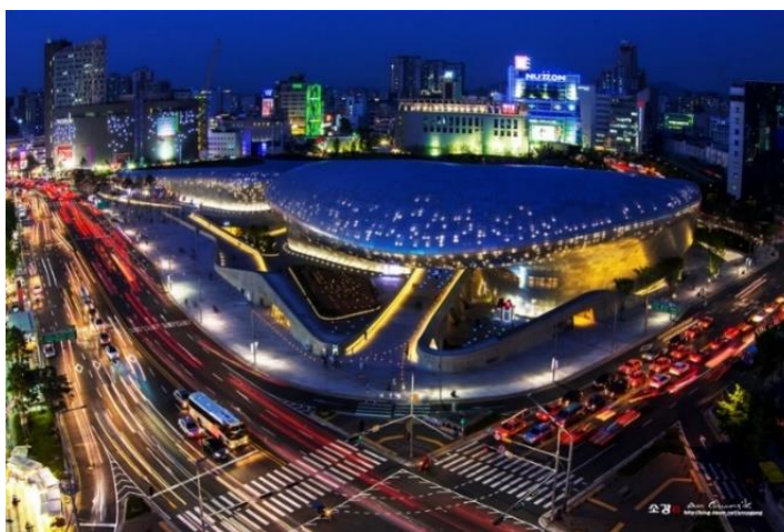
ภาพที่ 2.4 ทงแดมุน ดีไซน์พลาซ่า (Dongdaemun Design Plaza)

ทงแดมุน ดีไซน์พลาซ่า (Dongdaemun Design Plaza) ที่จะผุดขึ้นกลางตลาดค้าส่งเสื้อผ้าทงแดมุนและย่านธุรกิจการเงินใหม่ในยองซาน แวดล้อมไปด้วยตึกสูงฝีมือสถาปนิกที่มีชื่อเสียงระดับโลกอย่าง ซาฮา ฮาดิด (Zaha Hadid) และเรโนโซ เปียโนให้โซ (Renzo Piano) ทำให้โซลมีทั้งกลิ่นอายและเนื้อหาของความเป็นศูนย์กลางการออกแบบและธุรกิจที่ทันสมัยอย่างที่ผู้ว่าโอ เซฮุน คาดหวังไว้ว่า "ถ้าหากต้องการดูดีไซน์ ล่าสุดต้องไปที่กรุงโซล"