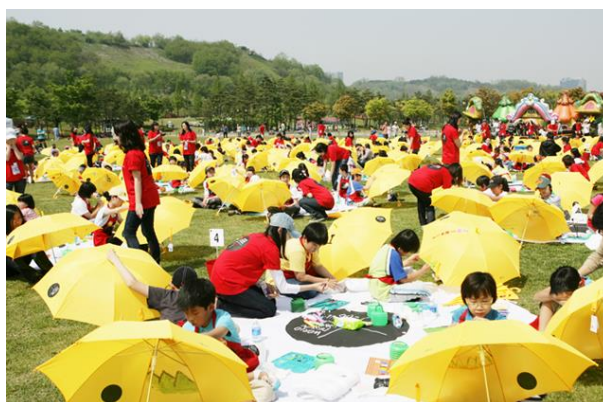
ภาพที่ 4.14 กิจกรรมค่ายศิลปะสำหรับเด็ก

องค์กรด้านการออกแบบของเมืองโซลได้มีการจัดกิจกรรมฝึกกลุ่มผู้สร้างสรรค์ และนักออกแบบขึ้นภายในเมืองโซล มีการจัดค่ายออกแบบสำหรับเด็กเพื่อการศึกษาด้านการออกแบบ ค่ายเปิดโอกาสให้เข้าใจและเรียนรู้เกี่ยวกับการออกแบบผ่านกิจกรรมการออกแบบที่รวมถึงประสบการณ์จริง และการเล่นเกมสำหรับเด็กที่จะมีบทบาทในสังคมในอนาคต และได้สัมผัสและเข้าใจวัฒนธรรมที่หลากหลายผ่านกิจกรรม และเกมการออกแบบของเด็ก ๆ อีกทั้งยังเพิ่มความสามารถในการแก้ปัญหาอย่างสร้างสรรค์ผ่านกิจกรรมการออกแบบในชีวิตจริงแก่เด็ก ๆ อีกด้วย