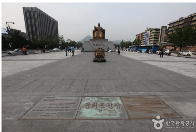
ภาพที่ 4.11 จัตุรัสกังฮวามุน

รัฐบาลโซลได้พัฒนาพื้นที่บริเวณจัตุรัสกังฮวามุนให้เป็นลานกว้างสาธารณะที่เป็นสัญลักษณ์ของเมืองโซล มุ่งเน้นให้บริเวณนี้เป็นพื้นที่สำหรับประสบการณ์ทางประวัติศาสตร์ และวัฒนธรรมภูมิทัศน์ที่สวยงาม และได้เปิดให้ประชาชนเข้าชมในค.ศ. 2009 สถานที่แห่งนี้รายล้อมไปด้วยสถานที่สำคัญของประเทศเกาหลีใต้ เช่น พระราชวังคยองบก ภูเขาบุกอกซัน (Bukaksan Mountain) จัตุรัสแห่งนี้ตั้งอยู่บนถนนเซจง (Sejeong Road) ที่เชื่อมยังพระราชวังคยองบก และยังสามารถเดินไปยังคลองของเกซอนได้อีกด้วย ซึ่งภายในจัตุรัสกังฮวามุนมีรูปปั้นบุคคลสำคัญของประเทศเกาหลีใต้อีกด้วย มีรูปปั้นพระเจ้าเซจง (Sejeong) กษัตริย์ในสมัยราชวงศ์โซซอน (Sochon dynasty) ที่เป็นผู้คิดค้นตัวอักษรภาษาเกาหลี และสิ่งประดิษฐ์ต่าง ๆ ซึ่งในบริเวณนี้ก็มีรูปปั้นสิ่งประดิษฐ์ของพระองค์ด้วย ในบริเวณเดียวกันมีรูปปั้นของนายพลยี่ซุนชิน (Yi Sun-Shin) ตั้งอยู่ ซึ่งเป็นสัญลักษณ์ที่สำคัญของถนนเส้นนี้ และยังมีน้ำพุที่คอยเปิดให้ชมอยู่ตลอดในช่วงหน้าร้อน สถานที่แห่งนี้ได้กลายเป็นสถานที่พักผ่อนของคนในเมือง และได้การเป็นสถานที่ท่องเที่ยวทางประวัติศาสตร์ที่ได้รับความนิยมจากชาวต่างชาติอีกด้วย