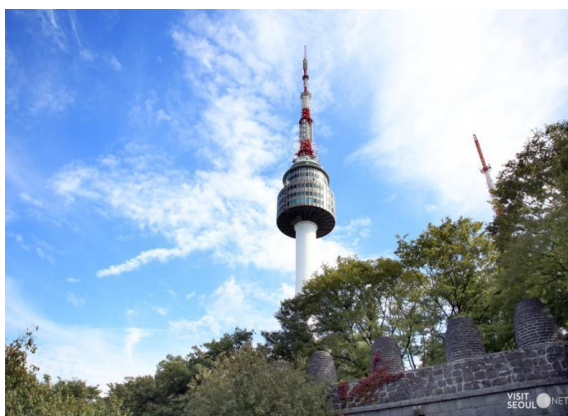
ภาพที่ 4.5 โซลทาวเวอร์ (Seoul Tower)

5) โซลทาวเวอร์ (Seoul Tower) เป็นแลนด์มาร์คที่สำคัญของกรุงโซล หรือของประเทศเกาหลี มีความสูง 236 เมตร ถือเป็น 1 ใน 18 หอคอยเมืองที่สูงที่สุดในโลกด้วยด้านบนของหอคอยสามารถมองวิวเมืองโซลได้ทั้งหมด และมีการประดับไฟสวยงามไว้เพื่อเป็นแสงสียามค่ำคืนให้กับผู้ที่มาเที่ยวชมด้วย คนเกาหลีเชื่อว่าถ้าหากได้ขึ้นไปคล่องกุญแจที่เขียนชื่อตัวเองกับคนรักบนหอคอยแห่งนี้จะทำให้ความรักมีแต่ความสุข โซลทาวเวอร์จึงเป็นอีกหนึ่งสถานที่ที่คนเกาหลีและนักท่องเที่ยวนิยมเดินทางมาชมความสวยงามของหอคอย และวิวทิวทัศน์ของเมืองโซล