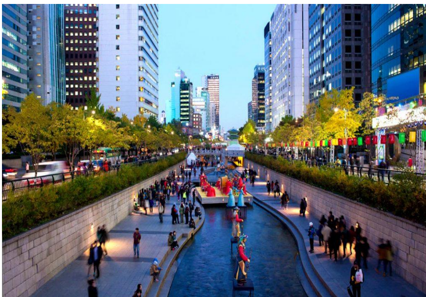
ภาพที่ 4.3 คลองชองเกซอน (Cheonggyecheon Stream)

3) คลองชองเกซอน (Cheonggyecheon Stream) เป็นคลองโบราณที่มีอายุมากกว่า 600 ปี เป็นคลองที่มีประวัติศาสตร์ยาวนานมาตั้งแต่สมัยราชวงศ์โชซอน คลองนี้มีความยาวเกือบ 6 กิโลเมตร ไหลผ่านใจกลางเมืองโซล ก่อนหน้านี้อ่างน้ำประปาปัญหามลพิษทางน้ำทำให้รัฐบาลโซลมีนโยบายปรับปรุงภูมิทัศน์ และฟื้นฟูธรรมชาติสิ่งแวดล้อมริมสองฝั่งคลองชองเกซอนครั้งใหญ่ในค.ศ. 2002 จนสภาพน้ำเสียกลายเป็นน้ำใส และปัจจุบันตลอดสองฝั่งคลองแห่งนี้ได้กลายเป็นสถานพักผ่อนที่ได้รับความนิยมอย่างมาก มีการประดับไฟไว้ตลอดแนวลำคลองทำให้ผู้คนนิยมมาถ่ายรูปกันในช่วงพลบค่ำ และได้กลายเป็นสถานที่ยอดนิยมของนักท่องเที่ยวอีกด้วย