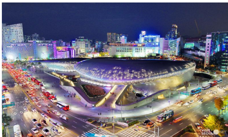
ภาพที่ 4.4 ทงแดมุนดีไซน์พลาซ่า (Dongdaemun Design Plaza)