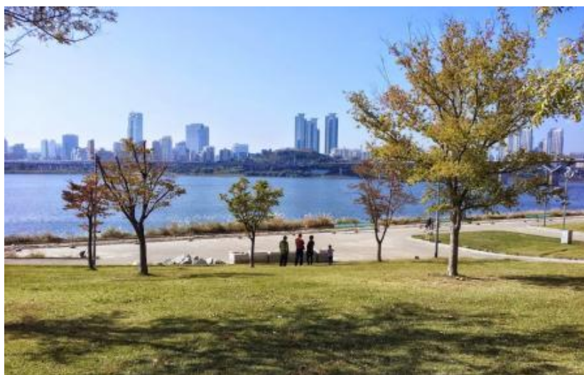
ภาพที่ 4.12 สวนสาธารณะริมแม่น้ำฮัน

รัฐบาลโซลได้มีการวางแผน Hangang Renaissance Project ในปี 2007 เพื่อฟื้นฟูพื้นที่บริเวณริมแม่น้ำฮันเพื่อให้กลายเป็นภาพลักษณ์ใหม่ให้กับเมืองโซล และเพื่อการพัฒนาพื้นที่แม่น้ำฮันให้เป็นเขตที่เป็นสัญลักษณ์ของกรุงโซลด้วย แม่น้ำฮันเป็นแม่น้ำสายสำคัญของประเทศเกาหลีใต้ และเป็นแม่น้ำที่ไหลผ่านใจกลางเมืองโซล และแม่น้ำฮันยังเป็นศูนย์กลางของเมืองโซล ซึ่งโครงการ Hangang Renaissance Project จะเริ่มดำเนินการตั้งแต่ปี 2007 - 2030 โดยมีการปรับปรุงการเชื่อมต่อกับมรดกทางประวัติศาสตร์รอบ ๆ แม่น้ำฮัน มีการสร้างสวนสาธารณะบริเวณรอบ ๆ แม่น้ำฮัน สะพานบันโป (Banpo Bridge) เป็นสะพานข้ามแม่น้ำฮันที่มีการแสดงน้ำพุ และเป็นสะพานน้ำพุที่ยาวที่สุดในโลกอีกด้วย ซึ่งการแสดงโชว์น้ำพุที่สะพานแห่งนี้ได้เริ่มแสดงครั้งแรกในปี 2007 และยังคงมีการแสดงเรื่อยมาจนถึงปัจจุบัน แต่จะมีการงดการแสดงโชว์น้ำพุในฤดูหนาว