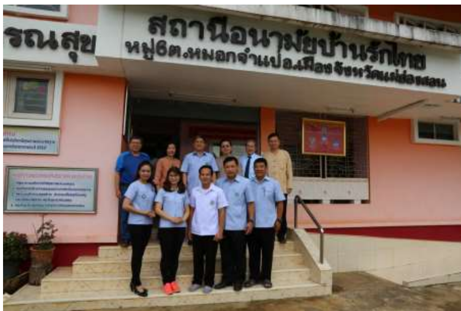
ภาพที่ 4.7 สถานีนามัยบ้านรักไทย