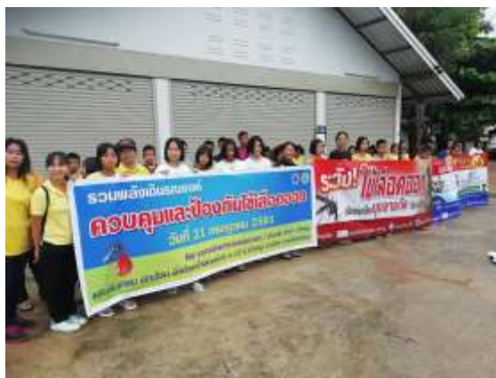
ภาพที่ 4.6 การรณรงค์ของสำนักงานสาธารณสุขอำเภอเมืองแม่ฮ่องสอน

ด้านสาธารณสุข ปัจจุบัน สาธารณสุขเข้าถึงทุกพื้นที่ในประเทศไทย บริเวณบ้านรุ่งอรุณ ขึ้นกับอำเภอเมือง การให้บริการด้านสาธารณสุขคือ สำนักงานสาธารณสุขอำเภอเมืองแม่ฮ่องสอน และเปิดให้ผู้คนมีส่วนร่วมในการดูแลสุขภาพ เช่น ธรรมนูญการป้องกันไข้เลือดออก โดยขอความร่วมมือจากคนในพื้นที่ (ภาพที่ 4.6)