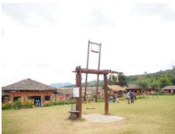
ภาพที่ 4.2 ไล่ชิงช้า

ง. เล่นไล่ชิงช้า (ภาพที่ 4.12) ชิงช้าคล้ายชิงช้าสวรรค์ นั่งได้ 4 คน ค่าบริการคนละ 25 บาท