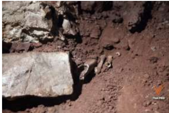
ภาพที่ 4. 9 ชิ้นส่วนกระดูกมนุษย์