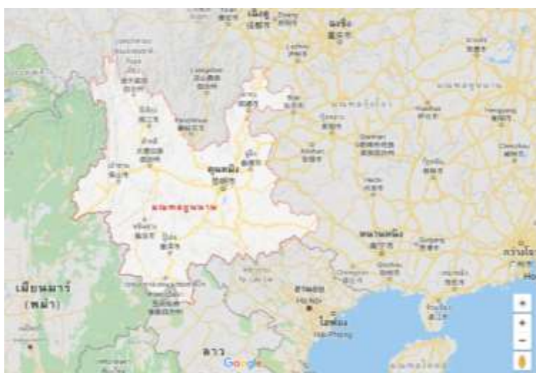
ภาพที่ 4.1 มณฑลยูนนาน

ลักษณะภูมิประเทศของมณฑลยูนนาน พื้นที่ส่วนใหญ่เป็นภูเขา มีอาณาเขตติดต่อกับสามประเทศคือ สหภาพเมียนมา สาธารณรัฐประชาชนจีน และประเทศเวียดนาม อีกทั้งยังเป็นมณฑลที่ใกล้ประเทศไทยมากที่สุด สภาพอากาศเย็นสบายตลอดทั้งปี มีอุณหภูมิเฉลี่ย 15 – 18 องศาเซลเซียส