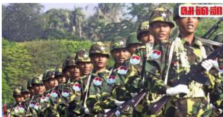
ภาพที่ 4. 4 กลุ่มทหารโกกั้ง

พื้นที่จังหวัดแม่ฮ่องสอนที่เป็นหมู่บ้านชาวจีนล้วนเป็นพื้นที่สีแดง เส้นทาง การลำเลียงยาเสพติด ทำให้หมู่บ้านปิดตัวจากคนภายนอก เจ้าหน้าที่ไม่กล้าเข้ามา ชาวบ้านบางคนอยู่ด้วยความหวาดกลัว ระยะเวลาเกือบสามสิบปีจึงมีมาตรการปราบปรามยาเสพติดของรัฐบาลทักษิณ ชินวัตร (สำนักงานกองทุนสนับสนุนการวิจัย, 2562)