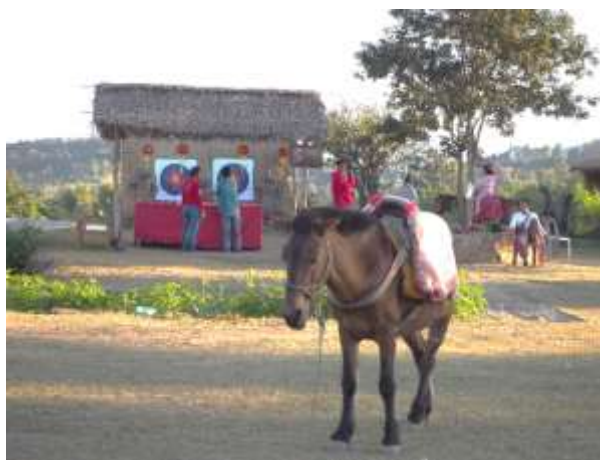
ภาพที่ 4.11 ม้าในหมู่บ้านสันติชล

ก. ซี่ม้า ม้าของชาวบ้าน เป็นม้าพันธุ์ไทย (ภาพที่ 4.11) แบ่งราคาออกเป็น การขี่ม้าชมรอบแหล่งท่องเที่ยวสั้น ๆ 3 รอบ 50 บาท หากต้องการชมหมู่บ้านคิดเป็นชั่วโมงละ 300 บาท (การท่องเที่ยวแห่งประเทศไทย, 2562)