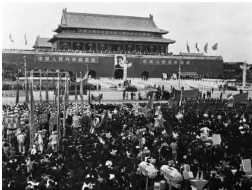
ภาพที่ 4.3 วันที่ 1 ตุลาคม ค.ศ. 2492 ประชาชนกว่าสามหมื่นคนมาร่วมอวยพรกับการสถาปนาประเทศจีน

มินตั้งต้องลี้ภัยออกจากประเทศ ผู้นำพรรค เจียงไคเชกย้ายไปตั้งรัฐบาลที่ไต้หวัน ทหารและประชาชนบางส่วนหนีออกนอกประเทศ ลงมาประเทศเพื่อนบ้าน เช่น ลาว เมียนมา และประเทศไทย ประเทศจีนสถาปนาชื่อประเทศเป็น สาธารณรัฐประชาธิปไตยประชาชนจีน ปกครองด้วยระบอบคอมมิวนิสต์ มีเหมาเจ๋อตงเป็นเลขาธิการพรรค ถือเป็น การสิ้นสุดการปกครองแบบจักรพรรดิอย่างสมบูรณ์ และตั้งให้ทุกวันที่ 1 ตุลาคมของทุกปีเป็นวันชาติจีน