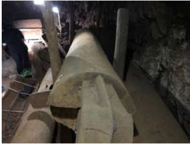
ภาพที่ 4.8 โลงไม้สัก