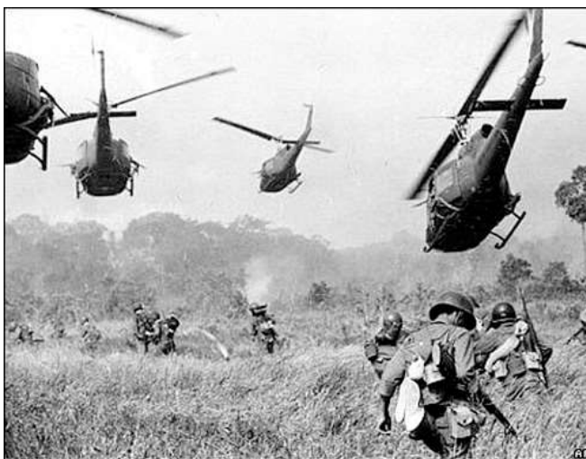
ภาพที่ 4.5 สงครามเขาค้อ

ในวันที่ 8 สิงหาคม พ.ศ. 2508 “วันเสียงปืนแตก” เป็นการเปิดฉากสงครามเขาค้อ (ภาพที่ 4.5) เป็นสงครามระหว่างรัฐบาลไทยกับพรรคคอมมิวนิสต์แห่งประเทศไทย สงครามการแย่งพื้นที่และความคิดอุดมการณ์ เมื่อพรรคคอมมิวนิสต์ไม่ต้องการขึ้นอยู่กับอำนาจรัฐ เมื่อสงครามเริ่มขึ้น มีการส่งทหารจากโรงเรียนนายร้อย จปร. รวมถึงกลุ่มทหารจีนกั๋วมินตั้ง กองพล 93 จากดอยแม่สลองและแม่ฮ่องสอนไปช่วยทำศึกสงคราม เหตุการณ์ทางการเมืองนี้มีระยะเวลากว่า 15 ปี จึงจบลง ทหารจีนอพยพจึงมีบทบาทสำคัญที่ทำให้สงครามจบลง อีกทั้งยังได้รับพระราชทานค่าตอบแทนจากพระบาทสมเด็จพระเจ้าอยู่หัวภูมิพลอดุลยเดช ประสงค์อยากให้ลูกหลานชาวจีนที่มาหากินอยู่เมืองไทย สามารถอาศัยอยู่ในเมืองไทยได้ รวมทั้งพระราชทานชื่อบ้านรักไทยและนามสกุลแก่ชาวจีน ดังนั้นชาวจีนจึงตั้งถิ่นฐานอยู่บริเวณนั้นถาวร