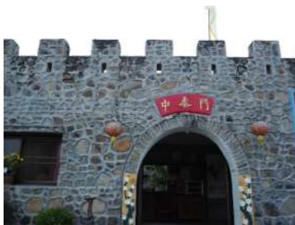
ภาพที่ 4.13 กำแพงเมืองจีนจำลอง ด้านในเป็นร้านขายของ

จ. ถ่ายรูปกับกำแพงเมืองจำลอง หรือถ่ายรูปตามสถานที่ต่าง ๆ ที่แสดงถึงวัฒนธรรมจีน (ภาพที่ 4.13)