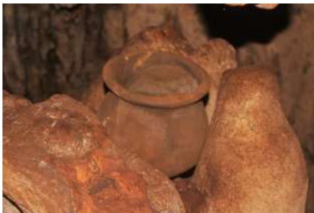
ภาพที่ 4.10 วัตถุโบราณในถ้ำกะลา

นอกจากนี้ยังมีการค้นการฝังศพลงบนพื้นถ้ำ ลูกปัดแก้ว เปลือกหอย อุปกรณ์ทอผ้า เครื่องประดับมนุษย์ยุคก่อนประวัติศาสตร์ (ภาพที่ 4.10) การค้นพบครั้งนี้ทำให้สร้างความเชื่อโยงได้ว่า ในการใช้ชีวิตของคนสมัยก่อนมีการเกิดการ ทำงาน เกิดอาชีพ การแบ่งหน้าที่ และการแลกเปลี่ยนนอกชุมชน บ่งบอกถึงกิจกรรมในครอบครัว เช่น ผู้หญิงทอผ้า ผู้ชายล่าสัตว์ (มติชนออนไลน์, 2560) การค้นพบวัตถุทางโบราณคดีหลายชิ้น เมื่อมีข้อมูลและหลักฐานครบ ทางสำนักศิลปากรเชียงใหม่ เตรียมขอประกาศให้ถ้ำโลงผีแมนเป็นโบราณสถานแห่งชาติในปี พ.ศ. 2560 (มติชนออนไลน์, 2560)