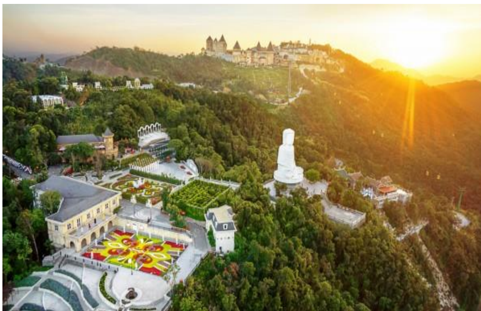
ภาพที่ 7 แสดงลักษณะของ บานาฮิลส์

และบ้านพัก ไว้ให้ชาวฝรั่งเศสพักผ่อนตากอากาศในช่วงนั้น จนเมื่อฝรั่งเศสถอนกำลังกลับ บานาฮิลส์ก็ถูกทิ้งร้างไปยาวนาน จนถึงช่วงปี ค.ศ. 2000 ที่นี้ก็ได้รับการบูรณะฟื้นฟูจากรัฐบาล เวียดนาม สร้างสิ่งอำนวยความสะดวกมากมายเพื่อเป็นสถานที่ท่องเที่ยวสำคัญที่ใกล้กับเมืองดานัง เพียง 30 กิโลเมตร รัฐบาลสร้างรถกระเช้าหรือเคเบิลคาร์ โรงแรม ร้านอาหาร สวนสวย พูลาเวนเดอร์ องค์กระใหญ่ วัดจีน และสวนสนุก ตั้งตระหง่านบนภูเขาเจียงเซิน (Truong Son) ที่ สูงกว่าระดับน้ำทะเลถึง 1,489 เมตร