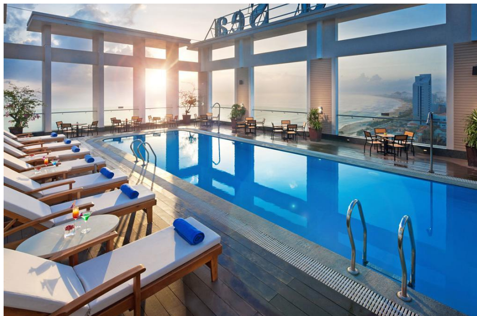
ภาพที่ 12 แสดงลักษณะของ Diamond Sea Hotel