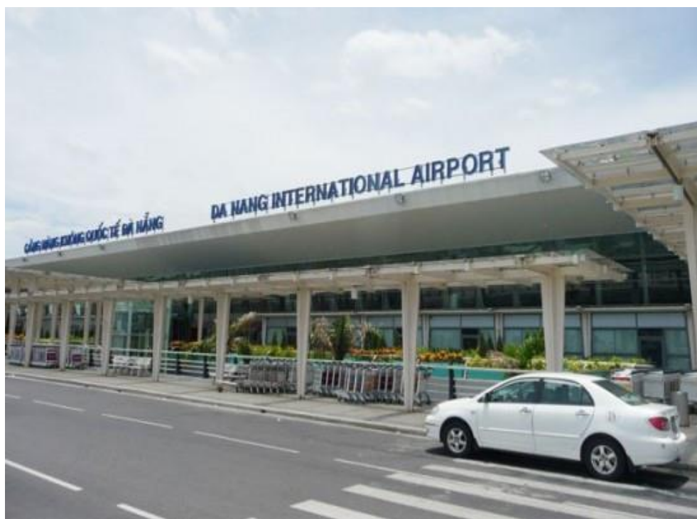
ภาพที่ 13 แสดงลักษณะของ ท่าอากาศยานนานาชาติดานัง