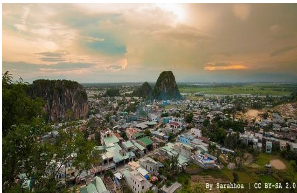
ภาพที่ 4 แสดงลักษณะของ ภูเขาหินอ่อน (Marble Mountain)

ภูเขาหินอ่อน เป็นภูเขาหินอ่อนและหินปูนที่มีชื่อเสียงของเวียดนาม ประกอบด้วยเนินเขาน้อยใหญ่ 5 ลูก ชาวเวียดนามเรียกภูเขานี้ว่าภูเขาแห่งธาตุทั้งห้า (เหล็ก, น้ำ, ไม้, ไฟ และดิน) ภายในภูเขามีแท่นบูชาพระพุทธเจ้า พระโพธิสัตว์ และเทพเจ้าองค์อื่นๆ ตามความเชื่อของชาวบ้านที่อาศัยอยู่แถบนั้น บริเวณพื้นที่รอบภูเขาหินอ่อนยังมีชื่อเสียงเรื่องการแกะสลักและประติมากรรมหินอ่อน ปัจจุบันได้มีการห้ามไม่ให้นำหินจากภูเขามาใช้แล้ว วัสดุที่ใช้ในการแกะสลักนำมาจากเหมืองหินในเขตจังหวัด Quang Nam