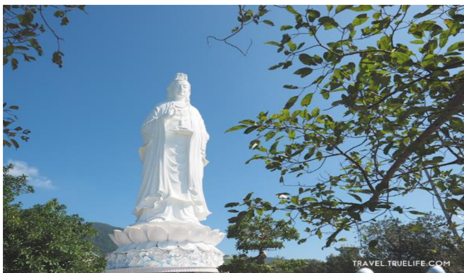
ภาพที่ 6 แสดงลักษณะของ วัดลิงอิง-บ้ายบุตร

ได้ค้นพบองค์เจ้าแม่กวนอิมบนหาดทรายจึงตั้งศาลบูชา นับตั้งแต่นั้นมาชาวบ้านในละแวกนี้ได้รับการคุ้มครองจากพระโพธิสัตว์กวนอิมให้แคล้วคลาดจากภัยพิบัติ ฝนฟ้าคลั่งลมสงบไม่รุนแรงช่วยให้ทุกคนมีความมั่นใจในการผลิต แต่ในช่วงสงครามต่อต้านสหรัฐอเมริกา ศาลเจ้าแม่กวนอิมนี้ถูกทำลายโดยสิ้นเชิงจนถึงปี 2004 พระมหาเถระติกเถียนเหงเวียนได้เปิดการรณรงค์เรียกร้องให้พุทธศาสนิกชนร่วมสมทบก่อสร้างวัดขึ้นมาใหม่และภายหลังใช้เวลาก่อสร้างถึง 6 ปี วัดลิงอิง-บ้ายบุตร ก็ได้สะท้อนให้เห็นถึงเอกลักษณ์และนิมิตหมายแห่งการพัฒนาของพุทธศาสนาเวียดนามในศตวรรษที่ 21 เมื่อมาเที่ยววัดลิงอิง บรรยากาศแห่งความศักดิ์สิทธิ์และทัศนียภาพที่สวยงามเหมือนได้นำพาทุกคนเข้าสู่ดินแดนแห่งความงดงามของเหล่าบรรดาเทพและชาวฟ้าทั้งหลาย บริเวณลานวัดมีพระอรหันต์ 18 องค์ที่เป็นหินมีเอกลักษณ์ท่าทางที่ถ่ายทอดอารมณ์ทุกอย่างของมนุษย์ซึ่งแฝงไว้ด้วยคติธรรมอย่างลึกซึ้ง รวมทั้งยังเป็นผลงานที่สะท้อนให้เห็นฝีมือการแกะสลักหินที่ยอดเยี่ยมของช่างศิลป์เขตนอนเนือก