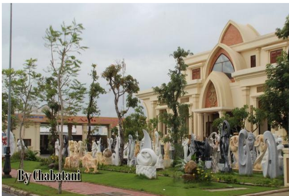
ภาพที่ 8 แสดงลักษณะของ หมู่บ้านแกะสลักหินอ่อนในเมืองดานัง

เจ้าแม่กวนอิม หรือเทพเจ้าแล้วนั้น ช่างก็จะแกะสลักตามที่ลูกค้าต้องการหรือแกะสลักเป็นสินค้า คราวเรือนก็สามารถทำได้ตามคำสั่งของลูกค้าเช่นกัน