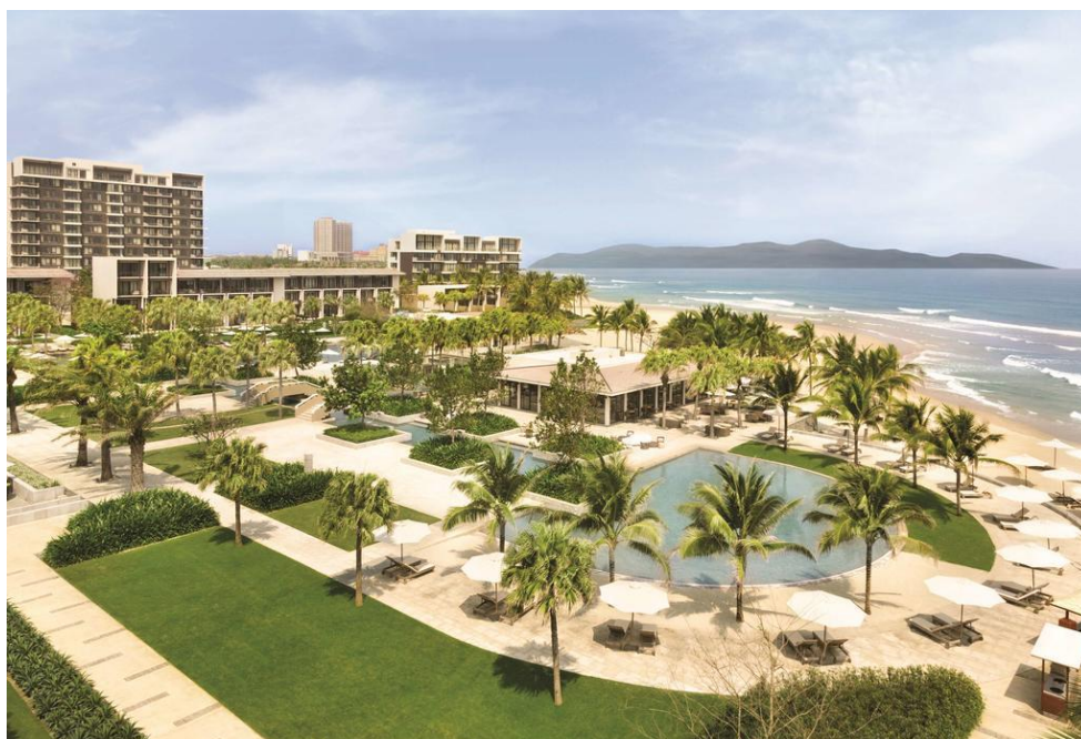
ภาพที่ 9 แสดงลักษณะของ Hyatt Regency Danang Resort and Spa (ที่มา: https://www.booking.com/hotel/vn/hyatt-regency-danang-resort-and-spa )

และ Love Lock Bridge Da Nang เพียง 15 นาทีหากเดินทางโดยรถยนต์ สนามบินที่ใกล้ที่สุด คือ สนามบินนานาชาติ Danang International Airport ซึ่งห่างจากที่พักโดยใช้เวลาเดินทางด้วยรถยนต์ 20 นาที อีกทั้งโรงแรมแห่งนี้ยังมีสิ่งอำนวยความสะดวกที่ครบครัน