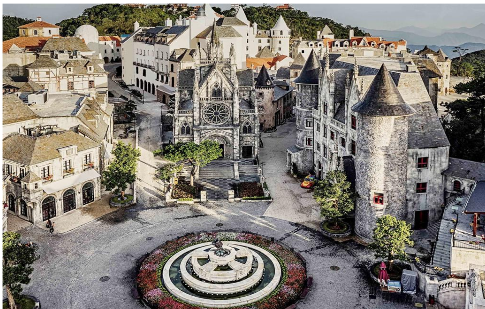
ภาพที่ 10 แสดงลักษณะของ Mercure Danang French Village Bana Hills