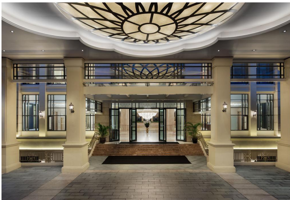
ภาพที่ 11 แสดงลักษณะของ Sheraton Grand Danang Resort