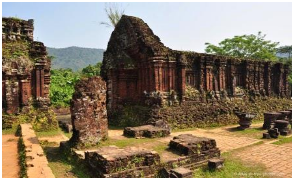
ภาพที่ 5 แสดงลักษณะของ สถานที่ศักดิ์สิทธิ์หมีเซิน (My Son Sanctuary)