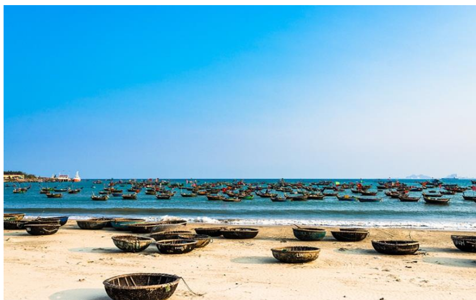
ภาพที่ 3 แสดงลักษณะของ หาดหมีเคว (My Khe Beach)

หาดหมีเควเป็นหาดที่สวยงามที่สุดของดานัง หาดหมีเควมีแนวชายหาดกว้างขวาง และมีความยาวถึง 10 กม. ทRAYที่นี้ขาวละเอียด มีแนวเก้าอี้ชายหาดที่หลังคามุงด้วยจากตั้งเรียงราย หาดหมีเควมีชื่อมากในช่วงสงครามเวียดนามเพราะทหารอเมริกันใช้เป็นที่พักผ่อนหย่อนใจ และภายหลังสงครามสิ้นสุด ก็เรียกแทนว่า หาดไชน่า (China Beach) เราสามารถเดินทางไปเที่ยวหาดหมีเควได้ง่ายๆเพราะว่าอยู่ห่างจากตัวเมืองดานังเพียง 6 กิโลเมตร