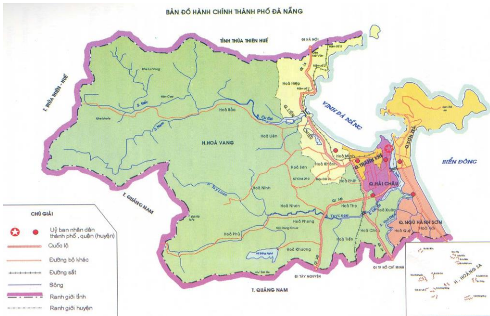
ภาพที่ 1 แสดงที่ตั้งของเมืองดานัง