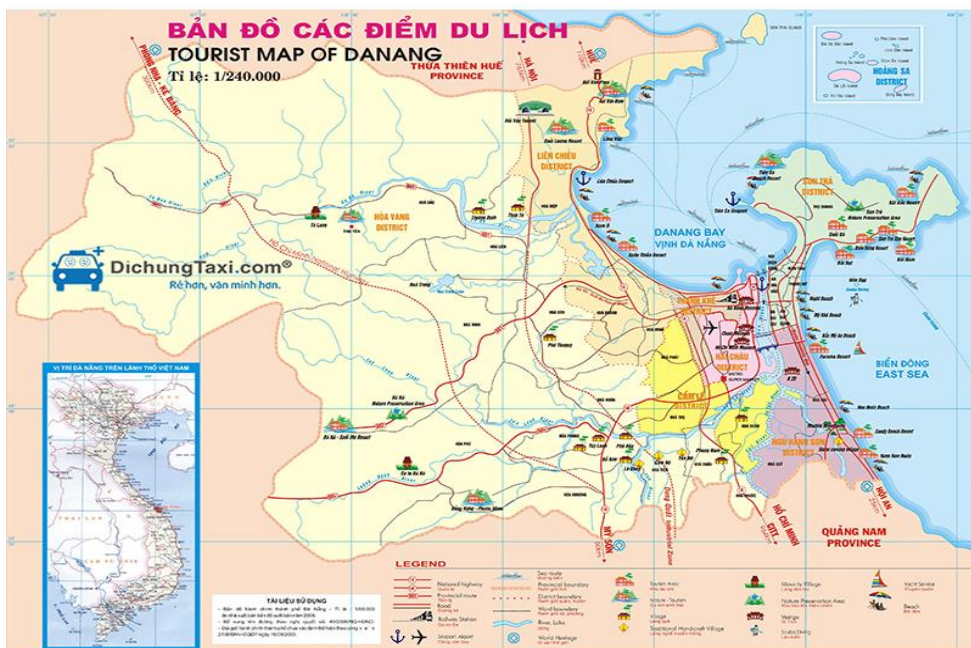
ภาพที่ 2 แสดงที่ตั้งของสถานที่ท่องเที่ยวต่างๆ