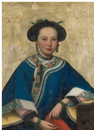
รูปที่ 12 : ภาพวาดพระนางเซียงเพยอันแสนงดงาม