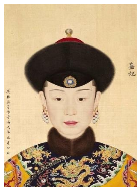
รูปที่ 11 : พระสาทิสลักษณ์ เจียก๊วยเพย