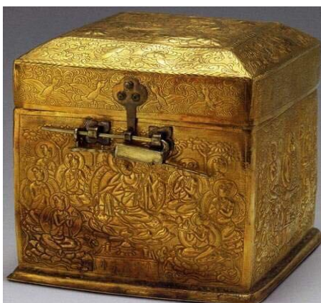
รูปที่ 2 หีบทองบรรจุตราประทับ