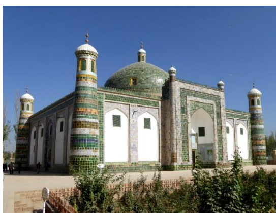
รูปที่ 13 : สุสานอาปักโฮจา