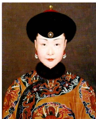
รูปที่ 7 : พระสาทิสลักษณ์ของหวงโฮ่วจากสกุลน้ำล่าเผ่าอุลา

ขณะที่วาดภาพพระนางมีตำแหน่งเป็นเสียนก้วยเพย