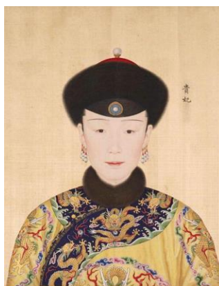
รูปที่ 9 : พระสาทิสลักษณ์ของพระนางฮู่ก๊วยเพย