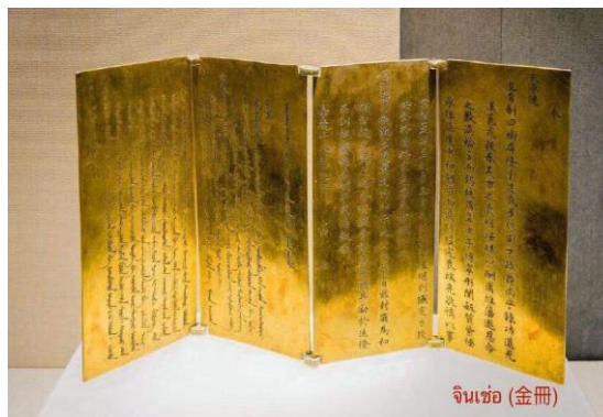
รูปที่ 1 จินเซ่อ

ผู้ที่ได้รับการแต่งตั้งเป็นหวงโฮ่ว หวงก๊วยเฟย และก๊วยเฟย ในวันที่มีพระราชพิธีแต่งตั้งจะได้รับพระราชทานแผ่นทองคำจารึกพระราชโองการแต่งตั้งและพระนามของผู้ได้รับการแต่งตั้ง เรียกว่า “จินเซ่อ” (金册) จะจารึกเป็นภาษาฮั่นและภาษาแมนจู และที่อยู่ในกล่องนั้นคือ ตราประทับทองประจำตำแหน่ง เรียกว่า “จินเป่า” (金寶)