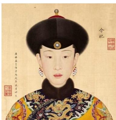
รูปที่ 8 : พระสาทิสลักษณ์ หลังอิ้วหวงก๊วยเพยขณะยังดำรงพระยศเป็น หลังเพย