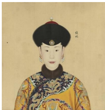
รูปที่ 10 : พระสาทิสลักษณ์ ฉุนก๊วยเพยขณะยังดำรงพระยศเป็น ฉุนเพย