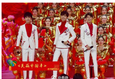
รูปที่ 4.1 TF Boys ขณะทำการแสดงในรายการปี 2017

โดยบทบาทหลักของพวกเขาในรายการนั้นปรากฏตั้งแต่ปี 2016 จนถึงปี 2018 คือมาร่วมร้องเพลงกับศิลปินคนอื่น ซึ่งในแต่ละปีบทเพลงที่นำมาร้องก็จะแตกต่างกัน แต่จุดที่สำคัญคือบทเพลงที่นำมานั้นมีเนื้อหาสื่อถึงความเป็นชาติหรือการปลุกฝังอย่างมากตามหน้าที่สื่อในการโน้มน้าวชักจูงใจ และการเลือกให้ TF Boys มาเป็นส่วนหนึ่งของรายการนั้นเพื่อดึงดูดผู้ชมในวัยหนุ่มสาวมารับชมรายการให้มากขึ้นและใช้บทเพลงที่มีเนื้อหาถึงความเป็นชาติปลุกฝังไปในเวลาเดียวกัน เมื่อดูจากรูปแบบของรายการแล้วสามารถสรุปตามบทบาทหน้าที่ของสื่อที่กล่าวไปข้างต้นได้คือ ตามบทบาทของข้อที่2 ที่ว่าด้วยบทบาทหน้าที่ในการแสดงความคิดเห็น และข้อที่4 ที่ว่าด้วยบทบาทหน้าที่ในการโน้มน้าวชักจูงใจ