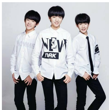
รูปที่ 1.1 TF Boys