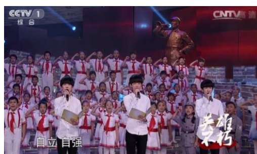
รูปที่ 4.8 เป็นตัวแทนกล่าวนำคำปฏิญาณตน