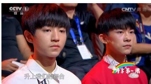
รูปที่ 4.12 รูปขณะนั่งฟังบรรยายในรายการร่วมกับเด็กๆ