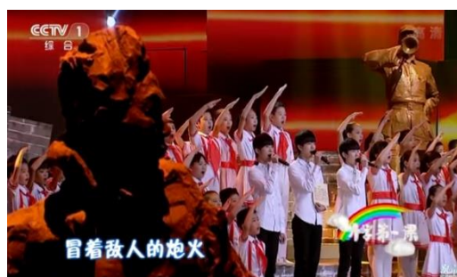
รูปที่ 4.7 ขณะที่เป็นตัวแทนร้องเพลงชาติในรายการ