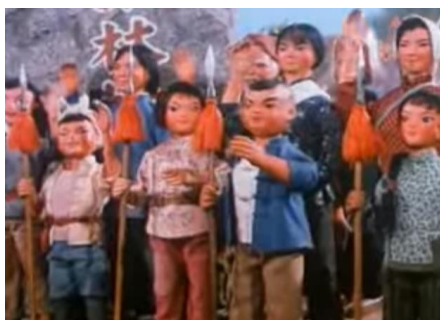
รูปที่ 2.4 ฉากในการตูน

ประชาชนทั้งประเทศด้วย หลังจากที่เขาได้ทำการต่อสู้กับเหล่ากองทัพญี่ปุ่นสำเร็จ เขาก็ได้รับการอนุมัติให้เข้าร่วมเป็นส่วนหนึ่งของเส้นทางกองทัพที่แปด