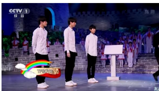
รูปที่ 4.5 เป็นตัวแทนรับโน้ตของเพลงชาติปี 2015