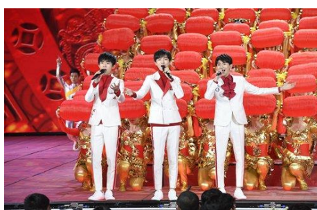
รูปที่ 2.19 TF Boys ในรายการเทศกาลตรุษจีน

จากผลงานดังกล่าวแสดงให้เห็นถึงการได้รับนิยมของพวกเขาอย่างมาก เนื่องจากผลงานภาพยนตร์นั้นล้วนแต่เป็นภาพยนตร์ที่มีชื่อเสียงและมีนักแสดงแนวหน้าของจีนร่วมแสดงด้วย มากไปกว่านั้นพวกเขาไม่ได้แค่แสดงภายในประเทศอย่างเดียวแต่ยังได้ร่วมแสดงกับภาพยนตร์ฮอลลีวูดที่ถือได้ว่าเป็นความโด่งดังในระดับหนึ่ง นอกจากนี้ส่วนหนึ่งที่ทำให้ TF Boys ได้รับความนิยมนั้น เพราะพวกเขาเป็นวงที่ได้รับการสนับสนุนจากรัฐบาล เห็นได้ชัดเจนจากการที่รัฐบาลมีการเชิญให้ TF Boys มีส่วนร่วมในรายการโทรทัศน์ต่างๆที่มีความเกี่ยวข้องกับรัฐบาลจีน เช่น เชิญให้เป็นศิลปินรับเชิญไปโรมงานที่สำคัญและยิ่งใหญ่อย่างเทศกาลตรุษจีน โดยมีการถ่ายทอดสดทางโทรทัศน์ของช่อง CCTV ซึ่งเป็นช่องหลักของจีนและมีผู้ชมจำนวนมาก