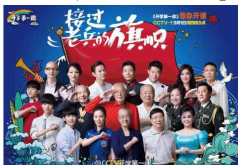
รูปที่ 2.22 หน้าปกรายการในตอนที่ “ธงบรรพบุรุษ”