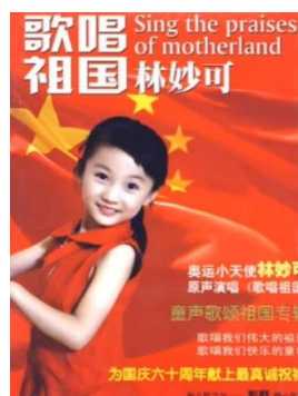
รูปที่ 4.21 หน้าปกอัลบั้มเพลงของ Lin Miaoke