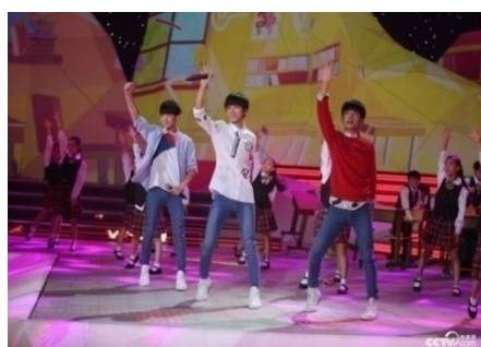
รูปที่ 2.21 TF Boys ในรายการบทเรียนแรกของการเปิดเทอม

และอีกกิจกรรมหนึ่ง TF Boys ยังมีส่วนร่วมร่วมกับนโยบายสำหรับเด็กจีนเกี่ยวกับความรักชาติให้กลับคืนสู่โรงเรียน โดยกระทรวงการศึกษาต้องการให้เด็กเหล่านี้ไปชมรายการโทรทัศน์ที่ชื่อว่า “บทเรียนแรกของการเปิดเทอม” ซึ่งเป็นรายการเกี่ยวกับการยกย่องจิตวิญญาณของเหล่ากองทัพแดงหรือกองรบของฝ่ายคอมมิวนิสต์โดยก่อนเริ่มรายการมีการเชิญ TF Boys มาเป็นศิลปินเปิดรายการโดยการร้องเพลง เพื่อเป็นการถ่ายทอดแนวคิดชาตินิยมในเชิงบวกให้เหล่านักเรียนระดับประถมศึกษาและมัธยมศึกษา ซึ่งทำให้นักเรียนเกิดความสนใจมากขึ้นเพราะมีศิลปินที่พวกเขาชื่นชอบปรากฏอยู่ในรายการด้วย