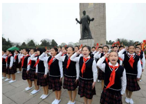
รูปที่ 2.14 ทำพิธีเคารพอนุสาวรีย์