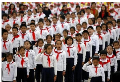
รูปที่ 2.11 ชุดประจำพรรค