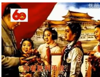
รูปที่ 2.20 ภาพประกอบบทเพลงประจำพรรคในอดีต

พวกเราคือผู้สืบทอดระบบคอมมิวนิสต์ สืบทอดประเพณีของบรรพบุรุษการปฏิวัติอันรุ่งโรจน์ รักประเทศของเราและรักประชาชน ฝ่าฟันคอสีแดงสดใสที่กระพือบนหน้าอกด้านหน้า ไม่กลัวความยากลำบาก ไม่กลัวศัตรู หวงแหวนการเรียนรู้และต่อสู้อย่างเด็ดเดี่ยว ต่อชัยชนะและก้าวไปข้างหน้าอย่างกล้าหาญ เดินตามเส้นทางอันรุ่งโรจน์ของบรรพบุรุษก่อนการปฏิวัติ รักประเทศของเราและรักประชาชน สมาชิกเยาวชนผู้บุกเบิกเป็นชื่อที่น่าภาคภูมิใจของเรา พร้อมทั้งจะสร้างผลงานดีเด่น ต้องกำจัดศัตรูให้หมดสิ้นไป เพื่อความคิดที่ก้าวไปข้างหน้าอย่างกล้าหาญ พวกเราคือผู้สืบทอดระบบคอมมิวนิสต์