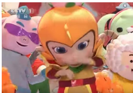
รูปที่ 4.2 ซุนหงอคงที่ปรากฏในรายการ

ตัวละครนี้เป็นบุคคลสำคัญที่มีชื่อเสียงมากในตำนานของจีนและมีความสามารถมาก เขาเป็นบุคคลที่เรียนรู้ได้ไว เช่น ชอบสะกดคำใหม่ๆ ซึ่งนำมาเป็นสัญญาณในเชิงของการที่ต้องเป็นคนเรียนรู้อะไรใหม่ๆ