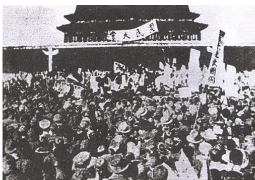
รูปที่ 2.1 การประท้วงของนักศึกษา

ระหว่างกลางปีที่ 1800 – กลางปี 1900 ชาวจีนประสบกับการเผชิญหน้าทางทหารกับตะวันตกและญี่ปุ่น ทั้งในเหตุการณ์สงครามฝิ่นกับอังกฤษทั้งหมดสองครั้ง โดยครั้งแรกเกิดขึ้นในปี 1839–1842 และครั้งที่สองในปี 1856–1860 และสงครามนานกิงกับญี่ปุ่นในปี 1937 เหตุการณ์เหล่านี้ทำให้จีนพ่ายแพ้และรู้สึกอับอายและประสบความยากลำบาก ซึ่งก่อนจะเกิดความสูญเสียนี้ จีนเองยังไม่มีชื่อที่เป็นทางการหรือธงประจำชาติสำหรับการใช้เป็นสัญลักษณ์ของรัฐบาล ซึ่งเหตุการณ์เหล่านี้ปลุกใจจากความฝิ่นที่ว่าตัวเองเป็นศูนย์กลางของโลกและจากทฤษฎีชาตินิยมที่ว่าความรักชาตินี้ความคิดหรือความรู้สึกจะเป็นไปในทิศทางเดียวกัน ก็อาจจะเป็นปัญหาได้เช่นกันถ้าหากเกิดความขัดแย้งขึ้นมาได้โดยเฉพาะกับต่างแดน หลังจากจีนพ่ายแพ้ในสงครามฝิ่น ชนชั้นสูงได้เริ่มพัฒนาการให้ความช่วยเหลือชาวจีนและกองกำลังทหารประชาชน ต่อมาในวันที่ 4 พฤษภาคม 1919 ได้มีการเคลื่อนไหวของกลุ่มนักศึกษา และวันที่ 30 เดือนเดียวกันนั้น ก็มีการเคลื่อนไหวของชนชั้นแรงงานด้วย ซึ่งส่งผลให้ความเป็นชาตินิยมได้พัฒนา เพราะเป็นเหตุการณ์ที่กลุ่มนักศึกษาได้ลุกขึ้นมาต่อต้านกับสนธิสัญญาขายชาติ ที่เยอรมันจะยกมณฑลซานตงของจีนให้กับญี่ปุ่นโดยอ้างว่าเพื่อรักษาเอกภาพขององค์การสันนิบาตชาติ ทำให้เกิดความเป็นชาตินิยมในประชาชนชาวจีนที่รู้สึกถึงการต้องปกป้องประเทศชาติตนเอง กลุ่มนักศึกษาจึงรวมตัวกันที่จัตุรัสเทียนอันเหมินเพื่อต่อต้านการประชุมสันติภาพจันรัฐบาลต้องเข้ามาจับกุมนักศึกษาเหล่านี้ทำให้เหล่ากรรมกรในเซี่ยงไฮ้เมื่อรู้ข่าวต่างก็หันมาร่วมมือกันช่วยเหล่านักศึกษาอีกแรง จากความกดดัน ฝ่ายชนะจึงตกเป็นของเหล่านักศึกษาและกรรมกร (www.silpa-mag.com, 2561)