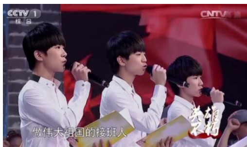
รูปที่ 4.9 เป็นตัวแทนกล่าวนำคำปฏิญาณตน