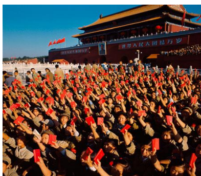
รูปที่ 2.2 เยาวชนจีนถือสมุดปกแดงในยุคปฏิวัติวัฒนธรรม

การปฏิวัติวัฒนธรรมนั้นได้เริ่มขึ้นเมื่อเดือนพฤษภาคม ปี 1966-1976 เพื่อสถาปนาลัทธิเหมาให้เป็นอุดมการณ์หลักของพรรคคอมมิวนิสต์จีนโดยขจัดแนวคิดทุนนิยมและพวกอนุรักษ์ที่ยังเหลืออยู่ในสังคมจีนให้หมดไป ซึ่งจุดสำคัญในเหตุการณ์ที่ยกมานี้ คือ ขบวนการปฏิวัติมีศูนย์กลางขบวน คือ กลุ่มเยาวชนเรดการ์ดที่คอยเชิดชูอุดมการณ์ของเหมาและเดินหน้าต่อต้านผู้ที่ยังเห็นต่างหรือไม่ปฏิบัติตามอุดมการณ์ของเหมาด้วยความรุนแรง โดยพวกเขาเชิดชูประธานเหมาเหนือบุคคลอื่นใดทั้งหมด พวกเขาจะมีสิ่งสำคัญที่ต้องมีติดตัวไว้ตลอดก็คือ หนังสือปกแดงเล่มเล็กๆ ภายในรวบรวมวาทะต่างๆของประธานเหมาเอาไว้ โดยเหล่าเยาวชนเรดการ์ดจะต้องกล่าววาทะของประธานเหมาทุกคำเพื่อเป็นการแสดงความเคารพ นอกจากนี้ทุกคนยังต้องสวมเสื้อผ้าที่เป็นสัญลักษณ์ที่แสดงตัวตนถึงความเป็นยูวชนแดงเหมือนกัน คือ การใส่เสื้อคอจีนสีเขียวขี้ม้า สวมหมวกประดับดาวแดง ผ้าพันคอสีแดงและปลอกแขนสีแดง