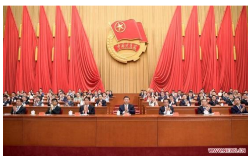
รูปที่ 4.18 สีจิ้นผิงขณะประชุมเลือกคนดูแลพรรคเยาวชนคอมมิวนิสต์

บทบาทของผู้นำสีจิ้นผิงที่มีต่อพรรคคอมมิวนิสต์เยาวชนนี้ คือ เป็นคณะกรรมการกลางเข้าร่วมประชุมในฐานะผู้นำของพรรคคอมมิวนิสต์เมื่อพรรคมีการประชุมครบรอบต่างๆ เช่น มีการประชุมของพรรคสภายุวชนคอมมิวนิสต์แห่งชาติครั้งที่ 18 เมื่อวันที่ 26 มิถุนายน 2018 และอีกบทบาท คือ เมื่อถึงเทศกาลงานวันเด็กเขาจะเดินทางมาพบปะพูดคุยกับเหล่าเด็กๆและสวมผ้าพันคอสีแดงที่เป็นสัญลักษณ์ของพรรคเช่นเดียวกัน และเรื่องที่เขาได้กล่าวกับเด็กๆคือเรื่อง สิ่งแวดล้อม กีฬา ศิลปะดั้งเดิม และการศึกษา รวมถึงสิทธิเด็กและสุขภาพของพวกเขา ที่สีจิ้นผิงเป็นห่วงเรื่องสุขภาพของเด็กๆ เพราะถ้าหากพวกเขาไม่มีสุขภาพร่างกายที่แข็งแรงก็จะเป็นกำลังที่ดีของชาติในอนาคตได้ มีกำลังที่จะช่วยถ่ายทอดแนวคิดได้ต่อไปในเวลานาน