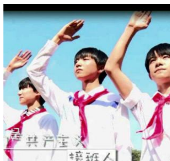
รูปที่ 2.20 TF Boys ในมิวสิกวิดีโอ