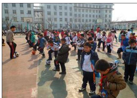
รูปที่ 2.10 บรรยากาศภายในโรงเรียนกีฬาฟุตบอล

จากการที่จีนมุ่งเน้นพัฒนาด้านฟุตบอล ทำให้มีหน่วยงานต่างๆเข้ามาสนับสนุน ทั้งนี้ เป็นเพราะจีนเองยังไม่ประสบความสำเร็จด้านฟุตบอลเท่าที่ควรเมื่อเทียบกับประเทศใกล้เคียง อย่างเกาหลีใต้ ซึ่งในระดับภูมิภาคด้วยตัวเองแล้ว จีนได้รับฉายาว่าเป็นโรคกลัวเกาหลี เพราะ จีนไม่เคยชนะเกาหลีใต้ได้เลย จนกระทั่งในวันที่ 23 มีนาคม 2017 แข่งชนะเกาหลีแต่ก็ชนะได้เพียง 1 ประตูต่อ 0 และผลงานสูงสุดด้านฟุตบอลของประเทศจีนที่ผ่านมา คือ ได้เข้าร่วมฟุตบอลโลกในปี 2002 ที่ญี่ปุ่นและเกาหลีเป็นเจ้าภาพร่วมกันเพียงปีเดียวเท่านั้น กีฬาฟุตบอลนั้นเป็นกีฬาระดับโลก ถ้าหากจีนแสดงศักยภาพด้านฟุตบอลได้ดี ประเทศก็จะก้าวหน้าและมีชื่อเสียงด้านกีฬาไปอีกขั้น เสมือนทำให้ประเทศตนเองมีอำนาจทางกีฬาสูงขึ้นรวมถึงอำนาจในด้านอื่นๆด้วย และการที่เหล่า เยาวชนสนใจจำนวนมาก ทำให้เห็นถึงความเป็นชาตินิยมในรูปแบบหนึ่ง คือ มีสำนึกถึงการรักชาติ และมีความคิดที่จะช่วยพัฒนาชาติในด้านกีฬาร่วมกัน