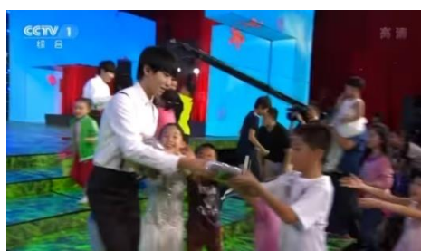
รูปที่ 4.16 ขณะแจกของขวัญ