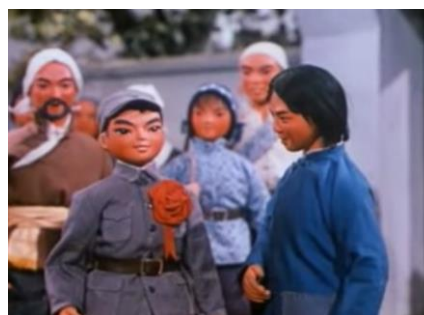
รูปที่ 2.5 ฉากในการตูน