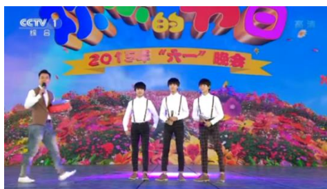
รูปที่ 4.15 บรรยากาศในรายการปี 2015

แต่ในที่นี้จะเน้นไปที่เนื้อหาของเพลงในปี 2016 เท่านั้น เนื่องจากมีเนื้อหาที่แสดงถึงค่านิยมตรงตามที่รัฐบาลมุ่งหวังต่อเยาวชน