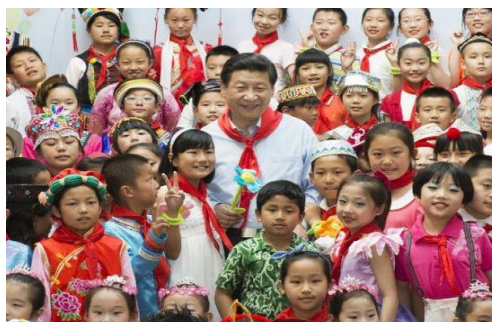
รูปที่ 4.19 สี่จิ้นผิงขณะพบปะเยาวชนในงานวันเด็ก