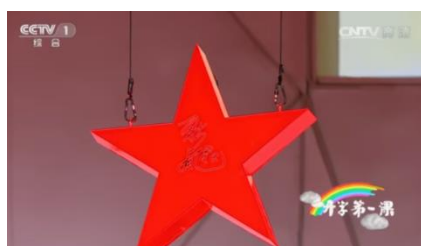
รูปที่ 4.14 ดาวในรายการ

3.) ดาวสีแดง เป็นสัญลักษณ์ที่สื่อถึงอุดมการณ์ของคอมมิวนิสต์และกองทัพแดงในอดีต แต่ปัจจุบันดาวแดงนี้ก็ยังคงใช้แทนความหมายคอมมิวนิสต์อยู่ โดยรายการได้นำมาใช้แสดงให้เห็นถึงการยังคงยกย่องระบบคอมมิวนิสต์อย่างมาก