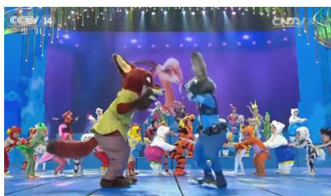
รูปที่ 4.17 การแสดงของเหล่าตัวการ์ตูน

นอกจากสัญญาในบทเพลงแล้ว การแสดงในรายการก็มีเช่นกัน คือ มีการนำตัวการ์ตูนจากภาพยนตร์ที่มีชื่อเสียงมากอย่างเรื่อง Zootopia ที่เป็นของค่าย Disney ซึ่งเนื้อหาพูดถึงกระต่ายที่มีความพยายามทำตามความฝันที่จะเป็นตำรวจ และสุนัขจิ้งจอกที่ตอนแรกประพฤติตัวไม่ดีจนสุดท้ายกลับตัวเป็นคนดีได้ เหมือนเป็นการสร้างค่านิยมให้กับเยาวชนเช่นเดิมว่าเยาวชนที่ดีควรปฏิบัติตนอย่างตัวการ์ตูน ซึ่งตัวการ์ตูนก็เป็นสัญญาที่ให้ความหมายโดยนัยเช่นกัน ที่ได้หมายถึงตัวละครการ์ตูนจริงๆ แต่เมื่อพูดถึงตัวการ์ตูนก็จะนึกถึงเด็กหรือเยาวชน