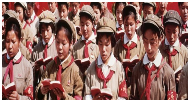
รูปที่ 2.3 เยาวชนขณะอ่านอุดมการณ์ของผู้นำในยุคปฏิวัติวัฒนธรรม