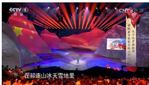
รูปที่ 4.13 ฉากในรายการ