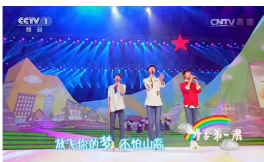
รูปที่ 4.11 ทำการแสดงในรายการปี 2016