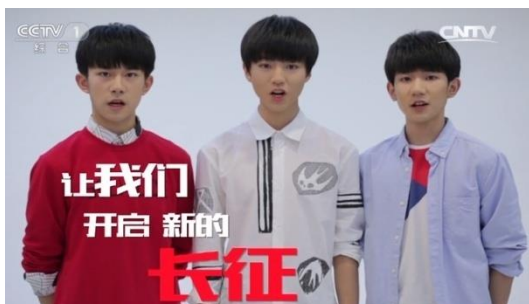
รูปที่ 4.10 ขณะกล่าวถึงแนวทางของและยกย่องกองทัพแดง