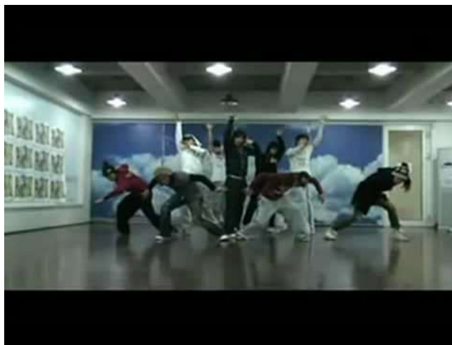
ภาพที่ 3.6 ภาพจากคลิปวิดีโอเวอร์ชัน Dance Practice ของศิลปิน TVXQ

ได้ง่ายขึ้น ถือว่าเป็นวิธีการแพร่กระจายวัฒนธรรมการเต้นอย่างชัดเจน การเต้นเลียนแบบศิลปินหรือ Cover Dance ในประเทศไทย จึงถือกำเนิดขึ้น