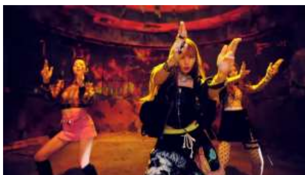
ภาพที่ 4.21 ท่าเต้นแสดงถึงความเป็นเพศหญิงที่แข็งแกร่ง

การยกมือขึ้นมาสองข้างทำเป็นรูปปิ่น แล้วยิงไปข้างหน้าตามจังหวะและคำร้องว่า ddu-du ddu-du du แสดงถึงความเป็นเพศหญิงที่แข็งแกร่งนั่นเอง