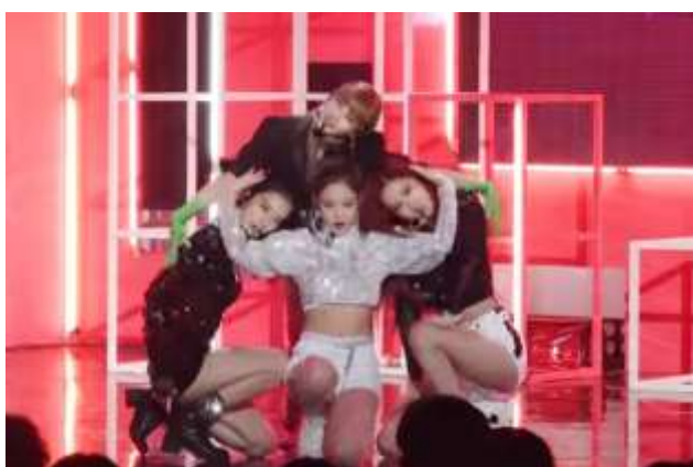
ภาพที่ 4.25 ท่าเต้นแสดงความสัมพันธ์ภายในทีม

นอกจากตำแหน่งหน้าที่ของตนเองและการเก็บรายละเอียดของท่าเต้นที่ต้องมีองศาที่เหมือนกันอย่างสมบูรณ์แบบในทุกท่าเต้นเพื่อแสดงถึงความเป็นหนึ่งเดียวกันแล้วนั้น สิ่งที่แสดงออกถึงความสัมพันธ์ภายในทีมผ่านท่าเต้นอีกหนึ่งสิ่งคือ ท่าเต้นที่สมาชิกแต่ละคนต้องมีความสัมพันธ์กัน หรือเป็นท่าเต้นที่เป็นรูปร่างที่จำเป็นต้องมีสมาชิกครบจำนวนถึงจะเป็นลักษณะของท่าเต้นที่สวยงามและสมบูรณ์แบบในท่านั้นๆได้ เป็นท่าเต้นที่ไม่สามารถเต้นเพียงคนเดียวได้ แสดงให้เห็นถึงความสัมพันธ์ภายในทีมอย่างเห็นได้ชัดเจน ผ่านกรณีศึกษาบทเพลง Ddu du Ddu du ของศิลปินวง Blackpink ด้วยเช่นกัน