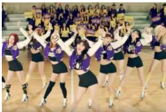
ภาพที่ 4.16 ท่าเต้นเป็นสัญญาณแทนคำว่า Cheer up

1. จากเนื้อเพลงในตอนที่ร้องว่า “Cheer up Baby , Cheer up Baby” โดยท่าเต้นจะเป็นการยกแขนทั้งสองข้างขึ้นมาสุดแขน ขึ้นลง เพื่อเป็นการแสดงแทนความหมายของการเชียร์นั้น แสดงให้เห็นได้ถึงบุคลิกภาพความการเป็นเชียร์ลีดเดอร์