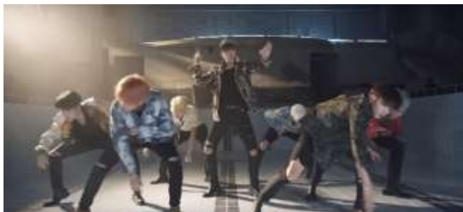
ภาพที่ 4.11 ทำเต็มแสดงตำแหน่งของเจโฮป-แรปและเด่นหลัก