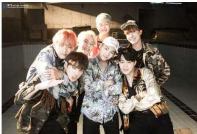
ภาพที่ 4.4 เพลง FIRE (불타오르네) – BTS

กรณีศึกษา การสื่อความหมายของการแสดงออกของศิลปินเกาหลีวง BTS ผ่านบทเพลง FIRE (불타오르네)