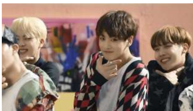
ภาพที่ 4.5 ท่าเต้นสัญญาณแทนคำว่า 관찮아 (แควนชานนา) ที่แปลว่า ไม่เป็นไร