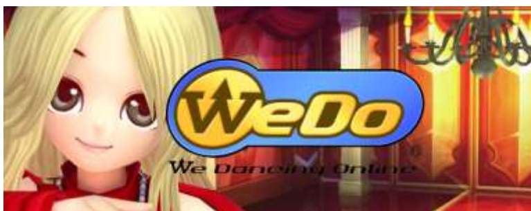
ภาพที่ 3.10 โลโก้เกมออนไลน์ We dancing online หรือ WEDO