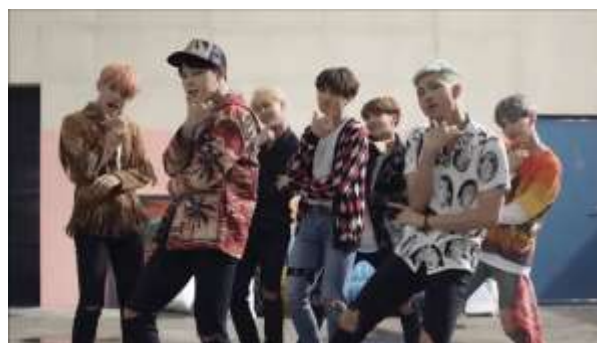
ภาพที่ 4.7 เครื่องแต่งกายในบทเพลง Fire – BTS

ซึ่งการแต่งกายถือว่าเป็นอีกองค์ประกอบหลักหนึ่งที่สำคัญ ในการแสดงออกของศิลปินผ่านบทเพลง นอกเหนือจากเพลงและทำเต็น การแต่งกายก็ถือว่าสำคัญมากที่แสดงออกได้ถึง บุคลิกของศิลปินในบทเพลงนั้นๆ ซึ่งบทเพลงนี้ แสดงถึงความคึกคะนอง บ้าระห่ำ ลูกเป็นไฟแต่ซ่อนความขี้เล่นไว้ การแต่งกายจึงมีความเท่ ที่บ่งบอกถึงความเป็นเพศชาย และเสื้อผ้าที่มีสีสันทันทีมีสดผสมกับสีดำและมีลวดลายที่แตกต่างกันออกไป เพื่อแสดงถึงความวุ่นวาย ร้อนรน และคึกคะนอง