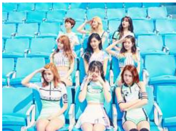
ภาพที่ 4.15 เพลง Cheer up – Twice