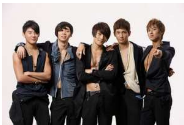
ภาพที่ 3.4 ศิลปินกลุ่มชายวง TVXQ

แต่จุดสูงสุดของความสำเร็จในการนำเสนอวัฒนธรรมประชานิยมเกาหลีในประเทศไทยที่เห็นได้อย่างชัดเจนที่สุดคือ การเข้ามาของศิลปินกลุ่ม “ดงบังชินกิ” (Dong Bang Shin Ki-TVXQ) แต่ก่อนที่จะมีวงดงบังชินกินั้น จะมีวงบอยแบนด์ที่โด่งดังมากๆ ในประเทศเกาหลีใต้อยู่แล้วอย่าง H.O.T , Shinhwa , G.O.D แต่ไม่มีวงไหนที่มีชื่อเสียงนอกประเทศ จนค่ายต้นสังกัดอย่างเอสเอ็มเอนเตอร์เทนเมนต์ คิดจะสร้างบอยแบนด์ขึ้นมา จุดประสงค์หนึ่งคือเพื่อผลักดันบอยแบนด์กลุ่มนี้ให้ไปในระดับเอเชียให้ได้ เพื่อกระตุ้นเศรษฐกิจของเกาหลี โดยมีการคิดภาพลักษณ์และชื่อในวงการของแต่ละ รวมถึงสไตล์ของเพลงที่ต้องการจะทำให้แตกต่างจากบอยแบนด์วงอื่นๆ โดยการใช้ความสามารถในการร้องของทั้ง5คน ที่มีโทนเสียงที่ต่างกัน จนได้สไตล์เพลงแนว acappella dance มีความสามารถในการร้องสดและอะแคปเปลล่า รวมถึงมีความสามารถในด้านการเต้นเป็นอย่างดีมากอีกด้วย เรียกได้ว่าหาได้ยากมากในหมู่บอยแบนด์ ที่สมาชิกทุกคนจะมีเสียงที่ดีและมีความสามารถในการเต้นที่เท่ากันทุกคน เปิดตัวครั้งแรกกับเพลง Hug เป็นเพลงแรกก็ดังไปทั่วเอเชียรวมถึงประเทศไทยด้วย ดงบังชินกิเป็นศิลปินที่โด่งดังเพราะผลงานมากกว่าภาพลักษณ์และหน้าตา เรียกได้ว่าเป็นศิลปินกลุ่มแรกที่เปิดทางไว้ให้ศิลปินรุ่นน้องได้เข้ามามีชื่อเสียงในประเทศไทย เป็นศิลปินกลุ่มที่ไอดอลยุคใหม่จะยึดเป็น role model ซึ่งนี่คือสิ่งที่ทำให้ดงบังชินกิเป็นตำนานหรือเรียกได้ว่า เป็นราชาแห่งวงการเคป็อป โดยได้สร้างภาพแทนของคำว่าวงบอยแบนด์ไว้คือการมีจำนวนสมาชิกเป็นกลุ่มที่หน้าตาดีและร้องเพลงไปพร้อมๆกับการเต้นที่สมบูรณ์แบบ