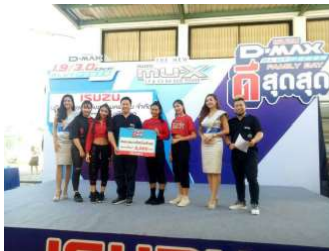
ภาพที่ 3.15 นักเรียนจากสถาบันอีทีซี อะคาเดมี่เข้าร่วมการประกวดเต้น Cover Dance