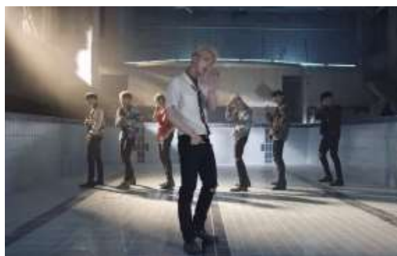
ภาพที่ 4.13 ทำเต็มแสดงตำแหน่งของจิน-ร้องเสริม