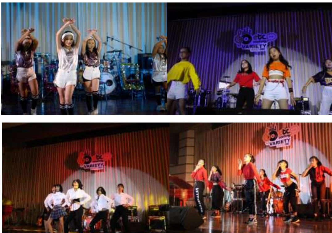
ภาพที่ 3.16 การจัดคอนเสิร์ตเพื่อแสดงความสามารถในการเต้น Cover Dance