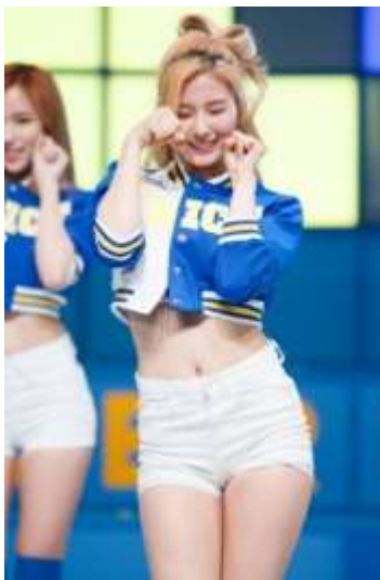
ภาพที่ 4.17 ทำเด่นเป็นสัญลักษณ์แทนคำว่า shy shy shy

2. ทำตัวแทนคำร้องในบทเพลงที่ว่า “shy shy shy” ที่มีความหมายว่า เจินหรืออาย แสดงให้เห็นถึงบุคลิกภาพในการเจินอายของเพศหญิง