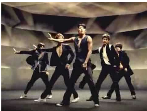
ภาพที่ 3.7 ภาพจากคลิปวิดีโอ Music Video (Dance Version) ของศิลปิน TVXQ