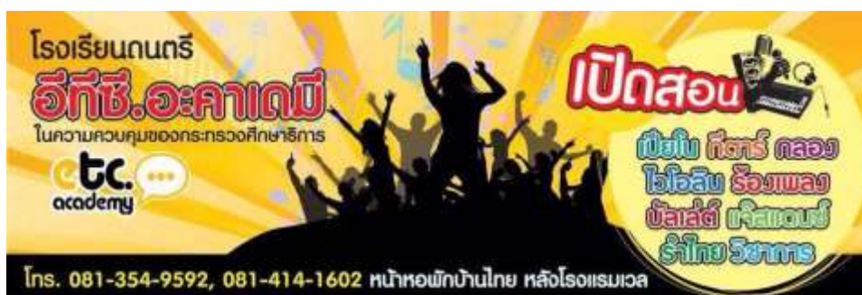
ภาพที่ 3.13 ป้ายโลโก้สถาบันอีทีซี อะคาเดมี่