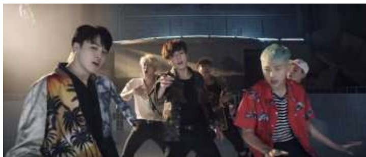
ภาพที่ 4.8 ทำเดินแสดงตำแหน่งของจองกุก-เซนเตอร์ของวง