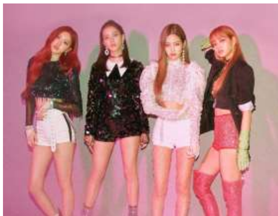
ภาพที่ 4.24 การแต่งกายเพลง Ddu du Ddu du – Blackpink

เนื่องจากชื่อวงว่า Black Pink เอกลักษณ์สีของวงคือสีดำและสีชมพู การแต่งกายก็มักมีสอตแทรกสีดำ และ สีชมพูเข้าไปด้วย แต่ก็สีอื่นผสมอยู่ด้วยเช่นกัน ซึ่งสีดำนั้น แสดงถึงความแข็งแรง ดุดัน แต่ในขณะที่สีชมพู แสดงถึงความเป็นเพศหญิง และภาพลักษณ์ของวงจะเป็นผู้หญิงที่เท่ปนเซ็กซี่ การแต่งตัวจึงเน้นการแต่งตัวในลักษณะที่เป็นผู้หญิงที่มีความมั่นใจ เซ็กซี่ ตามบุคลิกภาพของศิลปินในบทเพลงนี้