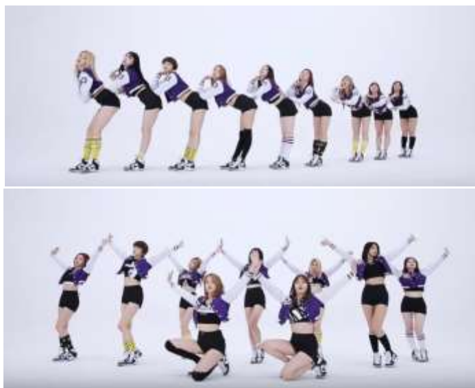
ภาพที่ 4.19 ความสัมพันธ์ภายในทีมเพลง Cheer up – Twice บ่งบอกถึงสังคมของเกาหลี

นอกจากตำแหน่งหรือหน้าที่ของสมาชิกแต่ละคนในทีมแล้ว สิ่งที่บ่งบอกถึงสังคมเกาหลีผ่านท่าเต้นในบทเพลงนี้คือ เนื่องจากการเต้นที่มีสมาชิกเป็นจำนวนมากนั้น การเคลื่อนไหวของร่างกายย่อมมีความแตกต่างกัน จึงจำเป็นต้องมีการเก็บรายละเอียดและองศาของท่าเต้นทุกท่วงท่าในบทเพลง ที่ต้องมีระเบียบวินัยสะอาด เป็นการบ่งบอกถึงความสามัคคีภายในทีม เปรียบเทียบกับสังคมของเกาหลีที่มีประชากรมากมายที่มีพฤติกรรมที่แตกต่างกัน แต่ต้องมีการจัดระเบียบทางสังคม เพื่อความเป็นหนึ่งเดียวกันนั่นเอง