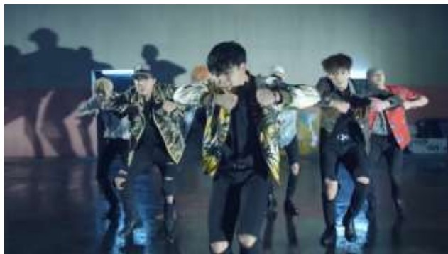
ภาพที่ 4.6 ทำเต็นที่เน้นการใช้ร่างกายในส่วนของแขนและขาในเพลง Fire

ความหมายทางด้านร่างกายนั้น เป็นการแสดงออกมาทางหน้าตา รูปร่าง และเครื่องแต่งกาย ในกรณีศึกษาทำเต็นของเพลงนี้ มีการใช้ร่างกายที่ค่อนข้างแข็งแรงมาก เน้นร่างกายในส่วนของแขนและขา ที่ต้องเคลื่อนไหวอย่างแข็งแรงและรวดเร็ว ตามจังหวะของเพลงและตามบุคลิกภาพของศิลปินในบทเพลงนี้ดังที่ได้กล่าวไปข้างต้น และทำเต็นเหล่านี้ก็ได้สัมพันธ์กันกับเครื่องแต่งกายด้วยเช่นกัน