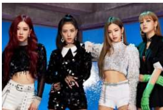
ภาพที่ 4.23 สีหน้าที่หยิ่งโส พร้อมกับความเซ็กซี่ที่บ่งบอก บุคลิกภาพของเพศหญิงที่มีความเซ็กซี่และมั่นใจ

ด้านหน้าตา สีหน้าและอารมณ์ในบทเพลงนี้ จะมีสีหน้าที่หยิ่งโส พร้อมกับความเซ็กซี่ เพื่อแสดงให้เห็นถึงบุคลิกภาพของเพศหญิงที่มีความเซ็กซี่และมั่นใจ ไม่อ่อนแอแน่นอน ซึ่งก็ได้สัมพันธ์ไปกับการแต่งกายด้วย