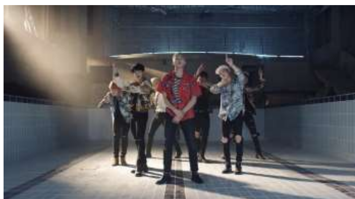
ภาพที่ 4.9 ทำเดินแสดงตำแหน่งของแรปมอนสเตอร์-แรปหลัก