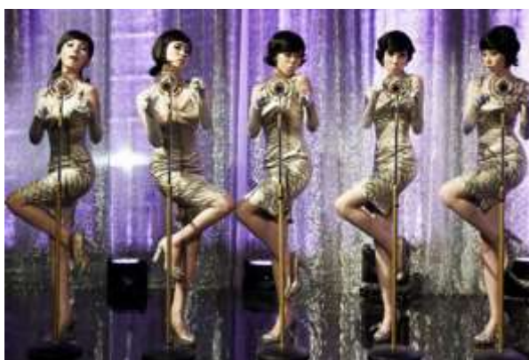
ภาพที่ 3.5 ศิลปินกลุ่มหญิงวง Wonder Girls

โดยแสดงให้เห็นว่าหากเนื้อเพลงดี ท่วงทำนองดี และมีดนตรีที่ดีสามารถร้องตามได้ง่ายและติดหู ภาษาจะไม่ใช่เรื่องสำคัญอีกต่อไป การออกแบบทิวทัศน์ของศิลปิน การเต้นที่เป็นเอกลักษณ์และน่าสนใจอย่างมาก โดยเป็นท่าเต้นที่สามารถเต้นตามได้ง่าย รวมถึงการตลาดอย่างจริงจัง จนทำให้เพลง Nobody ของวง Wonder Girls เป็นที่นิยมในประเทศไทยเป็นอย่างมาก และเริ่มมีกลุ่มคนจำนวนหนึ่งที่มีความสนใจรวมกลุ่มกันเต้นเลียนแบบ จนส่งผลให้การเต้นเกาหลีนั้นได้เริ่มเป็นที่นิยมมากขึ้นในกลุ่มคนที่ชื่นชอบศิลปินเกาหลี โดยท่าเต้นที่เป็นที่นิยมในช่วงนั้นคือ การยกมือขึ้นถึงบริเวณหน้าอกโดยใช้นิ้วชี้ ชี้ไปทางด้านหน้า ประบมือติดกันสองครั้ง และชี้อีกรอบ ซึ่งเป็นสัญลักษณ์ที่สื่อความหมายว่าเธอ ซึ่งตรงกับเนื้อเพลงท่อนนี้ว่า I want nobody but you ซึ่งแปลว่า ฉันไม่ต้องการใครนอกจากเธอ