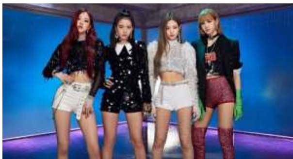
ภาพที่ 4.3 ศิลปินวง Black Pink