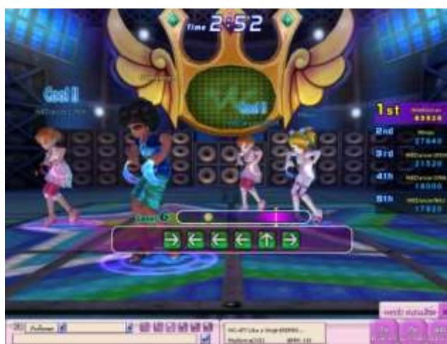
ภาพที่ 3.11 ภาพตัวอย่างการเล่นเกม We dancing online หรือ WEDO

โหมดการเต้นหลากหลายที่เรียกได้ว่ารวมรวมเกมโหมดต่างๆไว้ที่นี่เลยก็ว่าได้ ทั้งโหมดทั่วไปที่เราคุ้นเคย โหมดจังหวะกลอง โหมดจังหวะดนตรี และนอกจากนั้นยังมีโหมดใหม่ๆที่ไม่เคยมีมาก่อน นั่นคือ โหมดเต้นกับศิลปิน จะดีแค่ไหนถ้าได้เต้นกับศิลปินที่เราชื่นชอบ ไม่ว่าจะเป็น Rain F4 Cindy Jolin และอื่นๆอีกมากมายกว่า 30 ศิลปิน และยังมีท่าเต้นเรีตๆทั้ง Hip Hop, Locking, Popping, Raggae ได้มากกว่า 500 ท่าเพื่อเพิ่มความสนุกสนานให้กับการเต้นได้อีกด้วย และตบท้ายด้วยเพลงใหม่ๆฮิตๆมากมายทั้งจากฝั่งไต้หวัน จีน ฝรั่งเศส และไทย รับรองว่าคุณจะไม่เคยได้ยินเพลงเหล่านี้จากเกมเต้นไหนมาก่อน