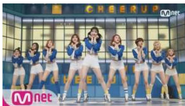
ภาพที่ 4.18 การแต่งกายบทเพลง Cheer up – Twice

ในบทเพลงนี้ การแต่งกายแสดงออกถึงคาแร็คเตอร์ที่น่ารักสดใสและเป็นสาวเชียร์ลีดเดอร์ของศิลปินในบทเพลงนี้ได้ชัดเจน โดยการแต่งกายในแบบหญิงสาวเชียร์ลีดเดอร์ โดยมีการแต่งกายในแนวกีฬาที่เหมือนกันหมดทุกคน