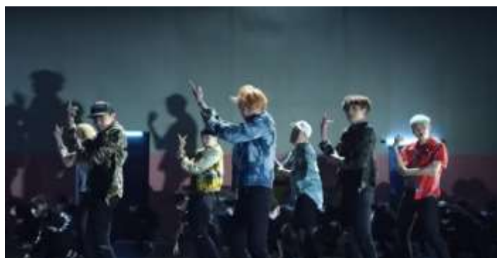
ภาพที่ 4.12 ทำเต็มแสดงตำแหน่งของวี-ร้องนำ