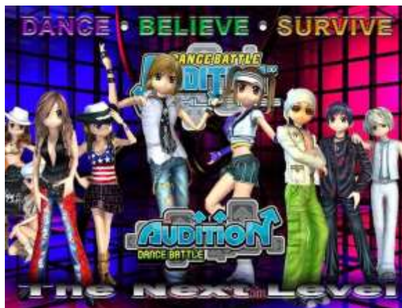
ภาพที่ 3.12 เกม Audition Dance Battle