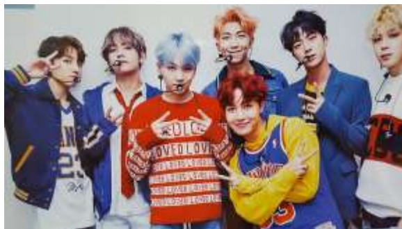
ภาพที่ 4.1 ศิลปินวง BTS