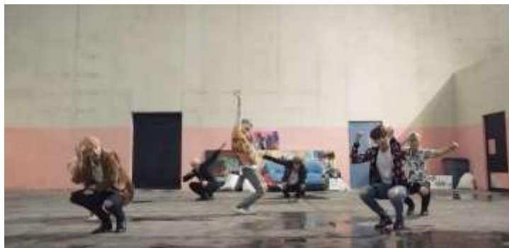
ภาพที่ 4.14 ทำเต้นแสดงตำแหน่งของซูก้า-แร็ปหลัก