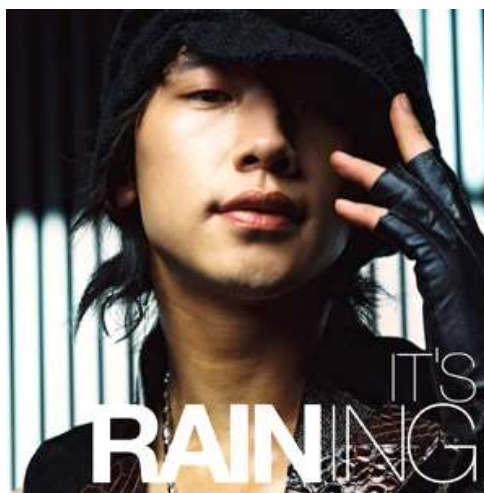
ภาพที่ 3.3 ศิลปินชาย RAIN