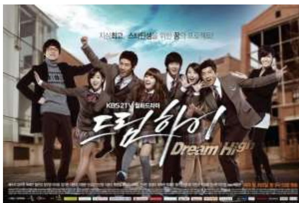
ภาพที่ 3.8 ละครเกาหลีเรื่อง Dream High

บันดาลใจให้กับทุกคนที่มีความฝัน และความมุ่งมั่นอยากจะเป็นดาว ในซีรีส์วัยรุ่นยอดเยี่ยม “DREAM HIGH มุ่งสู่ดาว ก้าวตามฝัน”