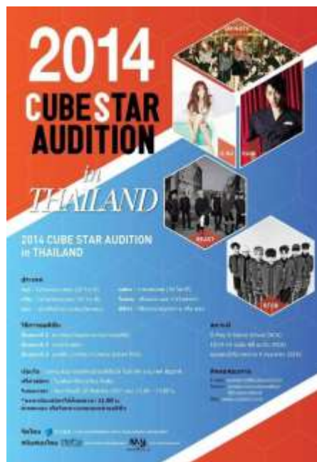
ภาพที่ 3.14 แผ่นโปสเตอร์ประกาศการออ디션ศิลปินเกาหลีสองค่าย Cube Entertainment ในปี พ.ศ. 2557