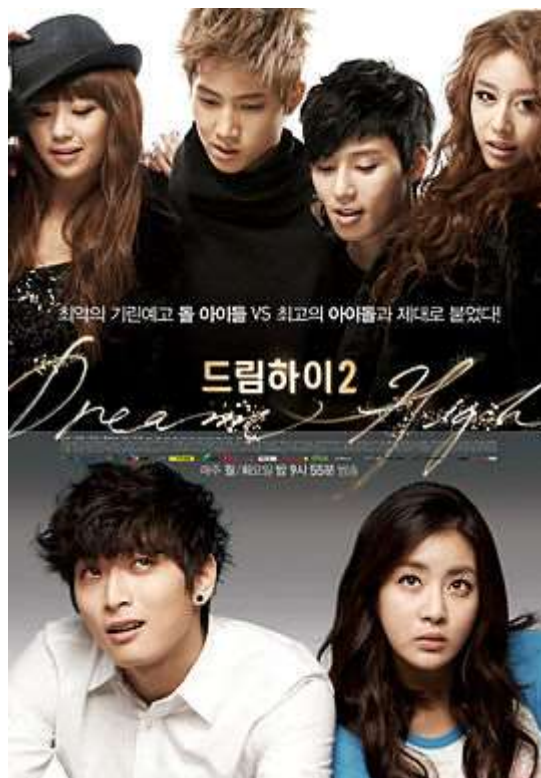
ภาพที่ 3.9 ละครเกาหลีเรื่อง Dream High 2