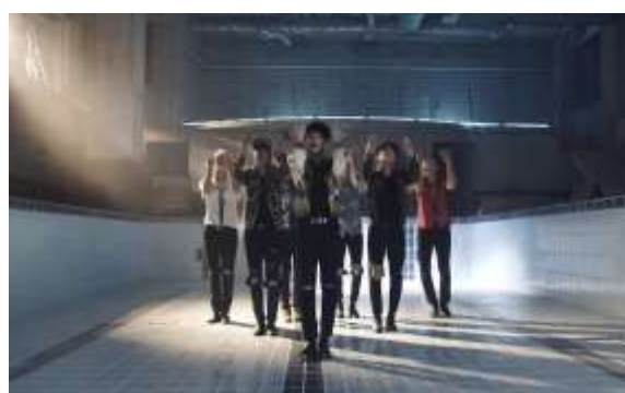
ภาพที่ 4.10 ทำเดินแสดงตำแหน่งของจีมิน-ร่อนนำและเดินหลัก