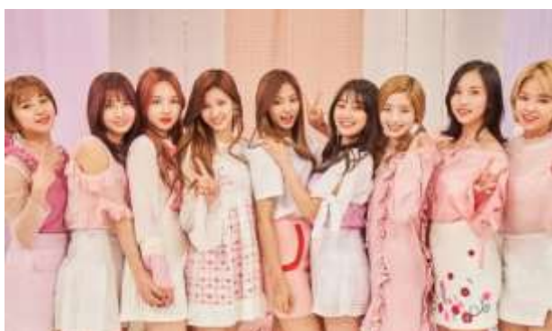
ภาพที่ 4.2 ศิลปินวง Twice